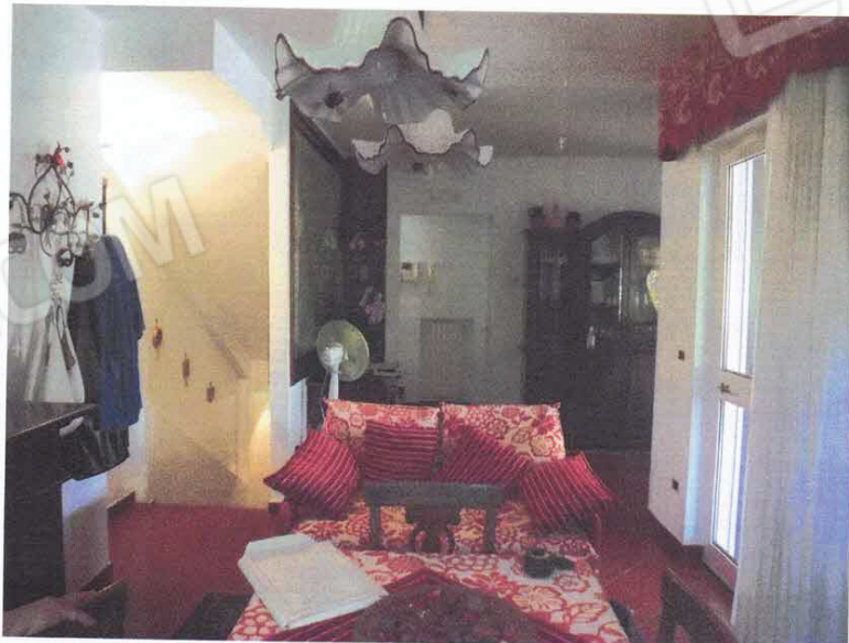
Foto 15. Piano Terra.