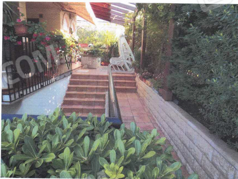
Foto 6. Area esterna.