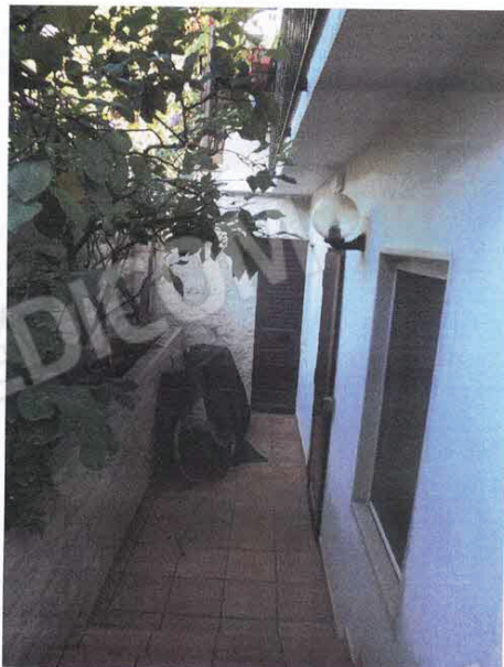
Foto 8-8a. Area esterna.