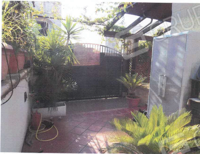
Foto 5. Area esterna.