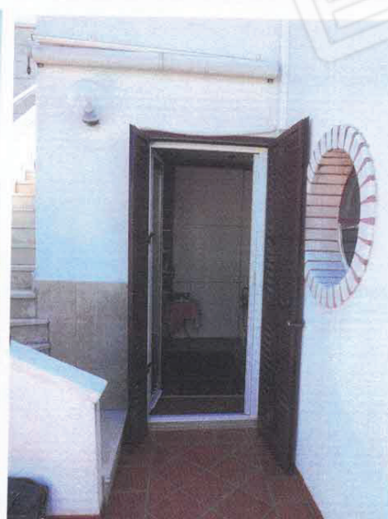
Foto 25- 26. Piano primo. Esterno.