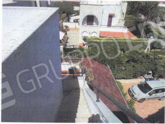
Foto 27-28-29-30. Lastrico solare.