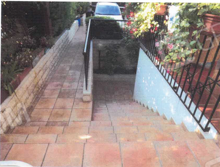
Foto 7. Area esterna.