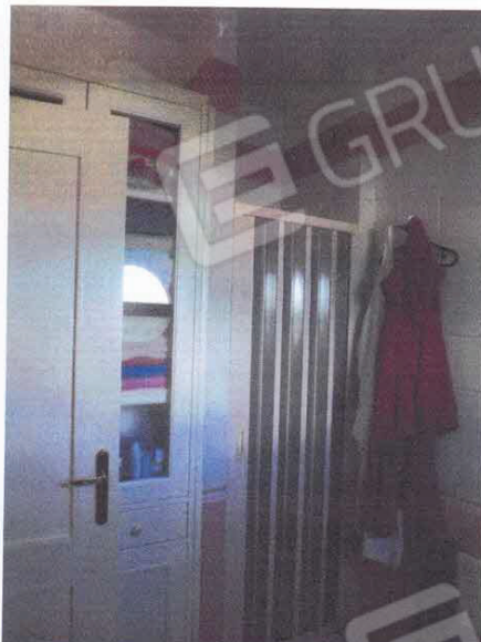
Foto 23- 24. Piano primo. Bagno.