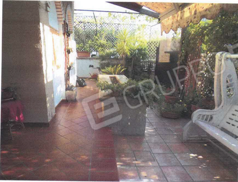
Foto 4. Area esterna.