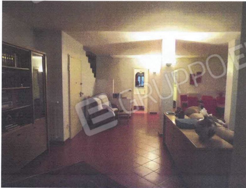
Foto 9. Piano interrato.