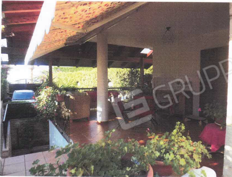
Foto 6a. Area esterna.