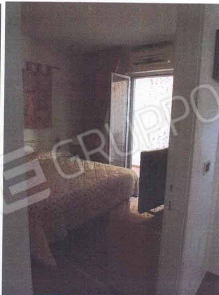
Foto 21- 22. Piano primo. Vani letto.