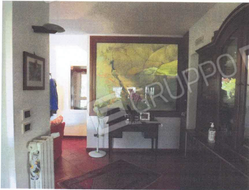
Foto 16. Piano Terra.