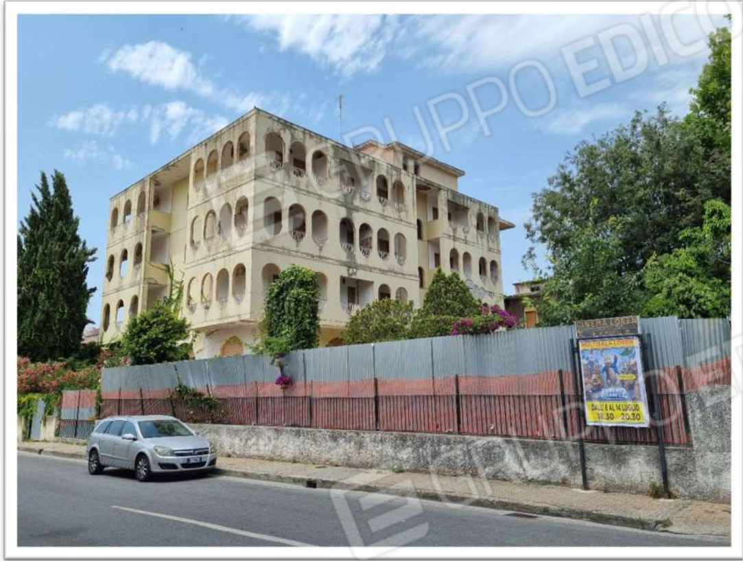
Foto 1 - Vista prospetto Sud/Est