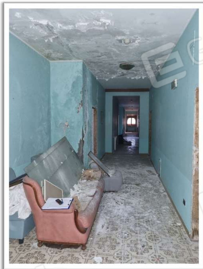
Foto 15 – Particolare corridoio piano 1° “primo corpo di fabbrica”