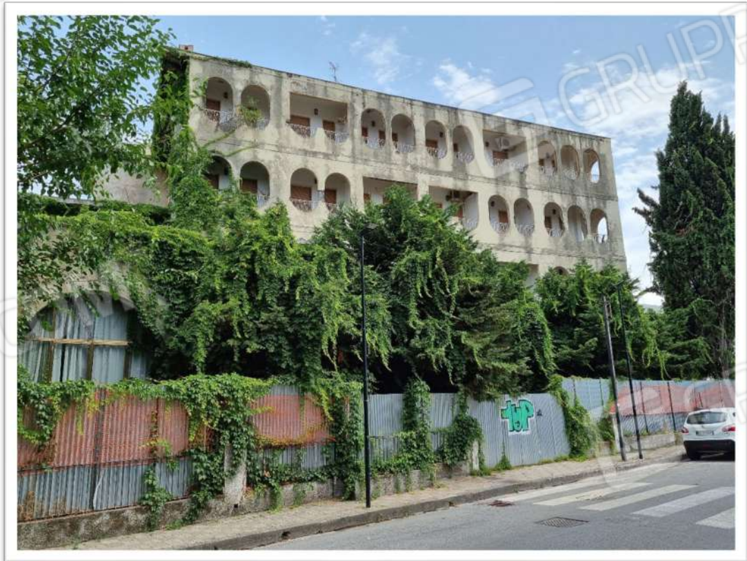
Foto 2 - Vista prospetto Ovest