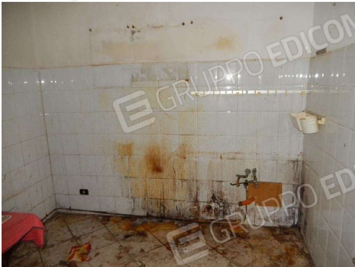
ANGOLO COTTURA IN CUCINA