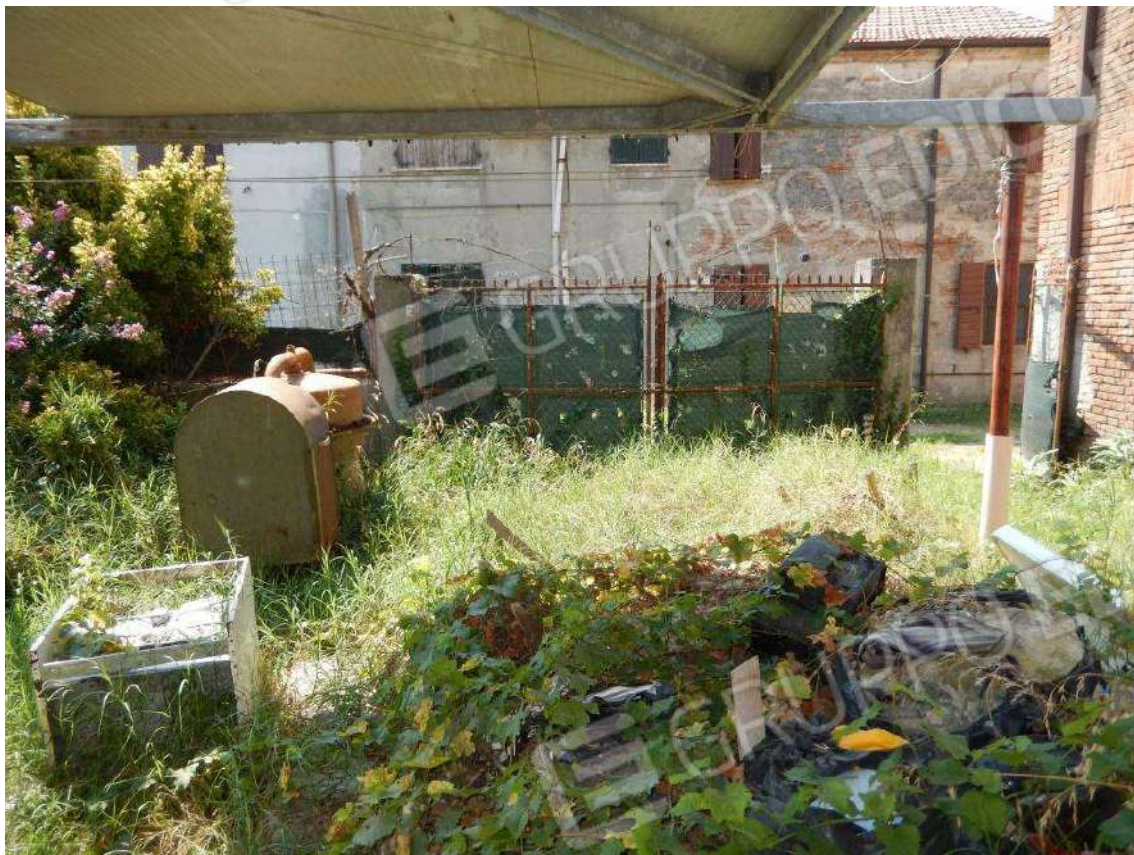
PARTICOLARE CORTE MAPP. 685