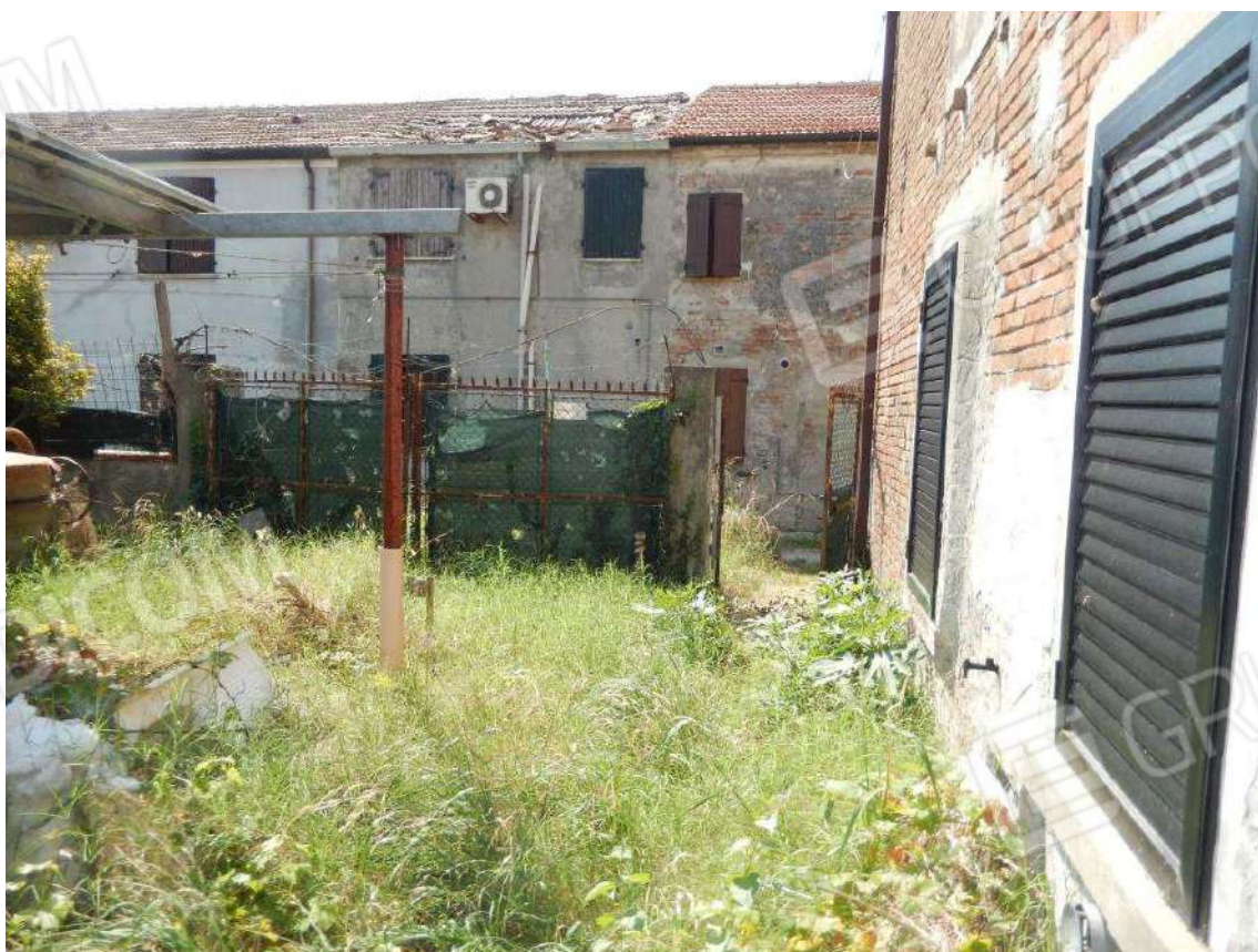
ACCESSO ALLA CORTE DA STRADELLO COMUNE MAPP. 14