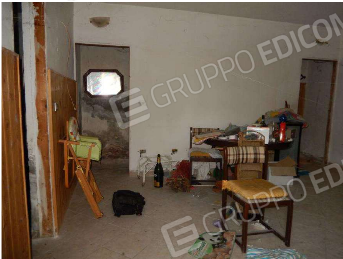
INGRESSO SU SOGGIORNO