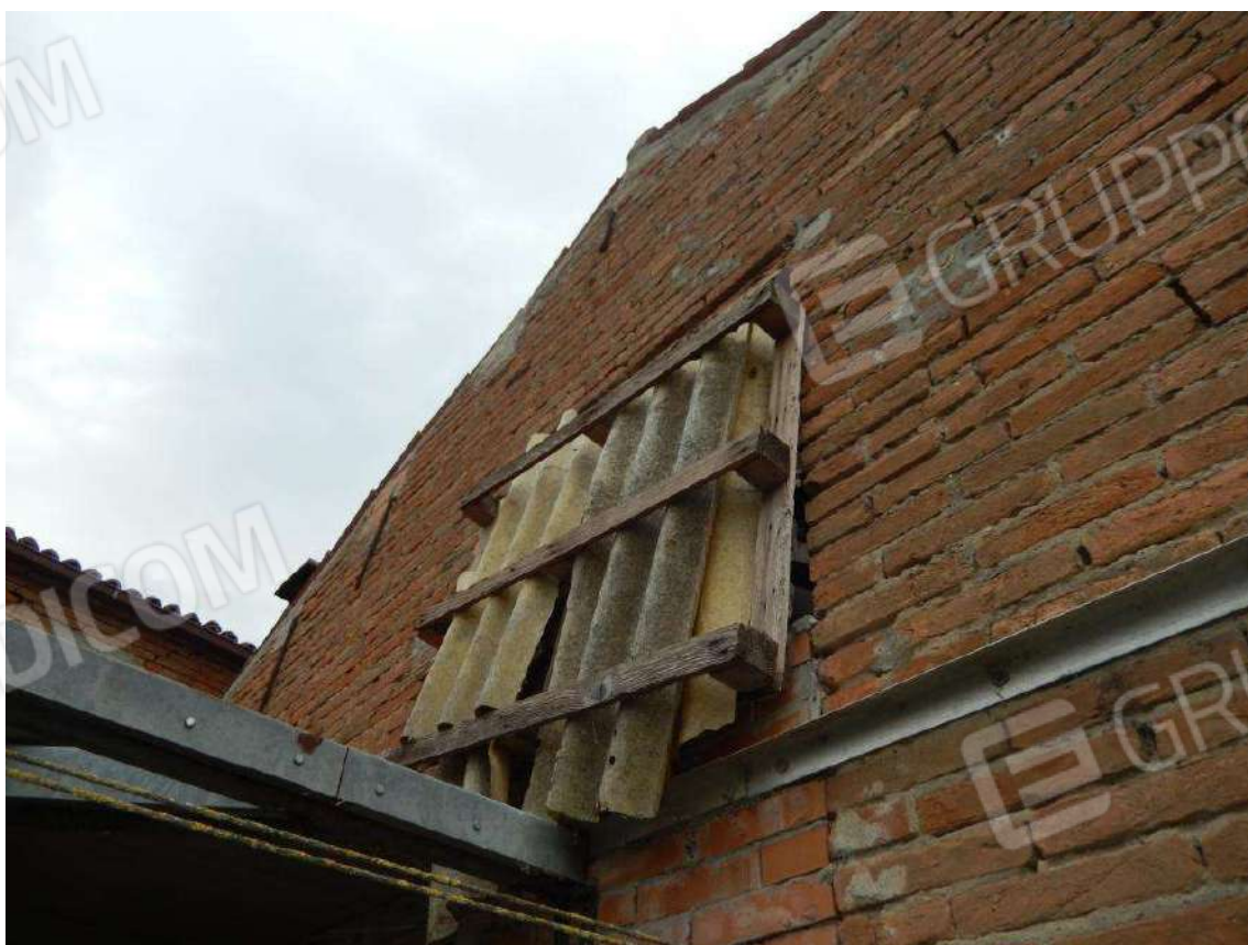
PARTICOLARE ACCESSO AL GRANAIO P.1. PROSERVIZIO