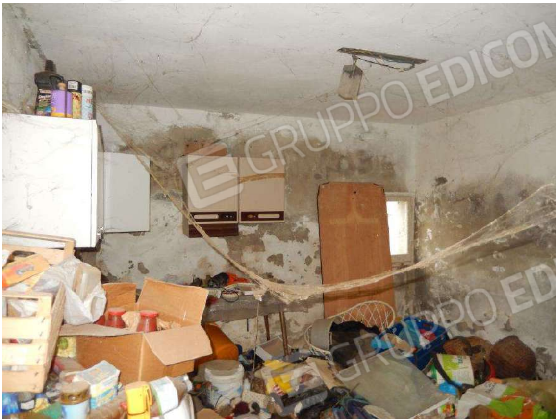
CANTINA / PROSERVIZIO ESTERNO