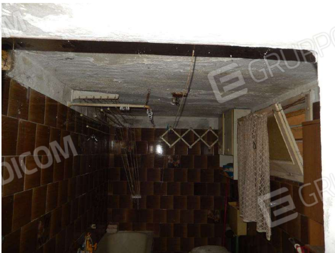
PARTICOLARE INFILTRAZIONI AL BAGNO