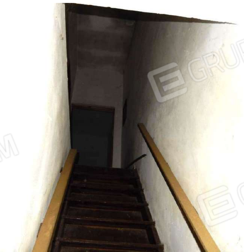
SCALA ACCESSO AL PIANO PRIMO (INACCESSIBILE)