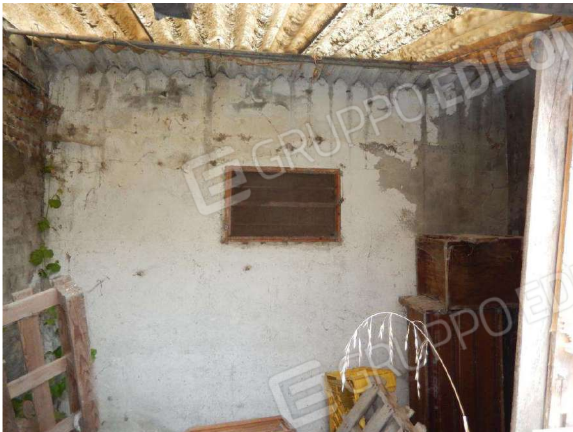
PARTICOLARE ESTERNO BAGNO SOTTO TETTOIA DA RIMUOVERE