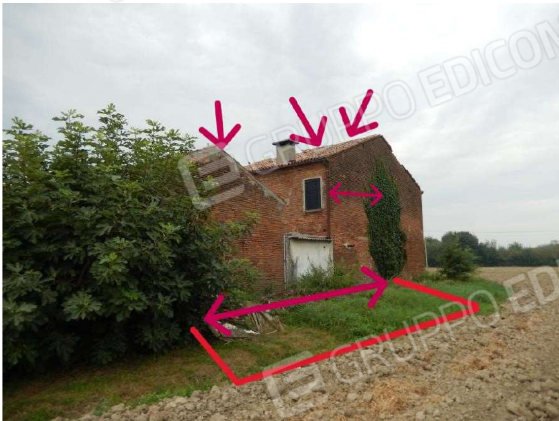
CORTE RETROSTANTE MAPP. 684 NON DELIMITATA