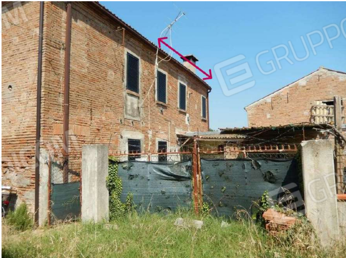
VISTA PROSPETTICA PORZIONE FABBRICATO IN OGGETTO