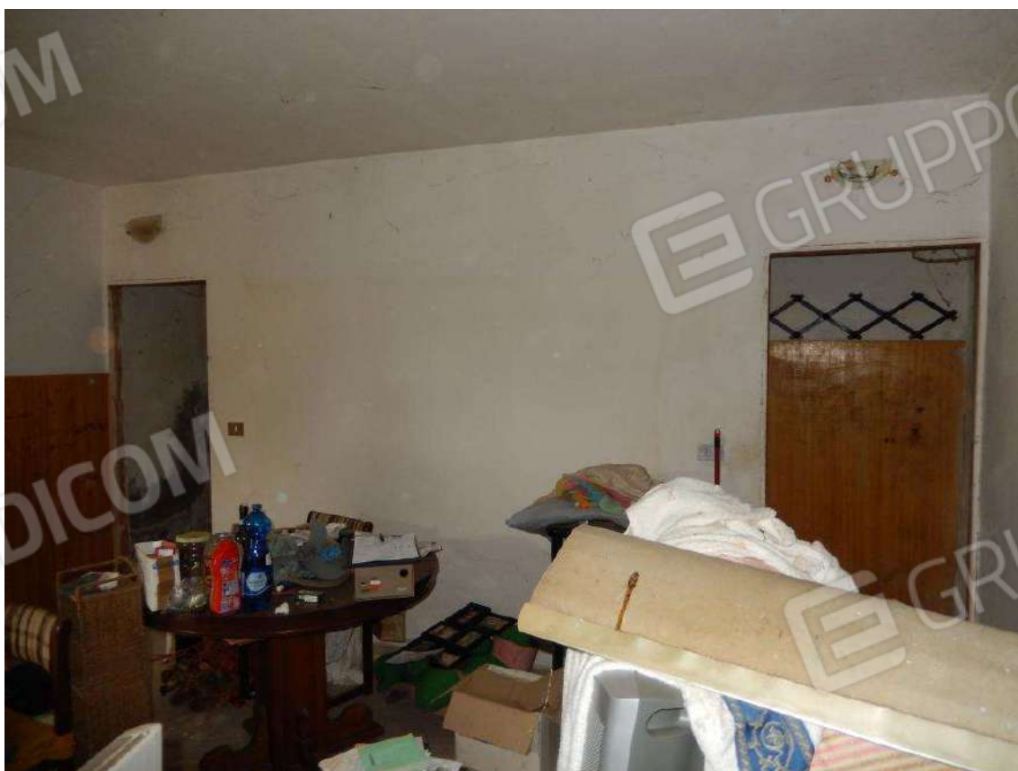
SOGGIORNO VERSO RIPOSTIGLIO E SCALA PER PIANO PRIMO