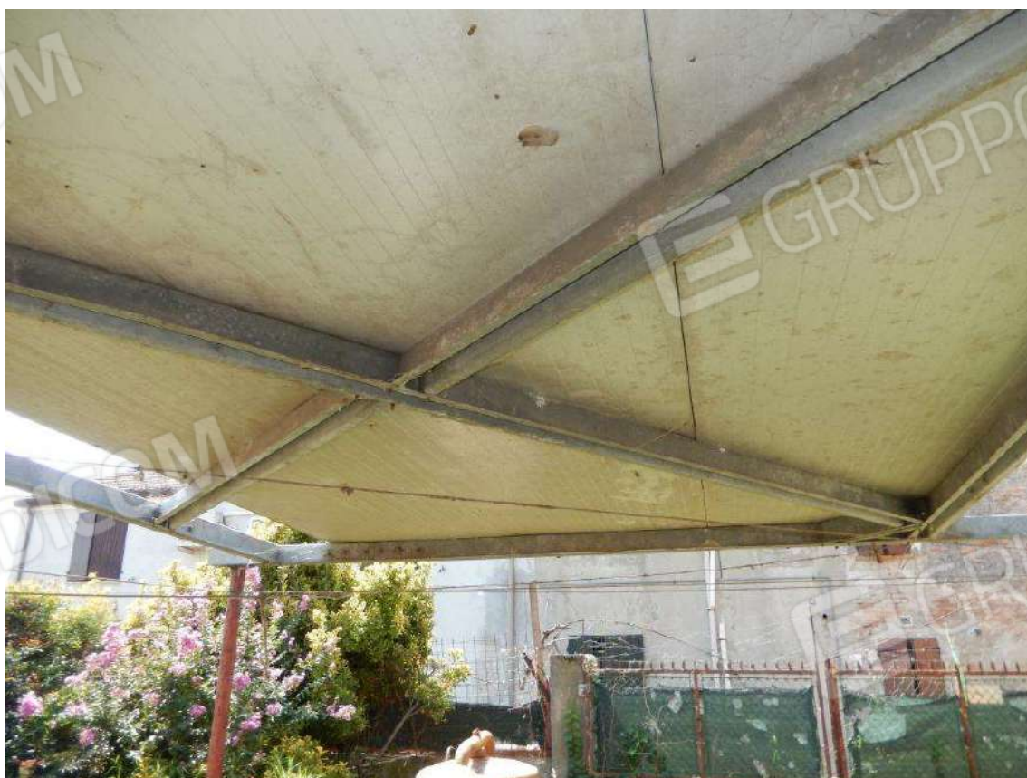
PARTICOLARE TETTOIA ANTISTANTE IL PROSERVIZIO DA RIMUOVERE