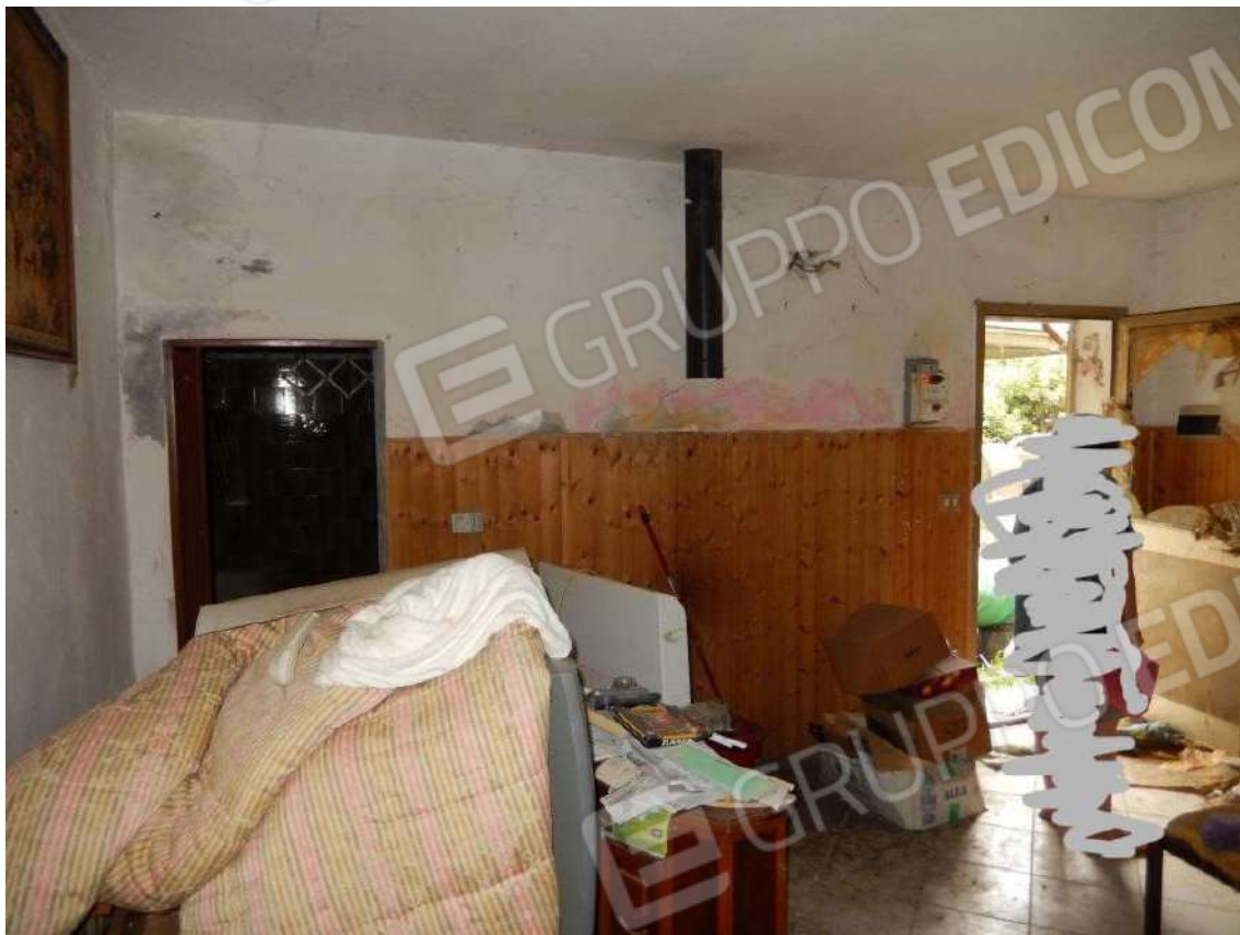
INGRESSO / SOGGIORNO VERSO BAGNO E PORTA INGRESSO