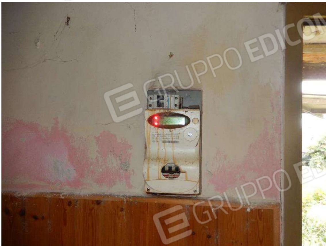
MISURATORE CONSUMO (CONTATORE) ELETTRICO