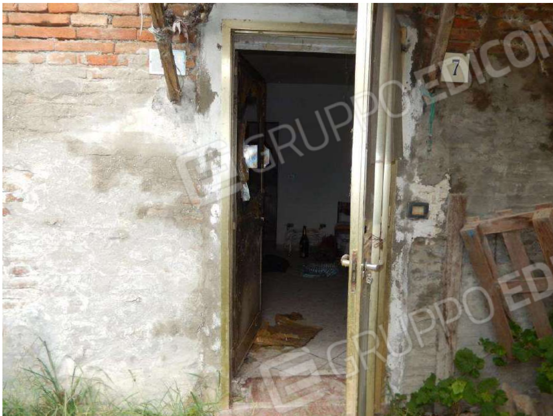
INGRESSO ALL'UNITA' DALLA CORTE ANTISTANTE MAPP. 685