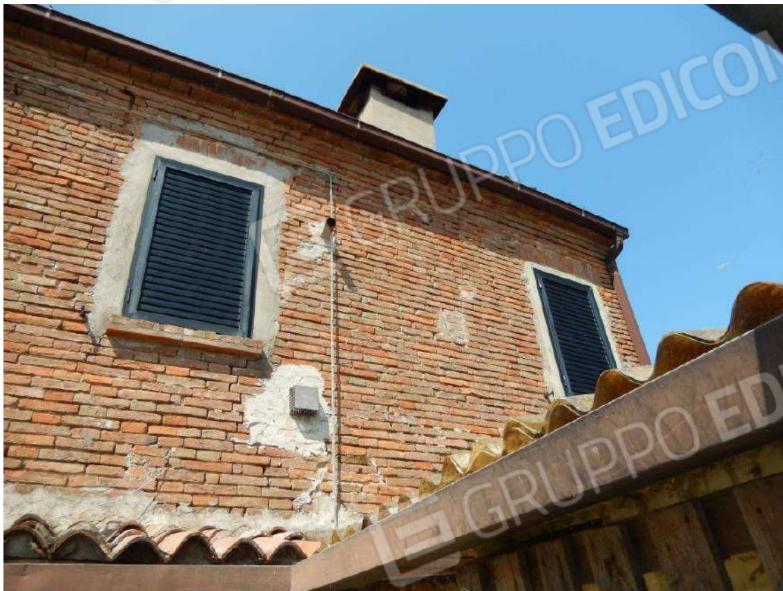
PARTICOLARE PROSPETTO PIANO PRIMO