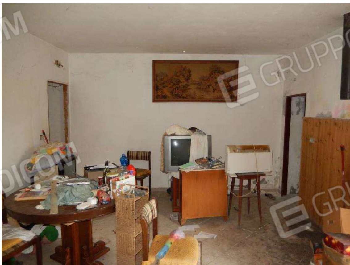
SOGGIORNO VERSO SCALA E BAGNO (PRIVO DI ANTIBAGNO)