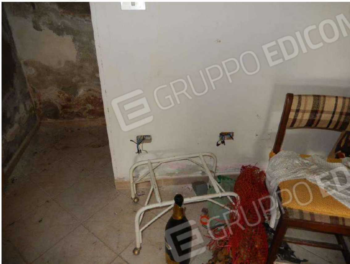
PARTICOLARI PAVIMENTO E IMPIANTO ELETTRICO E UMIDITA' MURARIA