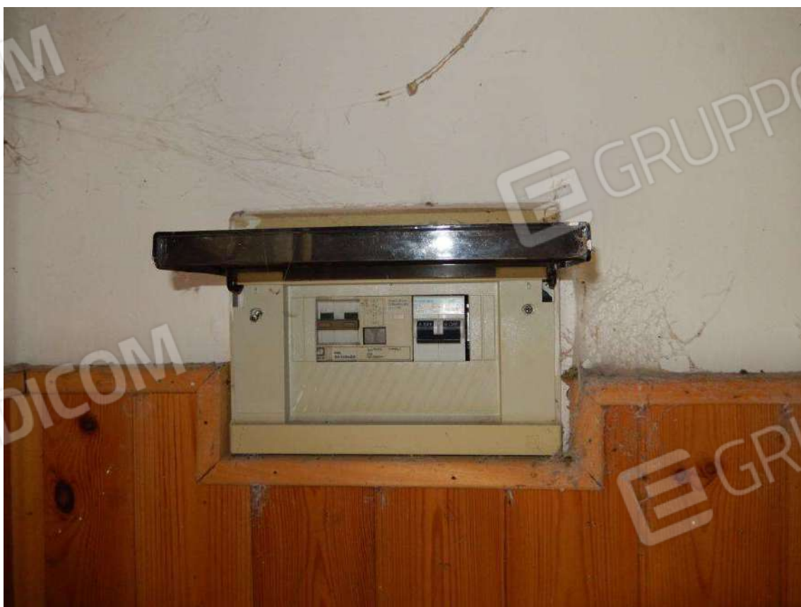
PARTICOLARE IMPIANTO ELETTRICO