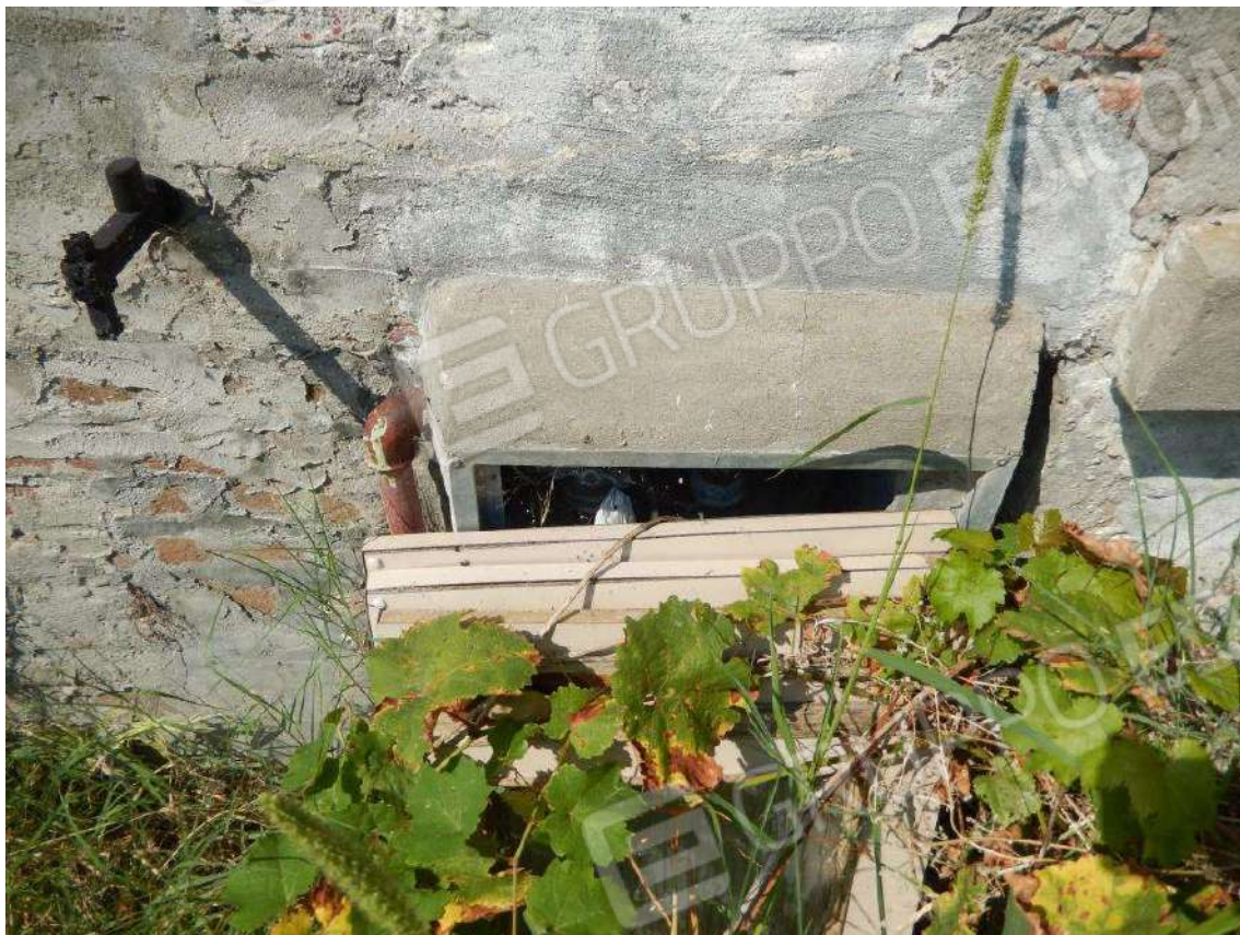
PARTICOLARE MISURATORE CONSUMO GAS-METANO