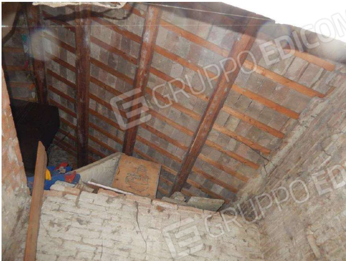
PARTICOLARE PIANO PRIMO PROSERVIZIO