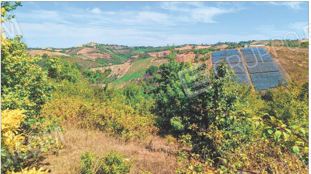
Figura 6: Bosco