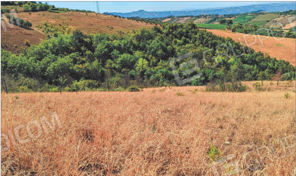
Figura 4: Seminatoio con invasione della vegetazione arborea e arbustiva