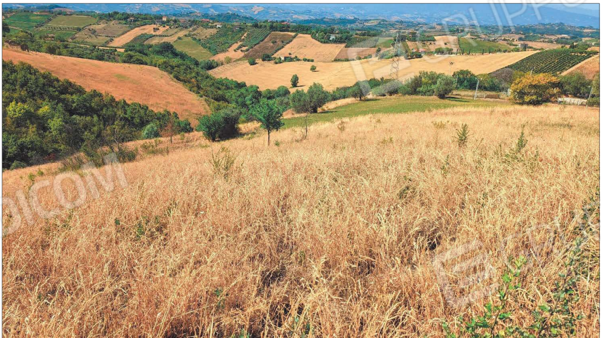
Figura 2: Seminativo confine sud-ovest