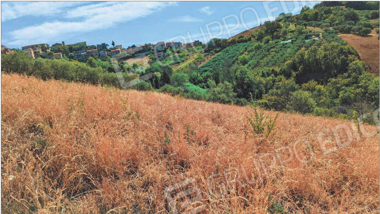
Figura 3: Seminatoio confine sud - est