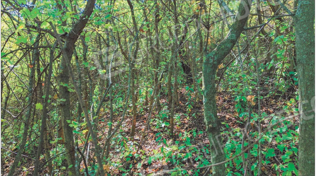
Figura 5: Bosco