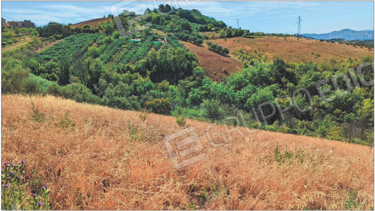
Figura 1: seminativo Fg 11 part. 781

Terreni sito in località Santa Caterina e Forola (Acquaviva Picena) identificati al fg.8 part.IIe 467-469-471 e fg.11 part.IIe 781-783