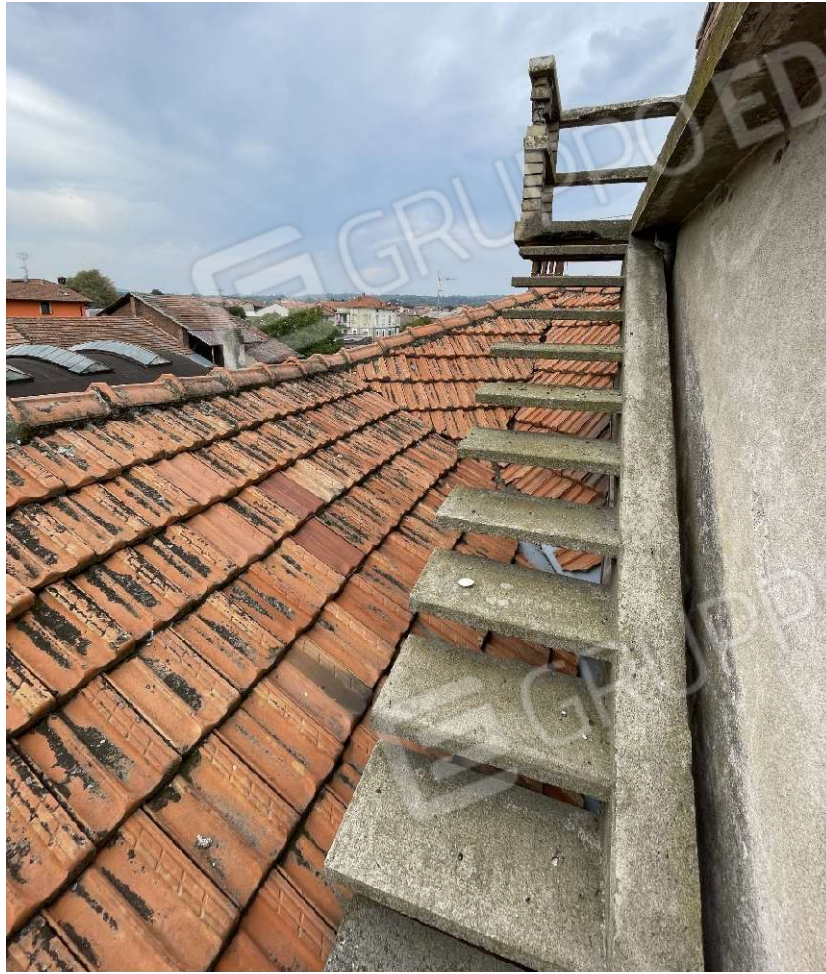
Scala di accesso al terrazzo