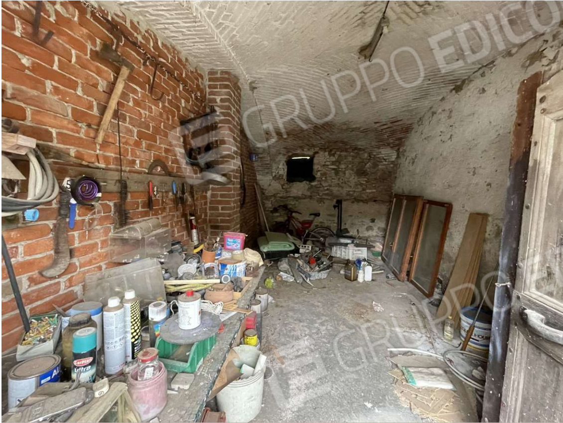
Ripostiglio con accesso dal cortile