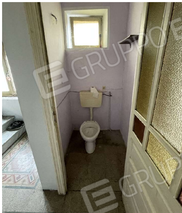
Wc al piano primo