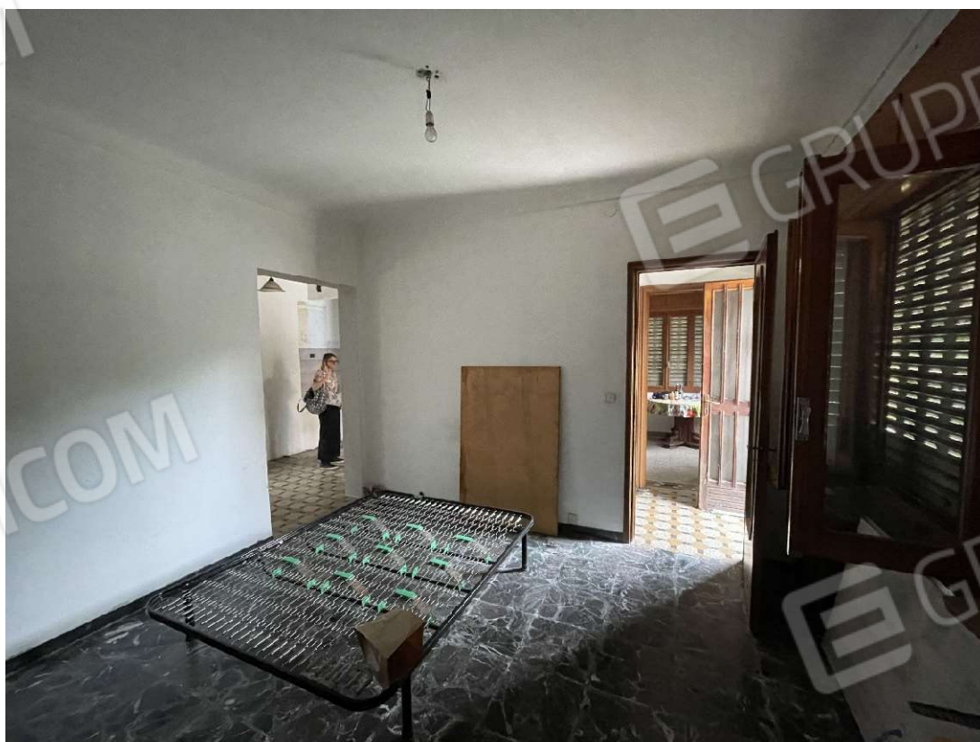
Vista del soggiorno