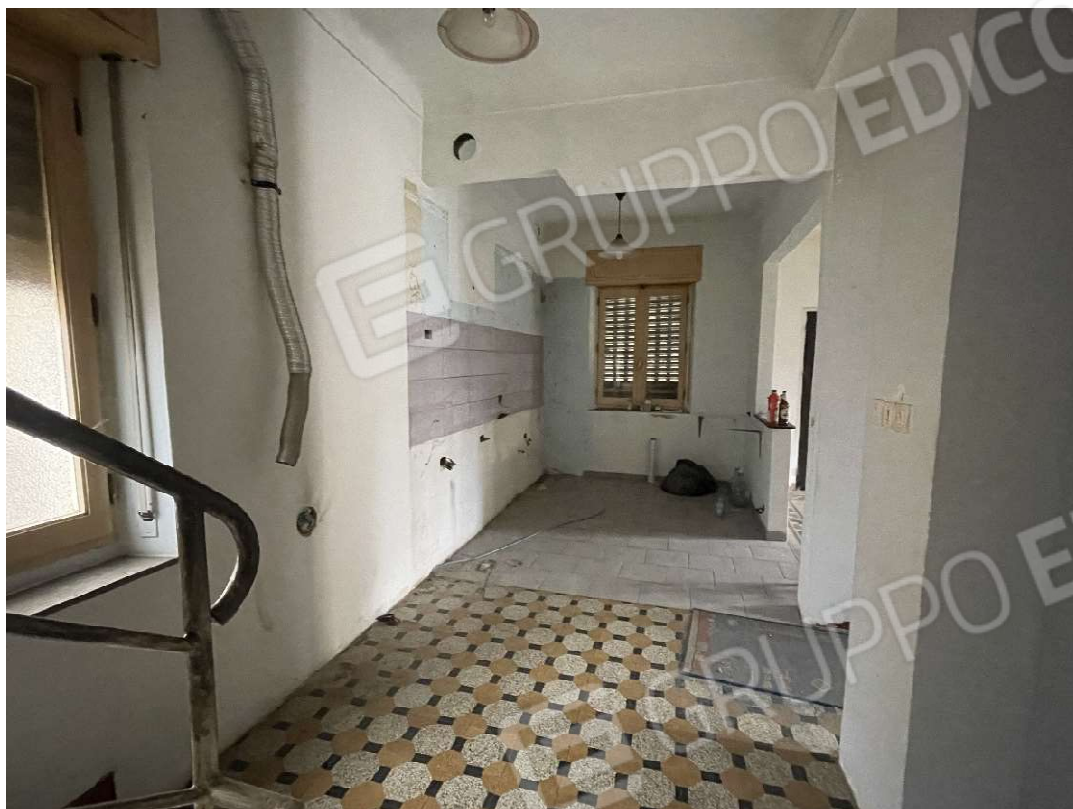
Vista della zona cucina