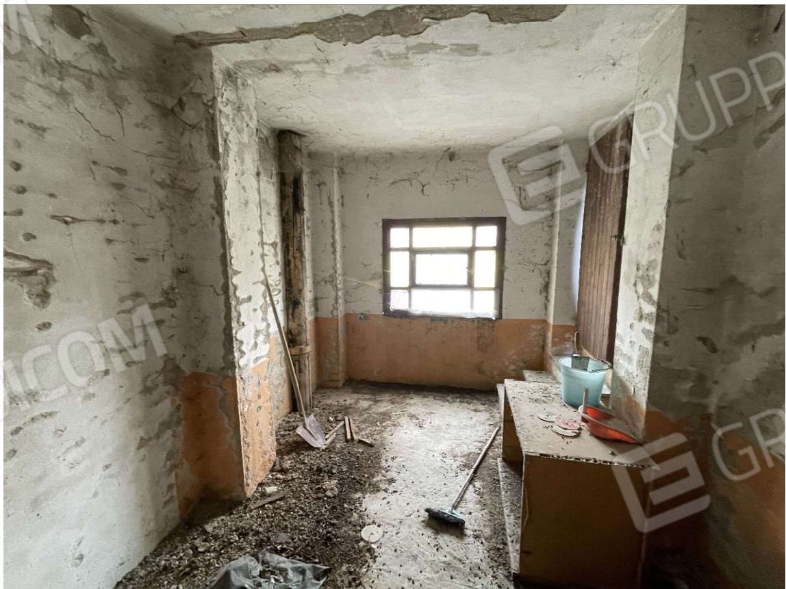
Locale ripostiglio al terzo piano