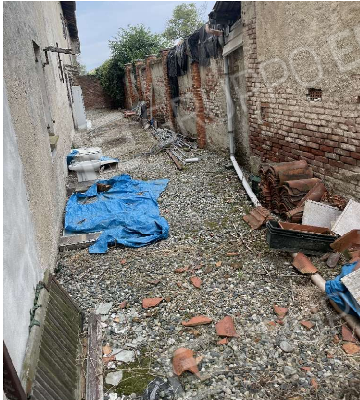
Cortile sul retro