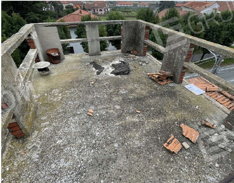
Terrazzo in cima alla torretta