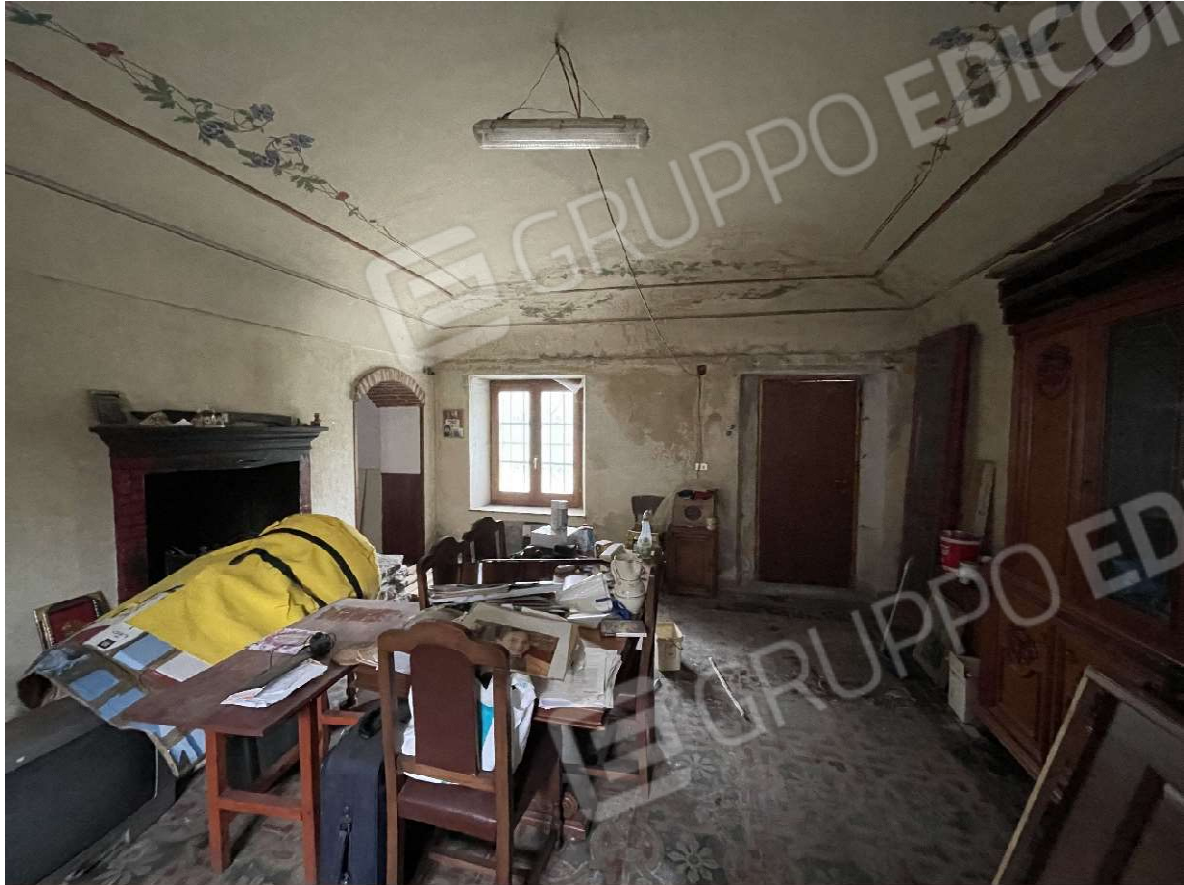
Vista dello studio