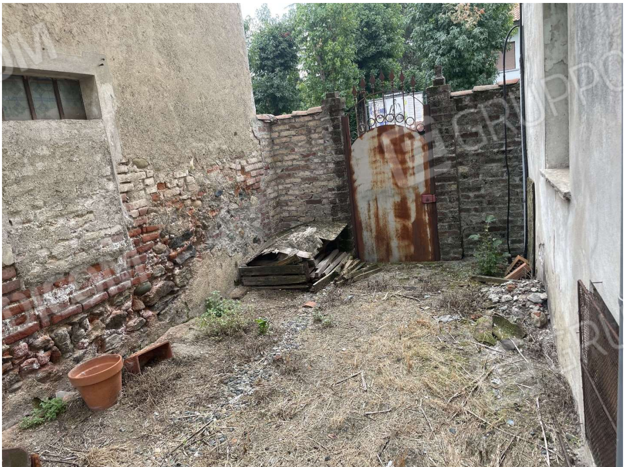
Accesso dalla strada del cortile sul retro