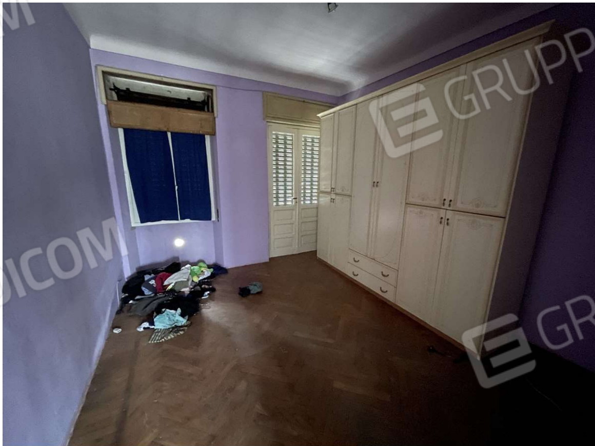
Altra camera al piano primo