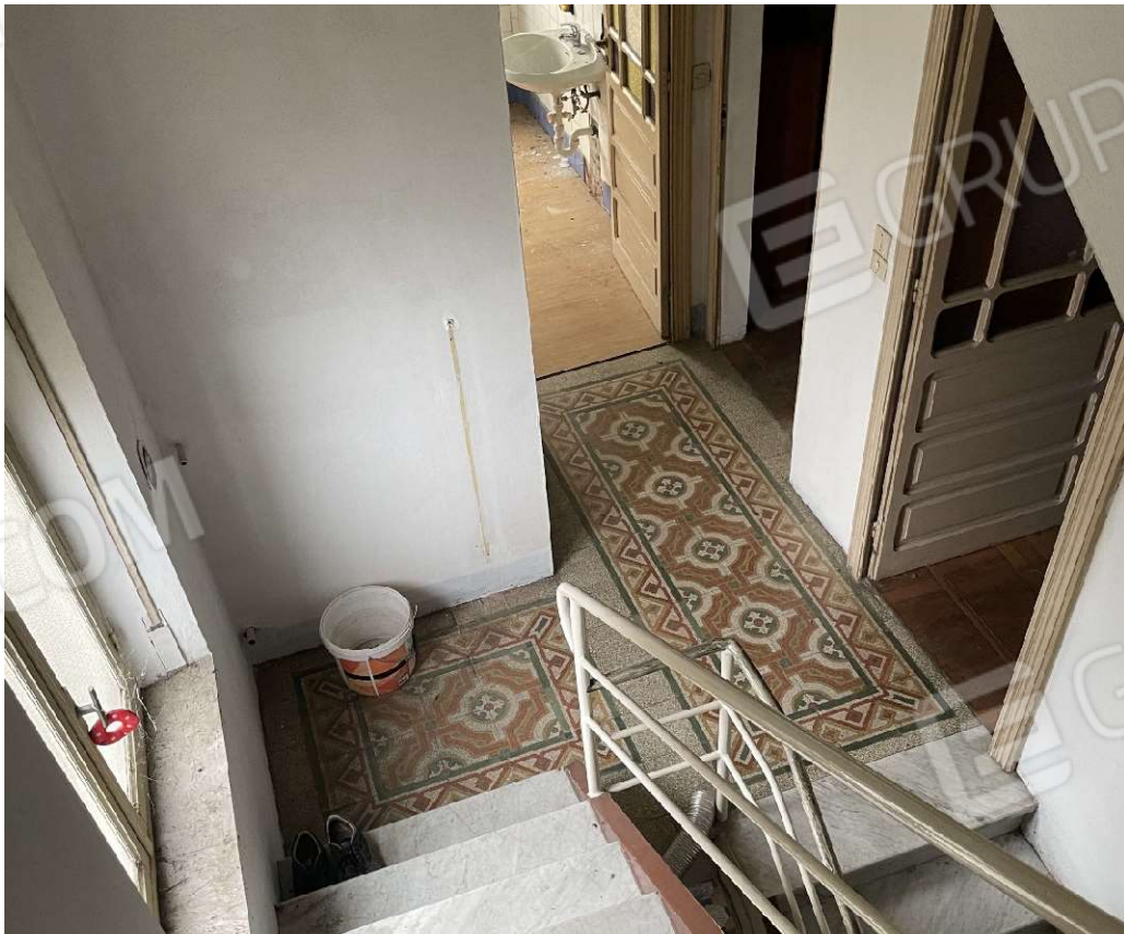
Vista del disimpegno al piano primo