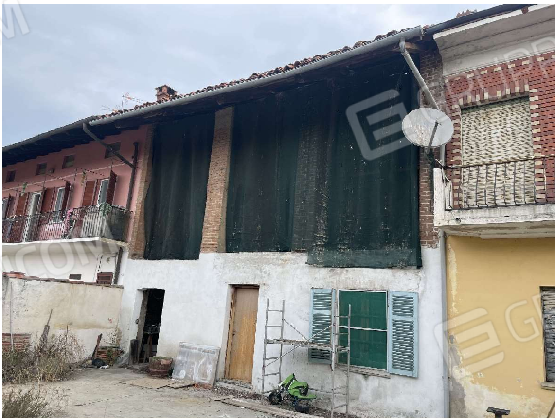
Vista delle tettoie accessibili con scala a pioli