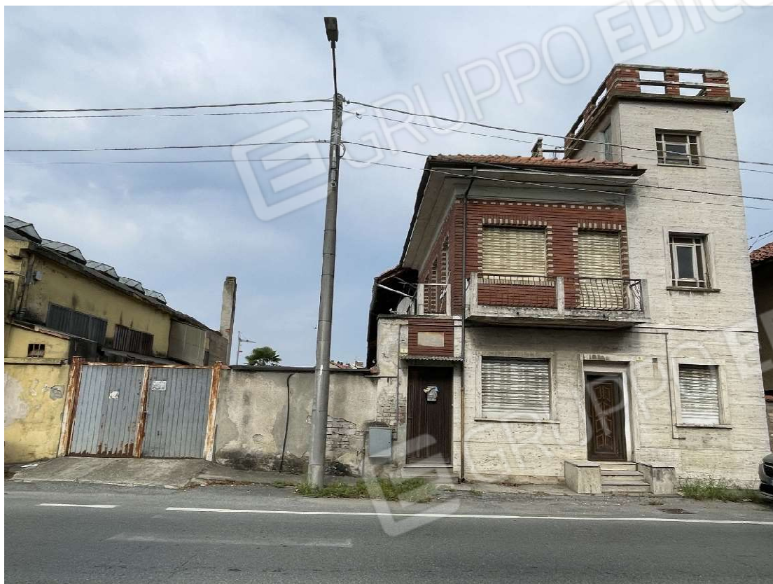
Vista esterna dell'immobile