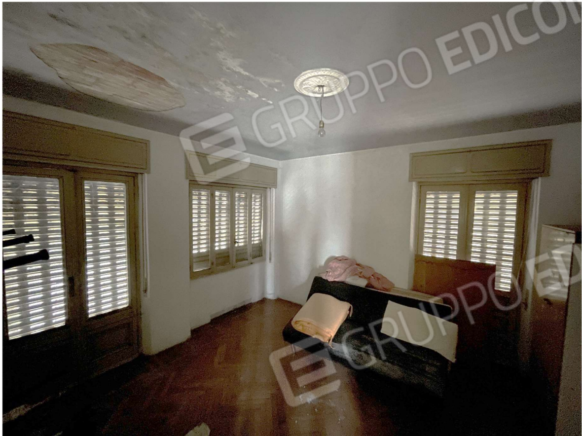
Camera al primo piano