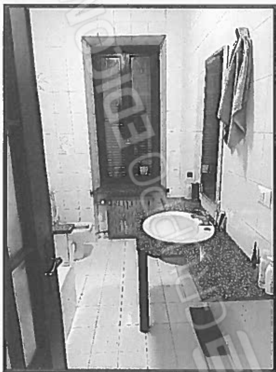
BAGNO (RIFERIMENTO PUNTO I IN PLANIMETRIA)