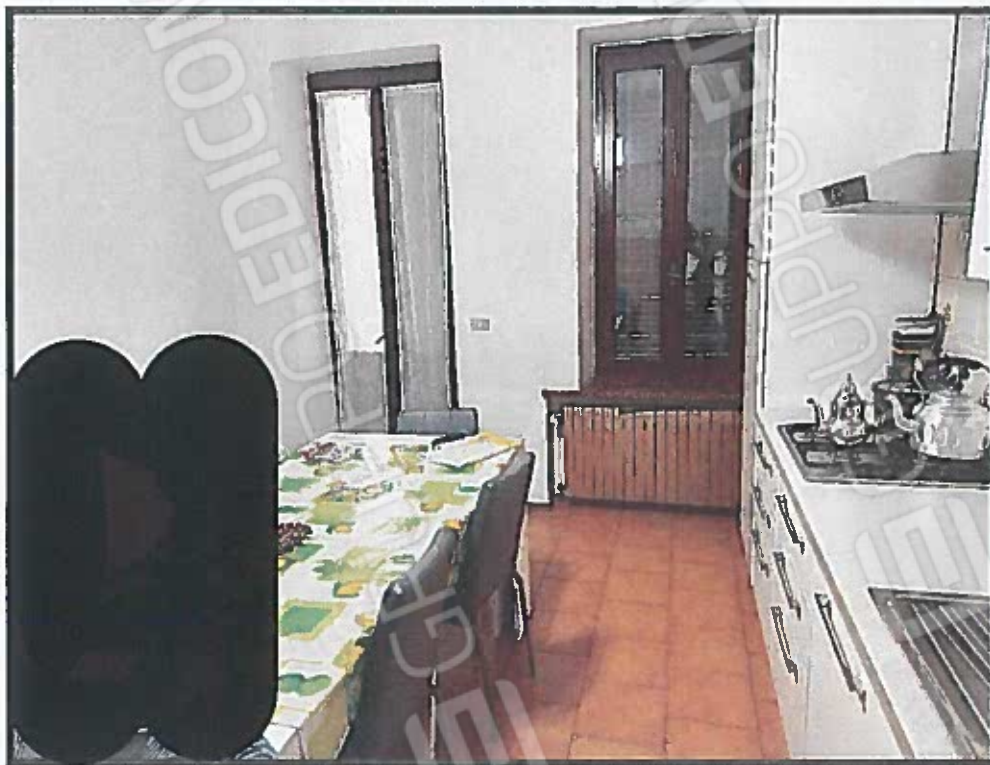
SALOTTO (RIFERIMENTO PUNTO D IN PLANIMETRIA)