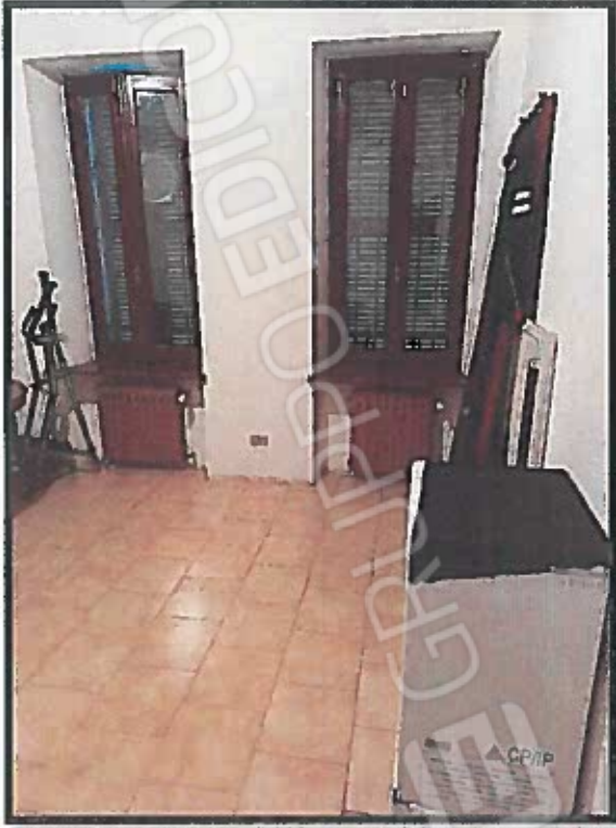
RIPOSTIGLIO (RIFERIMENTO PUNTO H IN PLANIMETRIA)