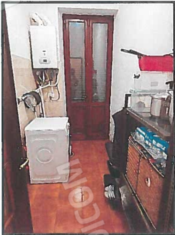
RIPOSTIGLIO (RIFERIMENTO PUNTO H IN PLANIMETRIA)