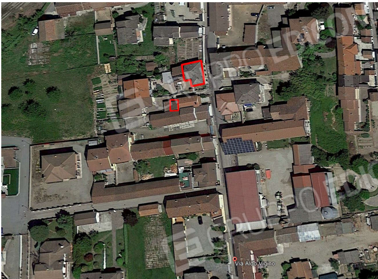
Vista satellitare ed inquadramento del bene, appartamento ed autorimessa, oggetto di perizia