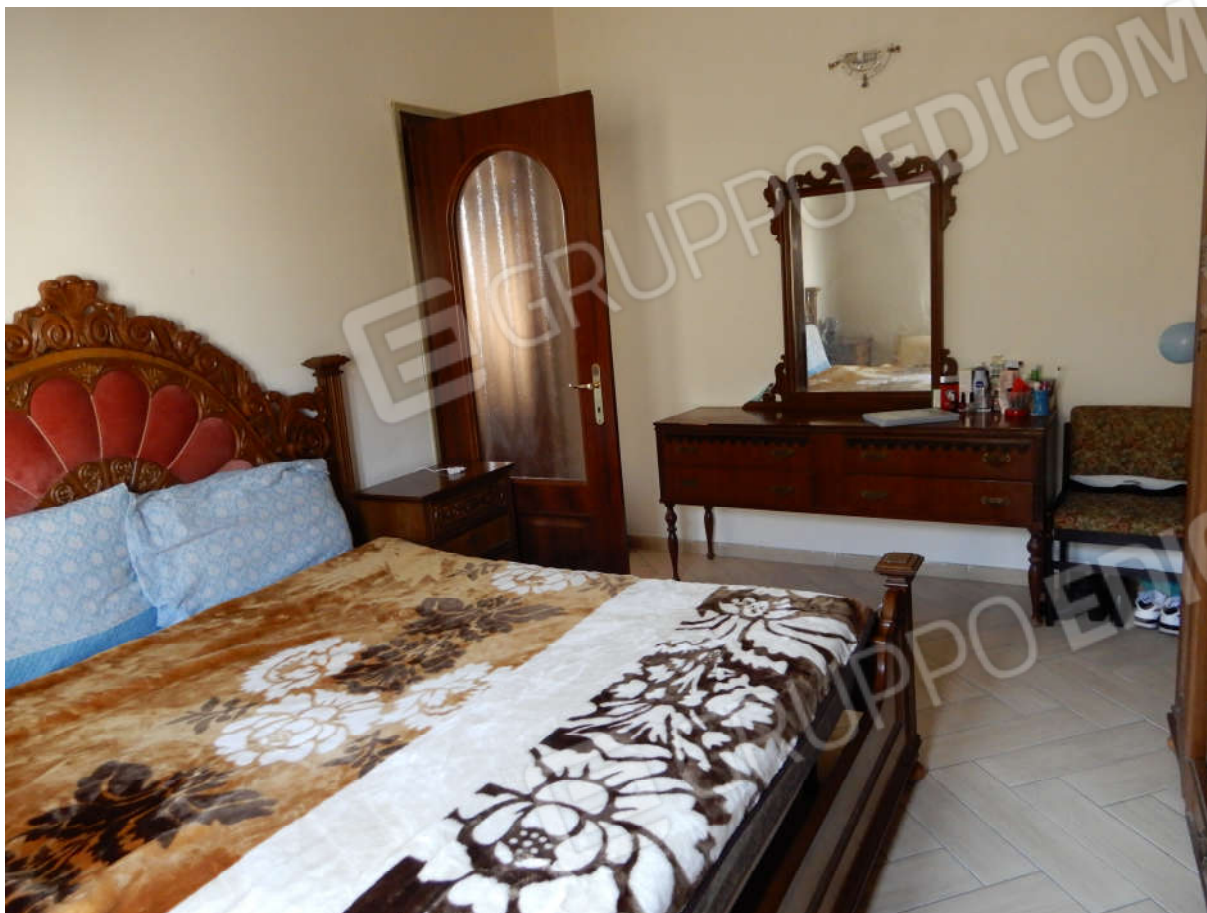
Piano primo - Camera matrimoniale