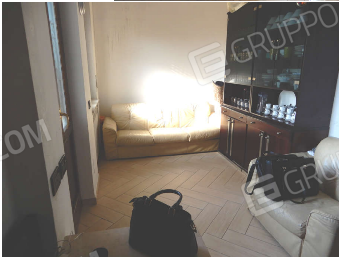
Piano primo – soggiorno aggettante su balcone