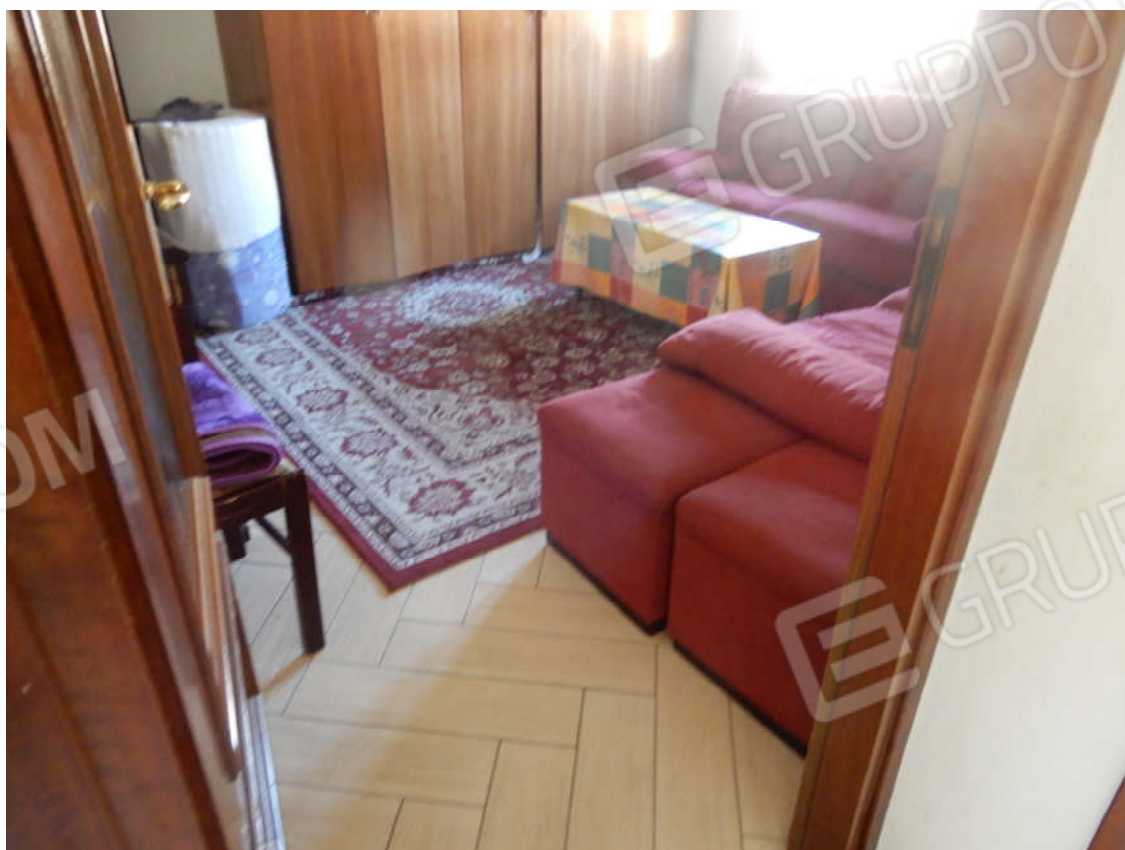
Piano primo - Camera