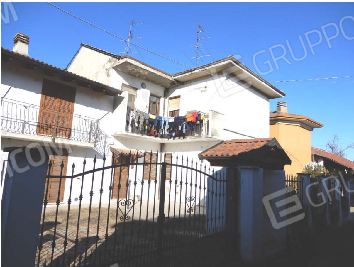
Ripresa da accesso privato – Prospetti Sud e prospetto Ovest

Da Via Igino percorrendo l'accesso privato si possono fotografare i prospetti Est e Sud