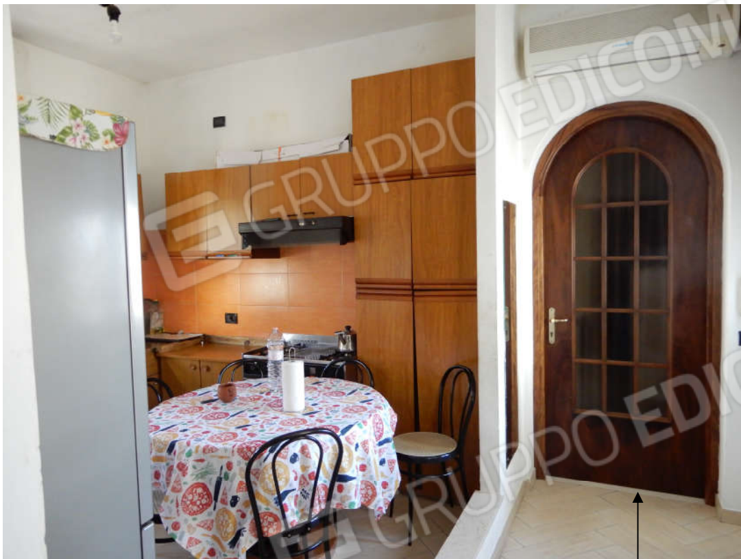
Piano primo – cucina – porta di accesso all'appartamento