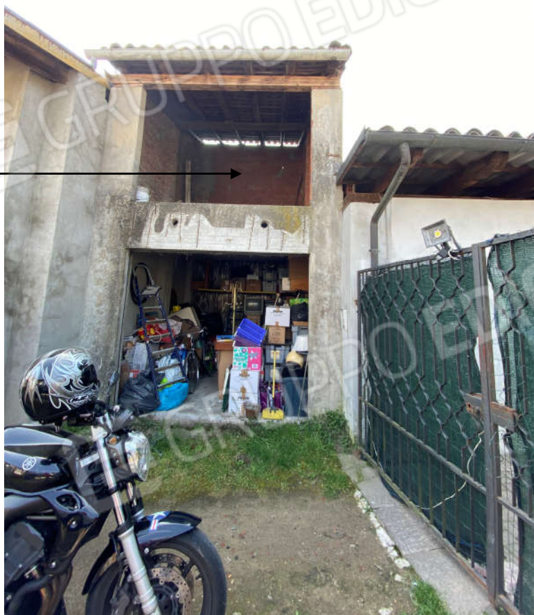
Vista da accesso privato - Piano terra autorimessa, piano primo cassero/fienile