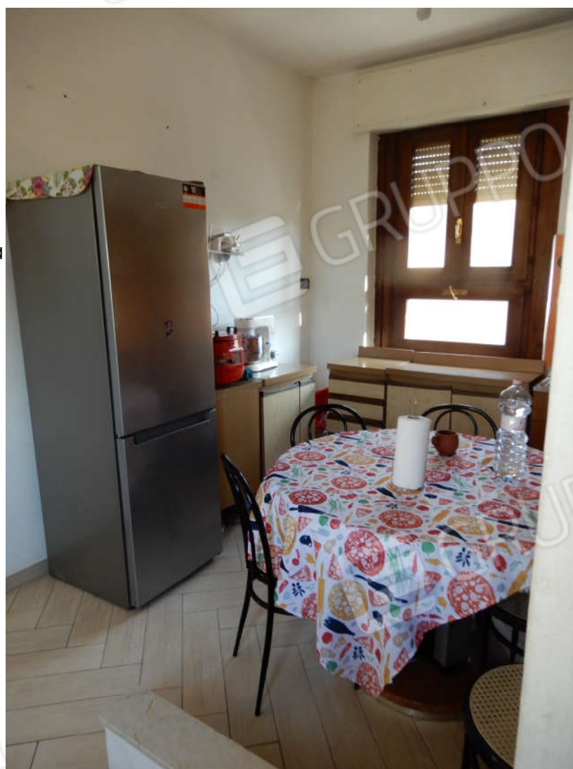
Piano primo - cucina