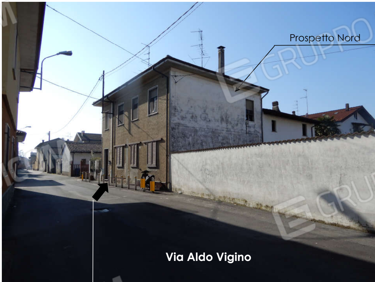
Ingresso all'appartamento, piano primo, prospetto Nord