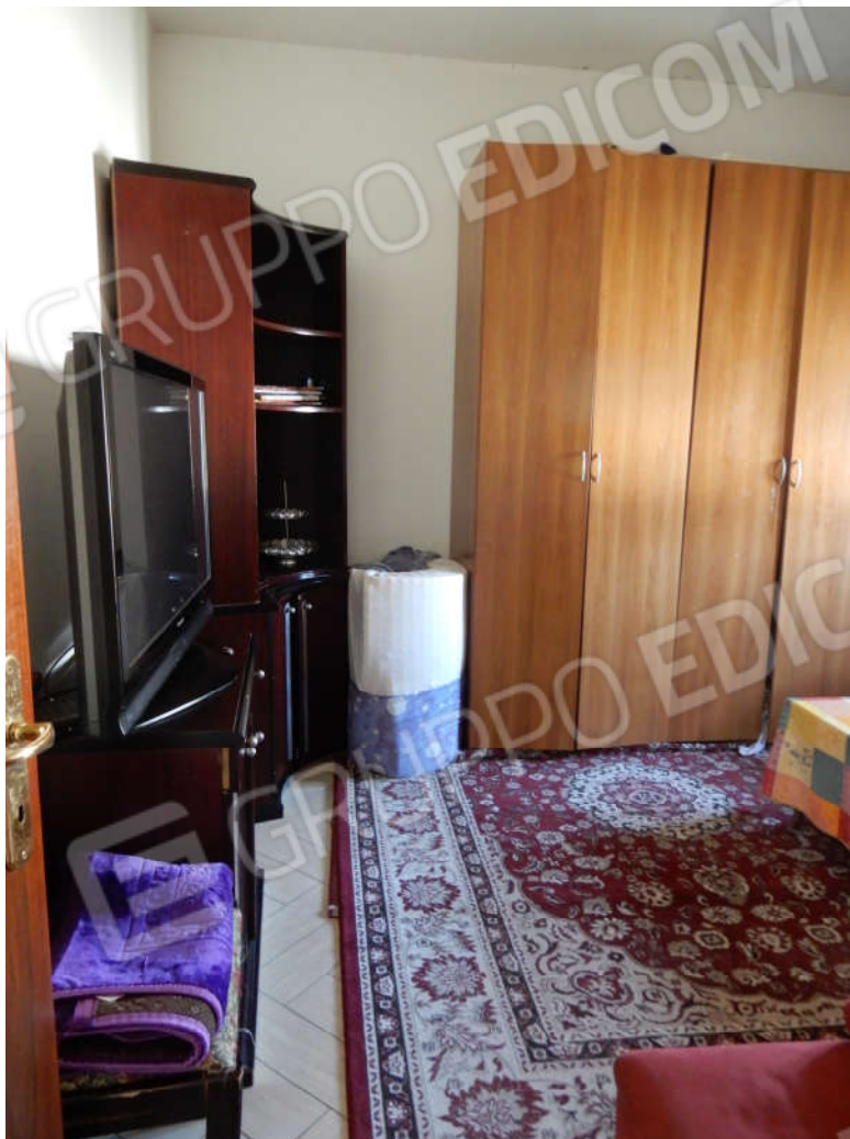
Piano primo - Camera