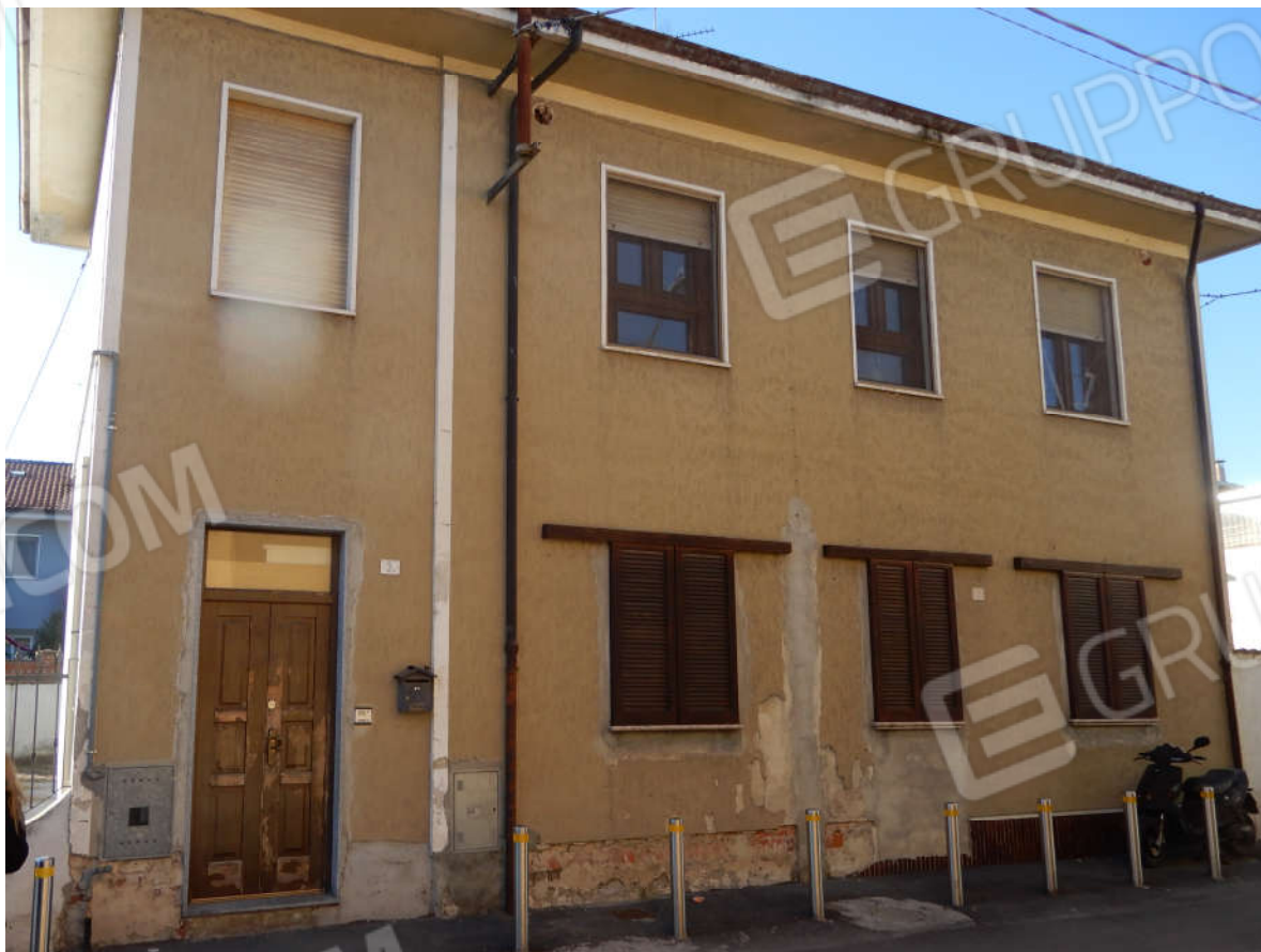
Piano terra – Porta di ingresso all'appartamento posto al piano primo