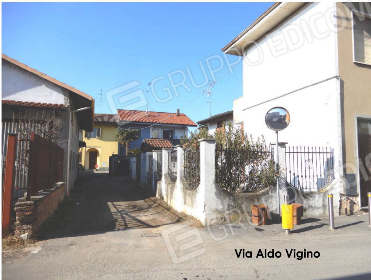
Via Aldo Vigino

Da Via Igino percorrendo l'accesso privato si possono fotografare i prospetti Est e Sud