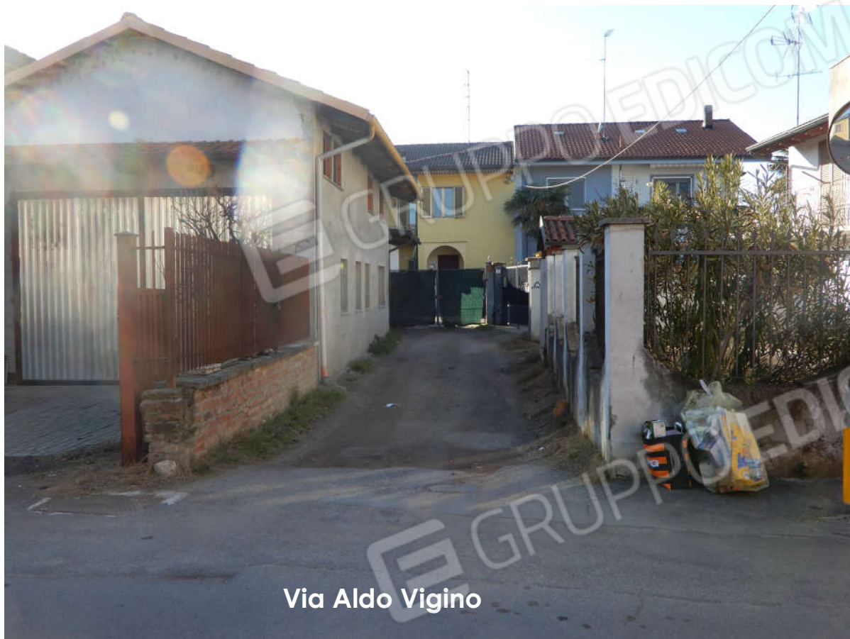
Via Aldo Vigino

Ripresa da via Vigino – Accesso privato all'autorimessa