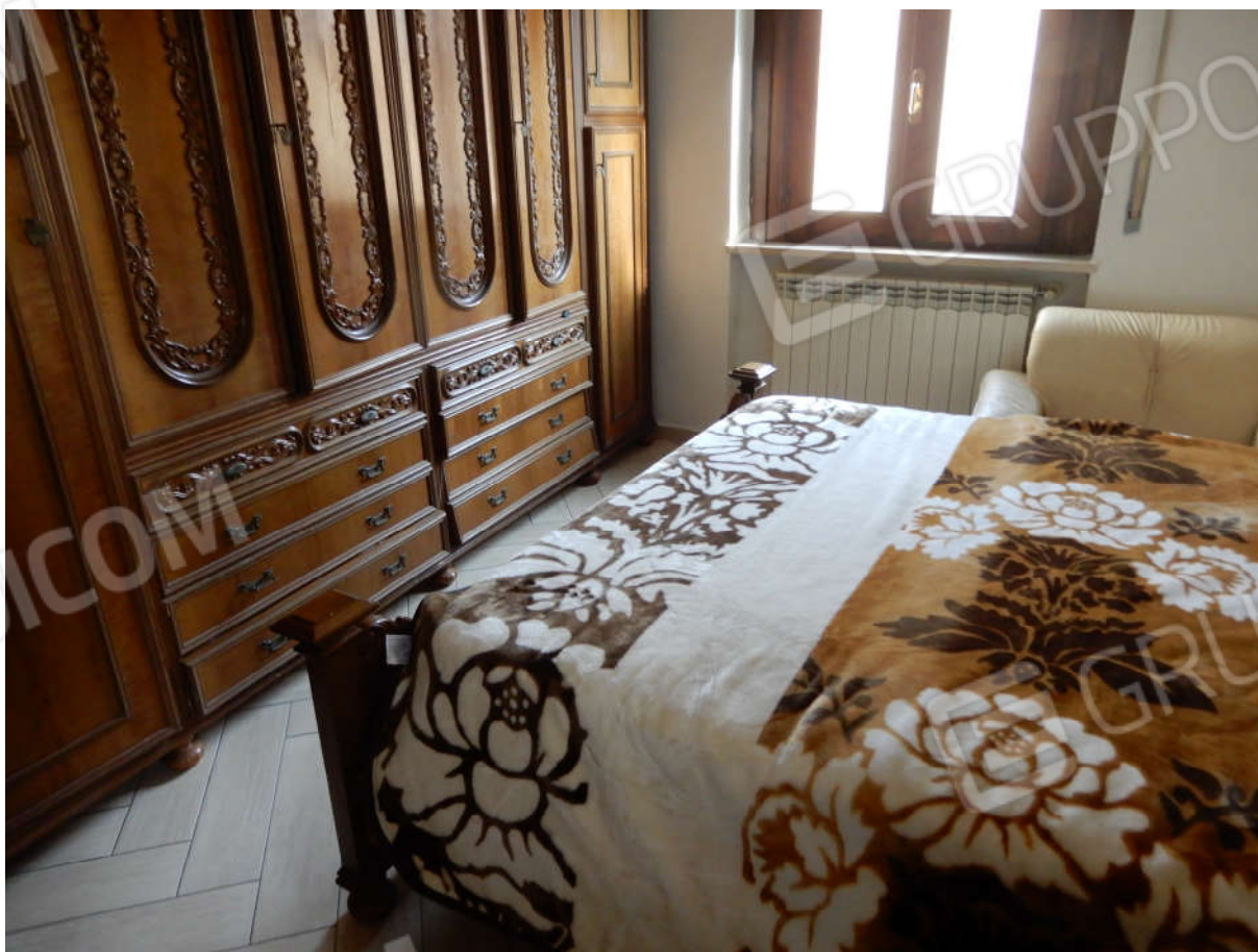
Piano primo - Camera matrimoniale