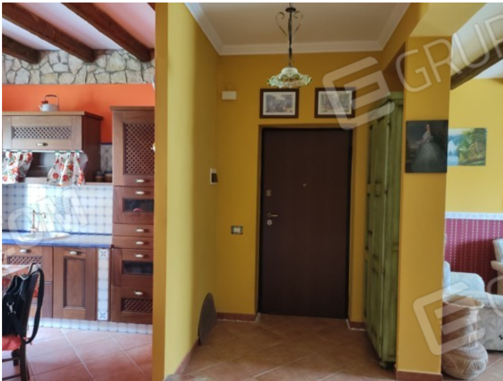
Fotografia J.2 - Ingresso-cucina-salone