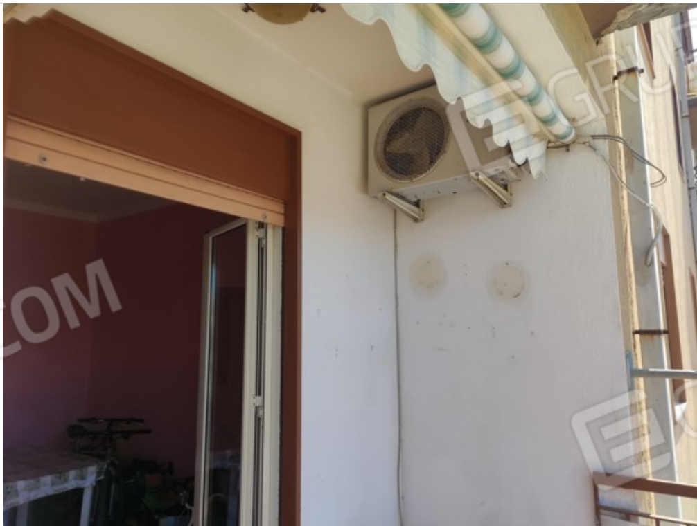
Fotografia J.12 - Particolare balcone sud