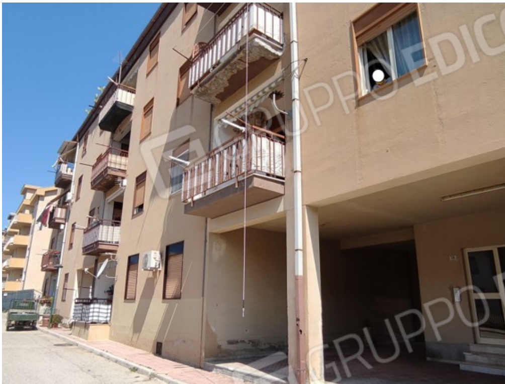
Fotografia J.13 - Prospetto sud con balcone