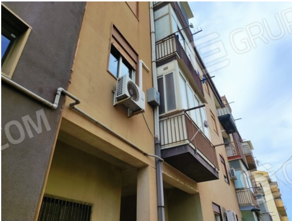
Fotografia J.14 - Prospetto nord con balcone chiuso a veranda