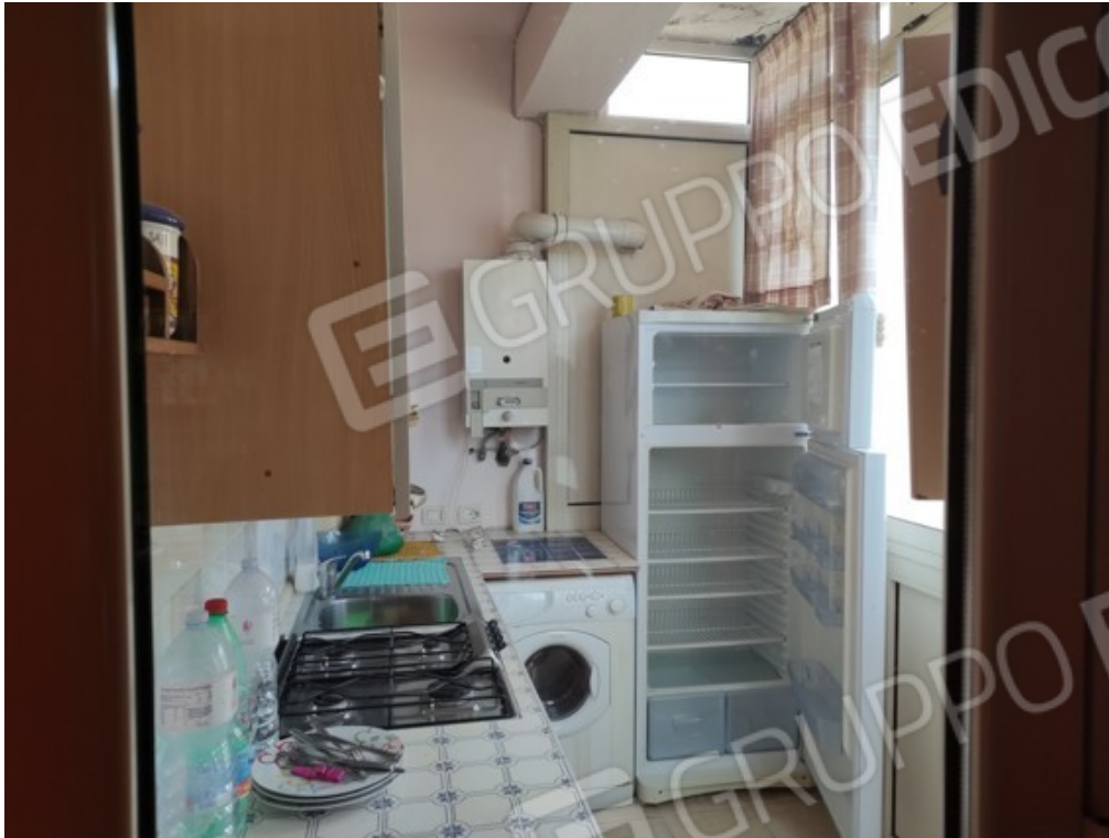
Fotografia J.5 - Veranda su balcone nord