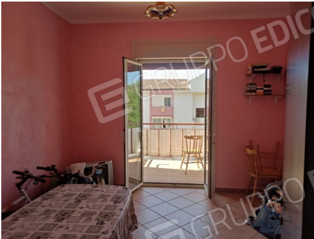
Fotografia J.7 - Camera da letto singola