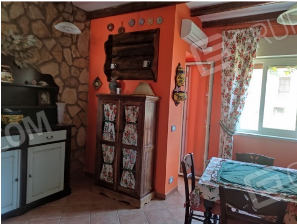
Fotografia J.4 - Cucina