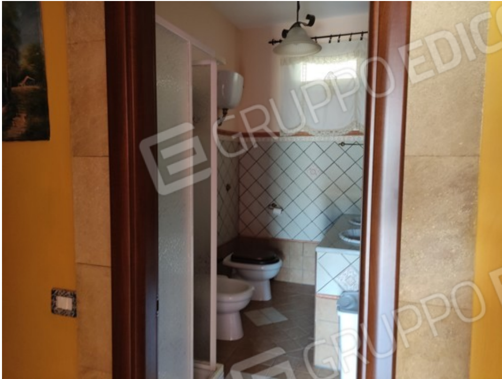
Fotografia J.11 - Bagno