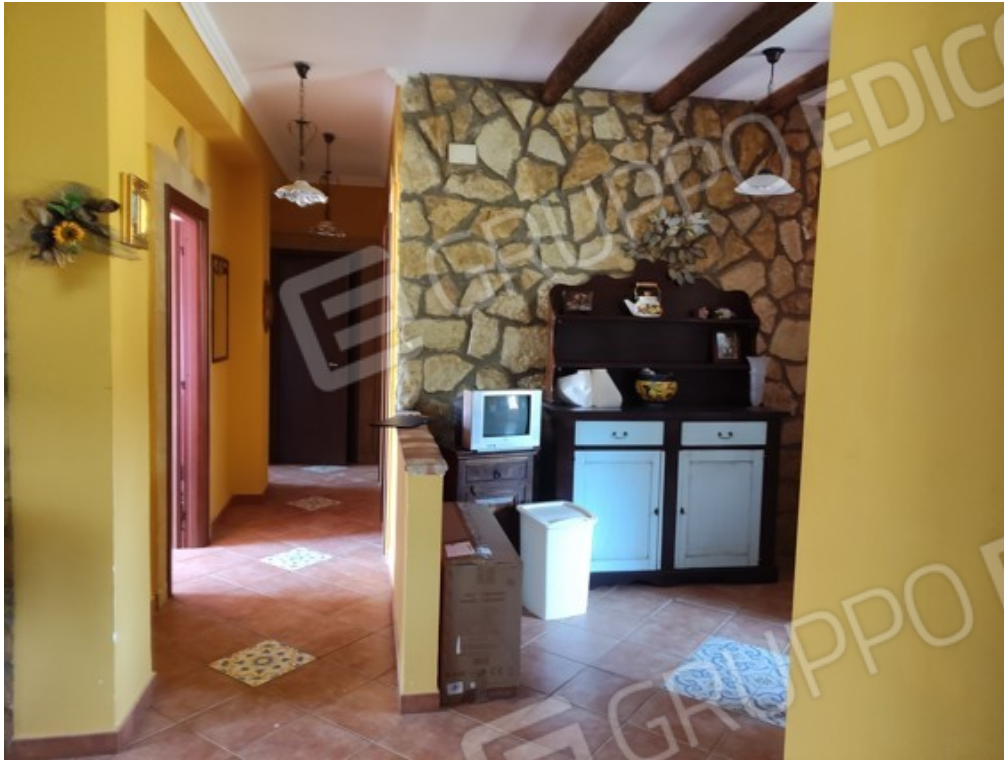
Fotografia J.1 - Ingresso