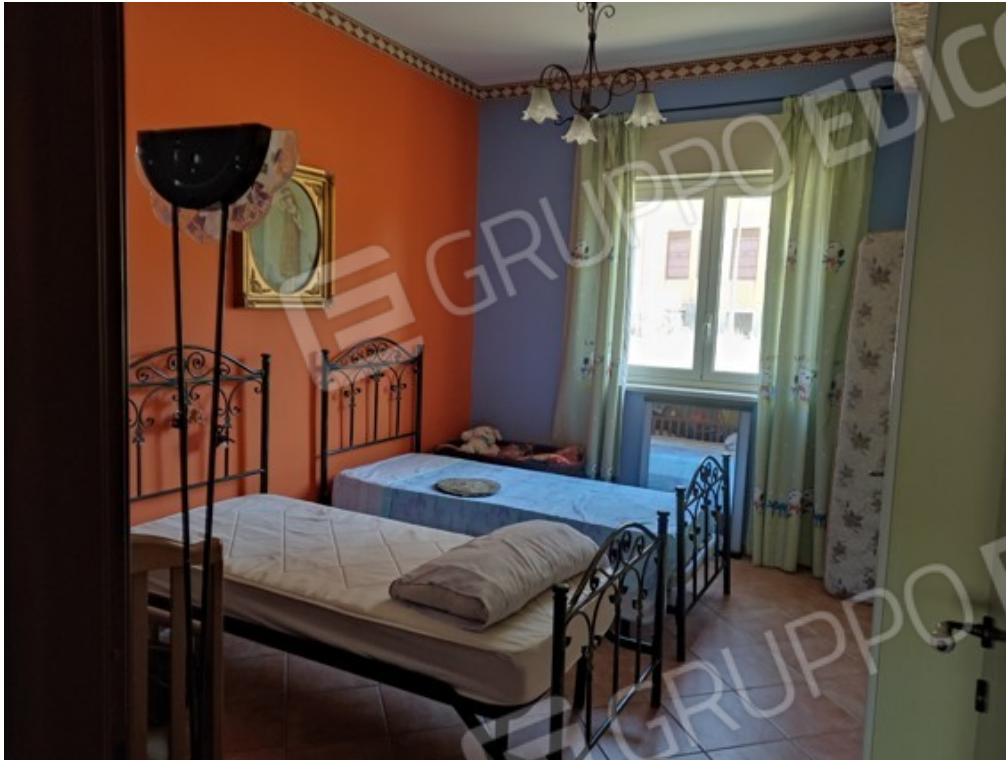
Fotografia J.9 - Camera da letto doppia