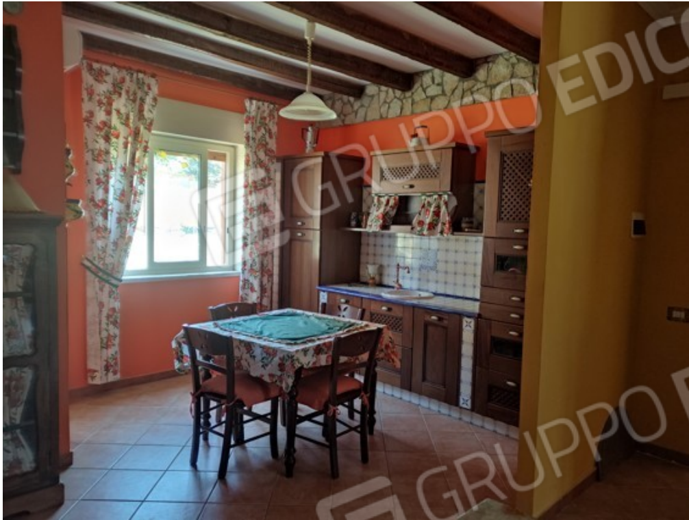
Fotografia J.3 - Cucina