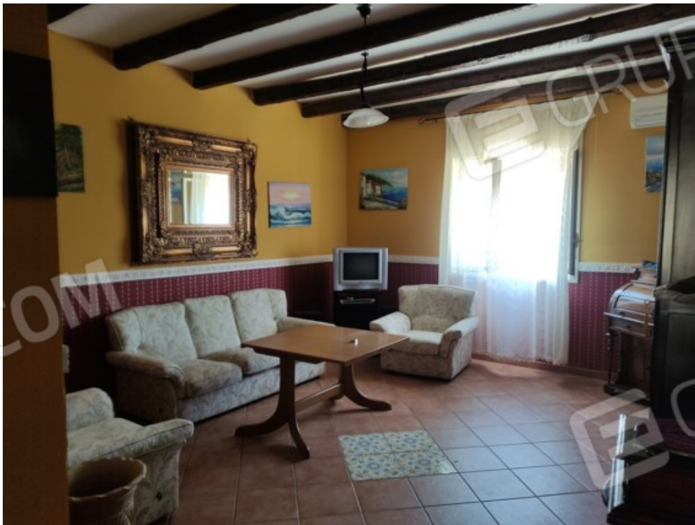
Fotografia J.6 - Salone