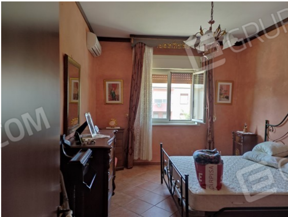
Fotografia J.10 - Camera da letto doppia