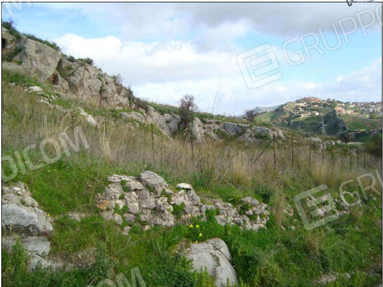
Terreno adibito a corte fg. 89 part. 46