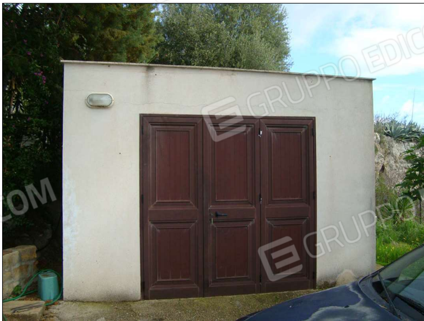
Prospetto magazzino principale s/o