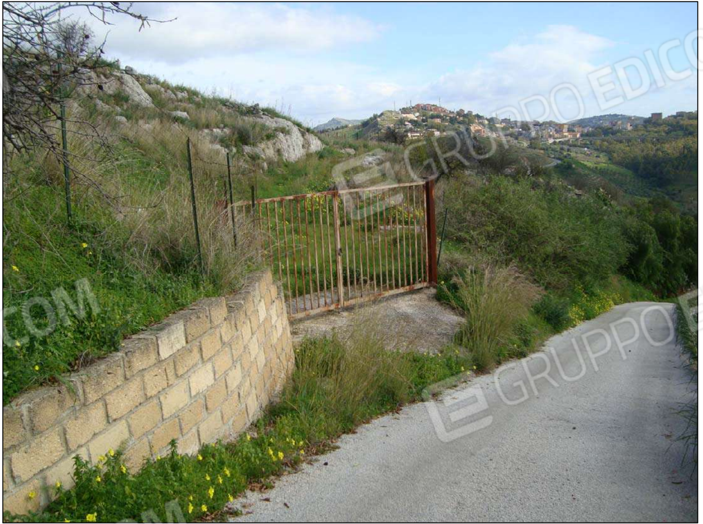
Cancello d'ingresso per il Terreno adibito a corte fg. 89 part. 46