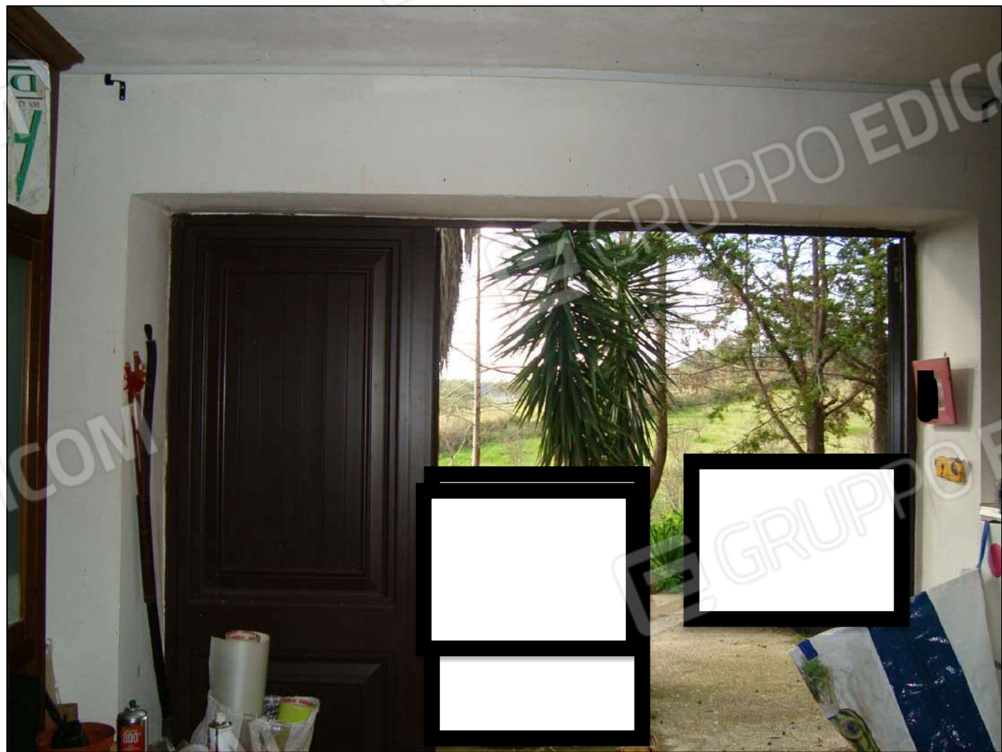
Vista interna magazzino