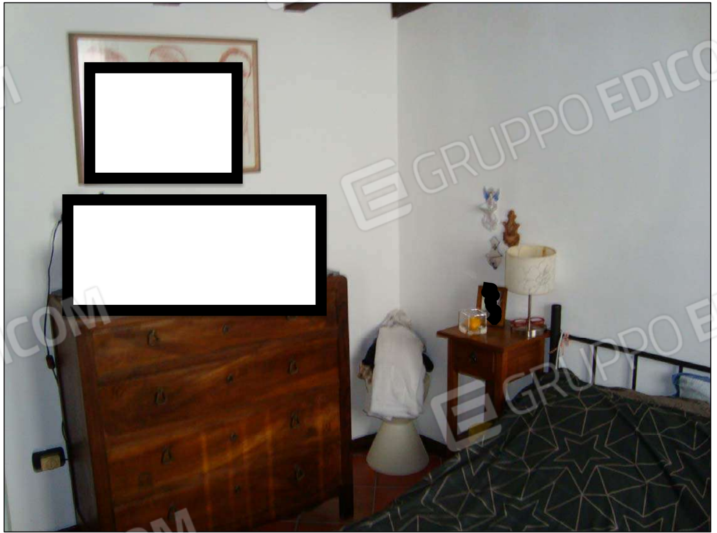
Camera da letto P.T.