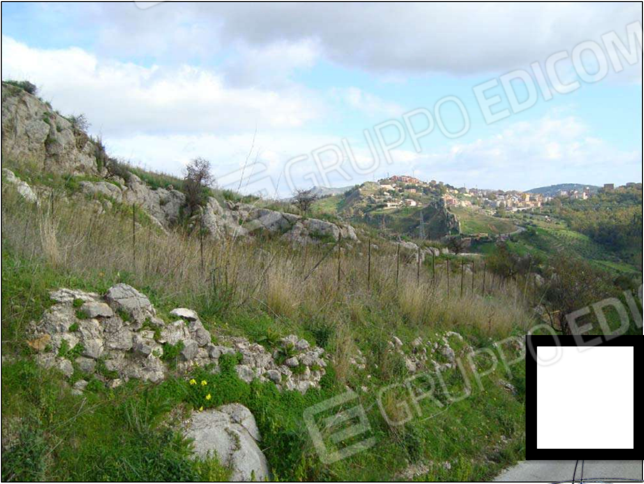
Terreno adibito a corte fg. 89 part. 46