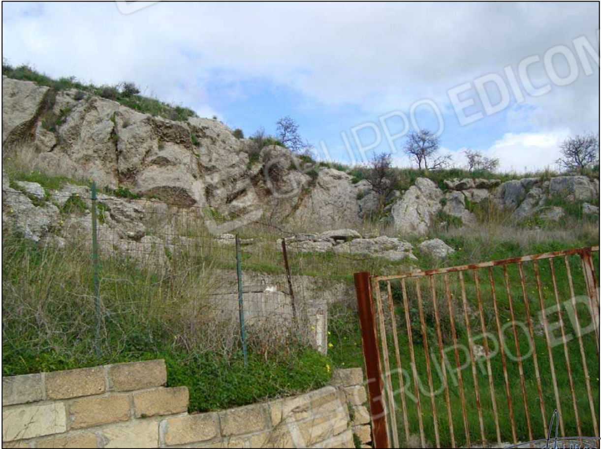
Terreno adibito a corte fg. 89 part. 46