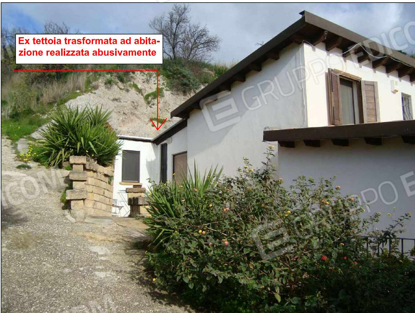
Prospetto lato EST

Ex tettoia trasformata ad abitazione realizzata abusivamente