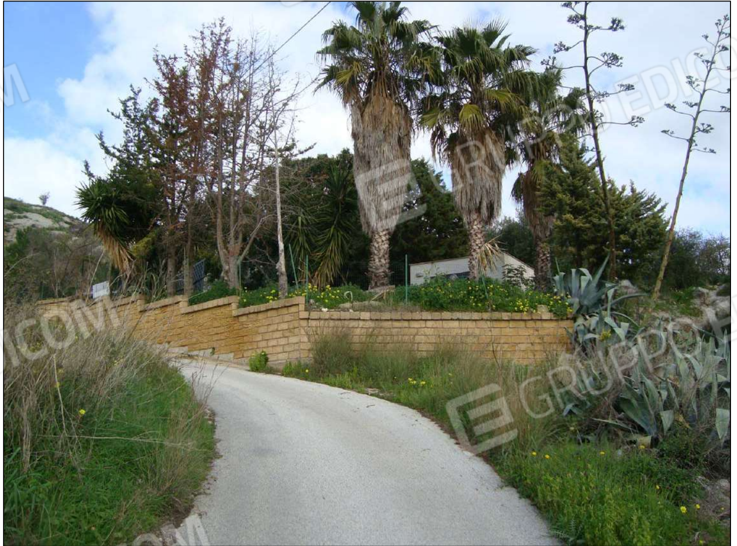
Recinzione della corte fg. 89 part. 556