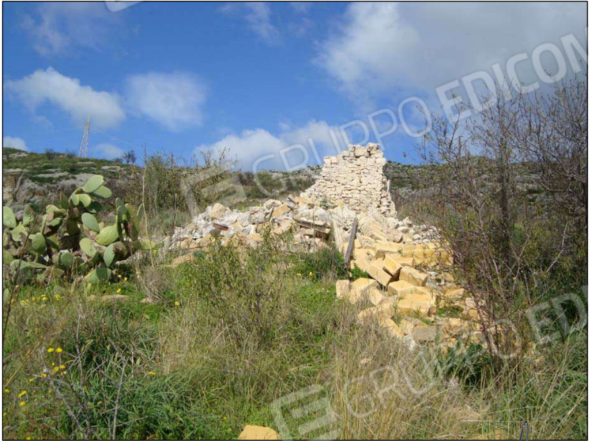
Rudere del ex F.R. fg. 89 part. 47