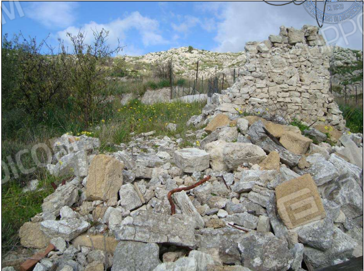
Rudere del ex F.R. fg. 89 part. 47