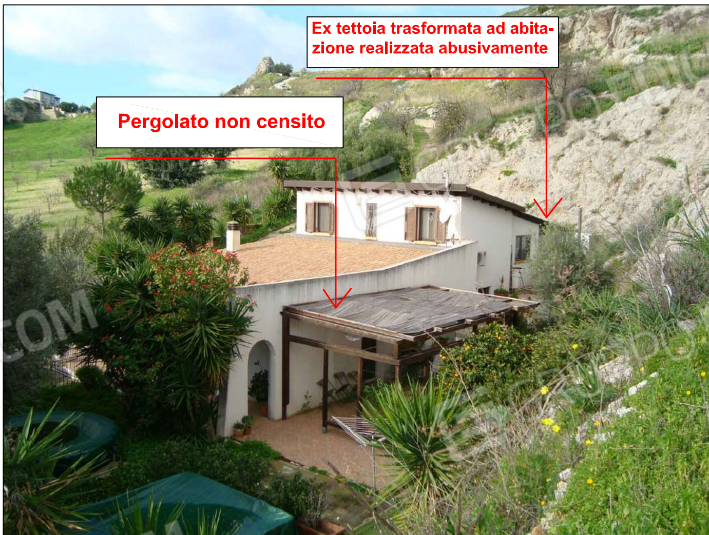
Prospetto lato OVEST