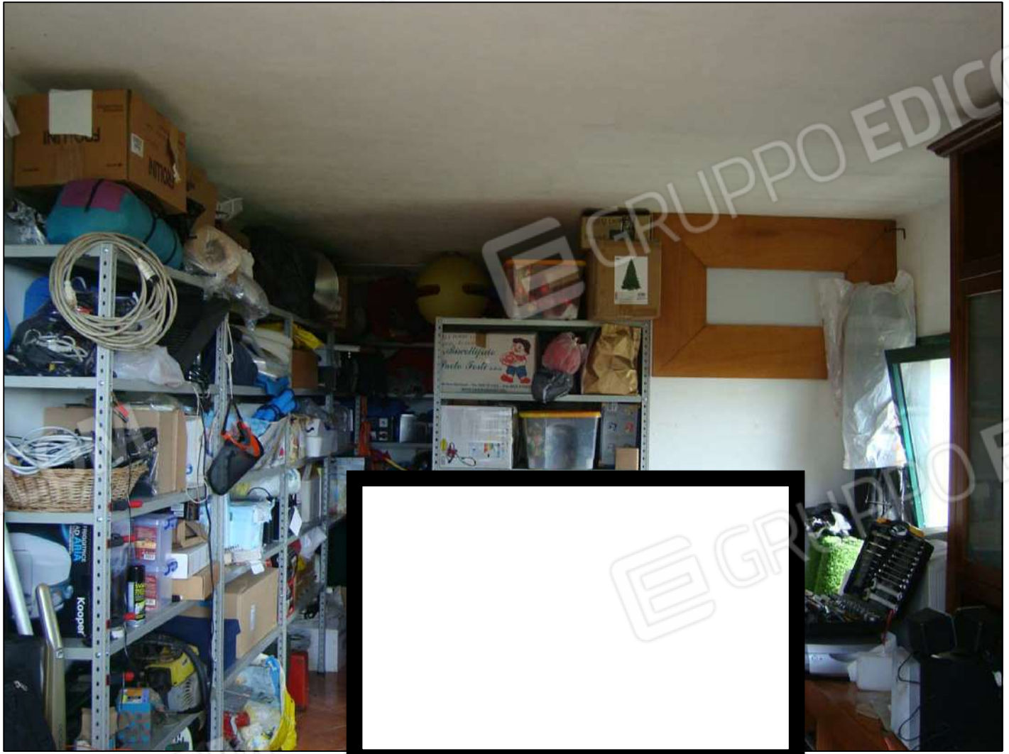
Vista interna magazzino