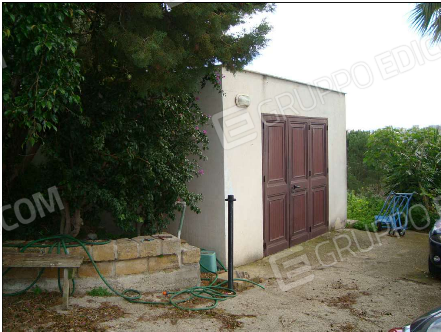
Prospetto magazzino principale s/o