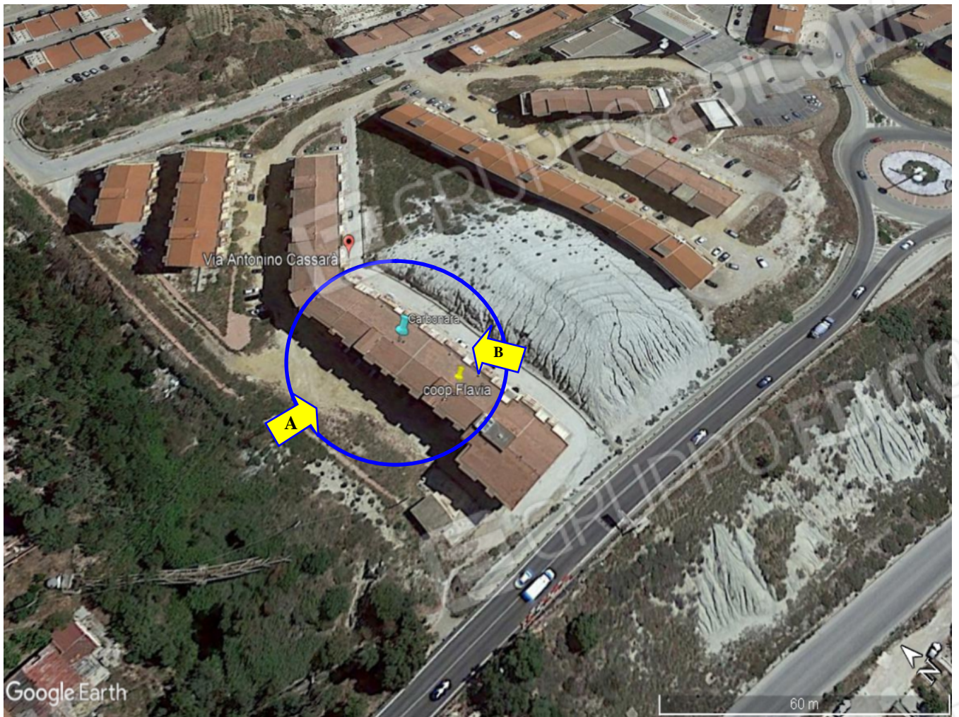
Contesto urbanistico nelle vicinanze del fabbricato ubicato in via Cassarà a Porto Empedocle