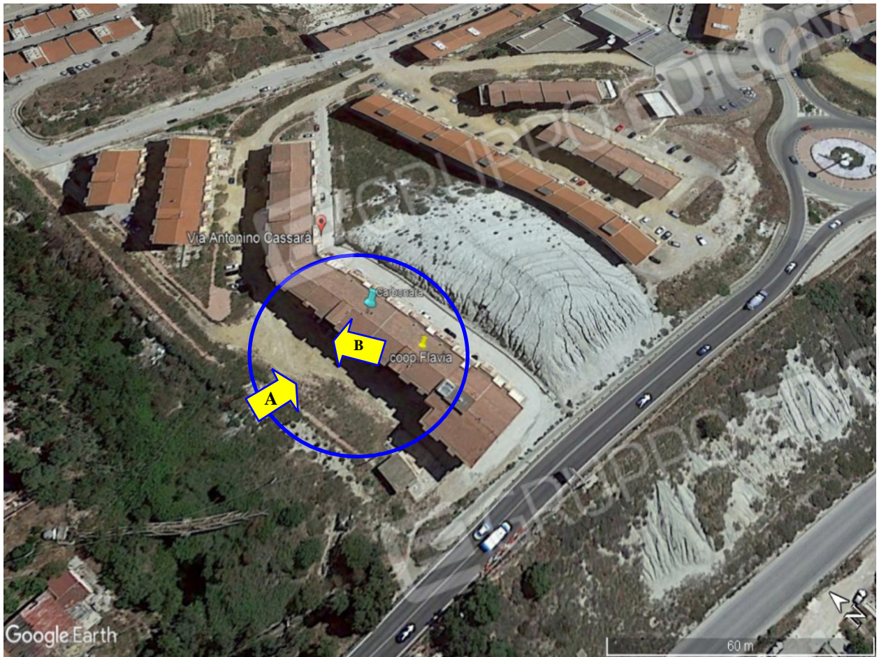
Contesto urbanistico nelle vicinanze del fabbricato ubicato in via Cassarà a Porto Empedocle