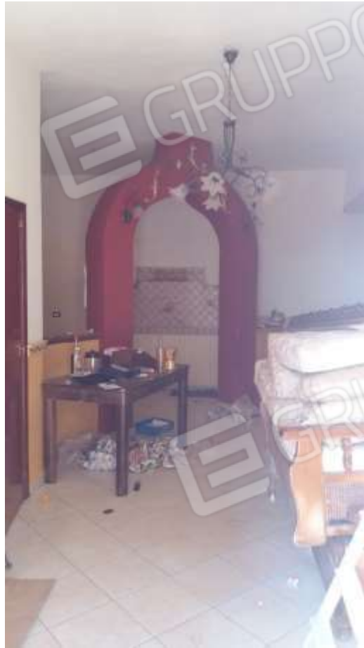
FOTO 5 - Veduta dell'ingresso a piano terra.