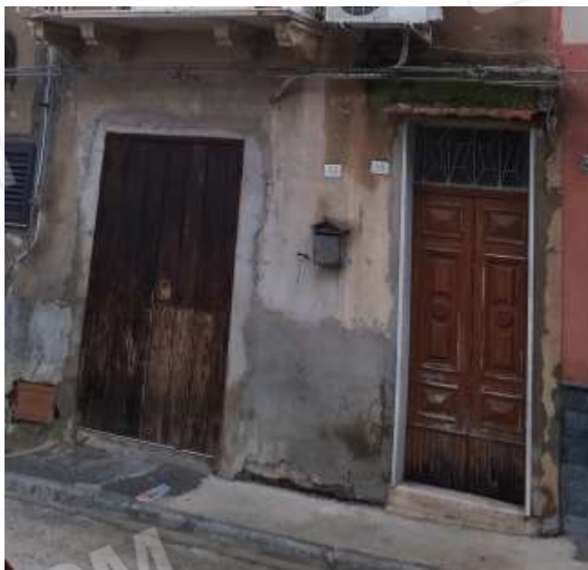
FOTO 2 - Veduta del portone d'ingresso