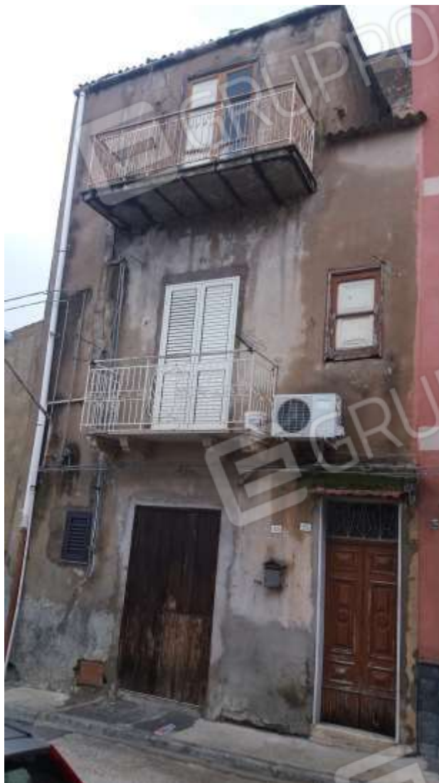
FOTO 1 - Veduta dell'unità immobiliare, sito in Via Cangiamila 53