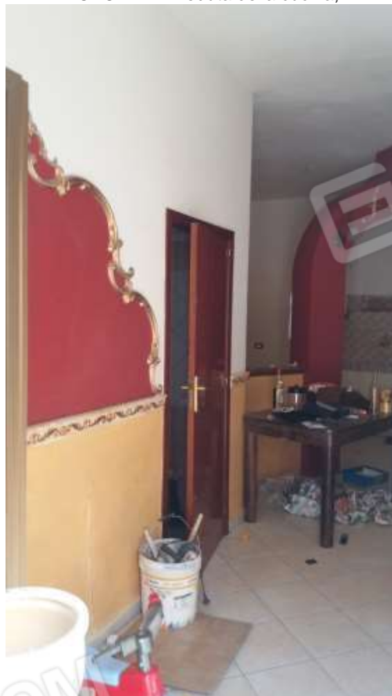
FOTO 8 - Veduta del wc a piano terra.