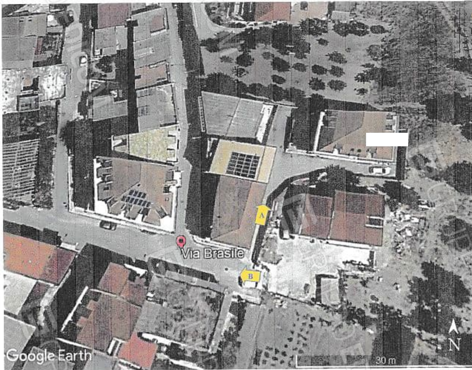
Contesto urbanistico nell'immediate vicinanze del Magazzino, ubicato in via Brasile a Canicatti