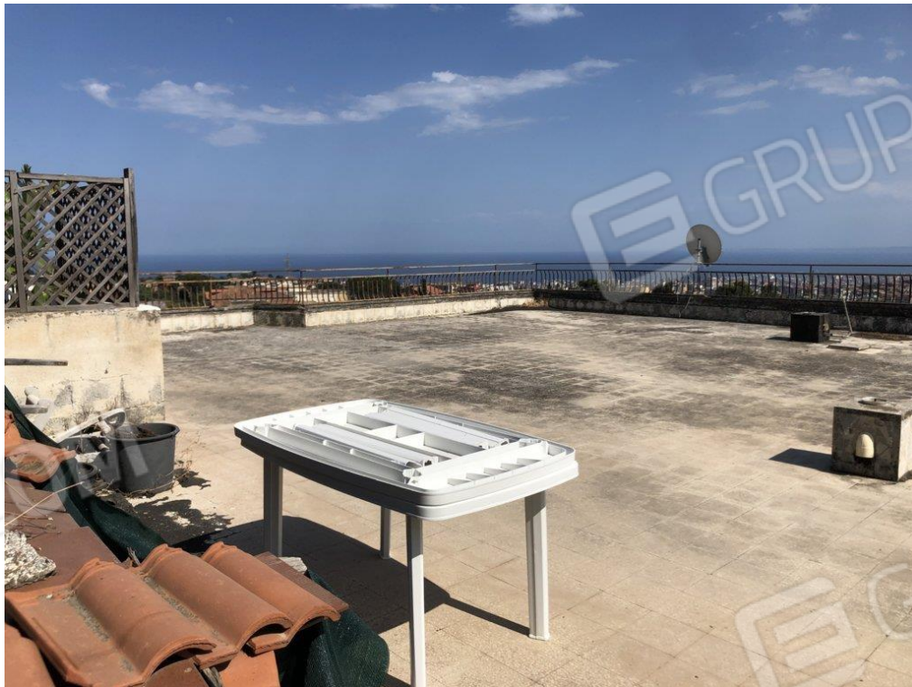
Foto n.16 Vista del lastrico solare.