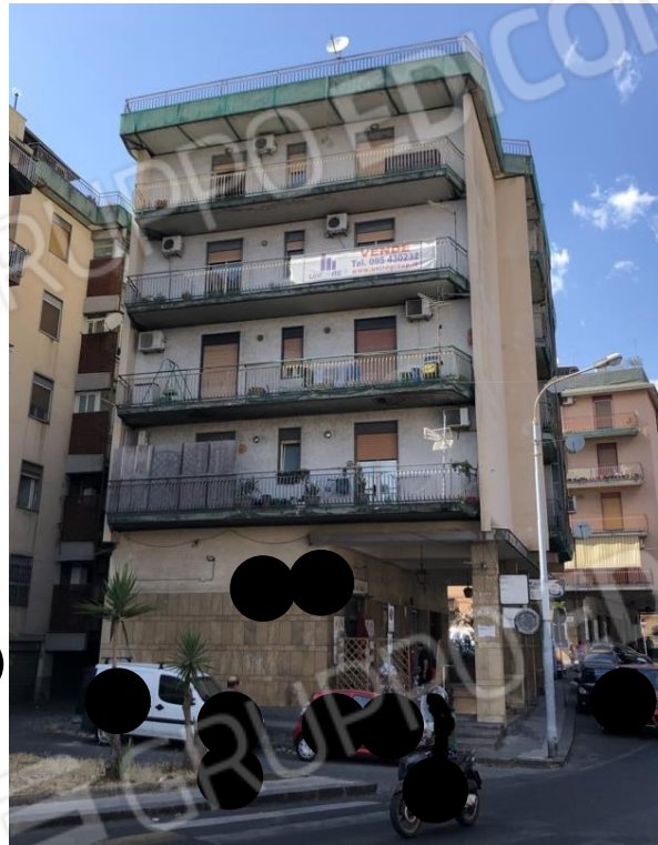
Foto nn.1-2 Vista dell'unità edilizia da via San Paolo.