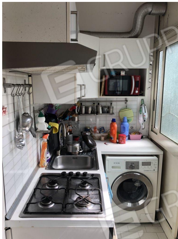
Foto nn 7-8 Vista dell'ingresso e dell'angolo cottura.