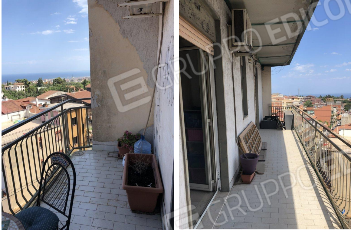
Foto nn 14-15 Vista dei balconi.