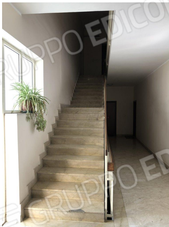
Foto nn.5-6 Vista del portoncino di ingresso all'appartamento al piano 4° e delle scale di accesso al piano 5°