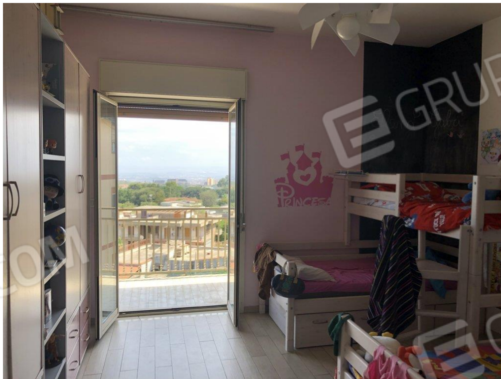
Foto n.13 Vista di una delle camere da letto.