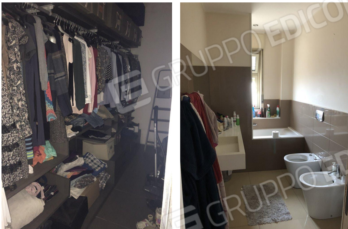
Foto nn.11-12 Vista della cabina armadio e del bagno.