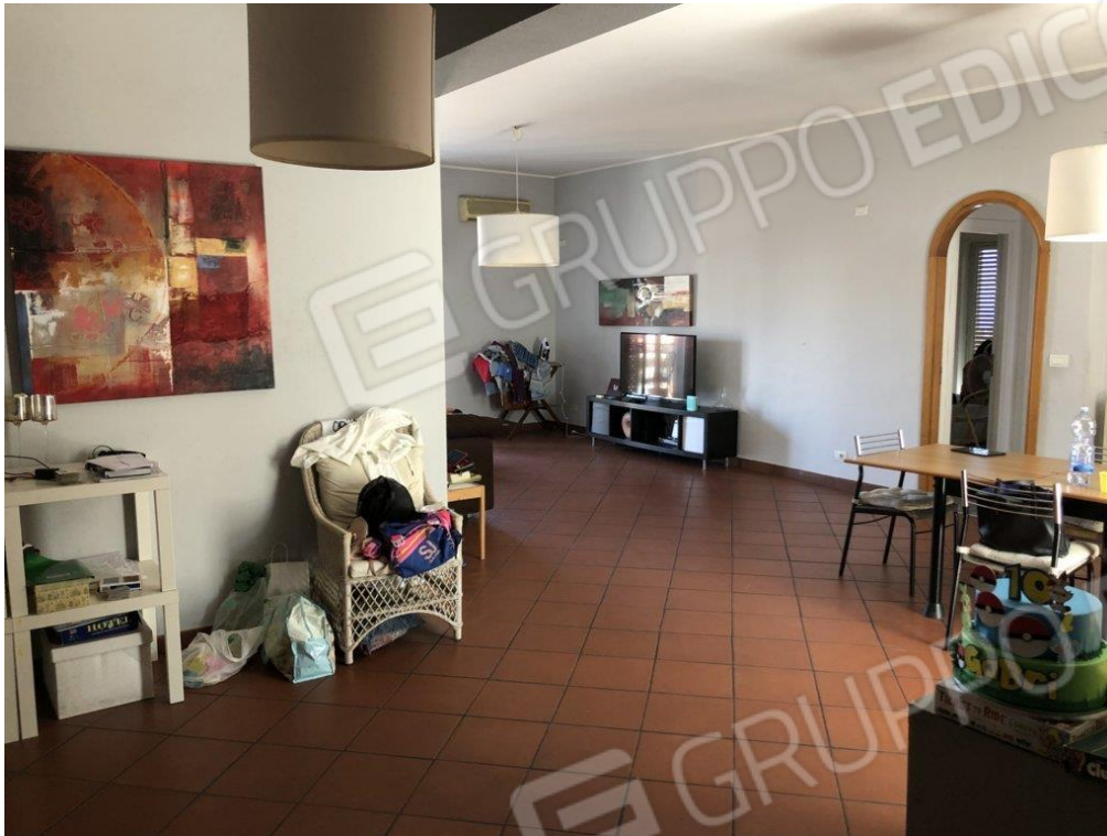
Foto n.9 Vista del vano soggiorno.