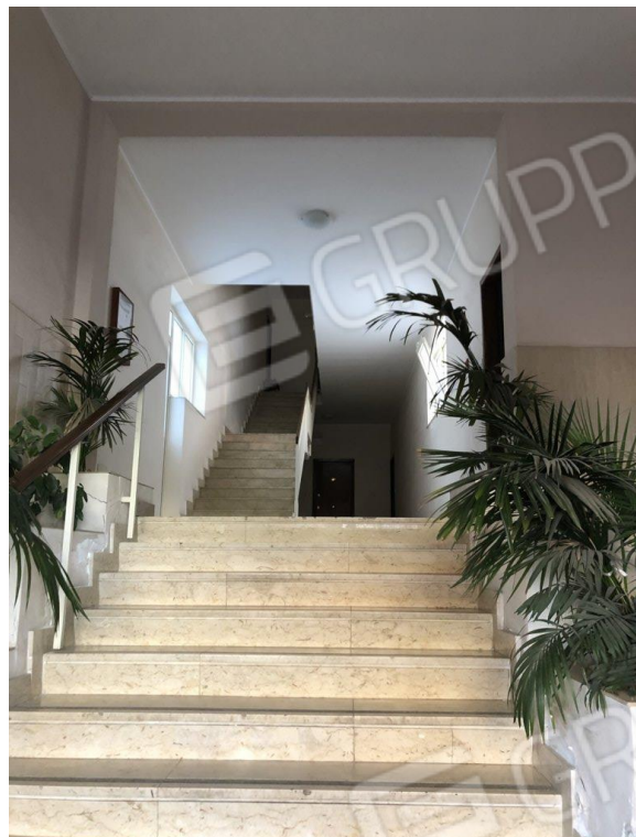
Foto nn.3-4 Vista del portoncino di ingresso su via San Paolo al civico n.35 e dell'androne condominiale.