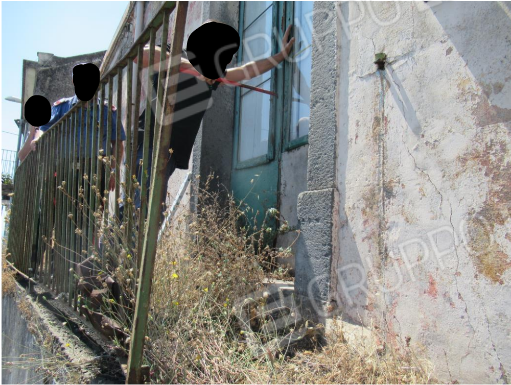
Foto n° 1 – Apertura dell'immobile ad opera del fabbro in presenza dei Carabinieri –