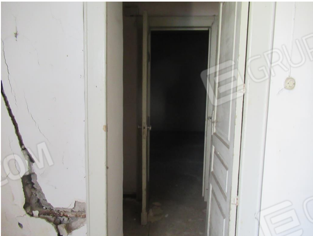
Foto n ° 10 – Condizioni dell'immobile riscontrate al sopralluogo –