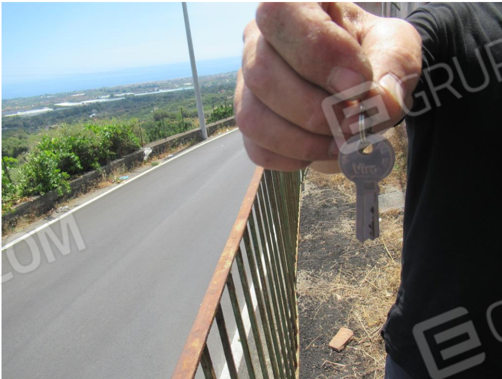
Foto n ° 24 – Consegna delle chiavi al C.T.U. da parte del fabbro. –