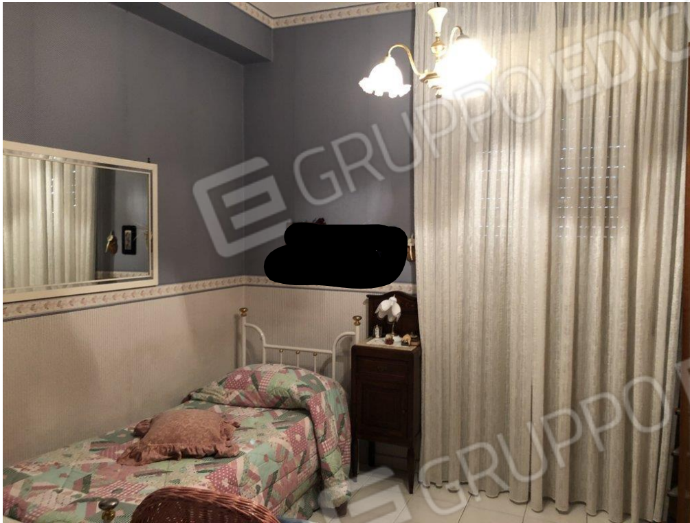
Foto n.9- Vista di una delle camere.