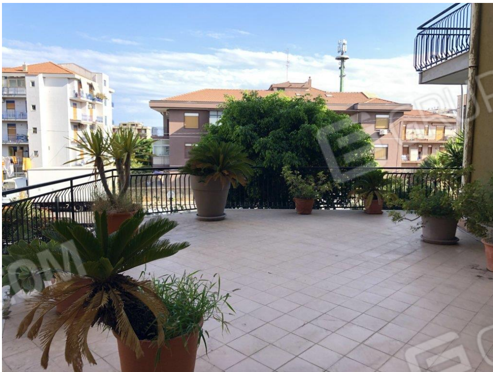
Foto n.14 Vista del terrazzo.