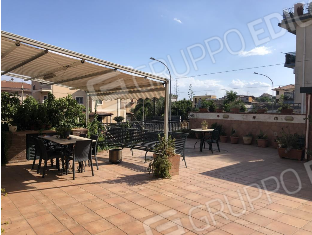
Foto n.15 Vista del terrazzo.