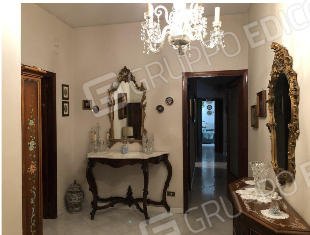
Foto n.3 Vista dell'ingresso dell'appartamento.