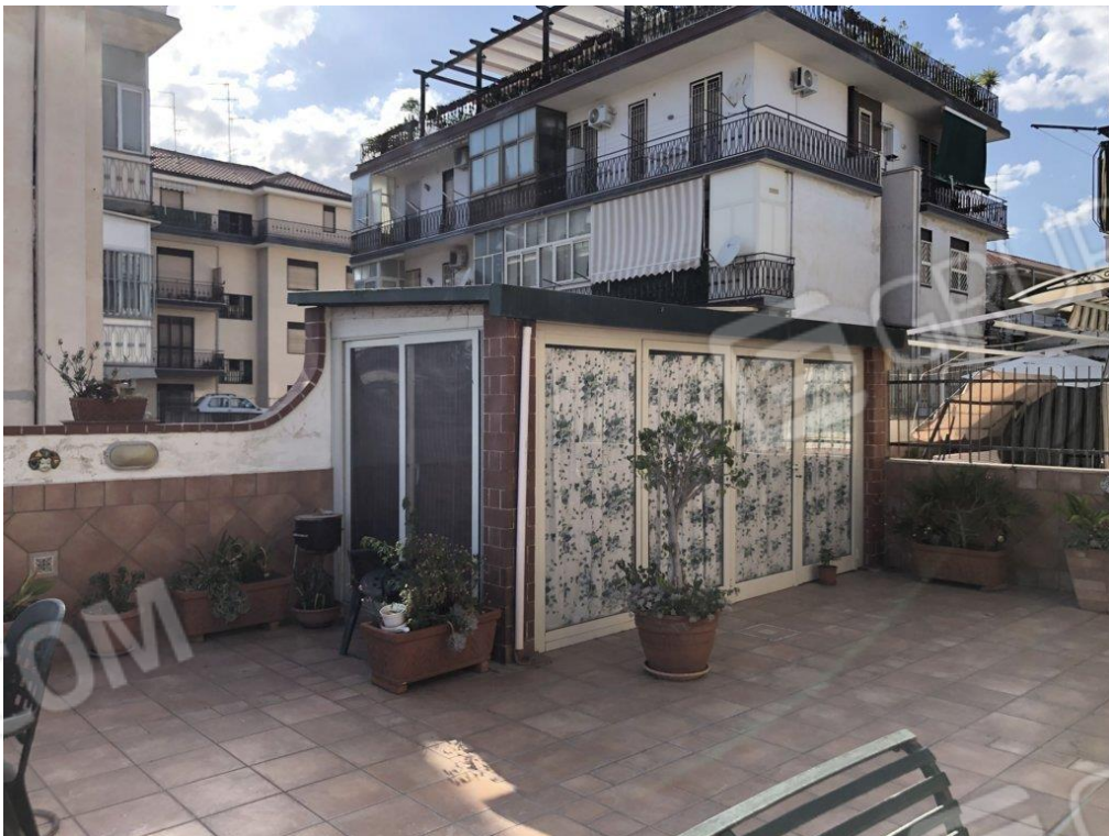
Foto n.16 Vista della costruzione sul terrazzo.