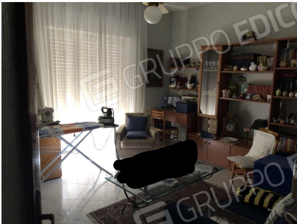
Foto n.11 Vista di una delle camere.