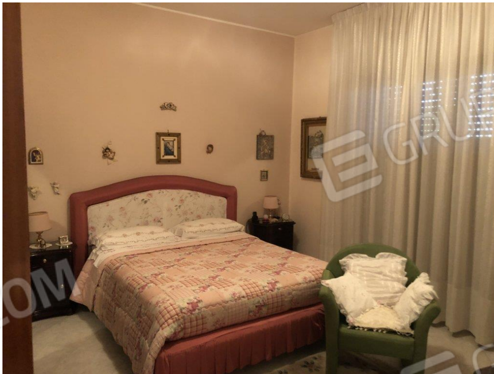
Foto n.10 Vista di una delle camere.