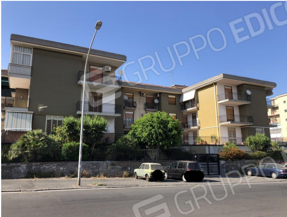
Foto n.1 Vista dell'edificio residenziale da via Evangelista Torricelli.