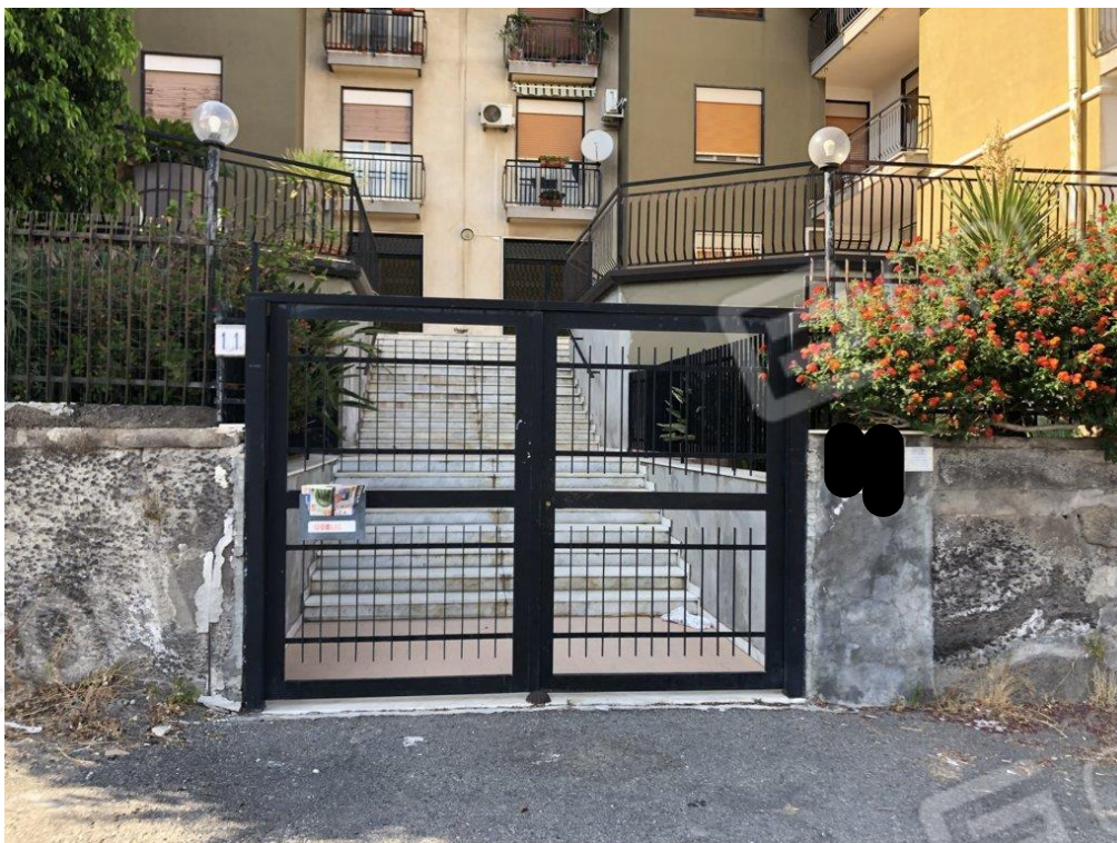
Foto n.2 Vista del cancello di accesso all'edificio residenziale al civico n.11.