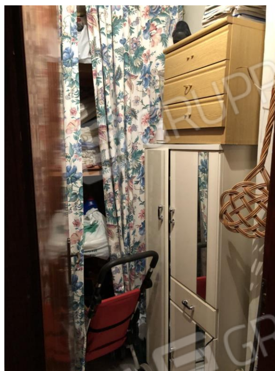
Foto nn.4-5 Vista del corridoio e del ripostiglio.