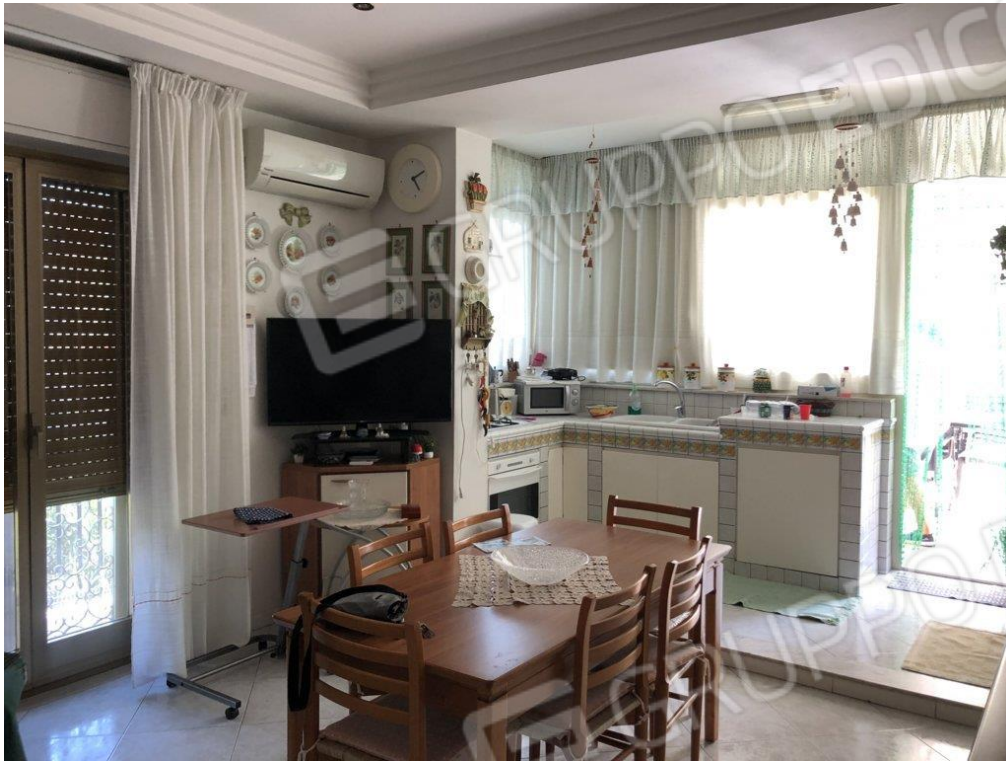
Foto n.13 Vista della cucina.