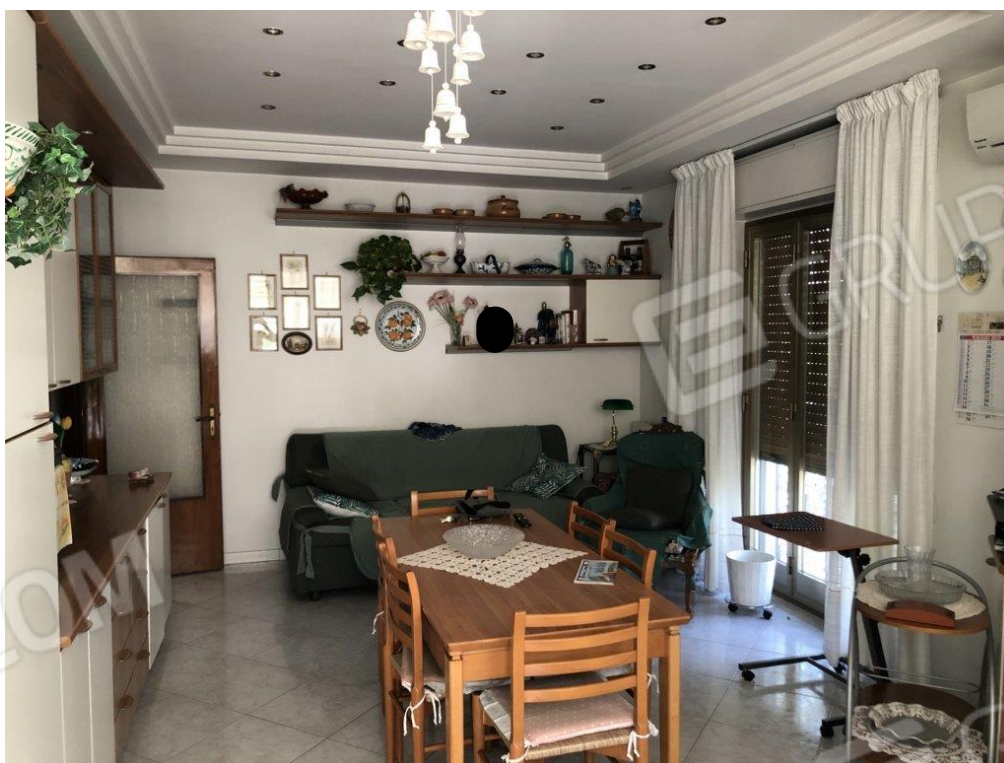
Foto n.12 Vista della cucina.