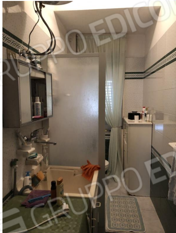
Foto nn.6-7 Vista del bagno e della lavanderia.