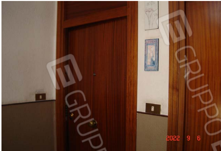
Porta di ingresso