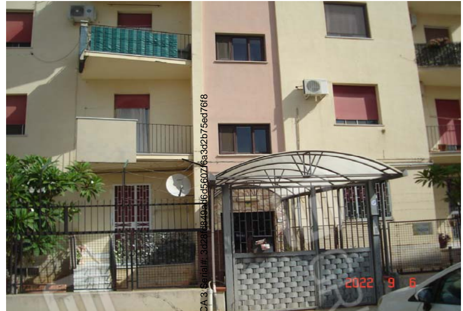
Vista esterna edificio