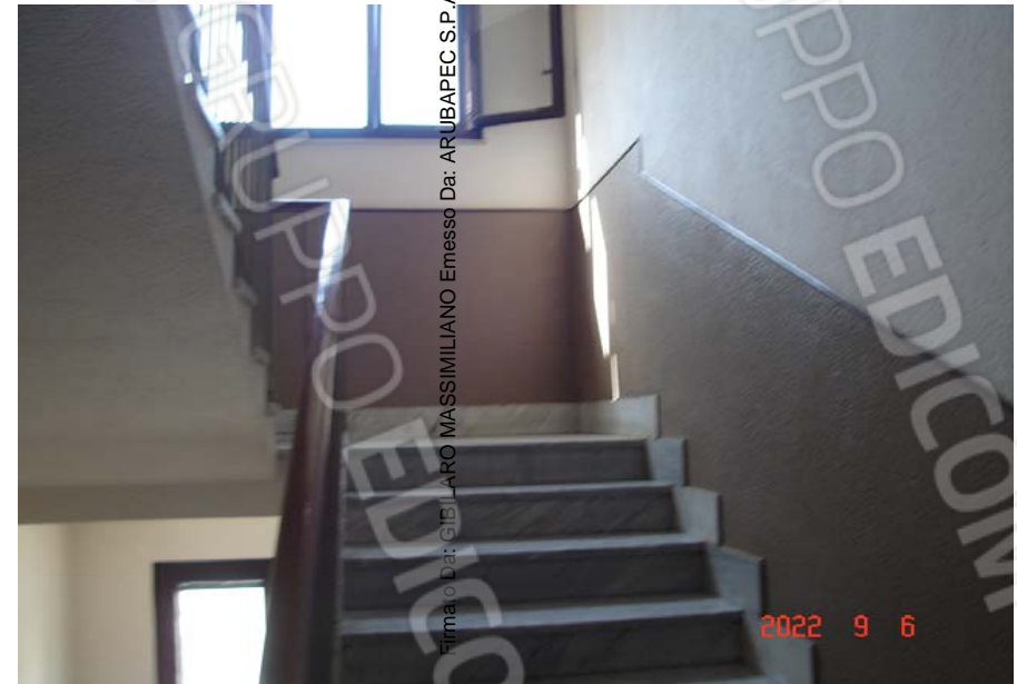
Scala di accesso

Firma: Da: CIELARO MASSIMILIANO Emesso Da: ARUBAPEC S.P.A. NG CA 3 Serial#: 3d284849a46d56076a3a2b75ed76f8