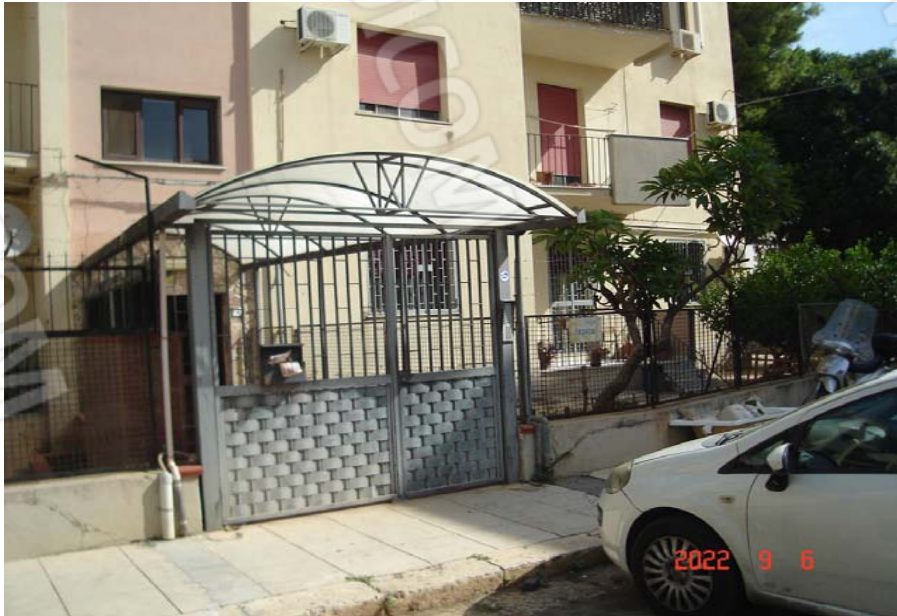
Vista esterna edificio

PIENA ED INTERA PROPRIETÀ DI APPARTAMENTO SITO IN PALERMO, LARGO ISPICA N. 3, PIANO PRIMO, A SINISTRA SALENDO LE SCALE; CENSITO AL C.F. AL FG. 38, P.LLA 2182 SUB. 4