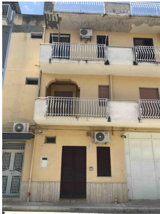
immagine n. 3 prospetto principale della palazzina con i tre ingressi

QUESITO 2: elencare ed individuare i beni componenti ciascun lotto e procedere alla descrizione materiale