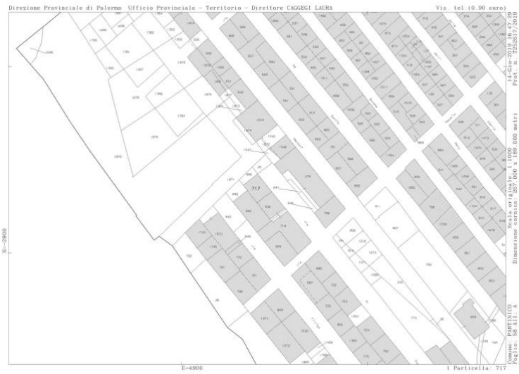
immagine n. 2 mappale castale con indicazione della p.IIa