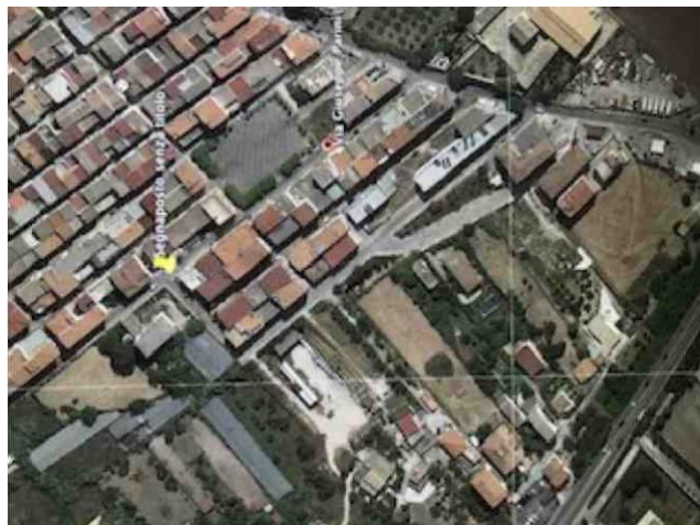
immagine n. 1 aerofoto di via Giuseppe Parini a Partinico

La proprietà confina nel suo intero con la via G. Parini a Nord, con la via Nazario Sauro ad Est, con proprietà la via Filippo Turati a Sud e con proprietà aliena ad Ovest.