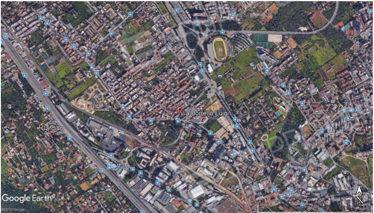
Zona della città in cui ricade l'immobile oggetto di valutazione