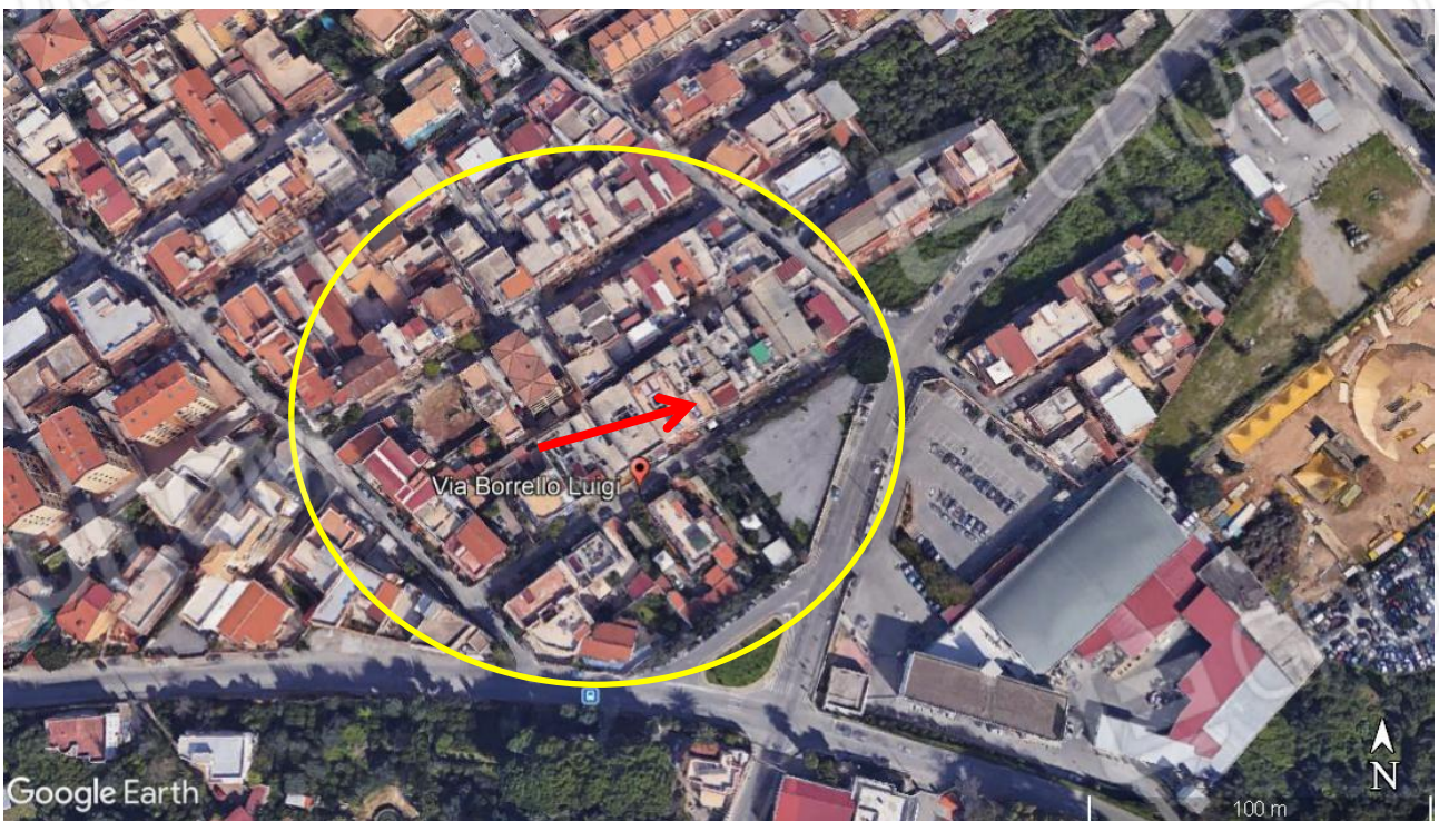
Quartiere della città in cui ricade l'immobile oggetto di valutazione