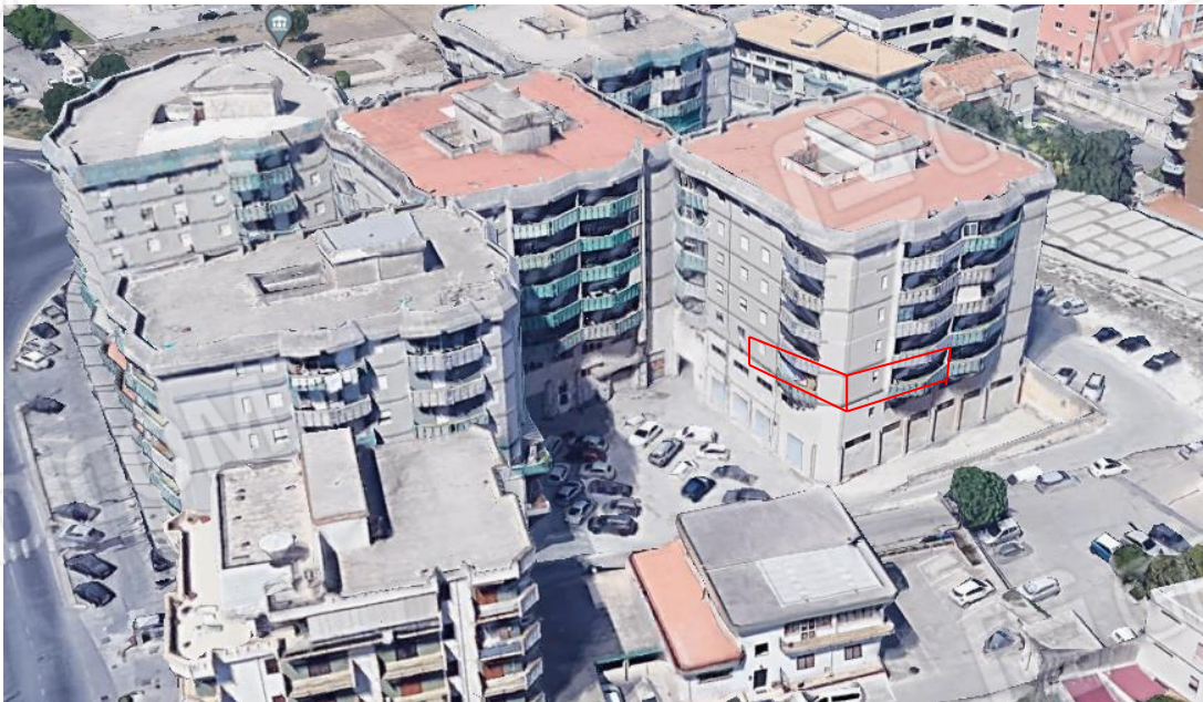
Foto_02 individuazione dell'unità immobiliare al piano primo- pal.E