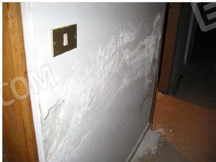
DETTAGLIO ZONE UMIDITA' CORRIDOIO