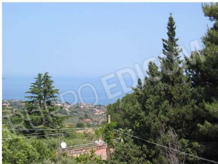
VISTA MARE DAL TERRAZZO