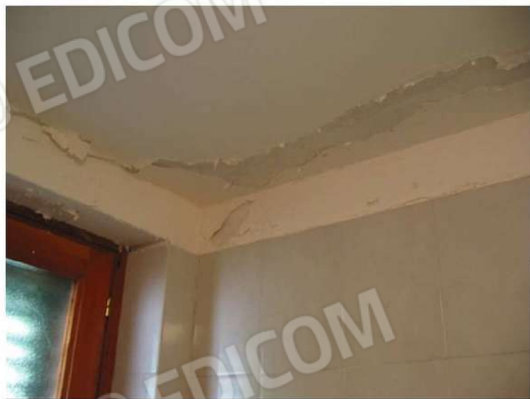
DETTAGLIO ZONE UMIDITA'