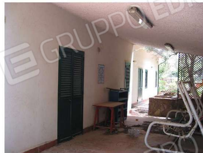
PROSPETTO SUD CON ZONA PORTICATO E SCALA ACCESSO TERRAZZO