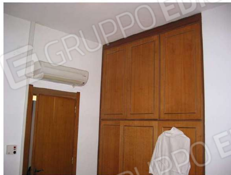
PARETE - ARMADIO