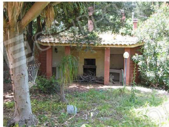
VISTA ZONA FORNO E CUCINA - LATO OVEST