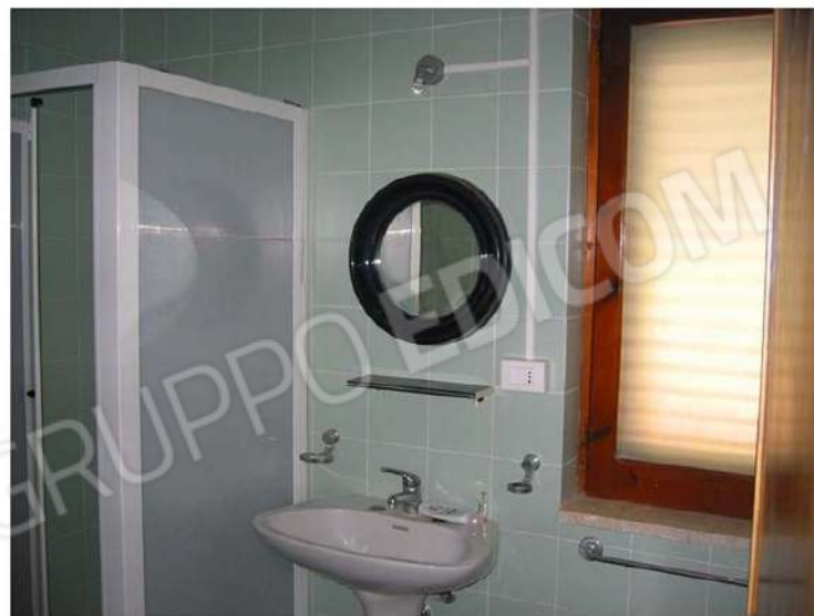
WC - DOCCIA