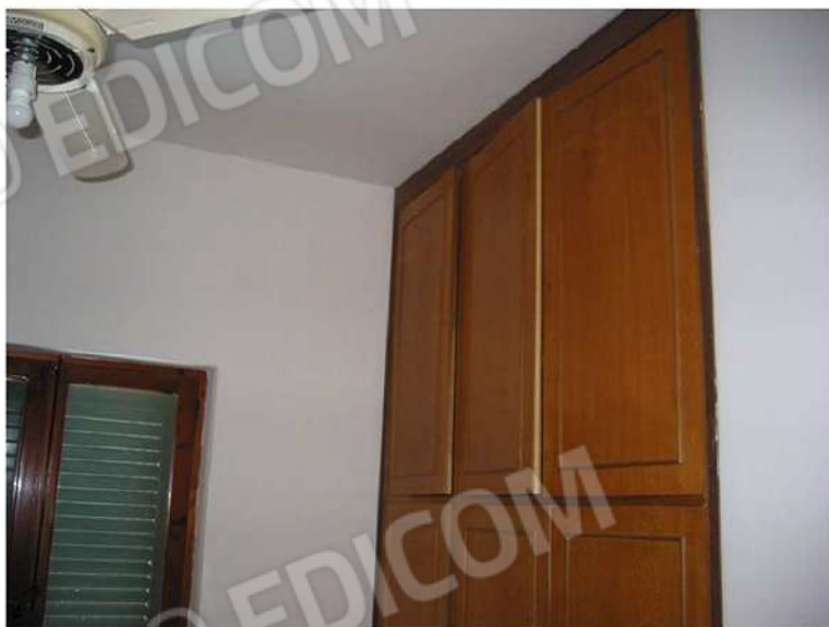
PARETE - ARMADIO