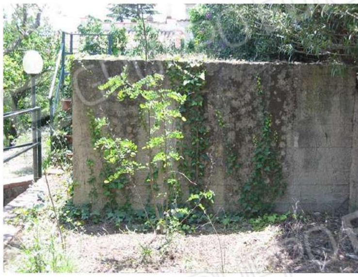
VASCA IDRICA DA DEMOLIRE