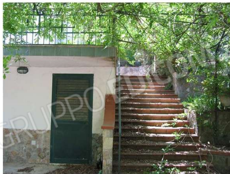
SCALINATA ZONA INGRESSO IN DIREZIONE P.T.