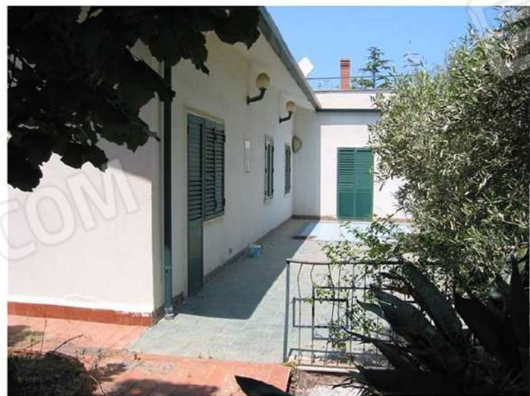
SCORCIO PROSPETTO NORD E AREA ESTERNA