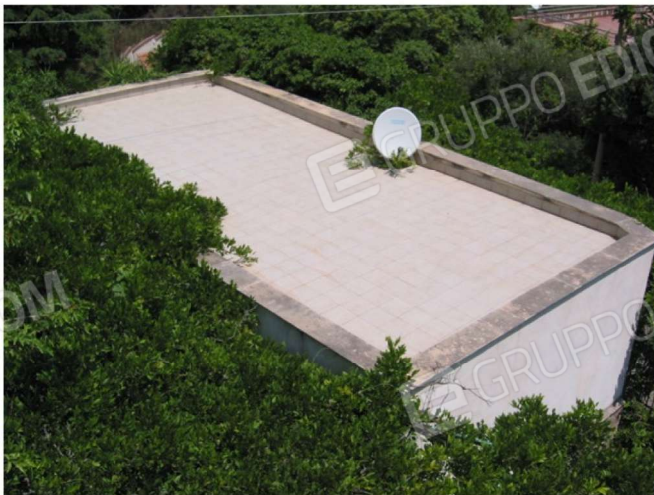
VISTA D'INSIEME - SUB 2 - DALLA TERRAZZA SUB 8