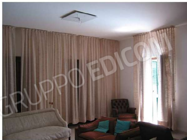
VISTA DIREZIONE TERRAZZO