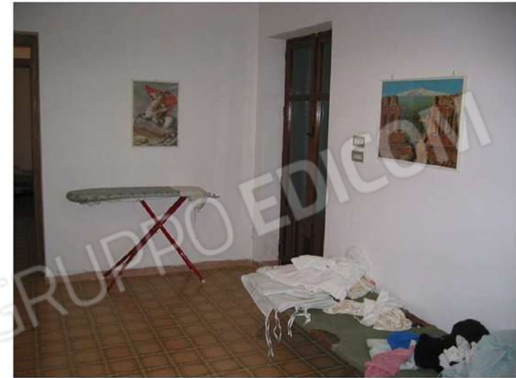
AMBIENTE DISIMPEGNO CON USCITA SUL PROSPETTO SUD