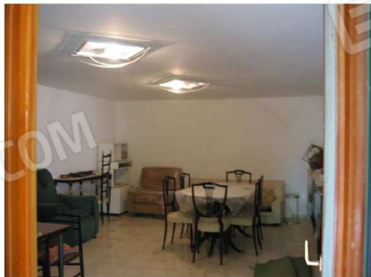
SEMINTERRATO SUB 9 - ZONA SOGG- PRANZO