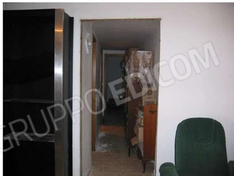
VISTA VERSO AMBIENTI