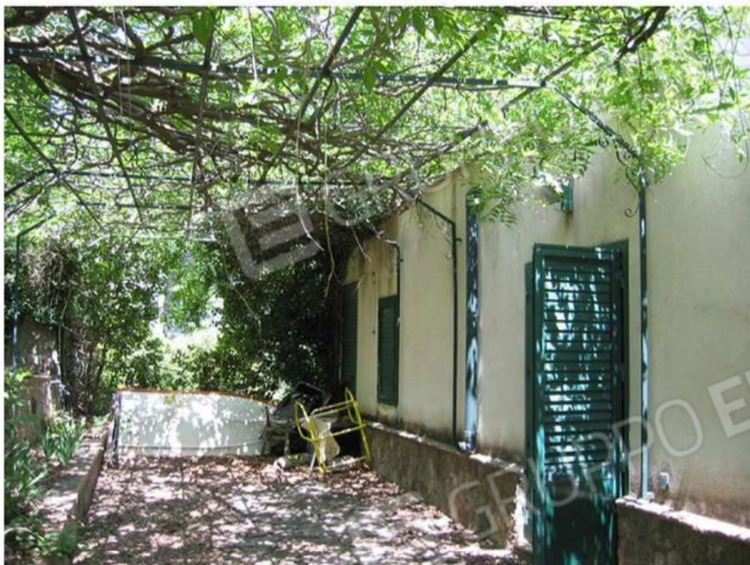
PROSPETTO LATO SUD - SUB 2