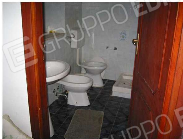
WC - DOCCIA