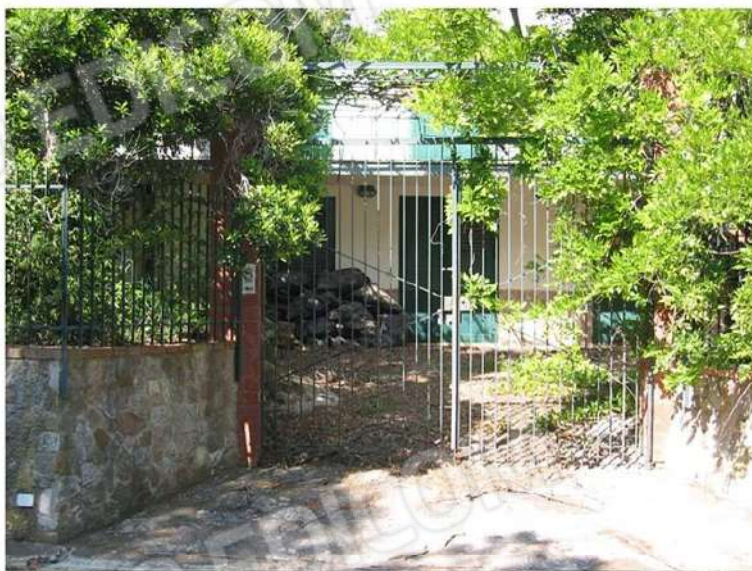
ZONA AREA INGRESSO