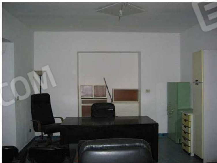
ZONA GIORNO - SUB 2