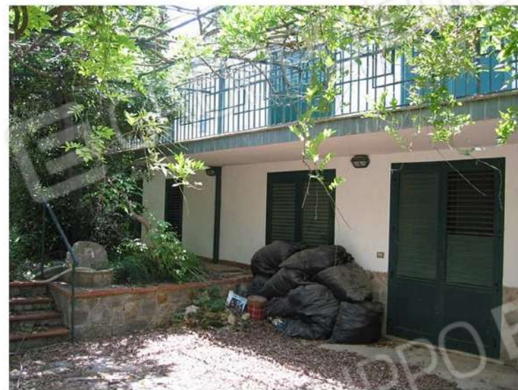
PIANO SEMINTERRATO E P.T.