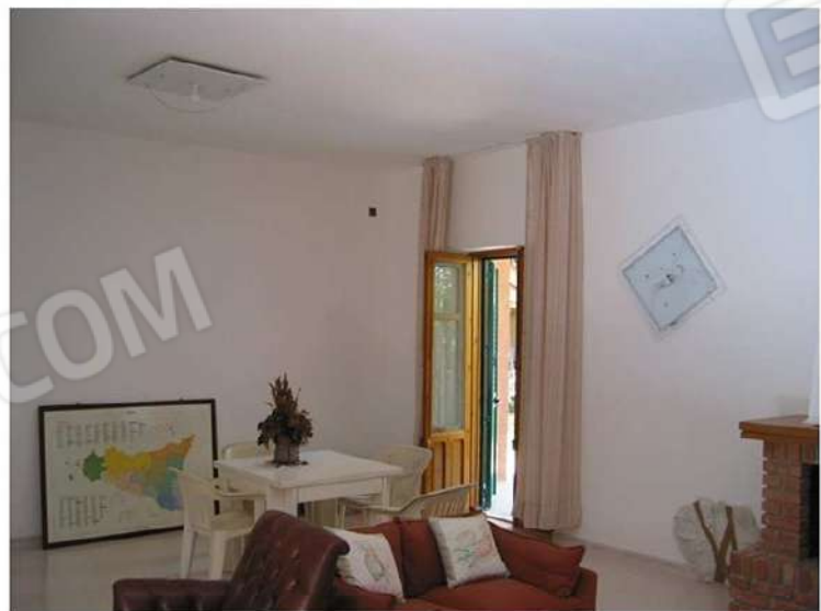
INGRESSO ZONA - GIORNO