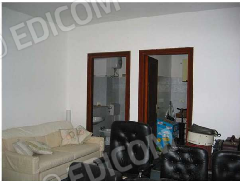
VISTA IN DIREZIONE SERVIZI