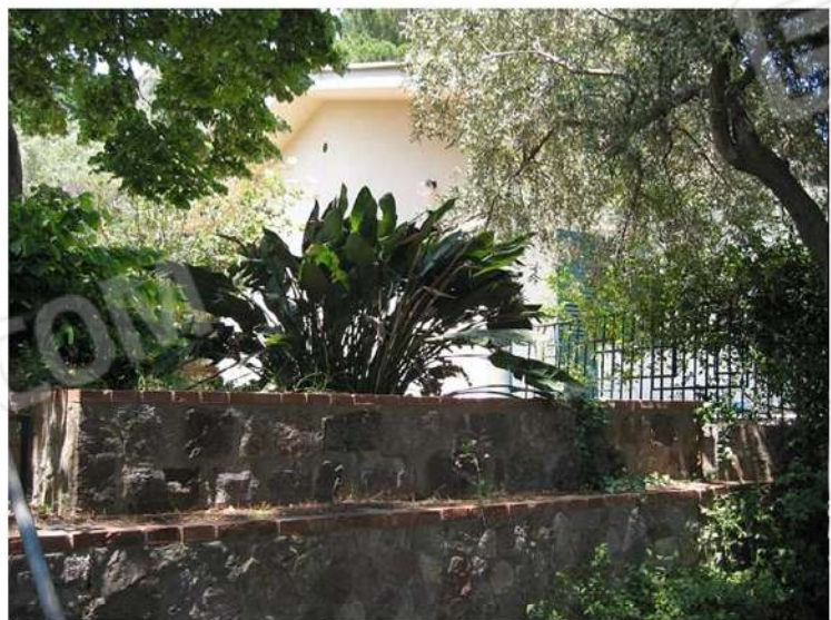
ZONA VERDE CON TERRAZZAMENTI