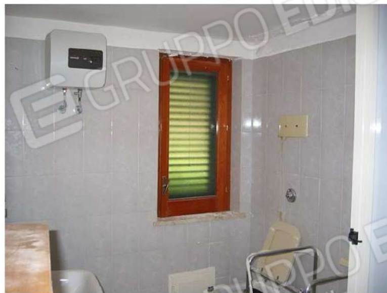
WC - DOCCIA