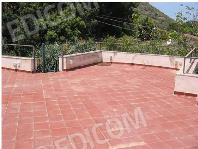
COPERTURA A TERRAZZO