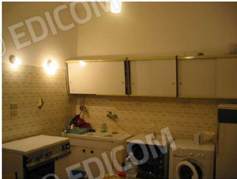
ANGOLO CUCINA - PRANZO