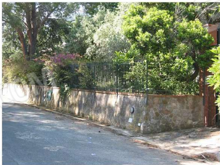
SCORCIO LOTTO ESTERNO