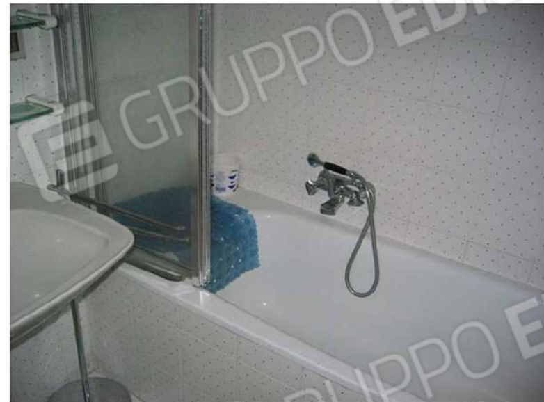
WC - BAGNO