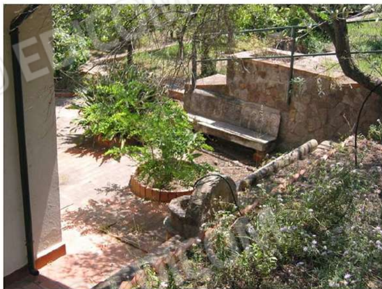
ZONA RELAX LATO PROSPETTO EST