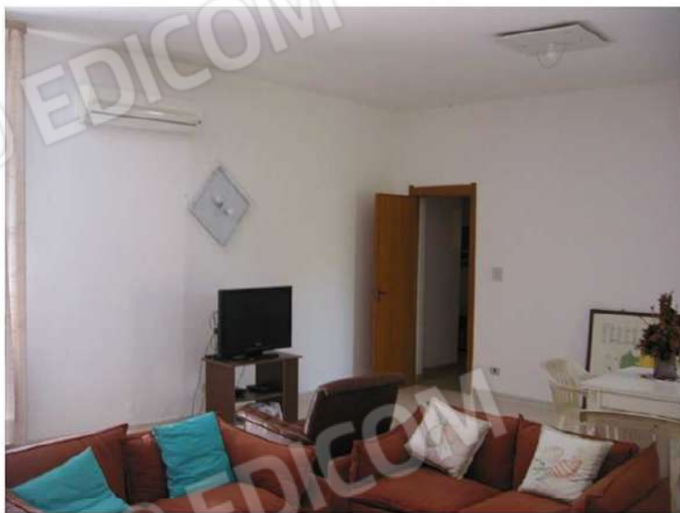
VISTA DIREZIONE AMBIENTI