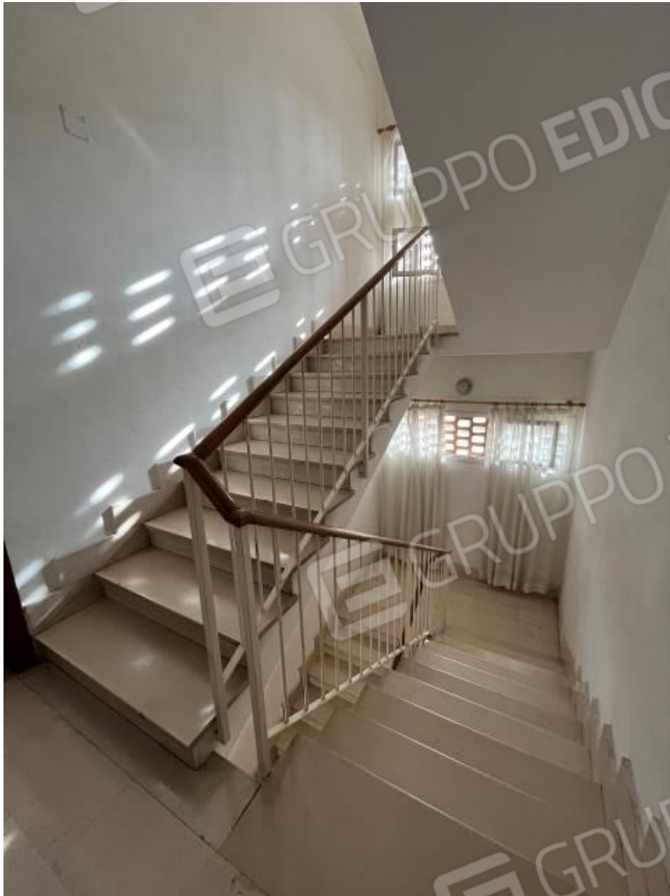
Figura 3: Vista interna, scale condominiali