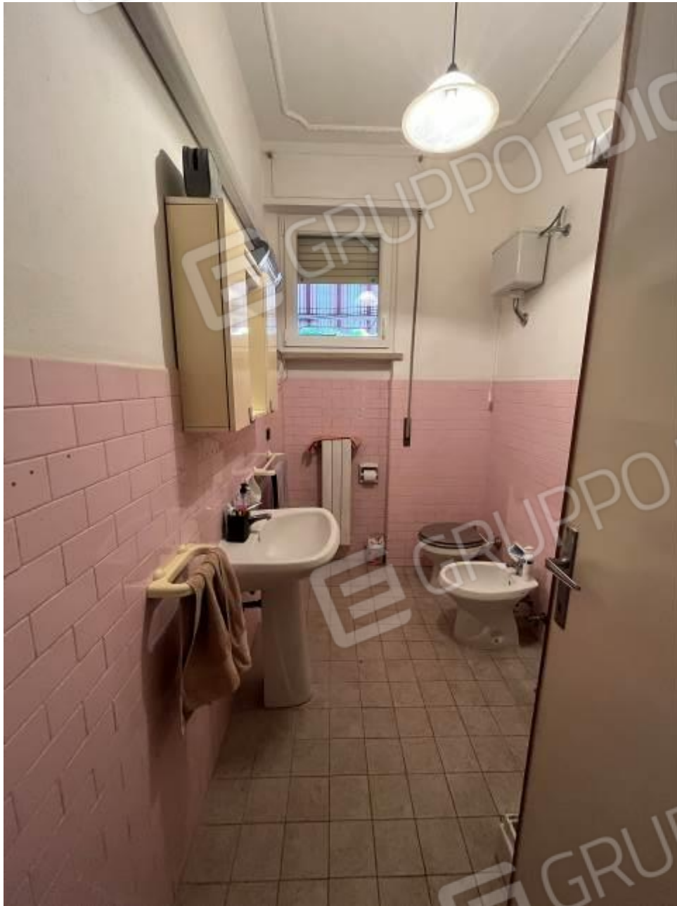
Figura 13: Vista interna, bagno