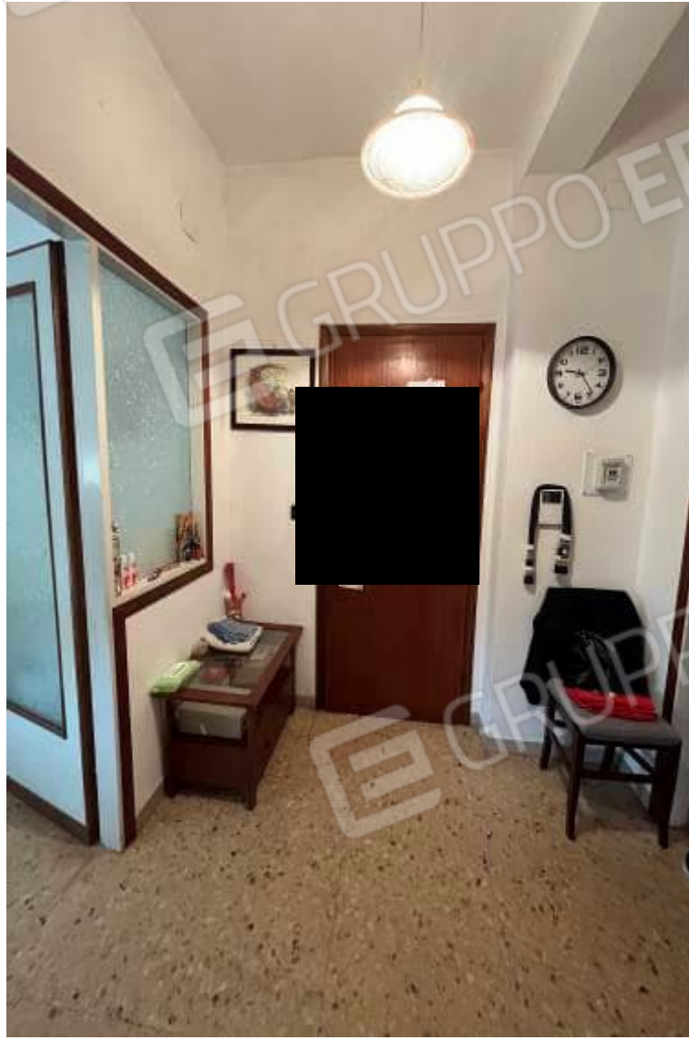
Figura 5: Vista interna, ingresso