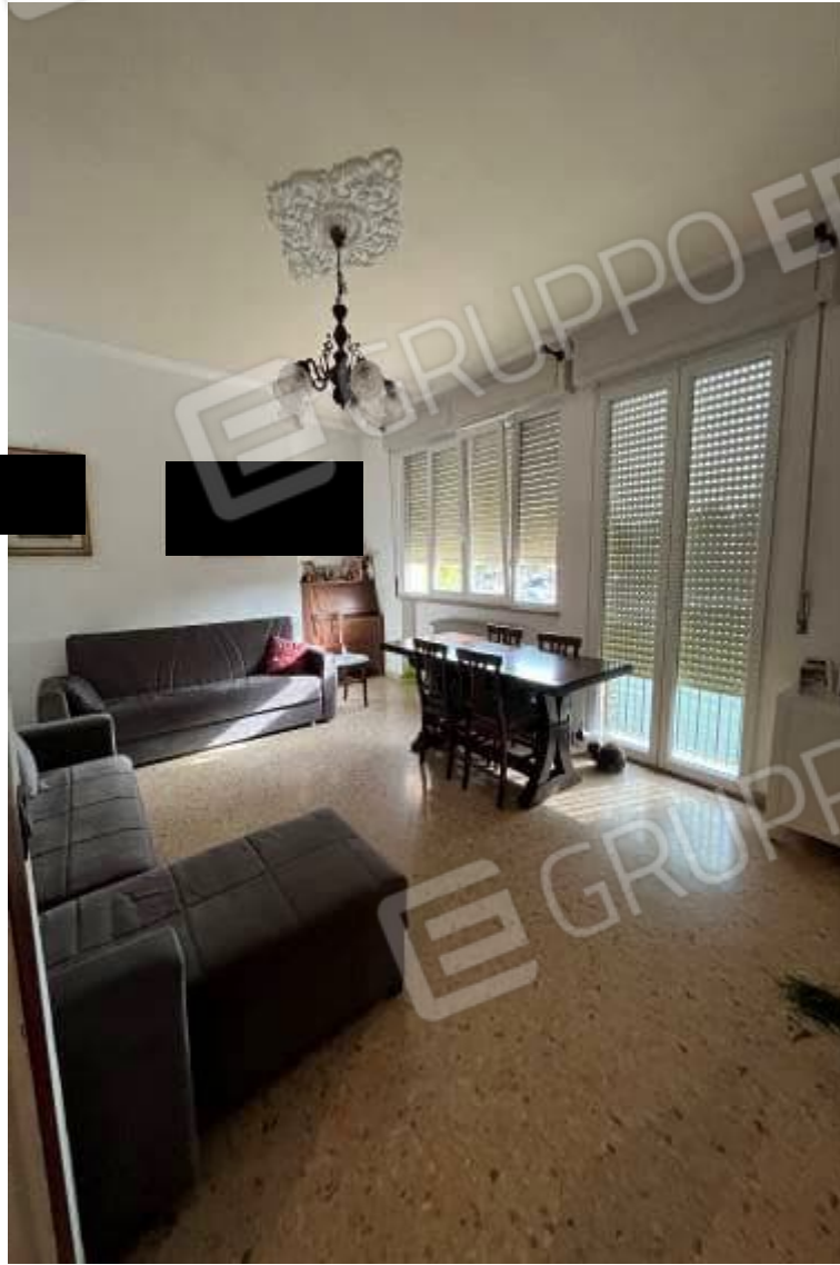
Figura 6: vista interna, sala