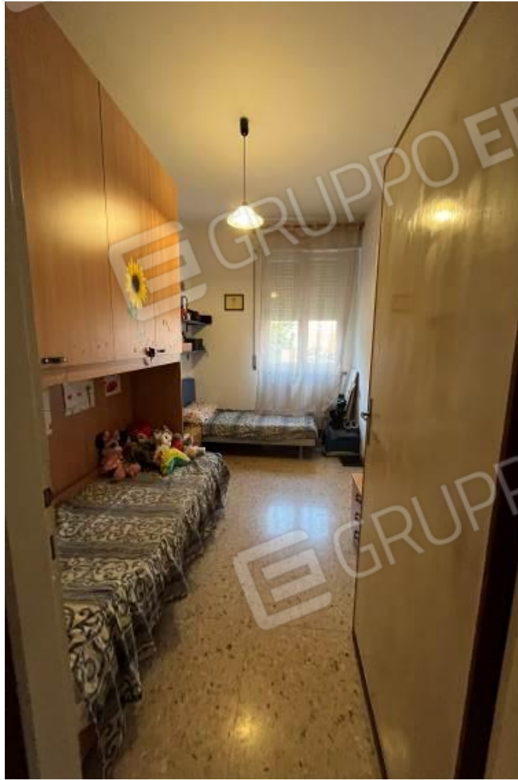
Figura 12: Vista interna, camera