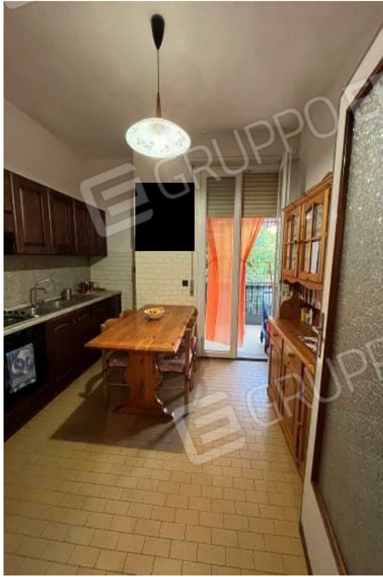
Figura 7: Vista interna, cucina