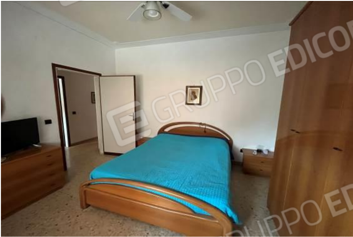
Figura 10: Vista interna, camera