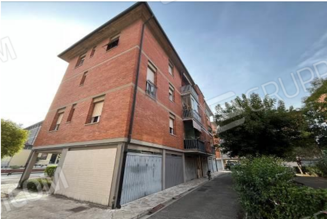
Figura 2: Vista esterna, garage