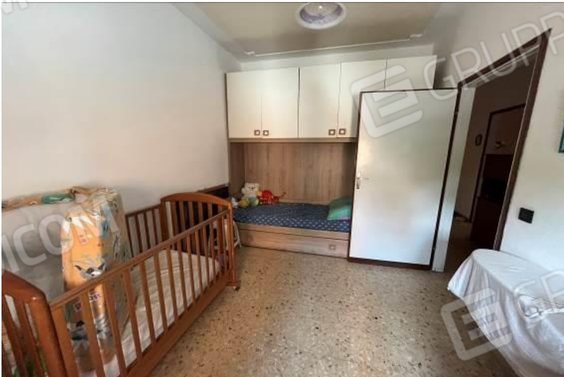
Figura 11: Vista interna, camera