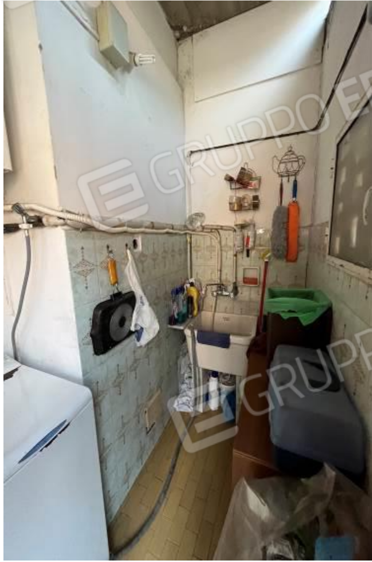
Figura 8: Vista interna, terrazza