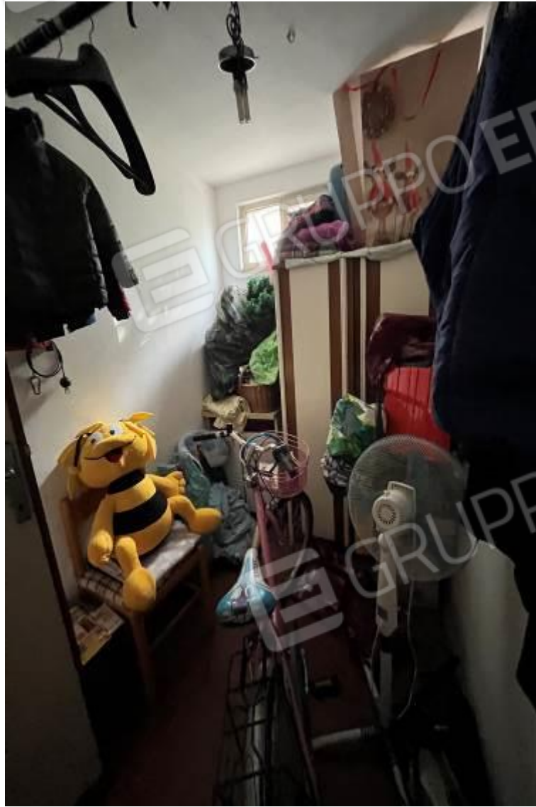
Figura 4: Vista interna, ripostiglio a piano terra