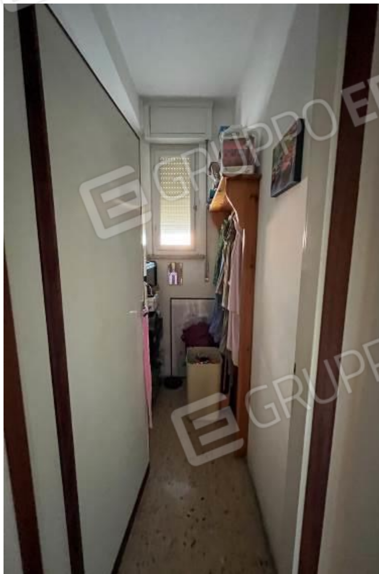
Figura 14: Vista interna, ripostiglio