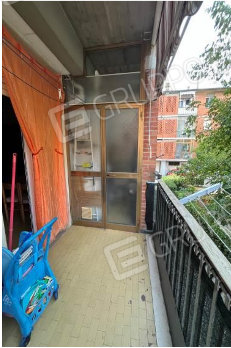
Figura 9: Vista interna, terrazza