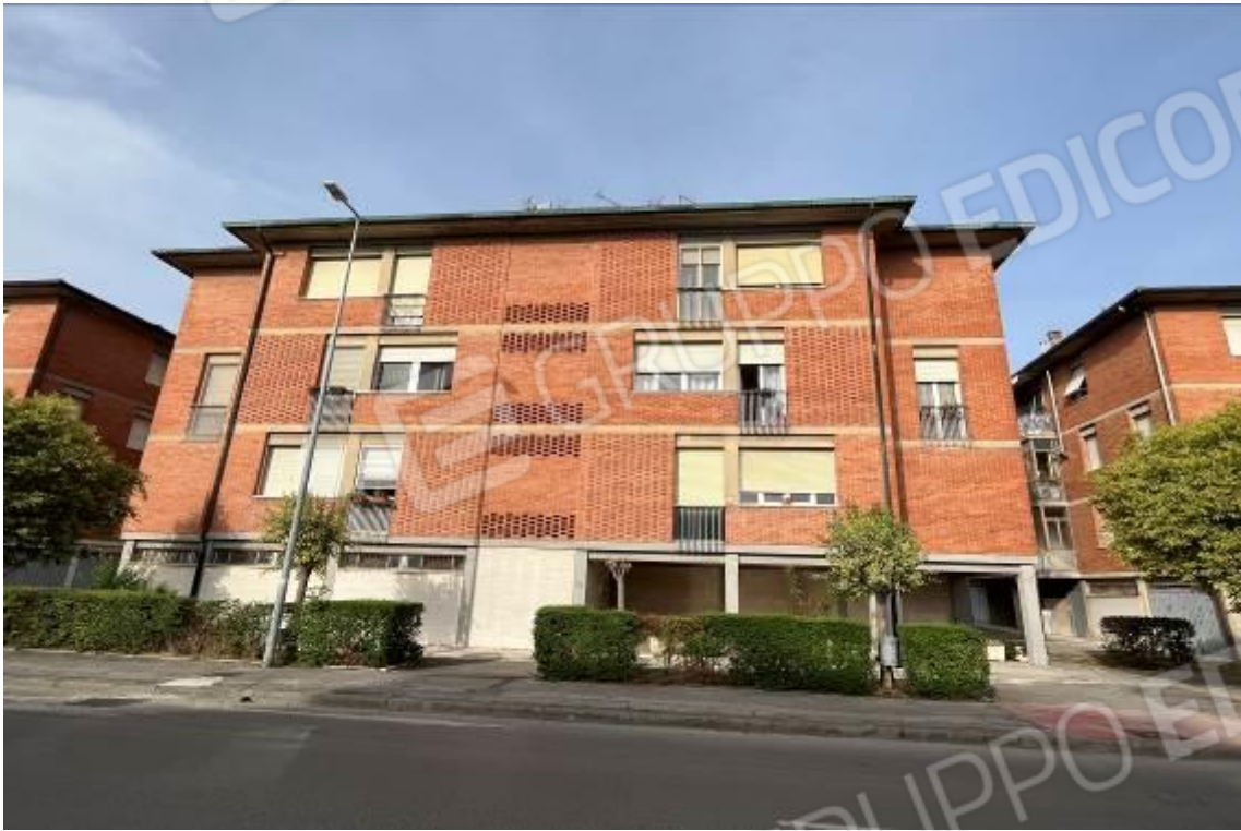
Figura 1: Vista esterna, condominio