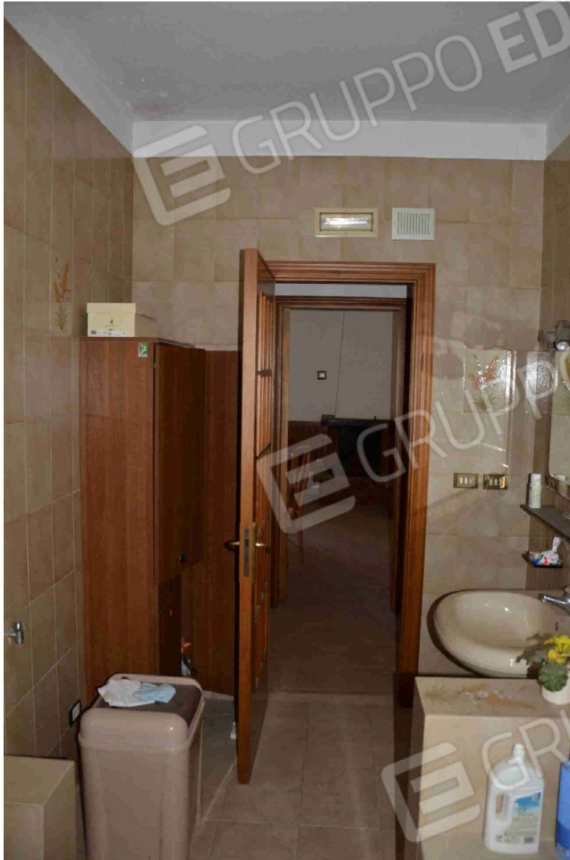
Figura 15 - Bagno (altra angolazione)