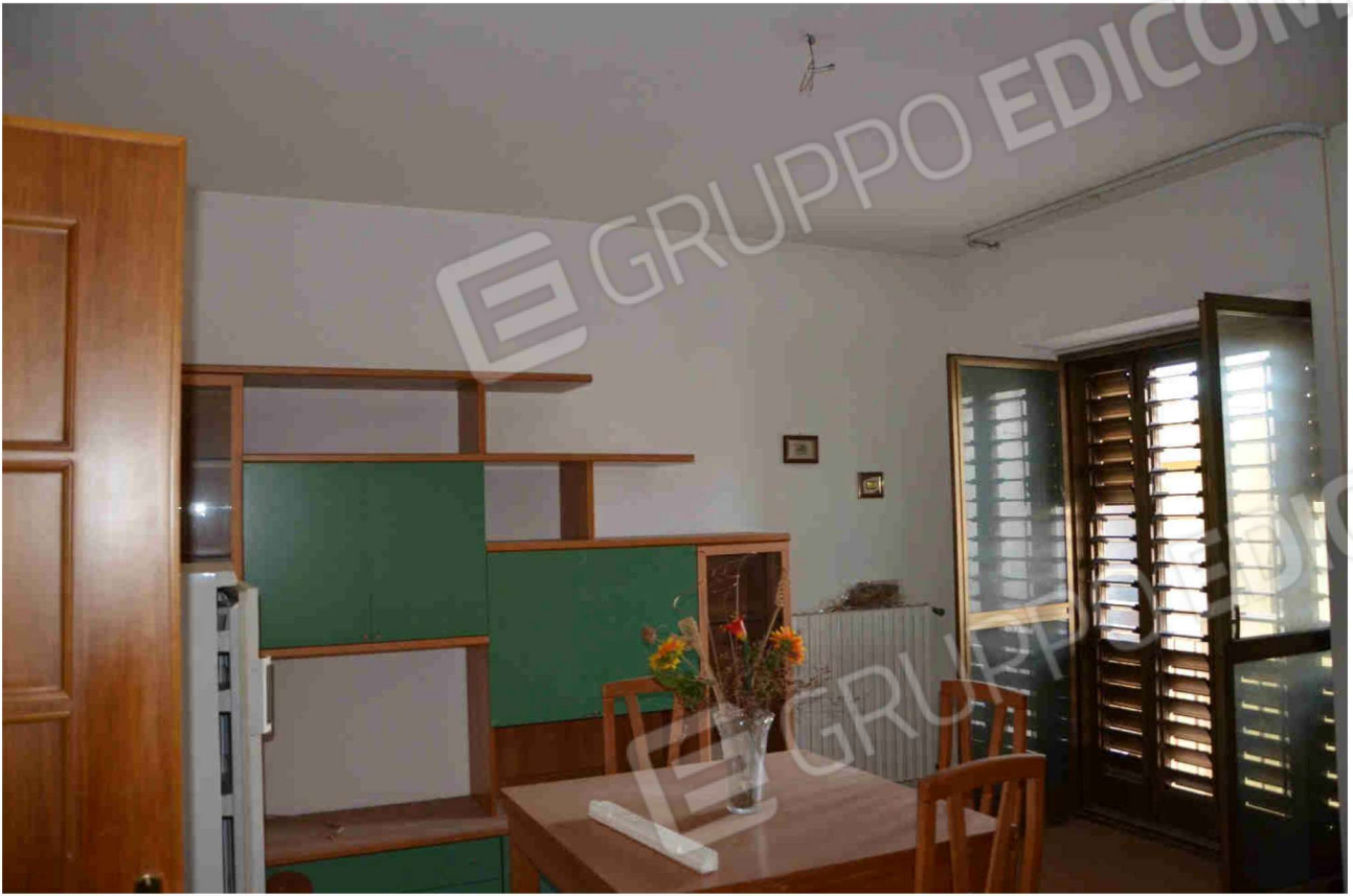
Figura 17 - sala pranzo (altra angolazione)