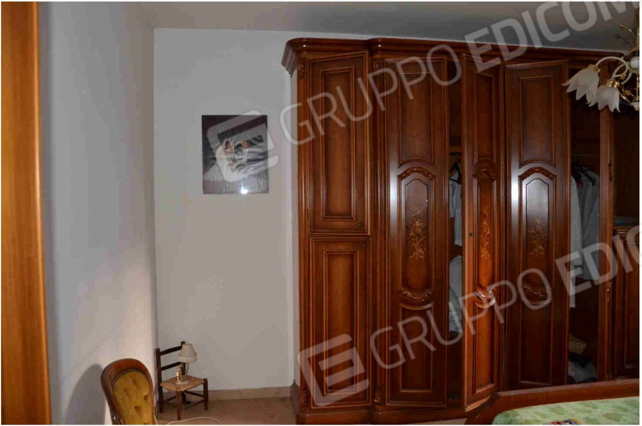
Figura 22 - Camera da letto (altra angolazione)