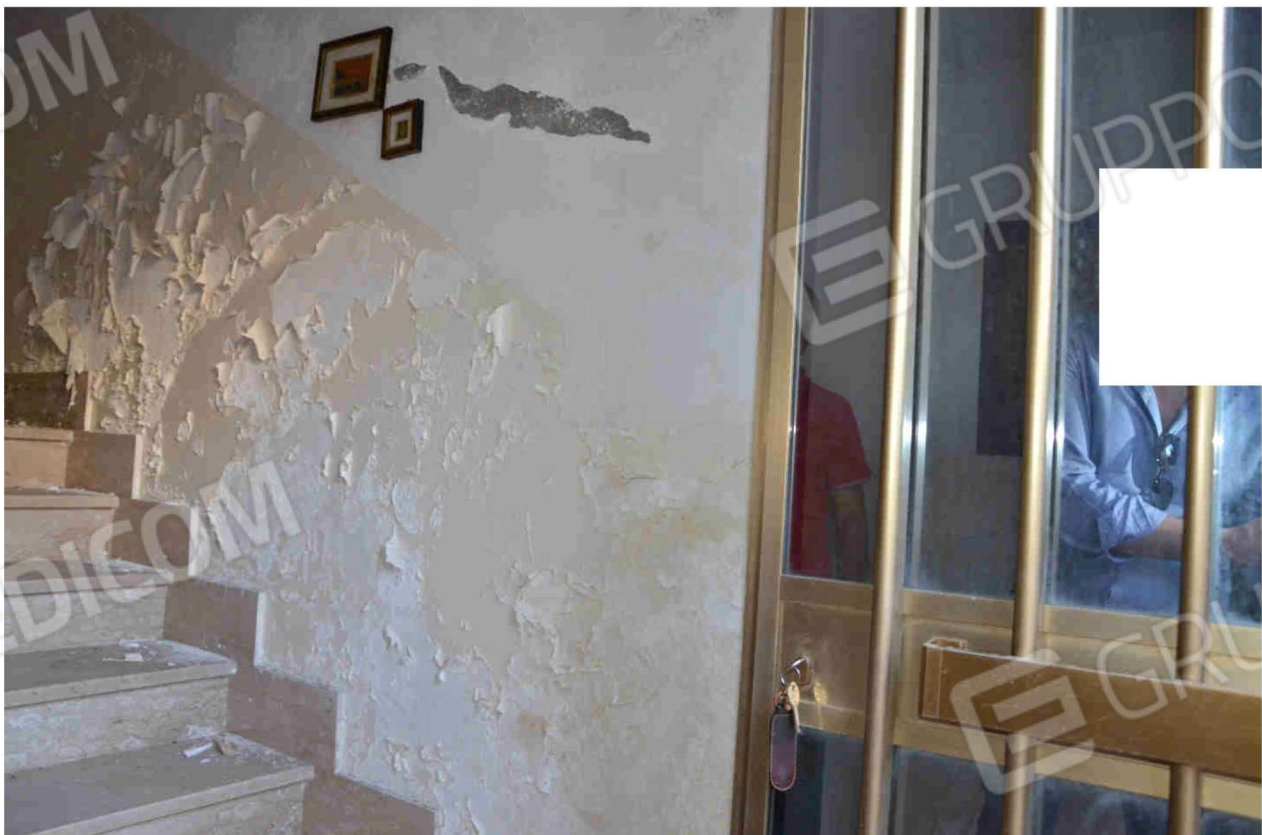
Figura 5 – accesso vano scala