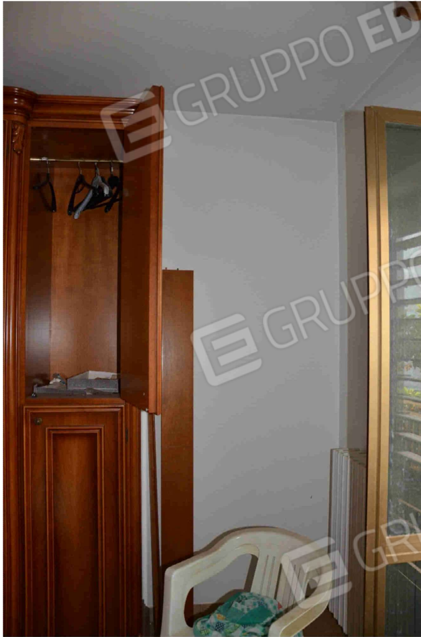
Figura 21 - Camera da letto (altra angolazione)