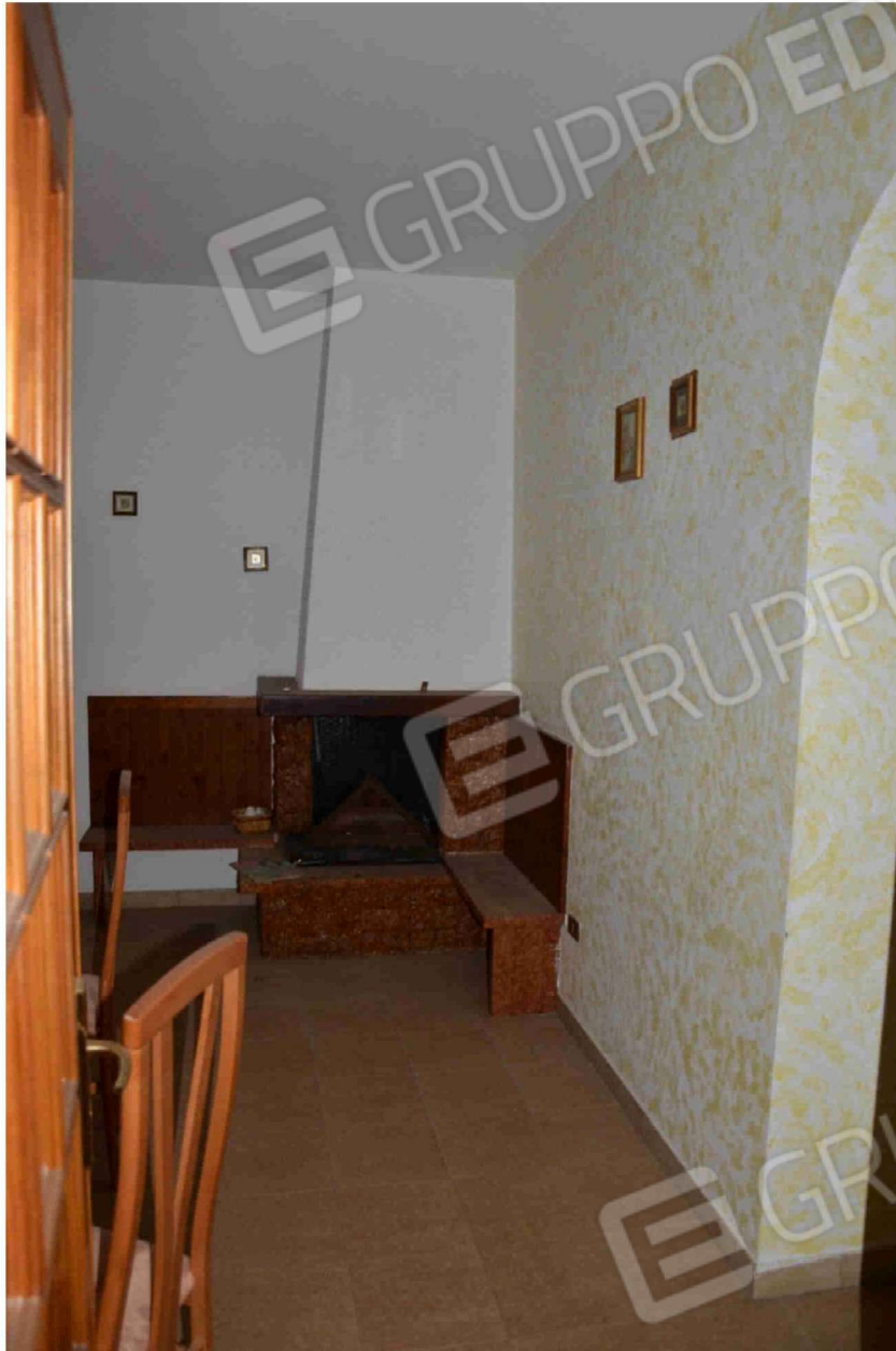
Figura 16 - sala pranzo