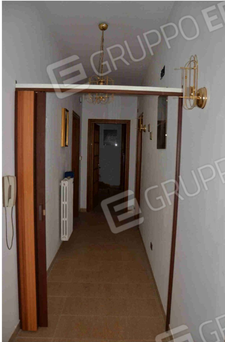
Figura 11 - disimpegno