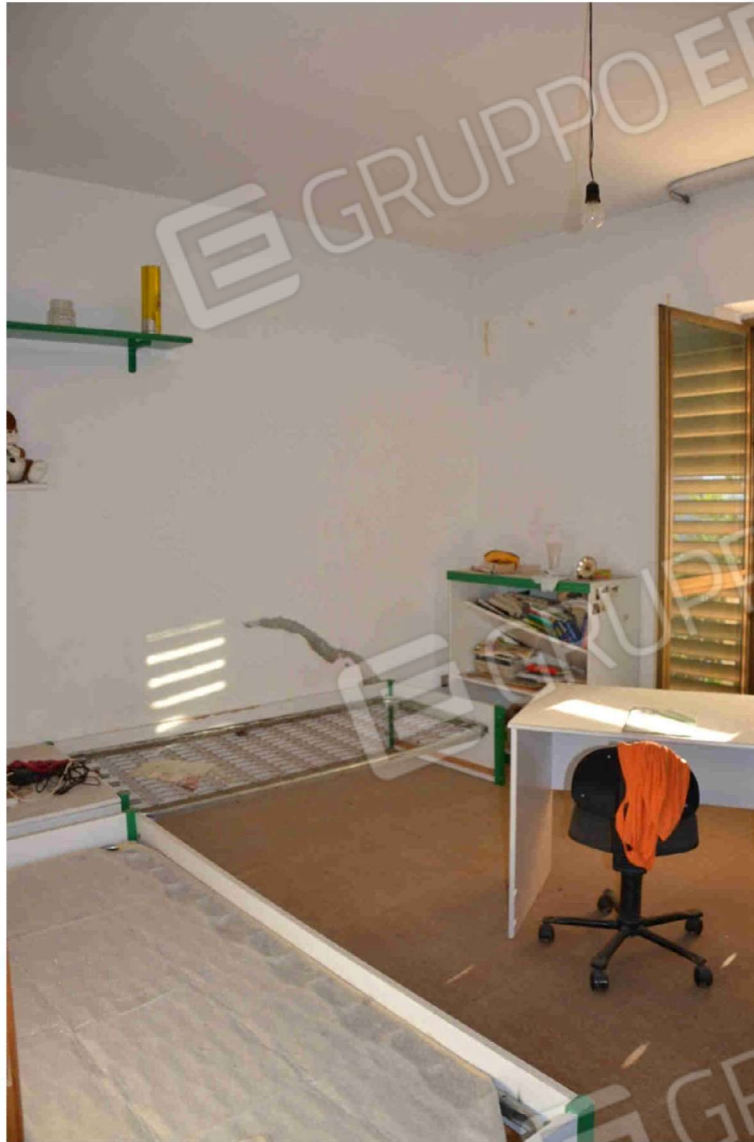
Figura 12 - camera ragazzi