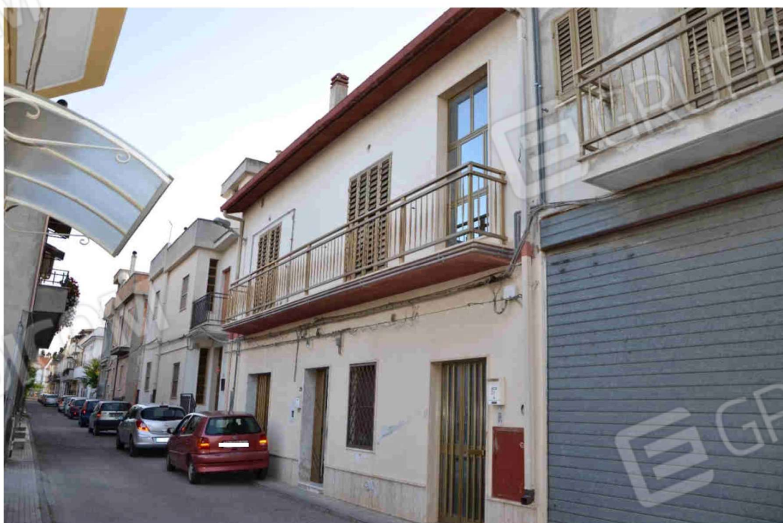
Figura 2 - Prospetto anteriore su via Chiarella (altra angolazione)