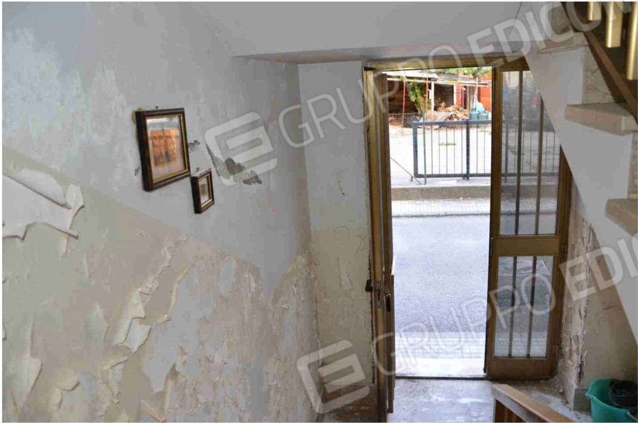
Figura 8 - Scala di accesso al piano primo (I rampa)