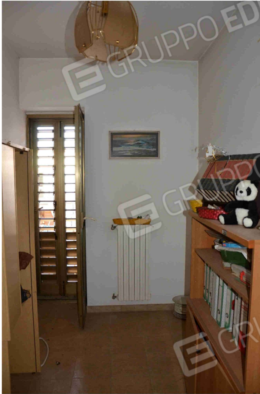
Figura - Camera