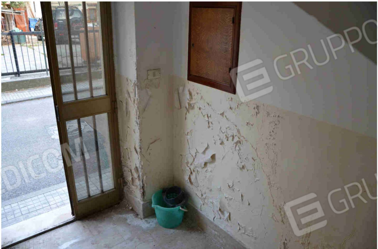
Figura 7 - accesso vano scala (altra vista)