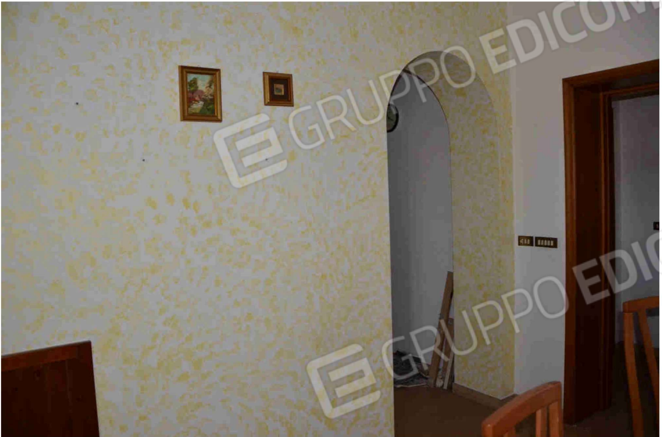
Figura 19 - sala pranzo (altra angolazione)