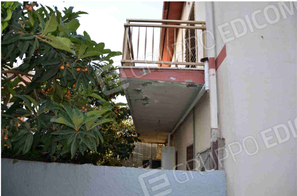
Figura 4 – vista prospetto posteriore