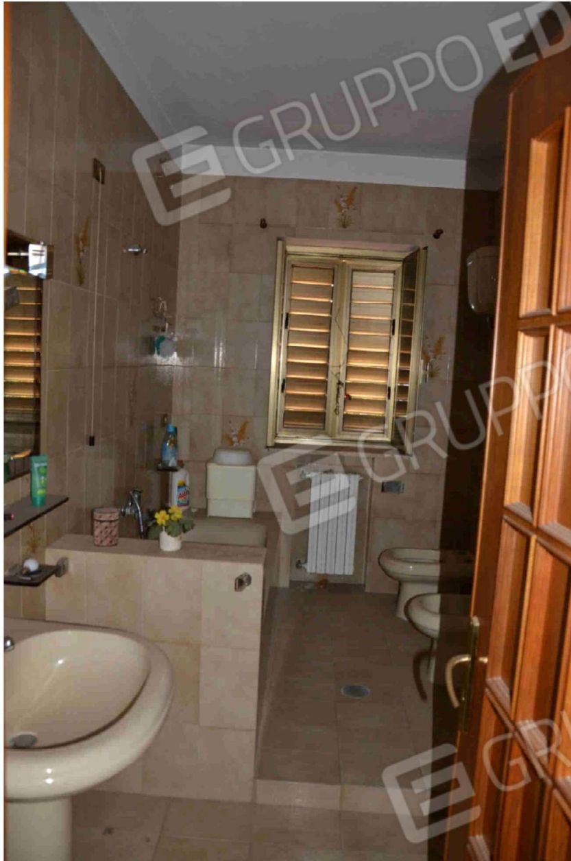
Figura 14 - Bagno