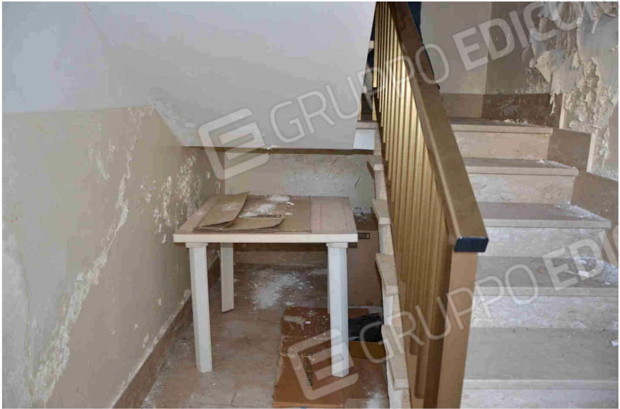
Figura 6 - accesso vano scala (altra vista)