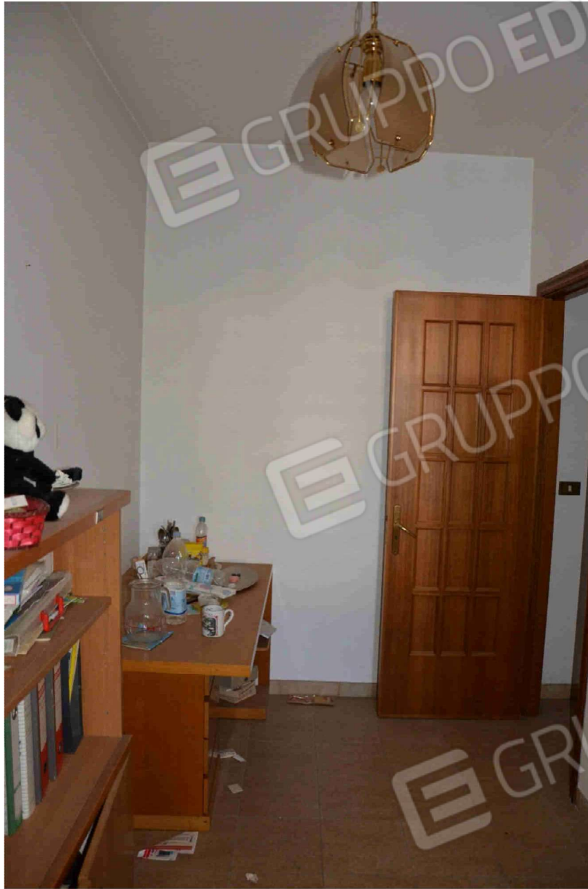
Figura 25 - Camera (altra angolazione)