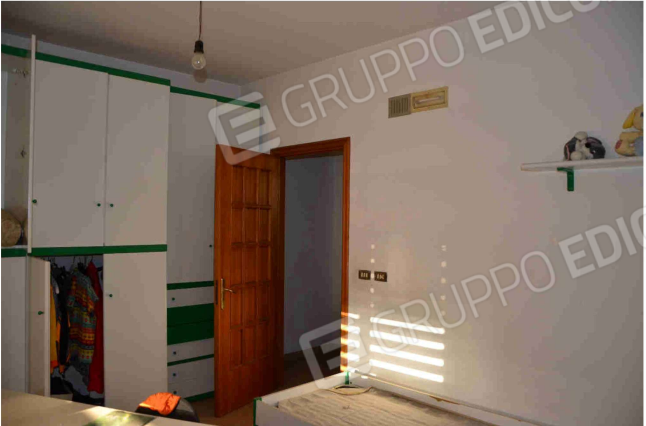
Figura 13 - camera ragazzi (altra angolazione)