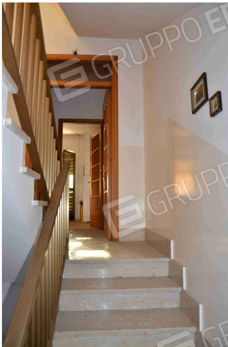
Figura 10 – Scala di accesso al piano primo (III rampa)