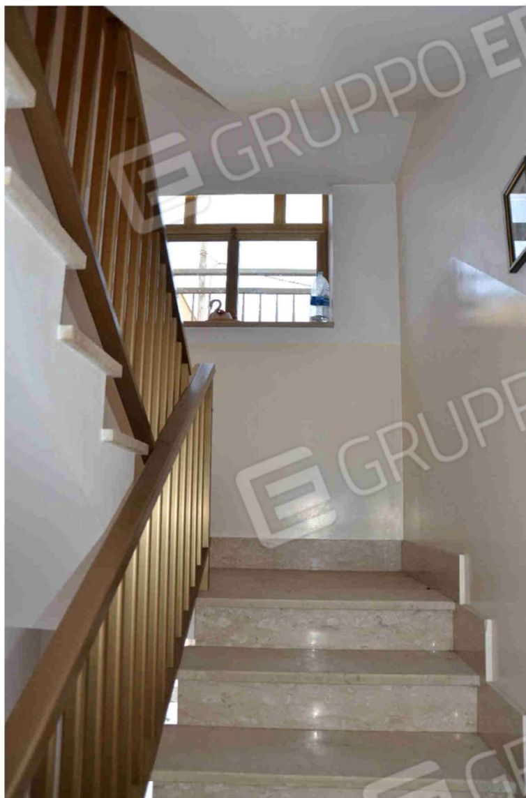
Figura 9 – Scala di accesso al piano primo (II rampa)