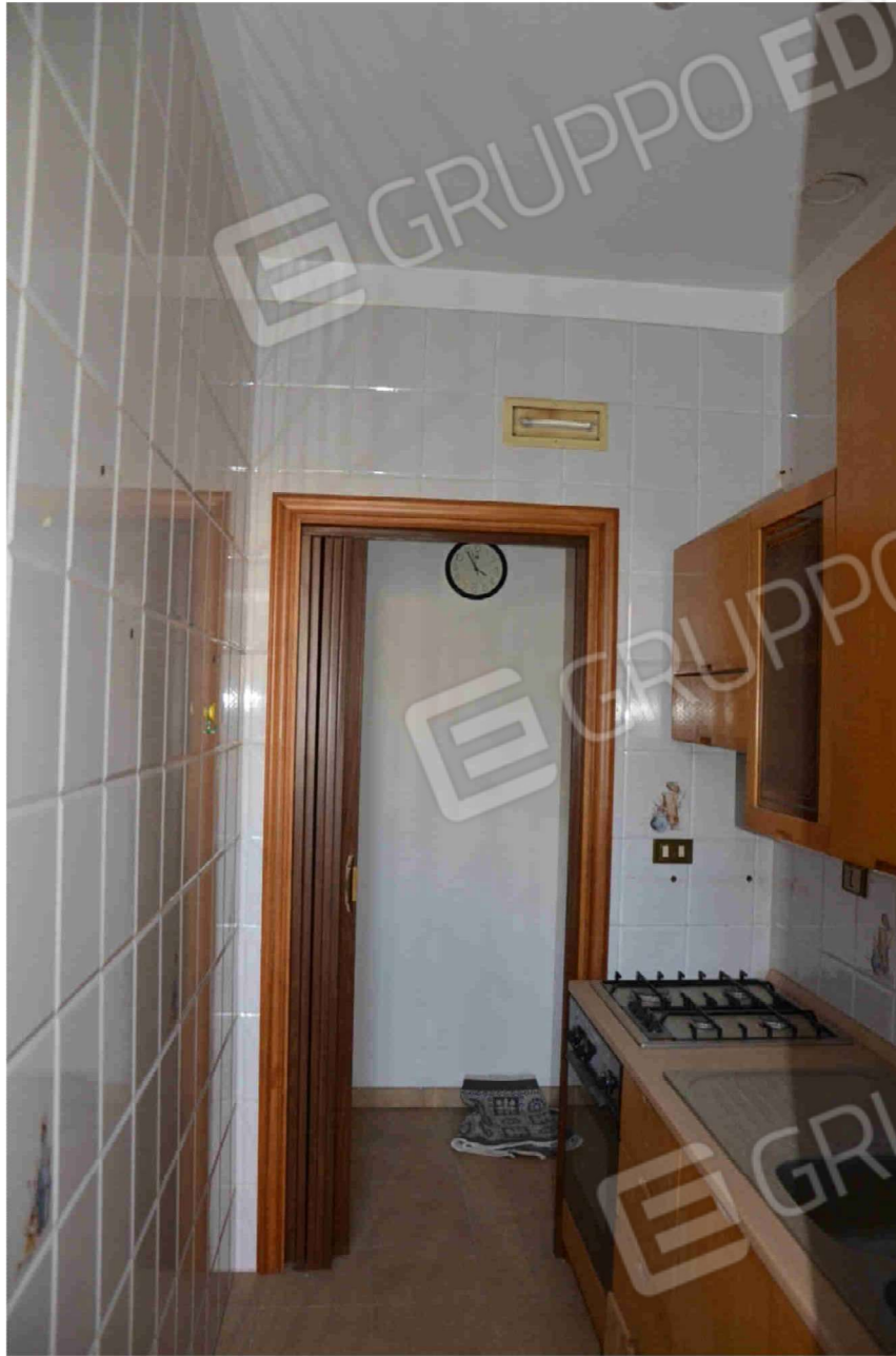
Figura 24 - Cucinino (altra angolazione)