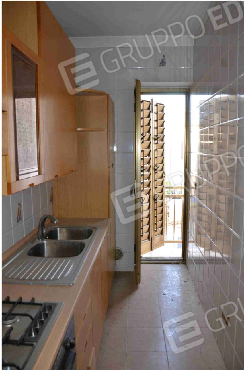
Figura 23 - Cucinino