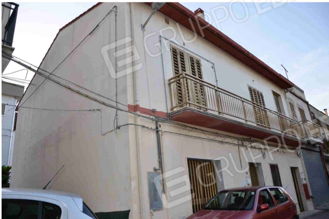
Figura 1 - Prospetto anteriore su via Chiarella