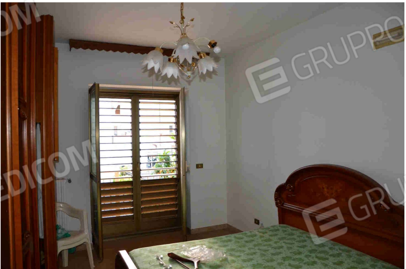
Figura 20 - Camera da letto