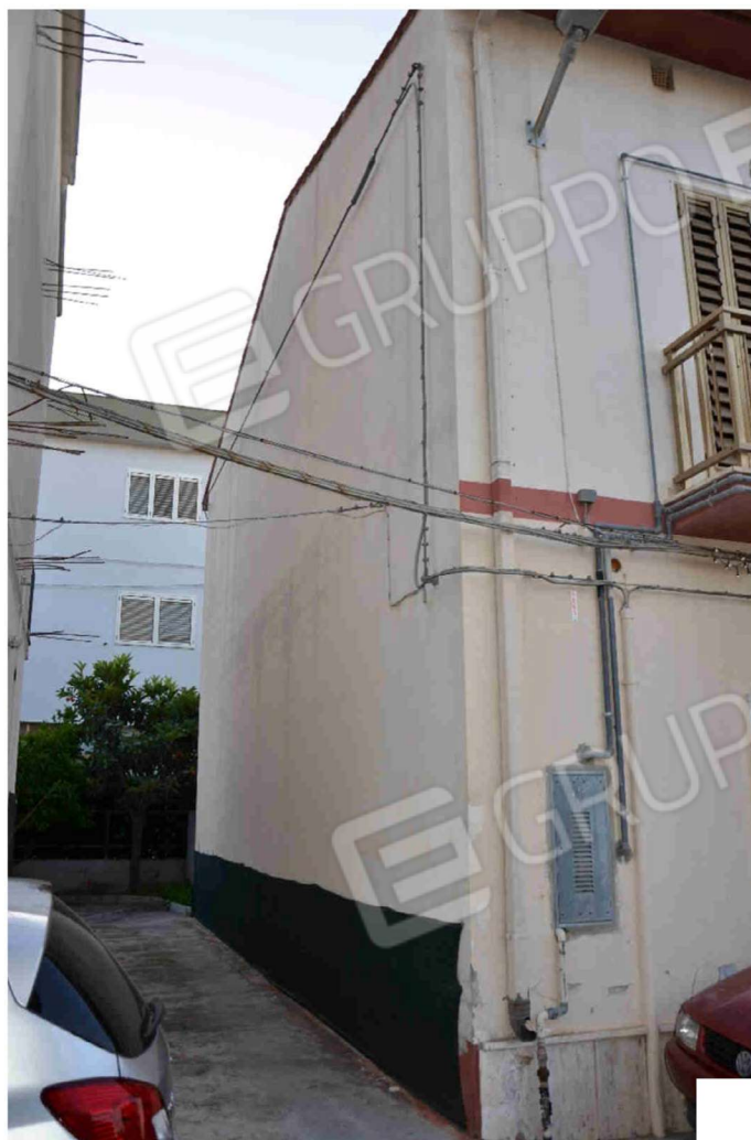
Figura 3 -- Prospetto laterale con accesso da via Chiarella