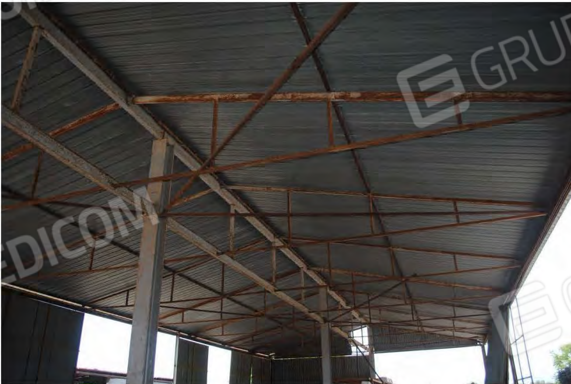
Corpo F: Particolare Tettoia-struttura in acciaio