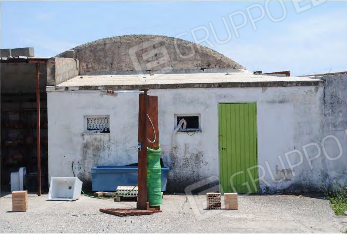
Corpo E: Vista esterna, interna al piazzale

All. A – Lotto 001 Corpo E : Fg 7 P.IIa 3388 sub 6