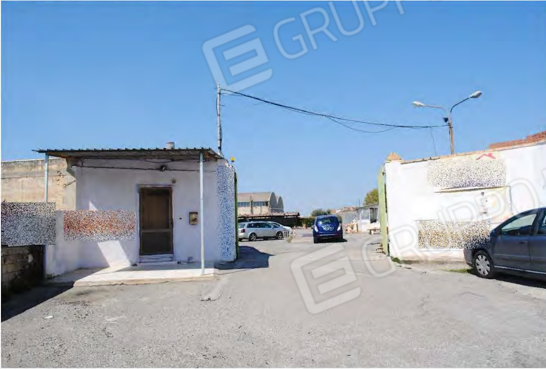
Vista esterna- ingresso al piazzale dalla bretella di Via Puglia