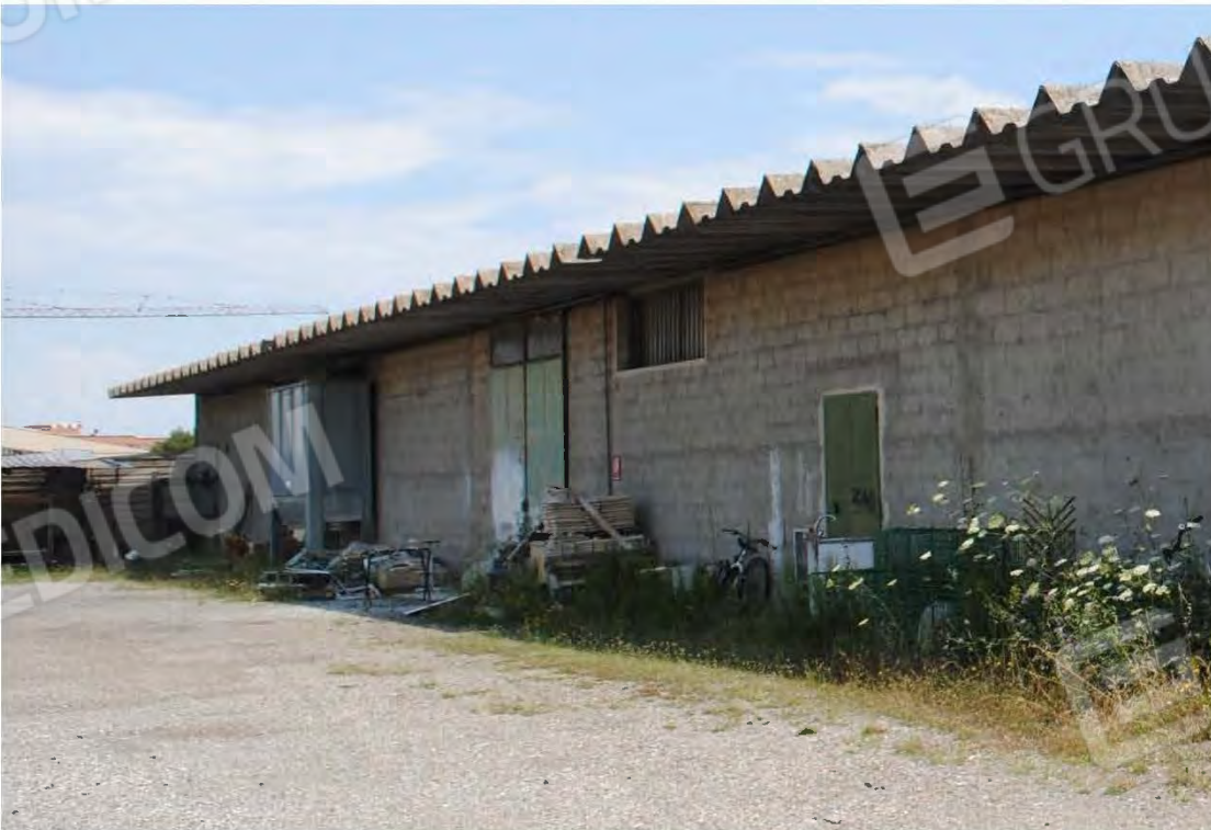
Corpo C: Vista esterna dal piazzale – Prospetto laterale sx