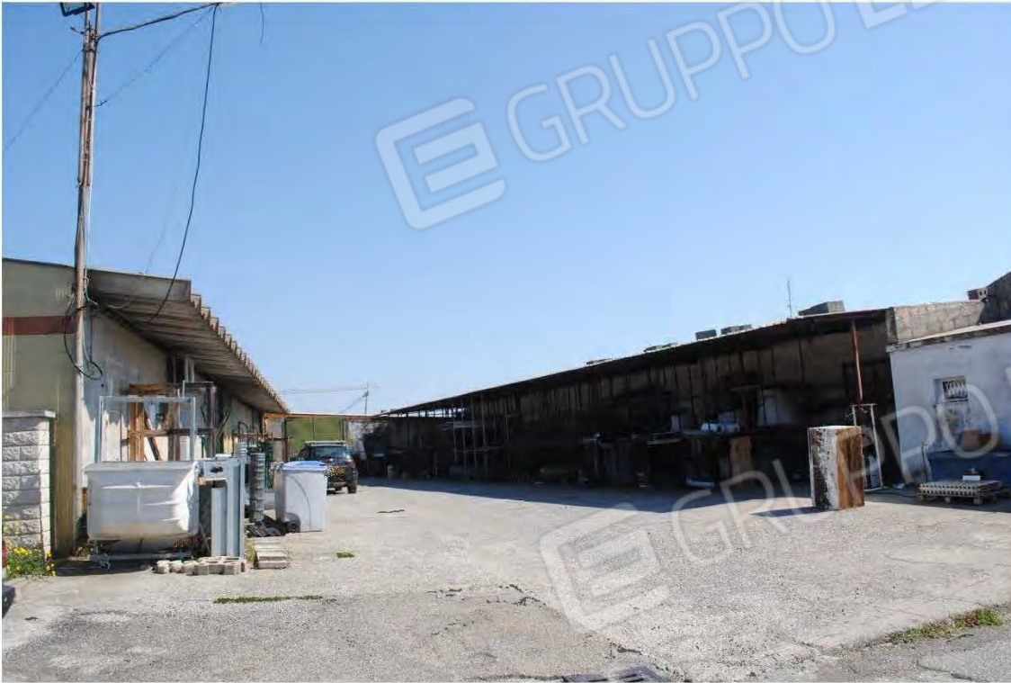
Corpo D: Vista esterna - Vista interna al piazzale-Corpi A,C,D,E

All. A – Lotto 001 Corpo D : Fg 7 P.IIa 3388 sub 5