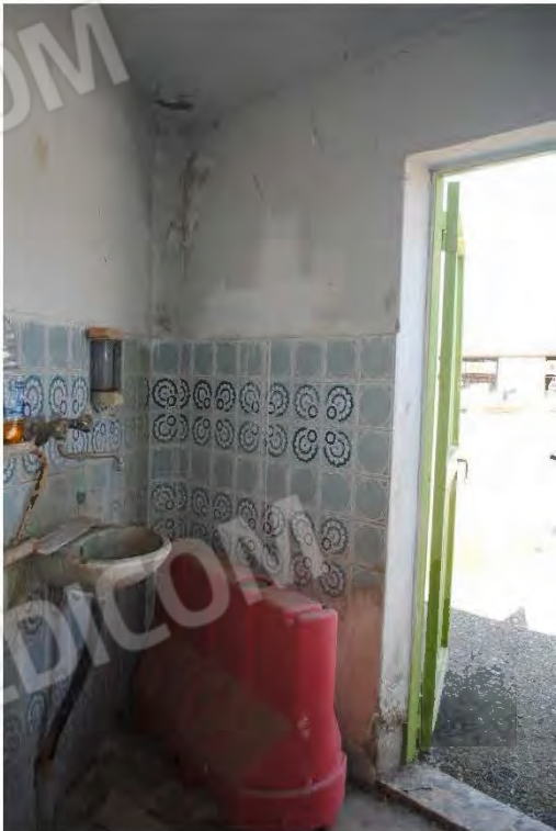
Corpo E: Viste interne Foto n. 22-