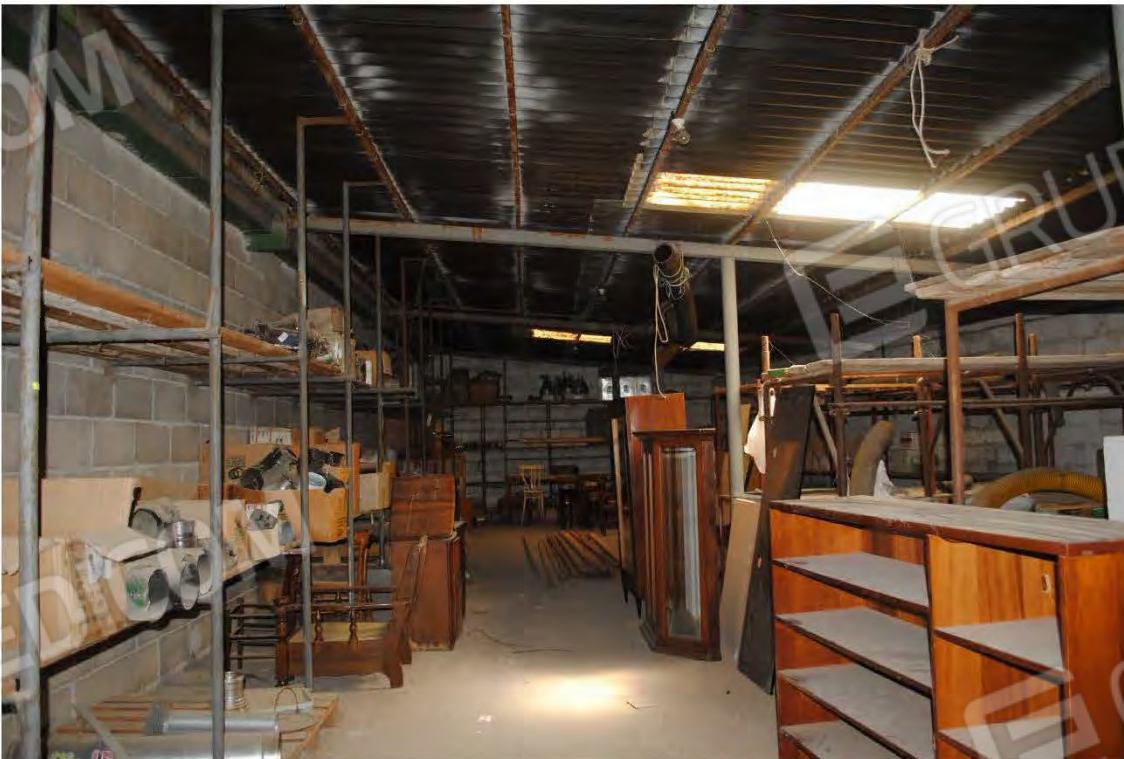
Corpo D: Vista interna