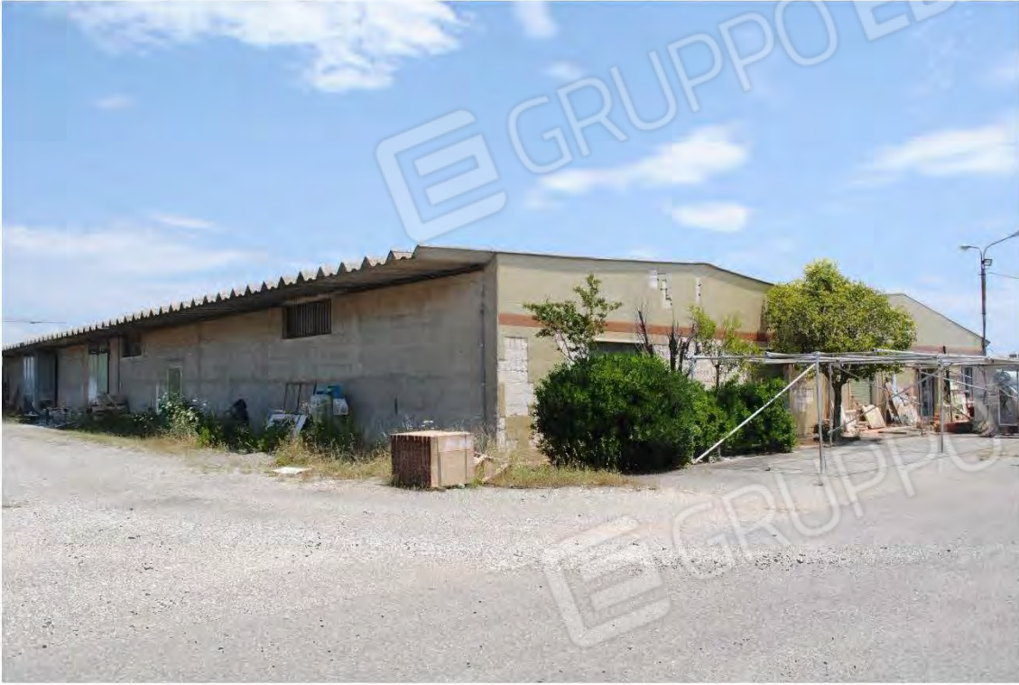
Corpo B: Vista esterna - Vista interna al piazzale-

All. A – Lotto 001 Corpo B : Fg 7 P.IIa 3388 sub 3