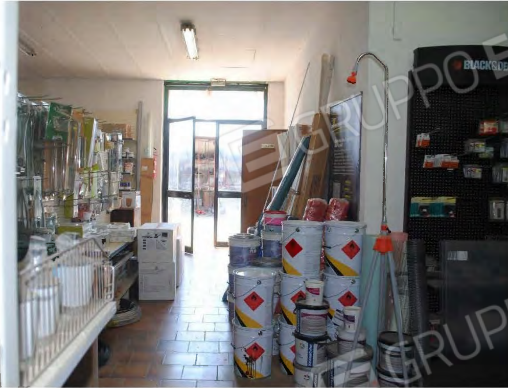
Corpo A : Vista interna – Ingresso laterale dal piazzale