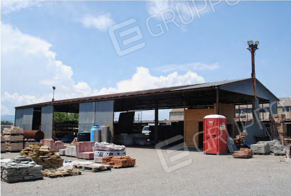
Corpo F: Vista esterna, interna al piazzale

All. A – Lotto 001 Corpo F : Fg 7 P.IIa 3388 sub 7