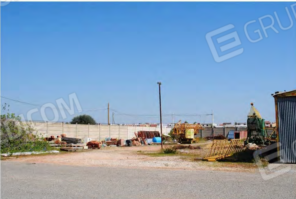
Vista interna al piazzale