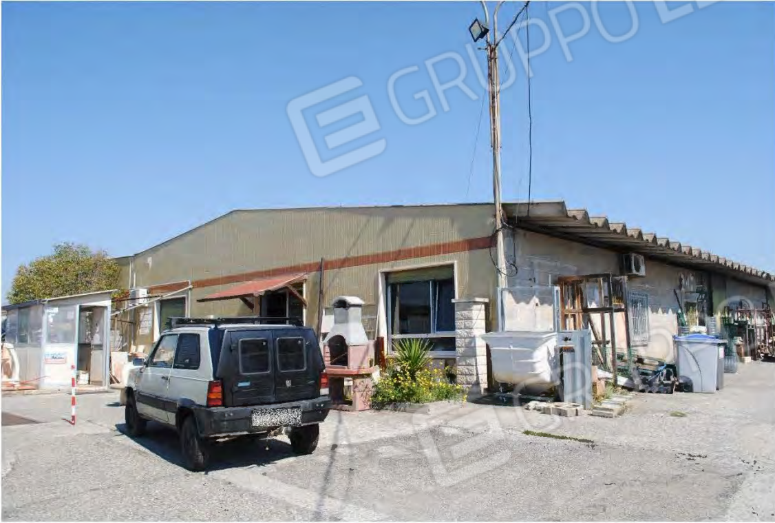
Corpo A: Vista esterna - Vista interna al piazzale-

All. A – Lotto 001 Corpo A : Fg 7 P.IIa 3388 sub 2