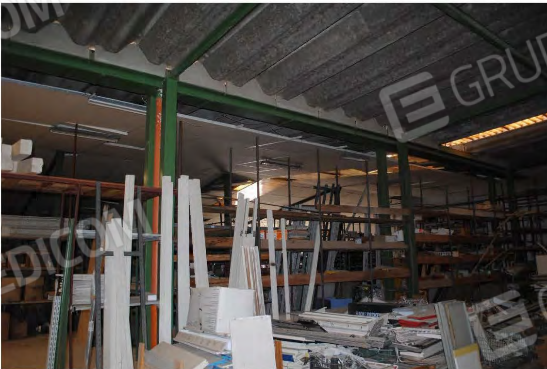
Corpo C: Vista Interna