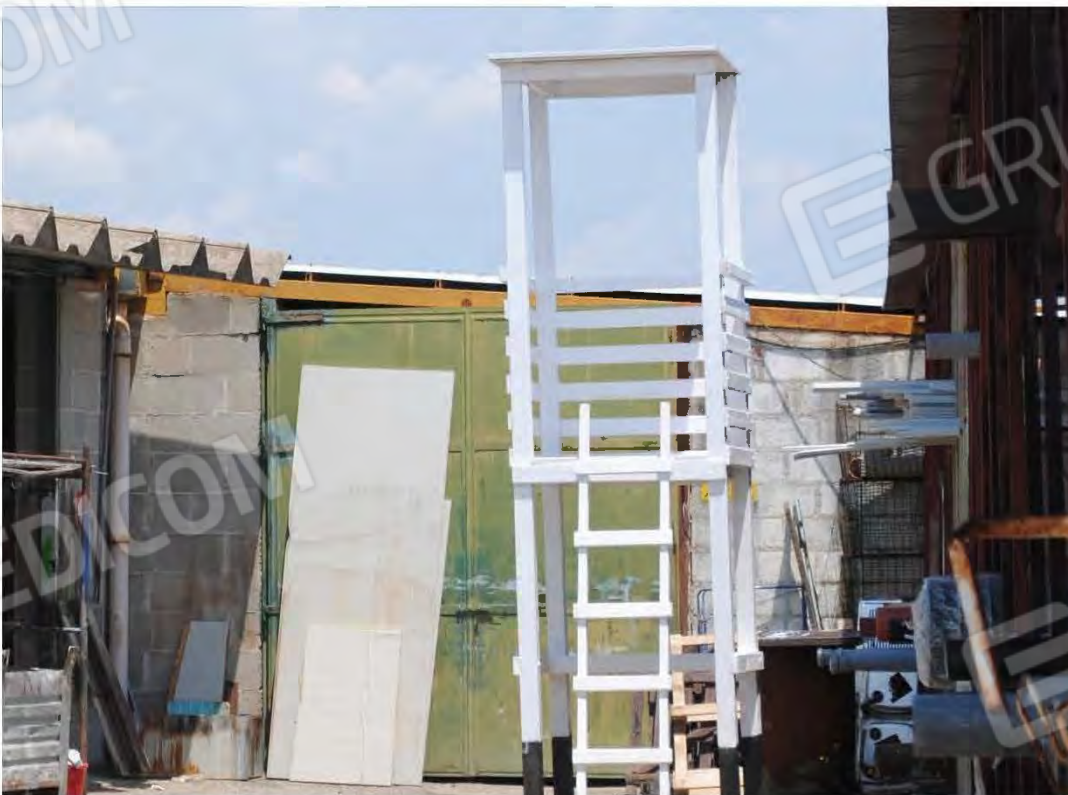
Corpo D: Vista esterna – Portone di ingresso dal piazzale