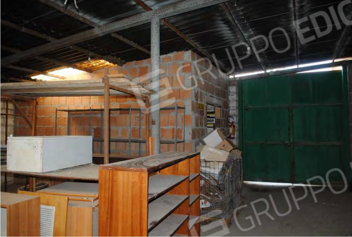
Corpo D: Vista interna