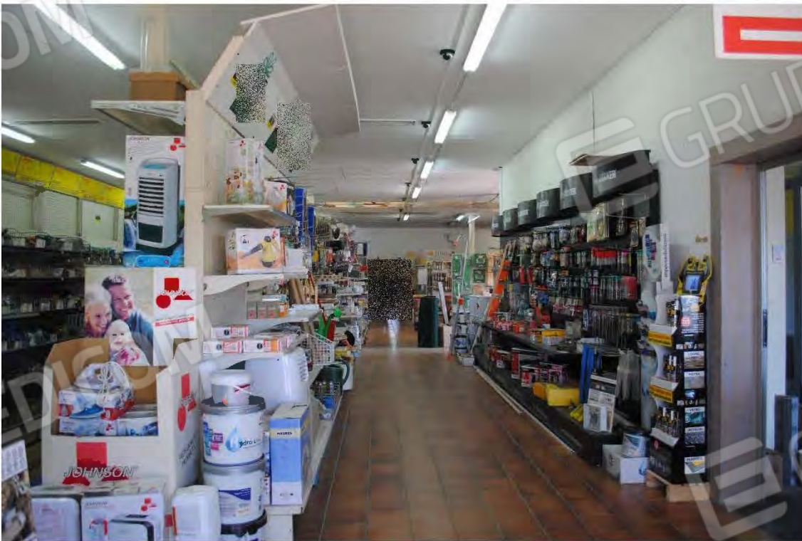
Corpo A : Vista interna – Sala Vendita- porta accesso ufficio