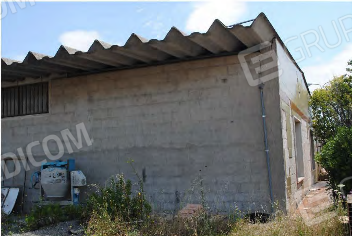
Corpo B: Vista esterna- particolare prospetti e copertura