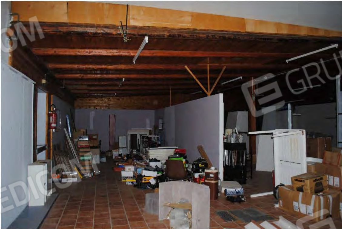
Corpo B: Vista interna - Sala mostre/deposito