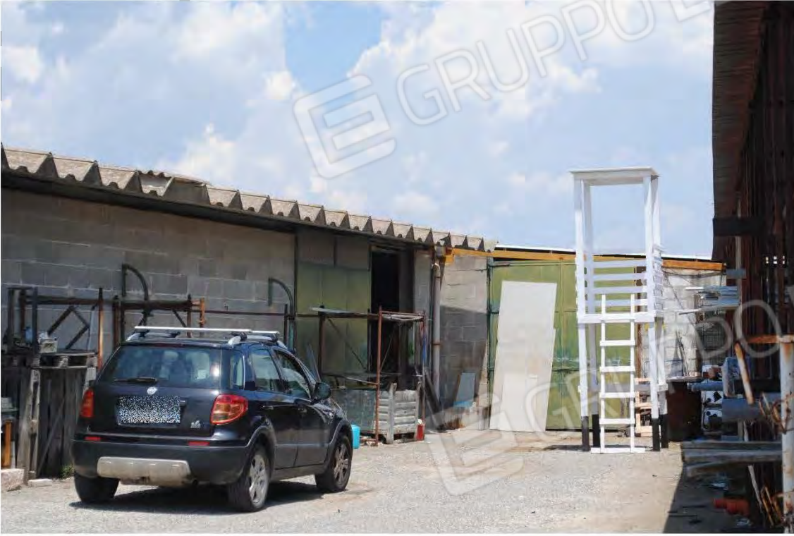
Corpo C: Vista esterna – Prospetto laterale dx–ingresso dal piazzale

All. A – Lotto 001 Corpo C : Fg 7 P.IIa 3388 sub 4