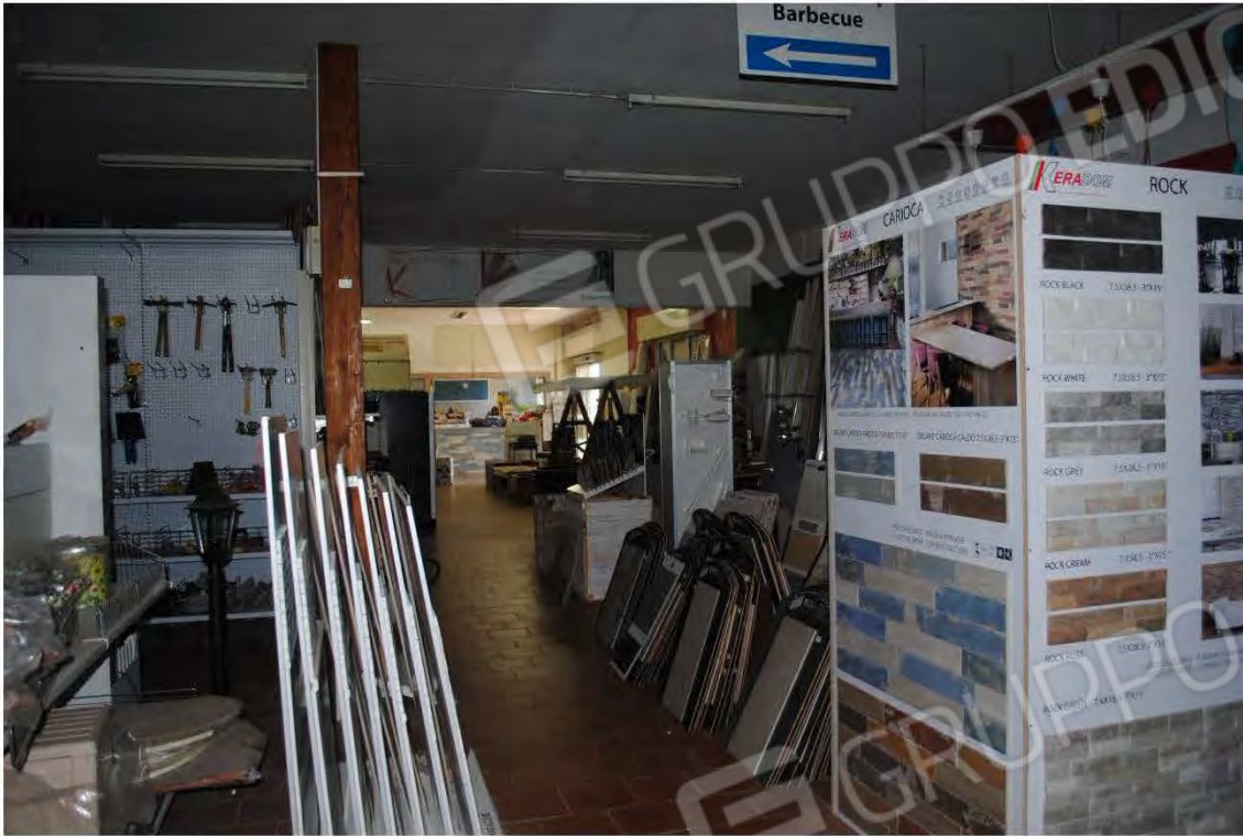
Corpo B: Vista interna sala esposizione- collegamento con il Corpo A