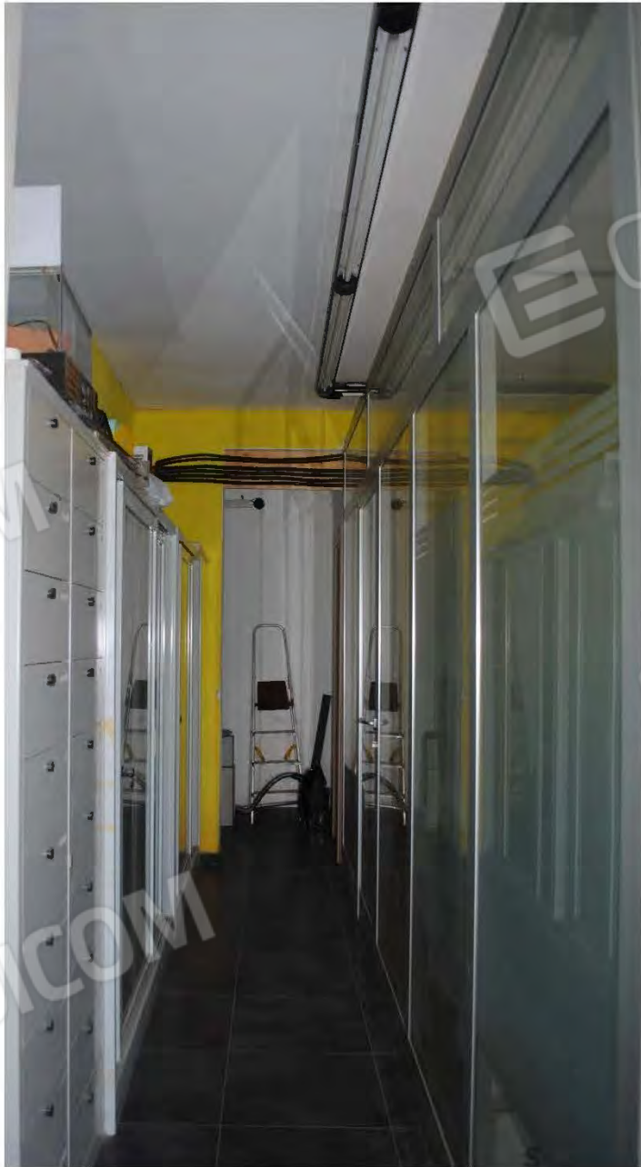
Corpo A : Vista interna Corridoio zona Ufficio