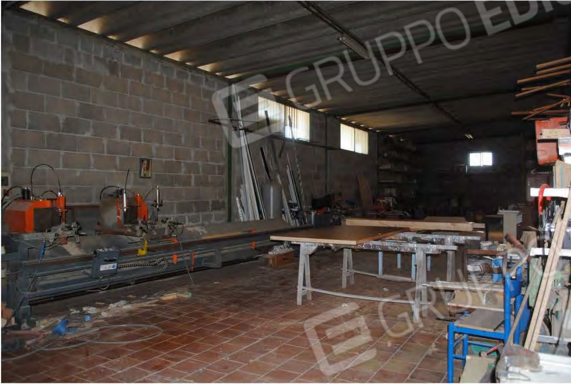
Corpo C: Vista interna