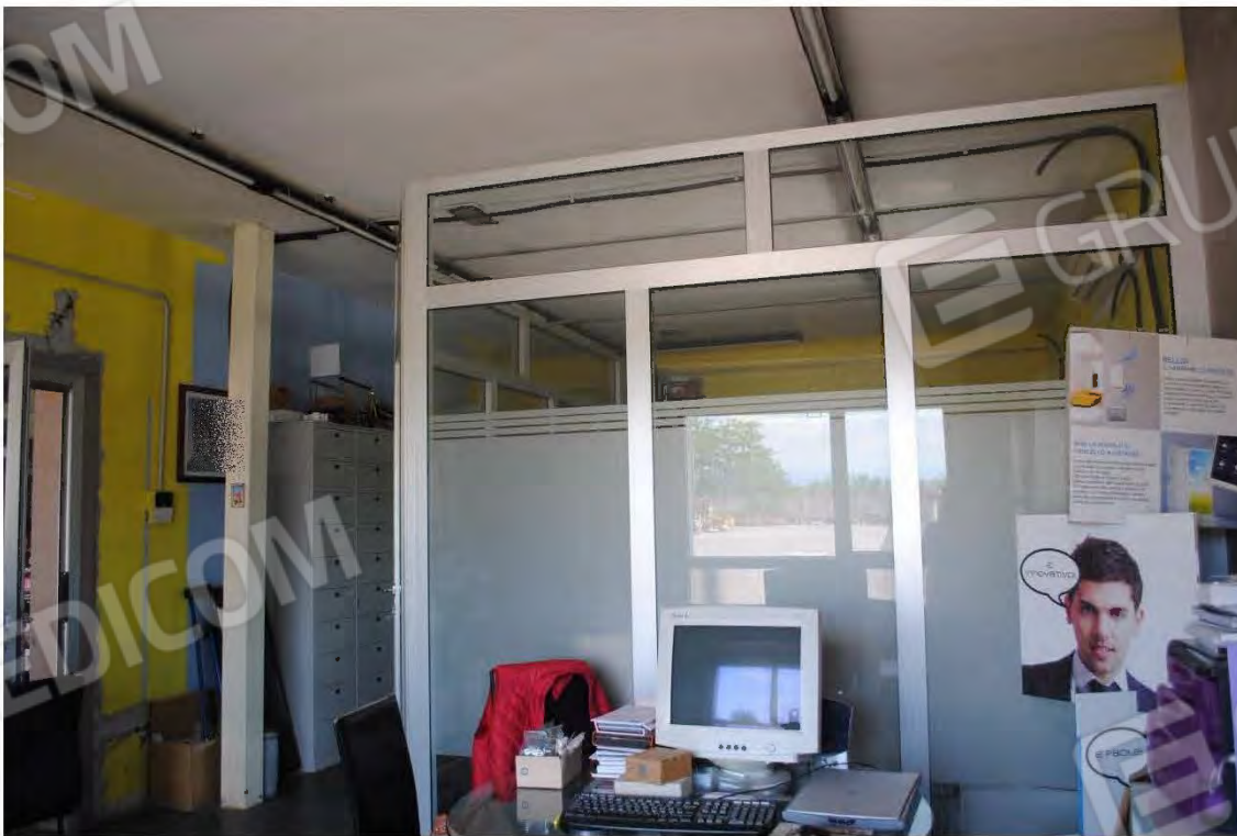
Corpo A: Vista interna – Ufficio