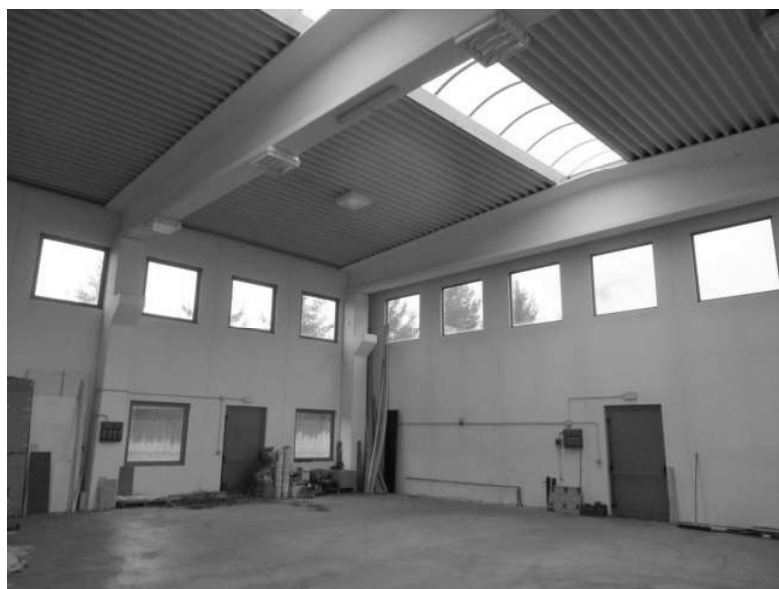
Figura 6: interno zona laboratorio