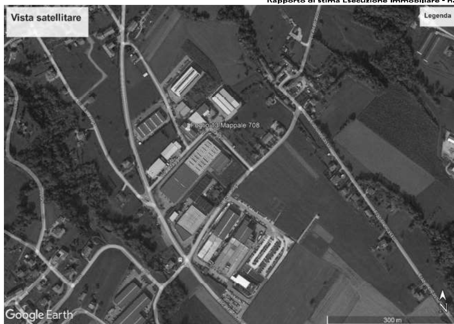
Figura 3: foto satellitare