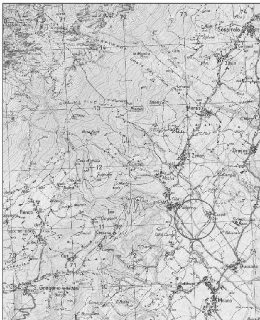
Figura 2: corografia