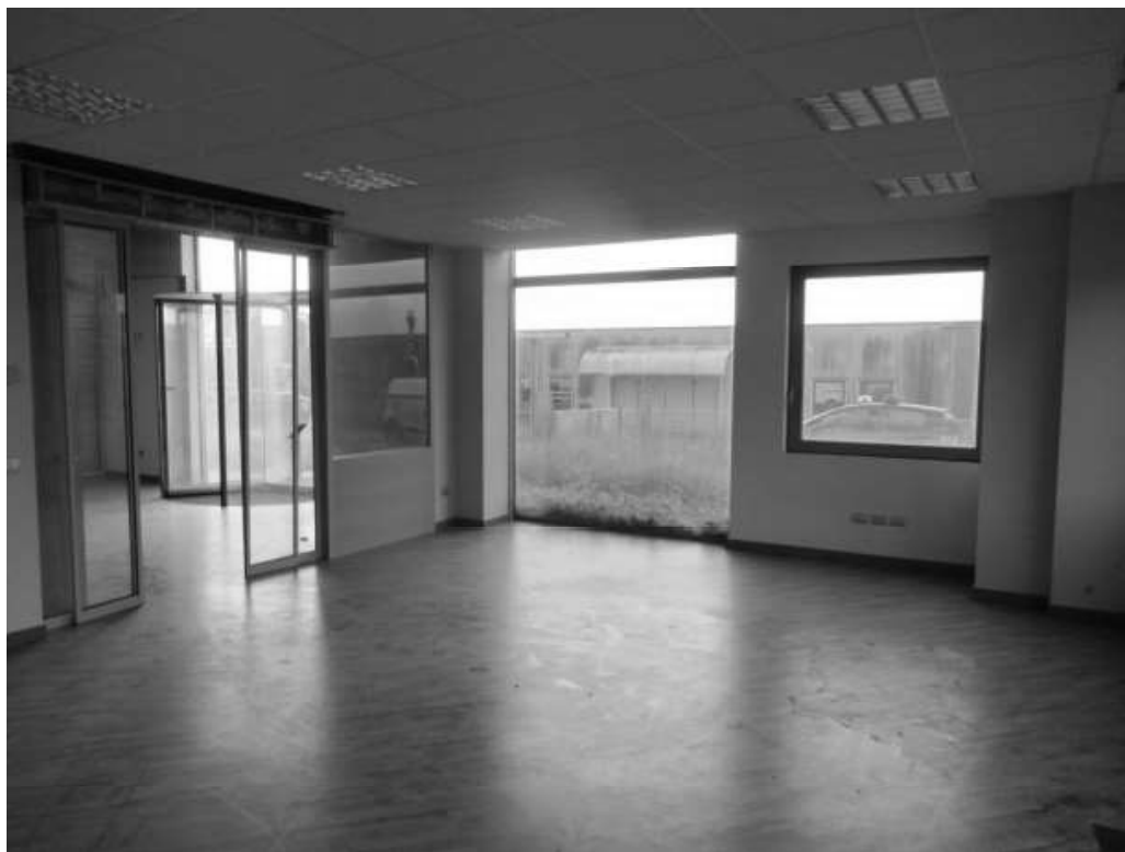
Figura 9: ufficio piano terra.