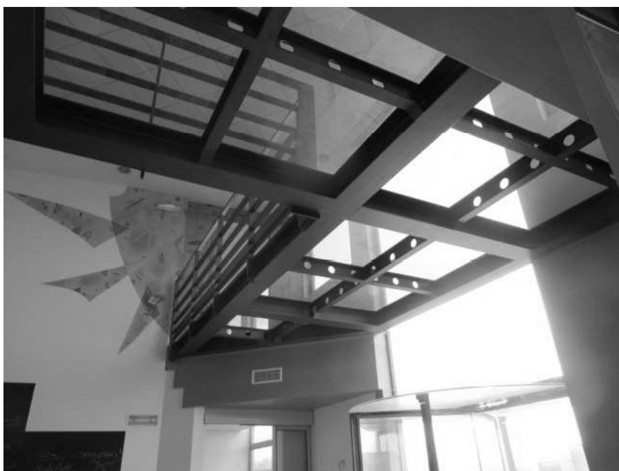
Figura 8: sottopaleo al piano primo