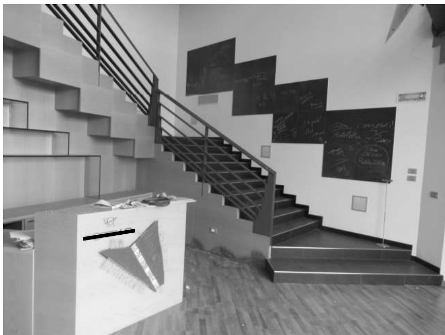
Figura 7: reception e scala al piano primo