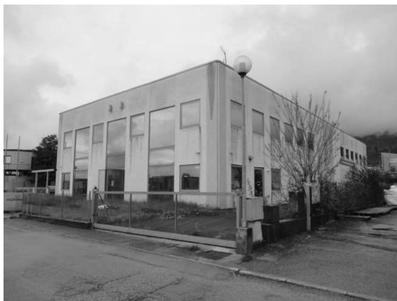
Figura 5: prospetto Sud Est

Note generali impianti: gli scarichi confluiscono nella fognatura comunale, a sud del fabbricato, previo passaggio in vasca Imhoff e pozzetto di ispezione. Produzione di acqua calda sanitaria mediante boiler elettrico