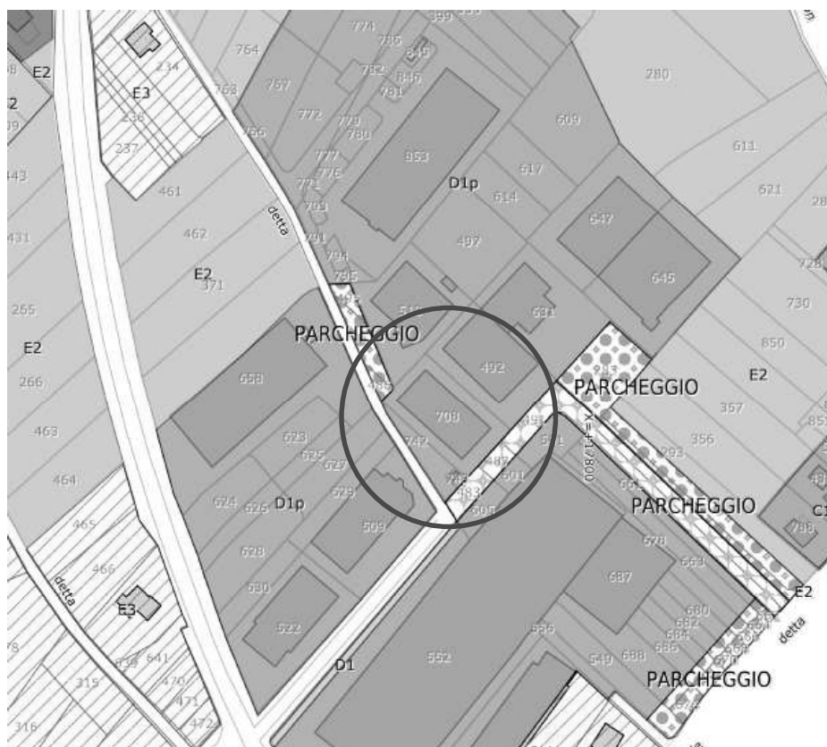
Figura 4: estratto PRG.