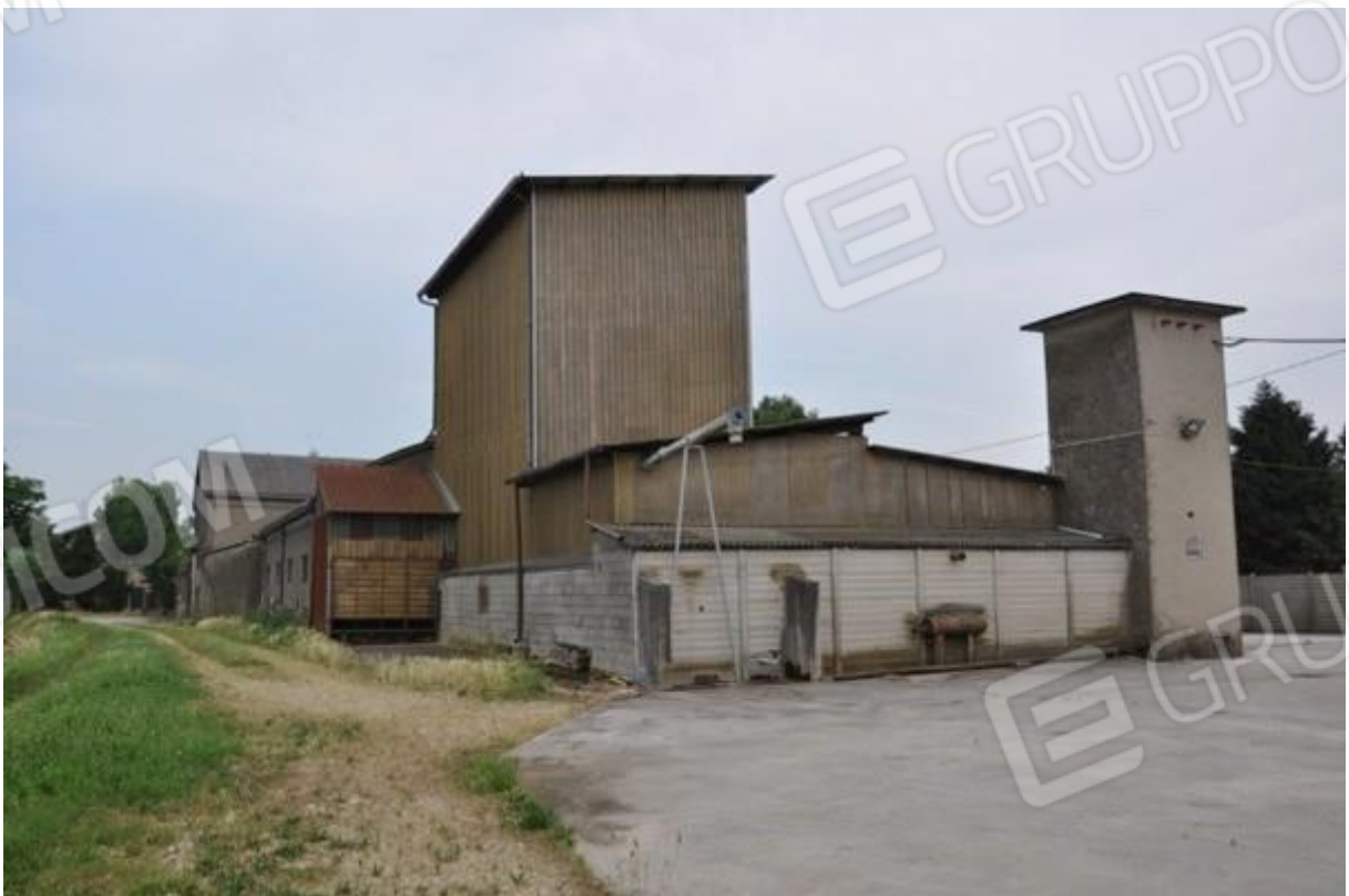
4. Prospetti ovest e nord della struttura principale.