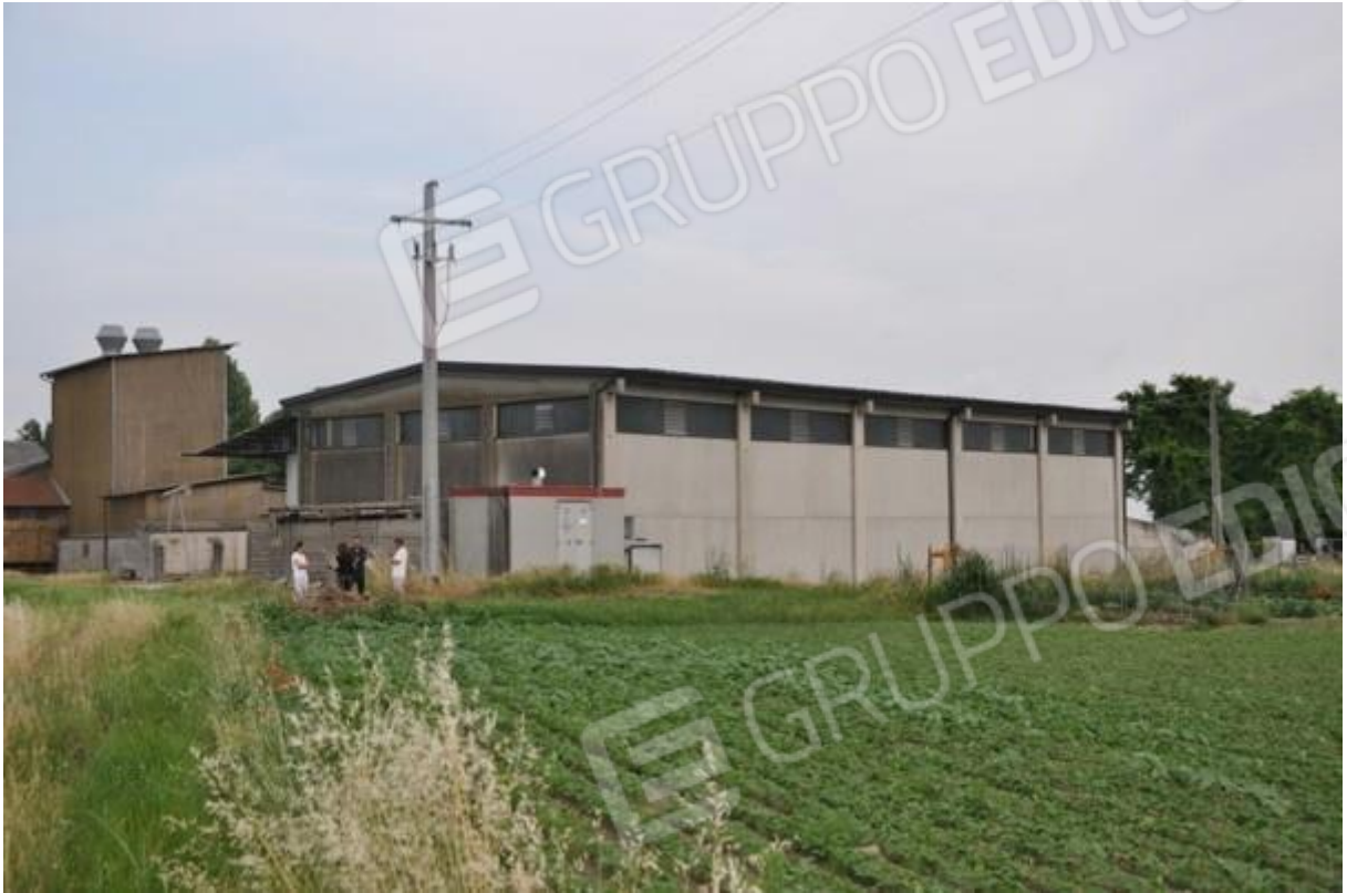
13. Ripresa del capannone nuovo dai terreni inclusi nel lotto.