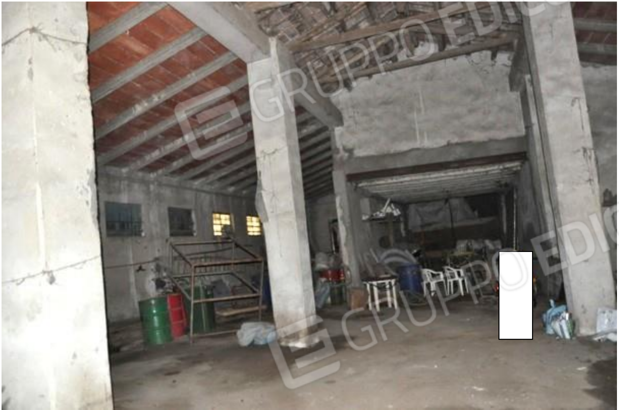
11. Porzione della struttura principale.