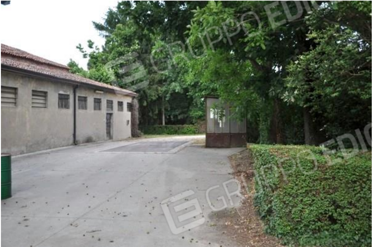
7. Piazzale antistante la struttura principale con pesa.