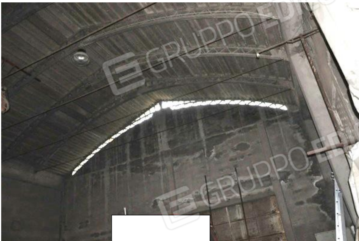
9. Porzione della struttura principale.