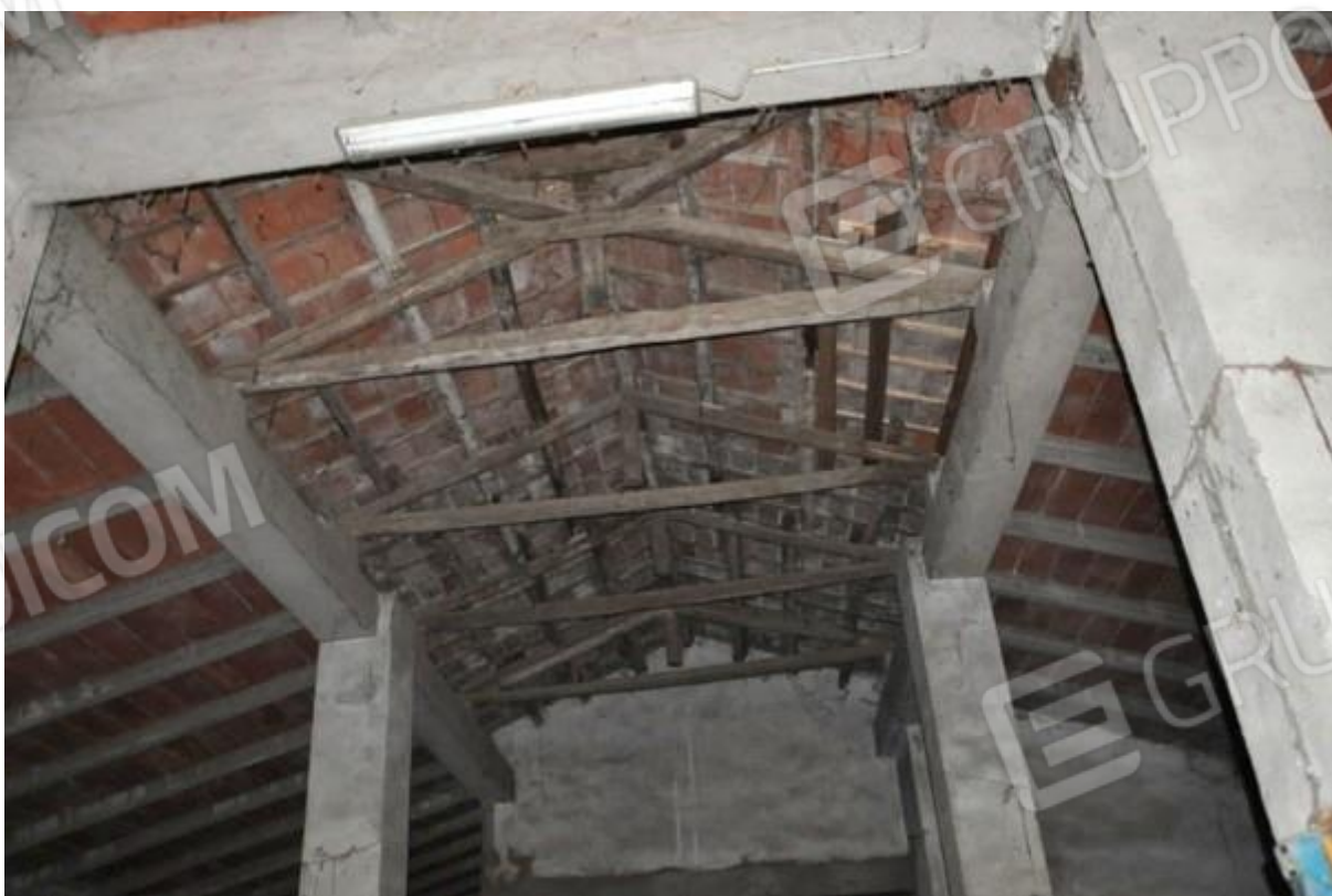
10. Porzione della struttura principale.