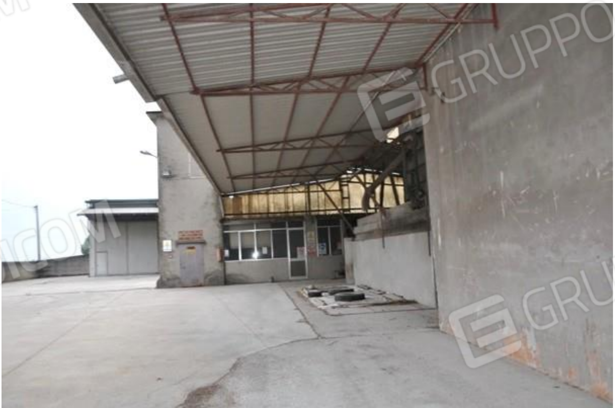
8. Struttura principale --- essiccatoio.