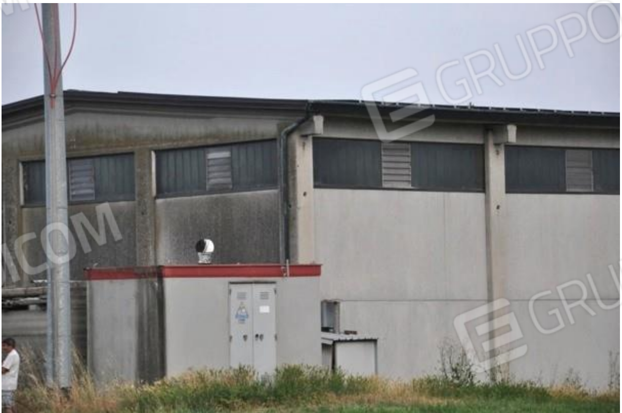
14. Particolare della cabina elettrica al servizio del pannello fotovoltaico installato sulla copertura (part. 306).