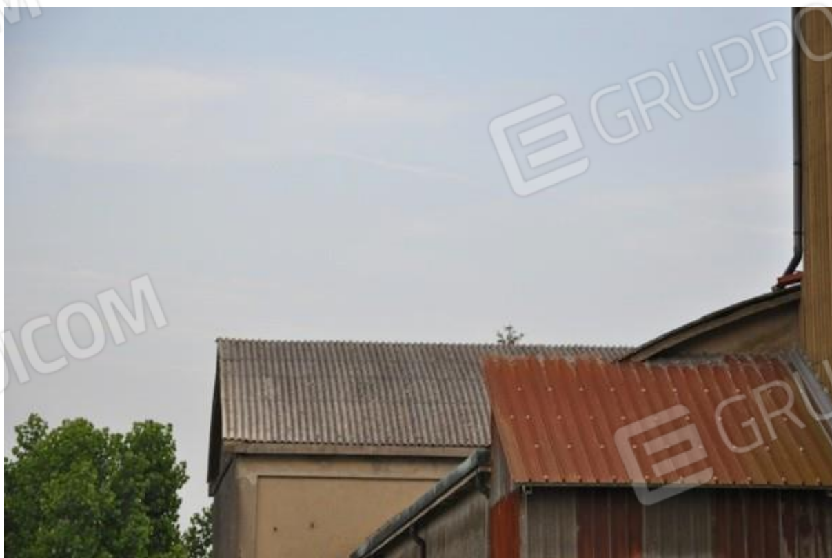
6. Particolare della copertura.