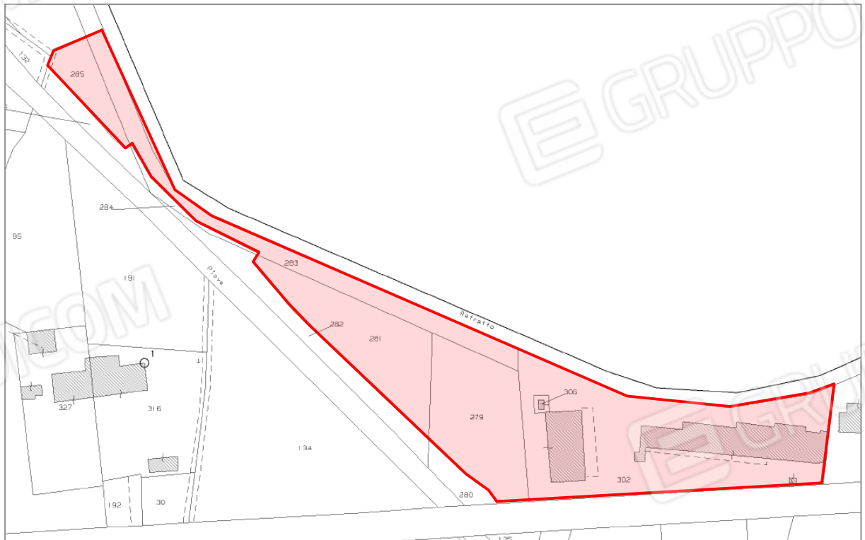
2. Estratto di mappa (non in scala).