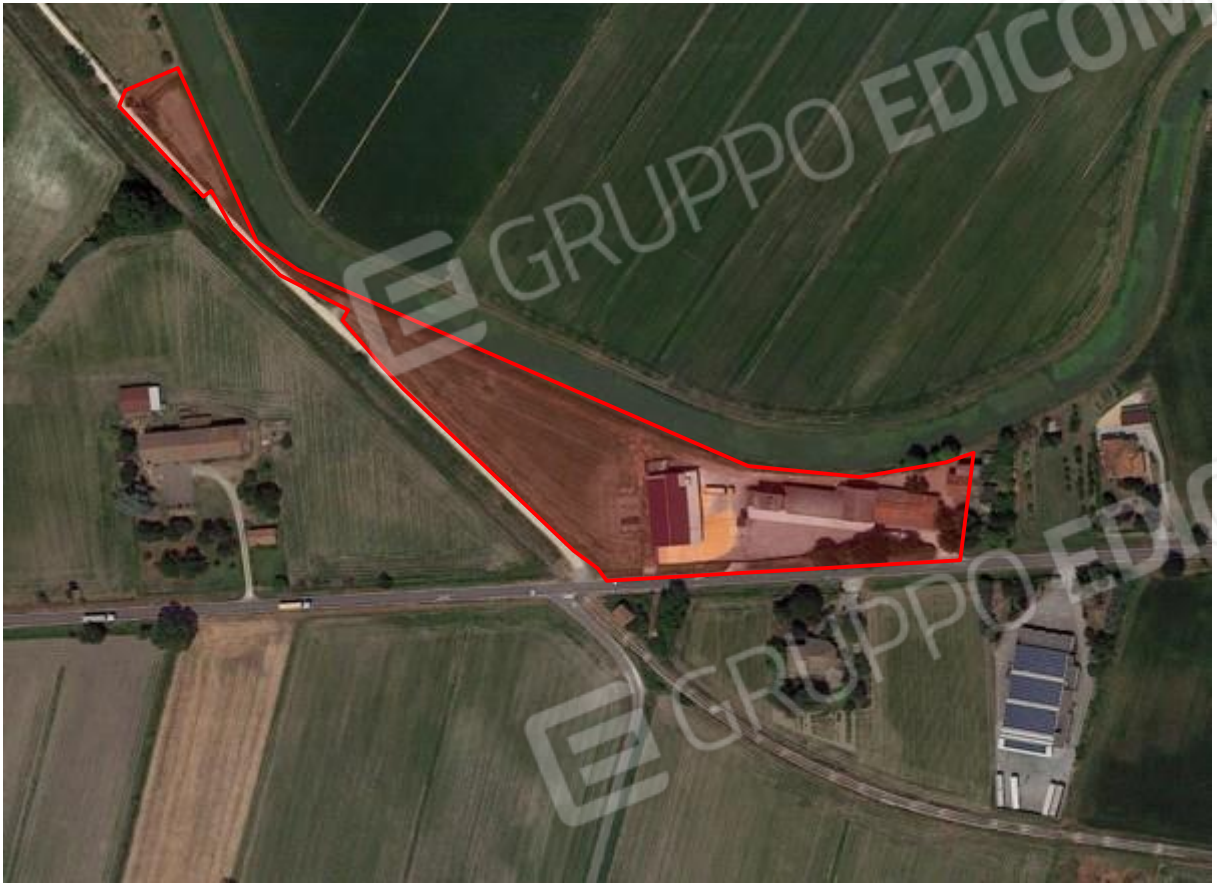
1. Individuazione approssimativa del lotto.