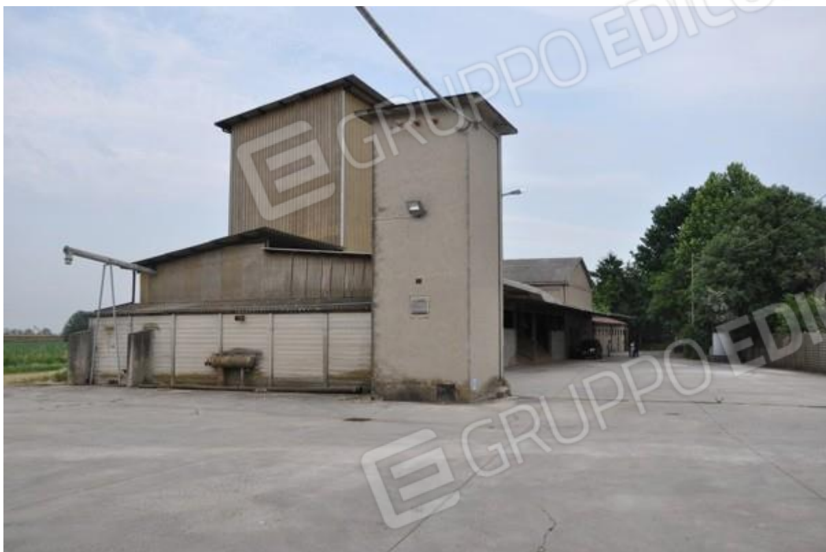
5. Prospetti ovest e sud della struttura principale.