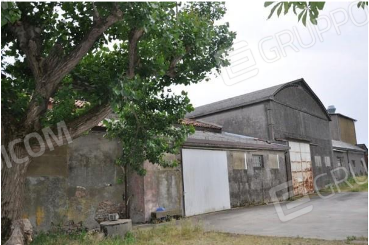
12. Retro della struttura principale.