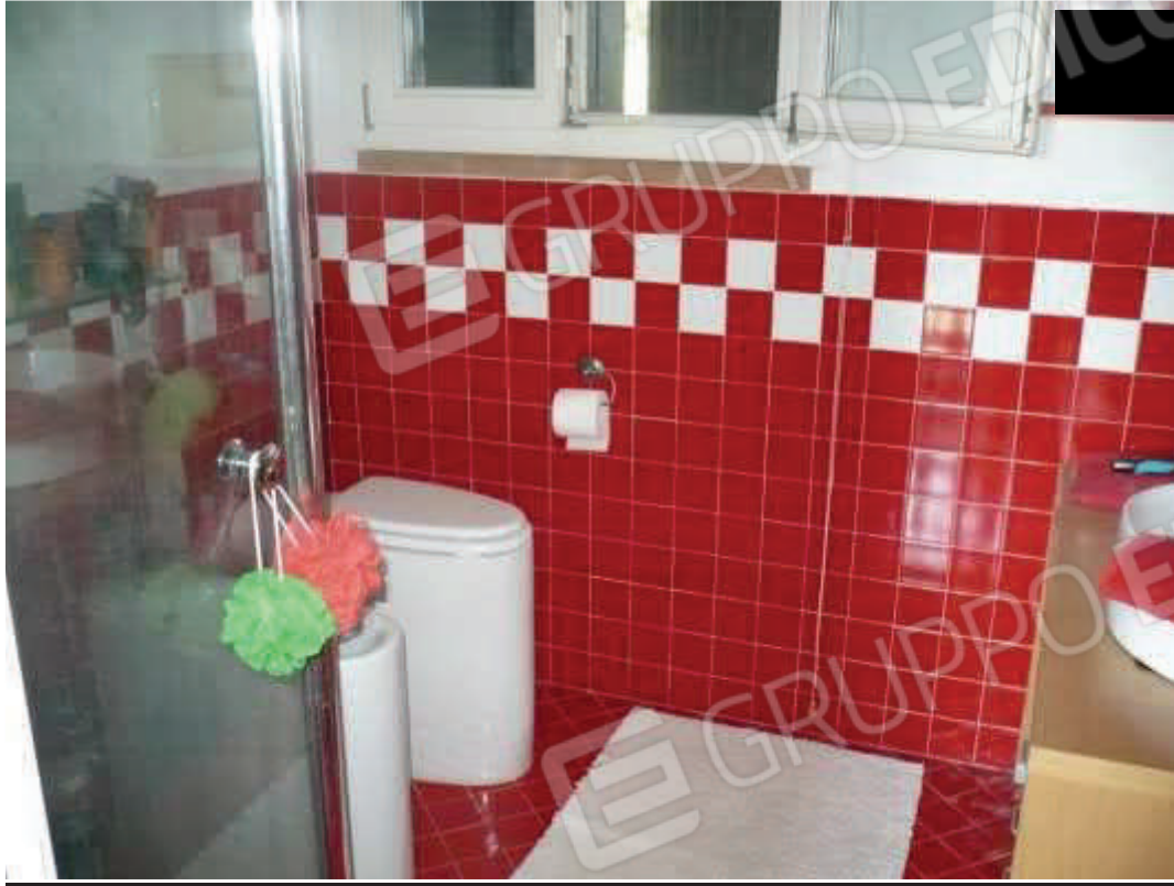
Bagno – piano primo