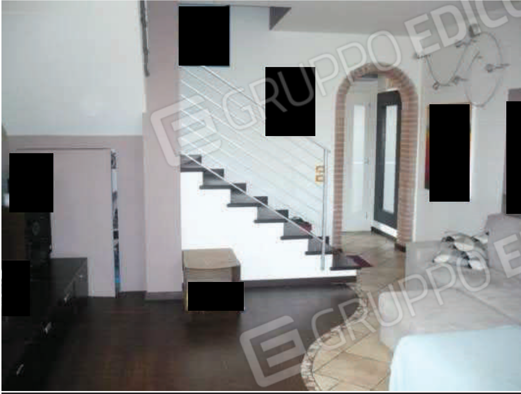
Soggiorno – piano terra – ex locale magazzino