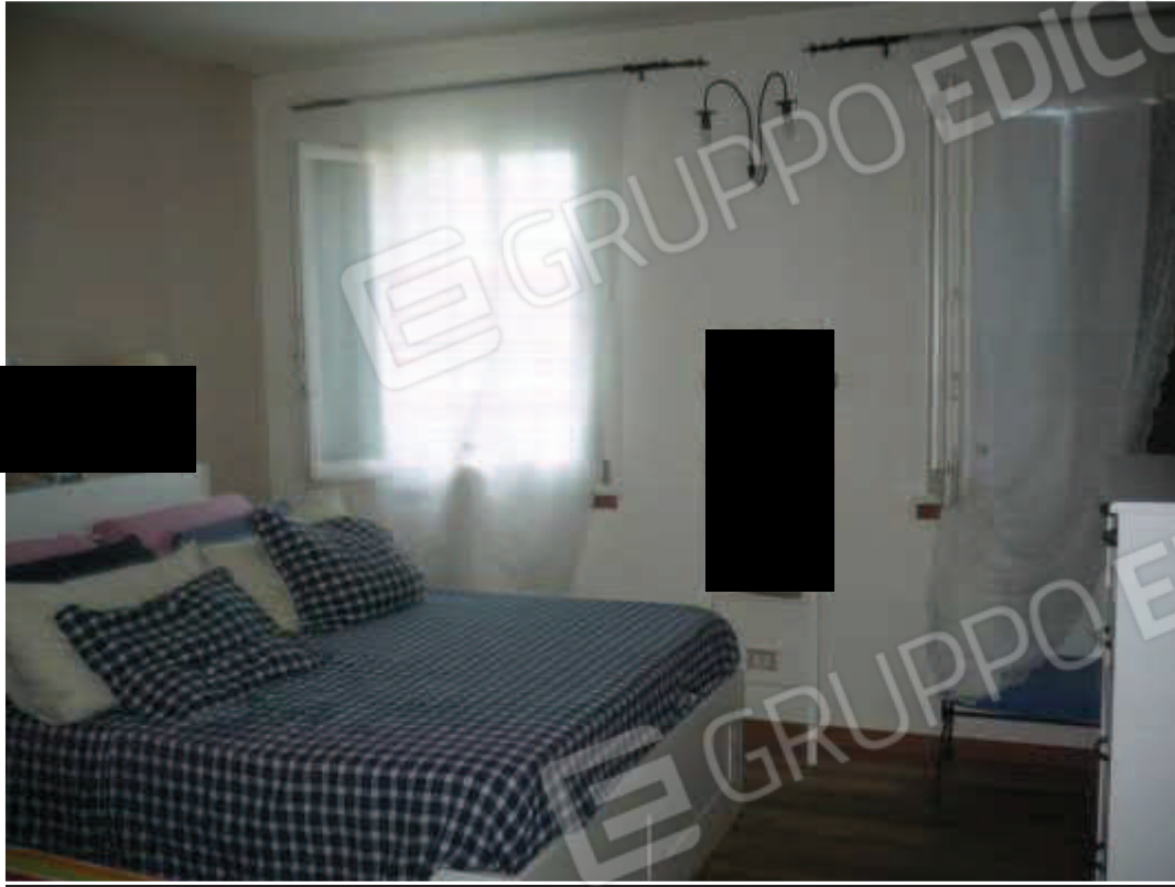
Letto – piano primo