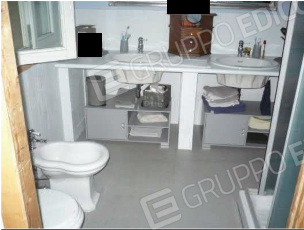
Bagno – piano primo