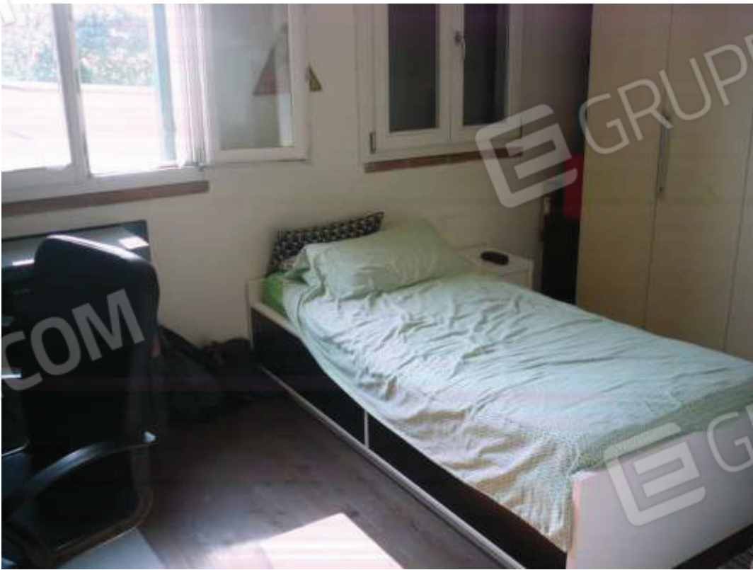
Letto – piano primo