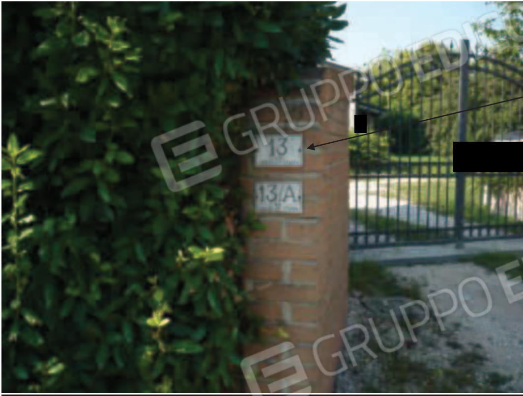
Identificazione numeri civici