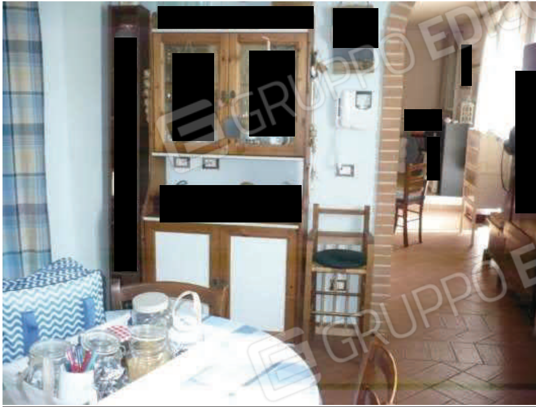
Cucina – piano terra