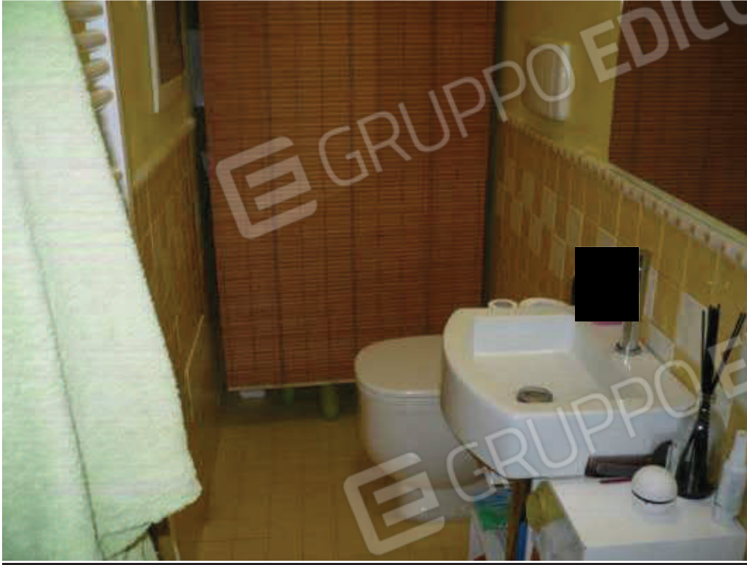
W.C. – piano terra