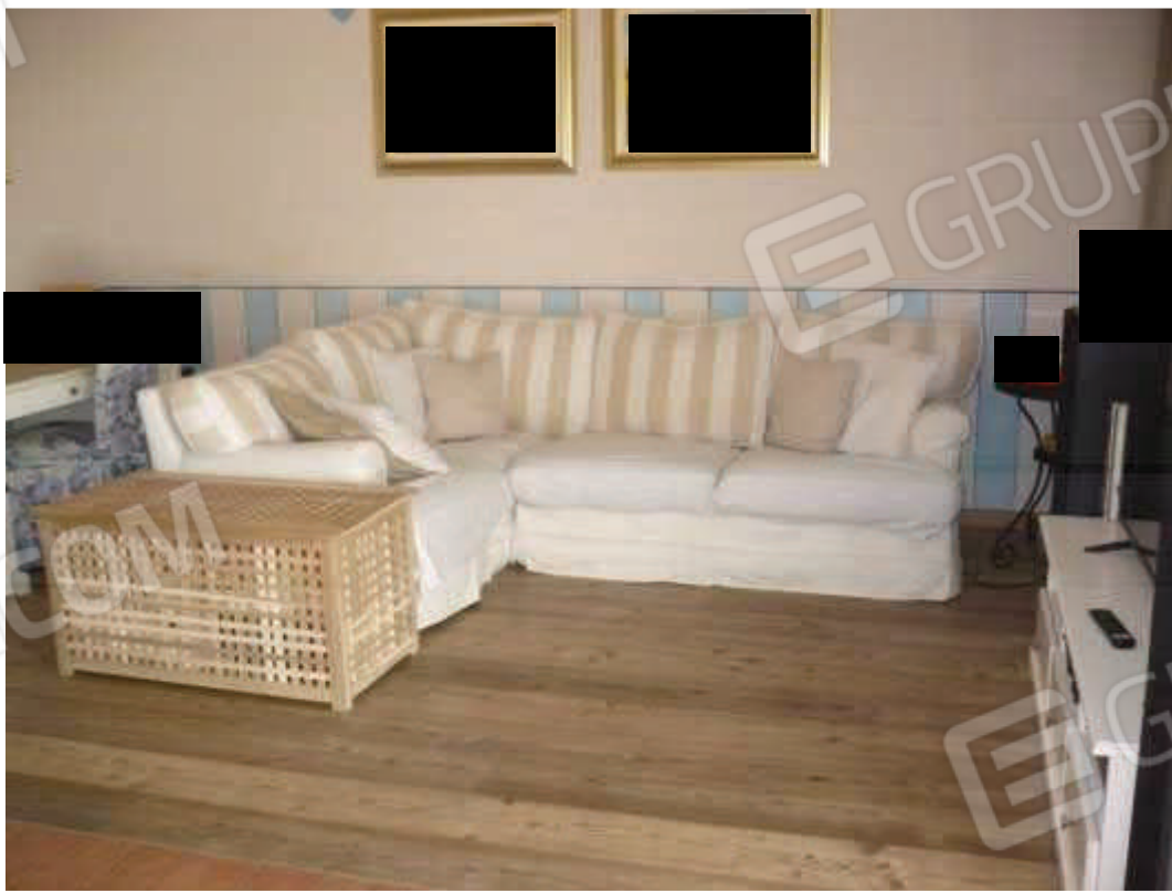
Soggiorno – piano terra