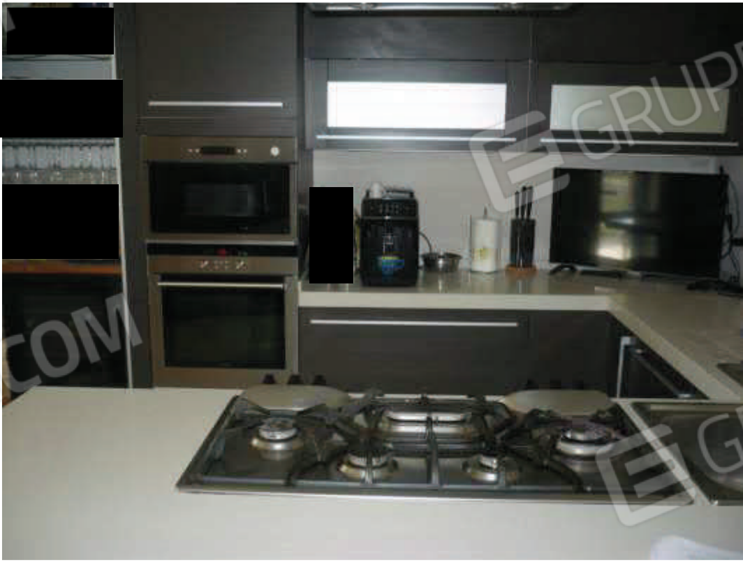
Cucina – piano terra – ex locale ingresso