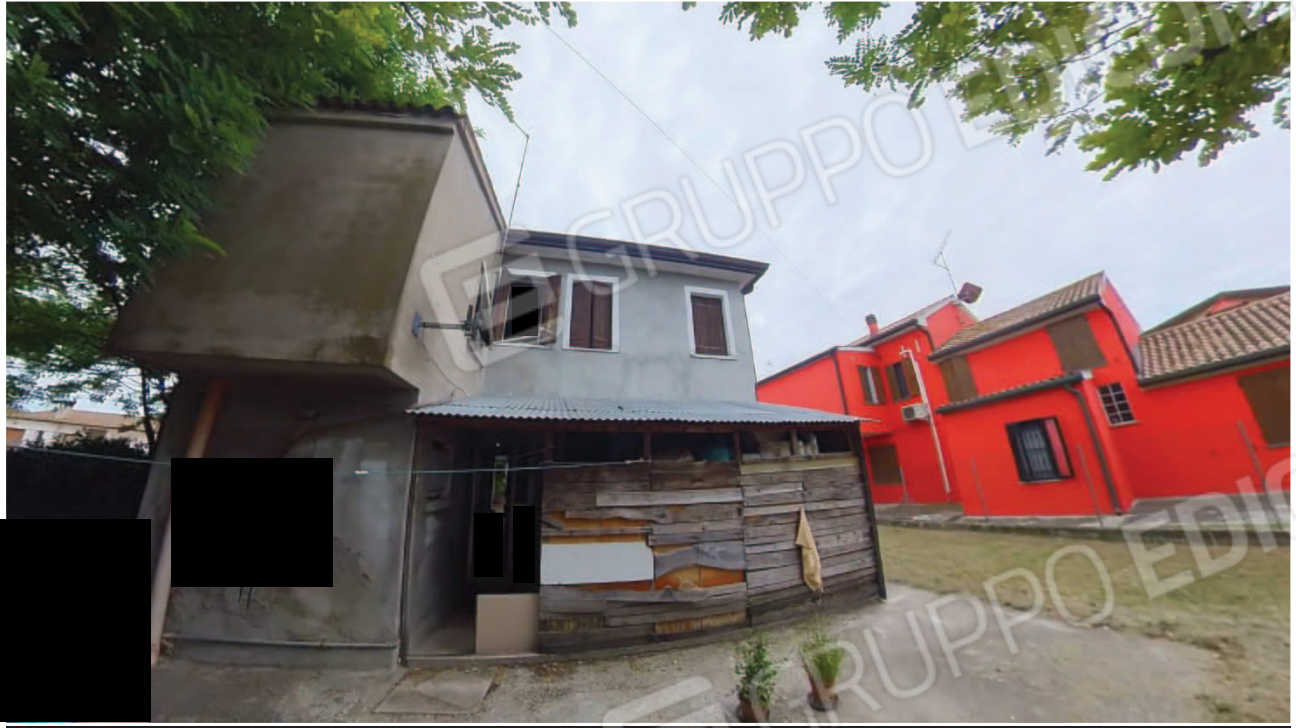
Figura 8 Lato Ovest abitazione