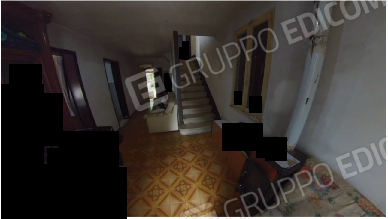
Figura 14 Interni abitazione piano terra