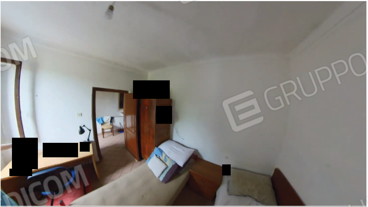
Figura 25 Interni abitazione primo piano