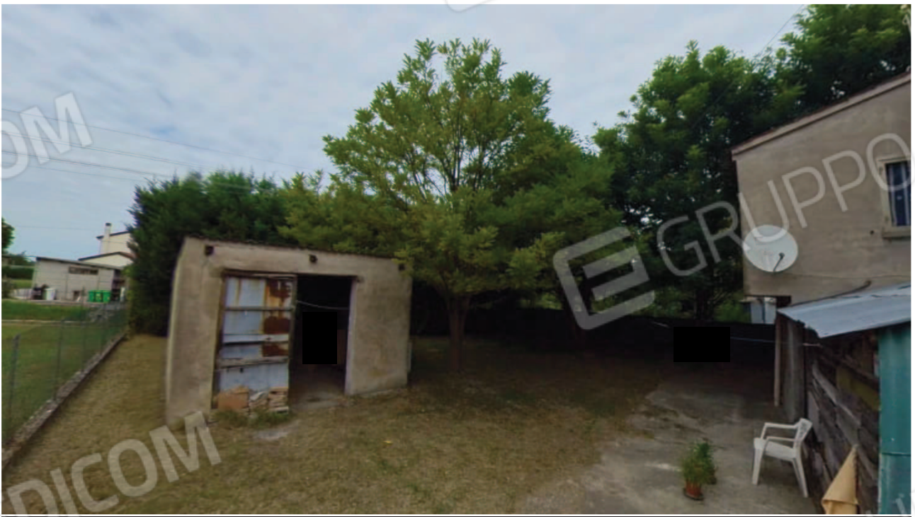
Figura 13 Pertinenza garage