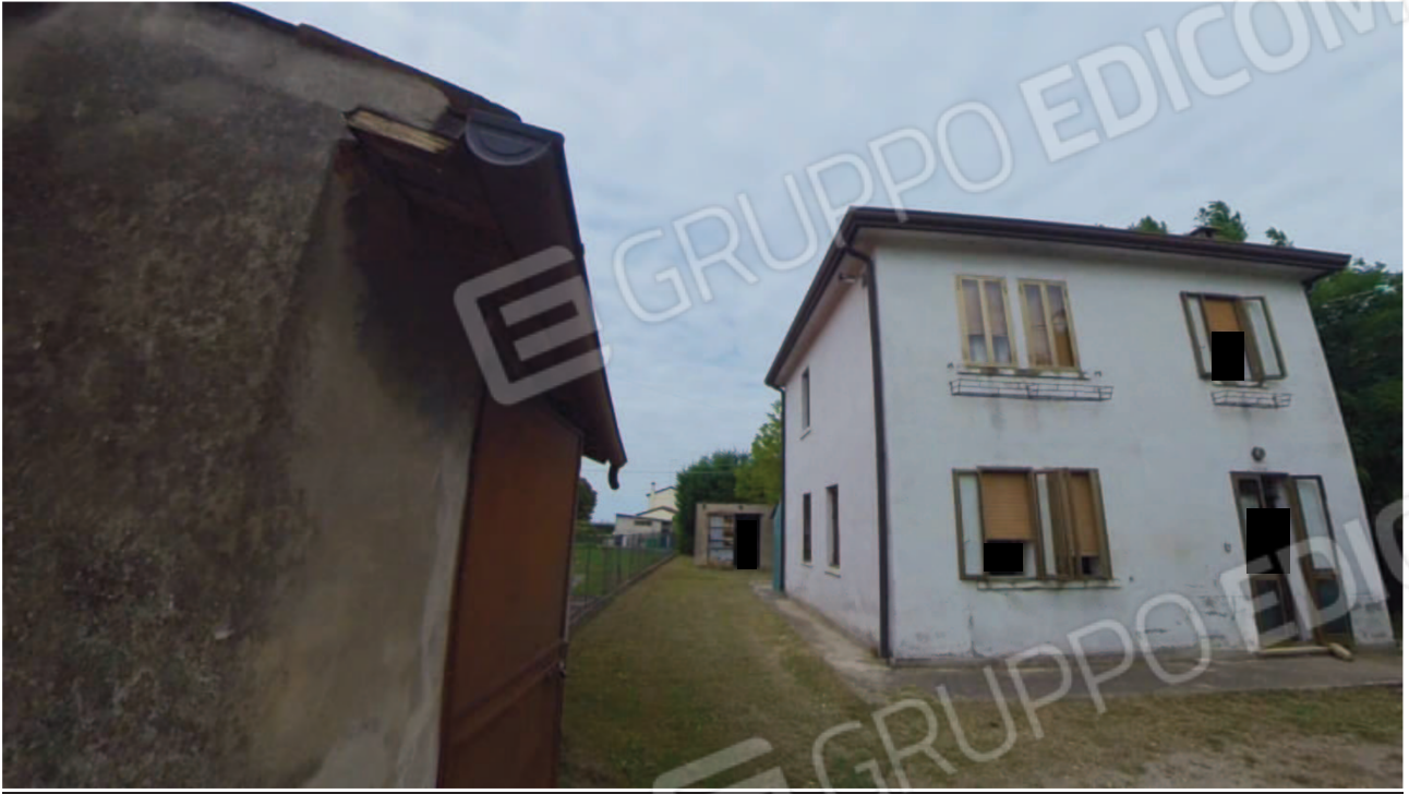
Figura 6 Esterno lato Est