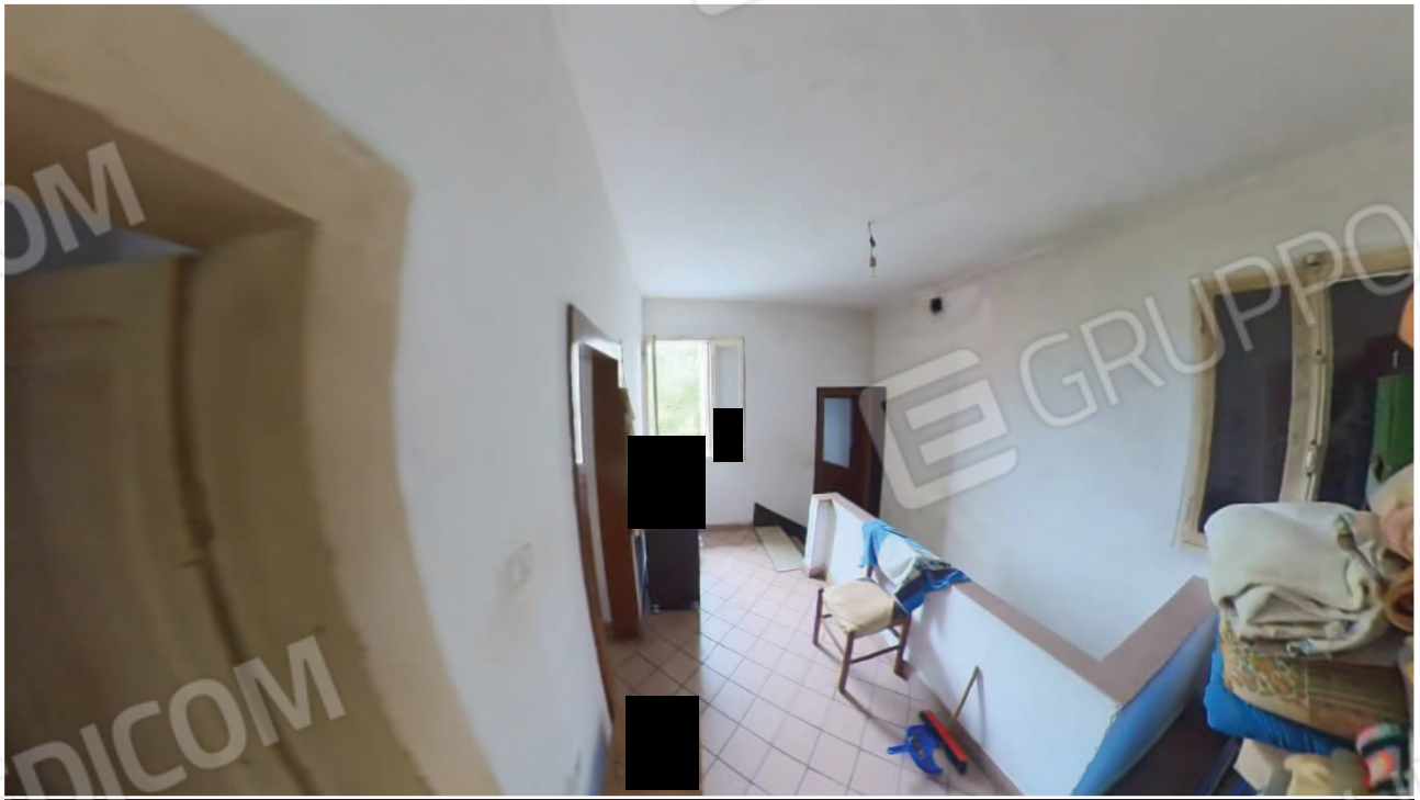
Figura 27 Interni abitazione primo piano