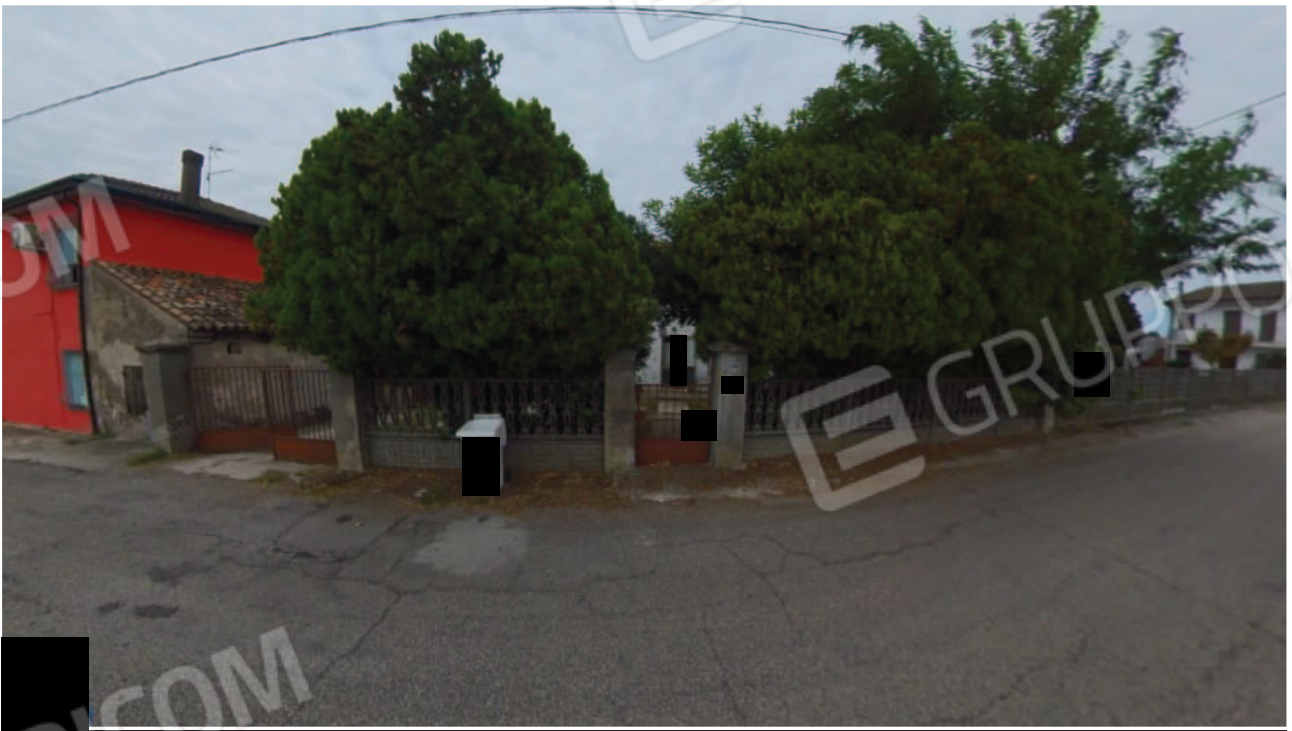
Figura 3 Veduta da Via Basse