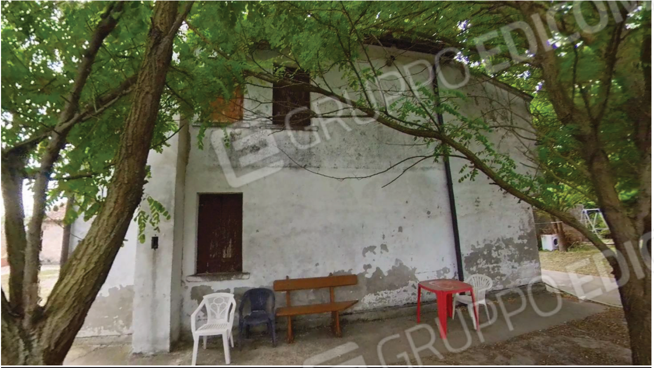
Figura 10 Lato Nord abitazione