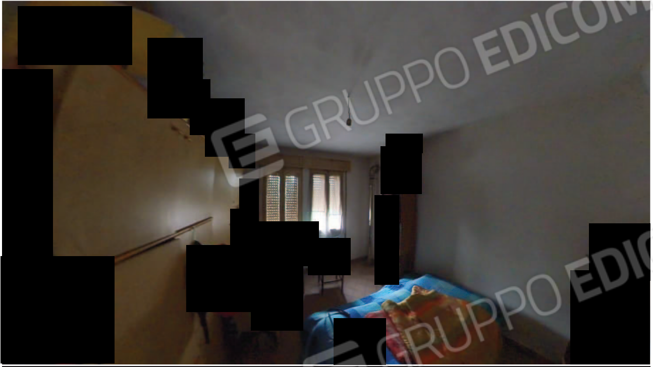
Figura 26 Interni abitazione primo piano