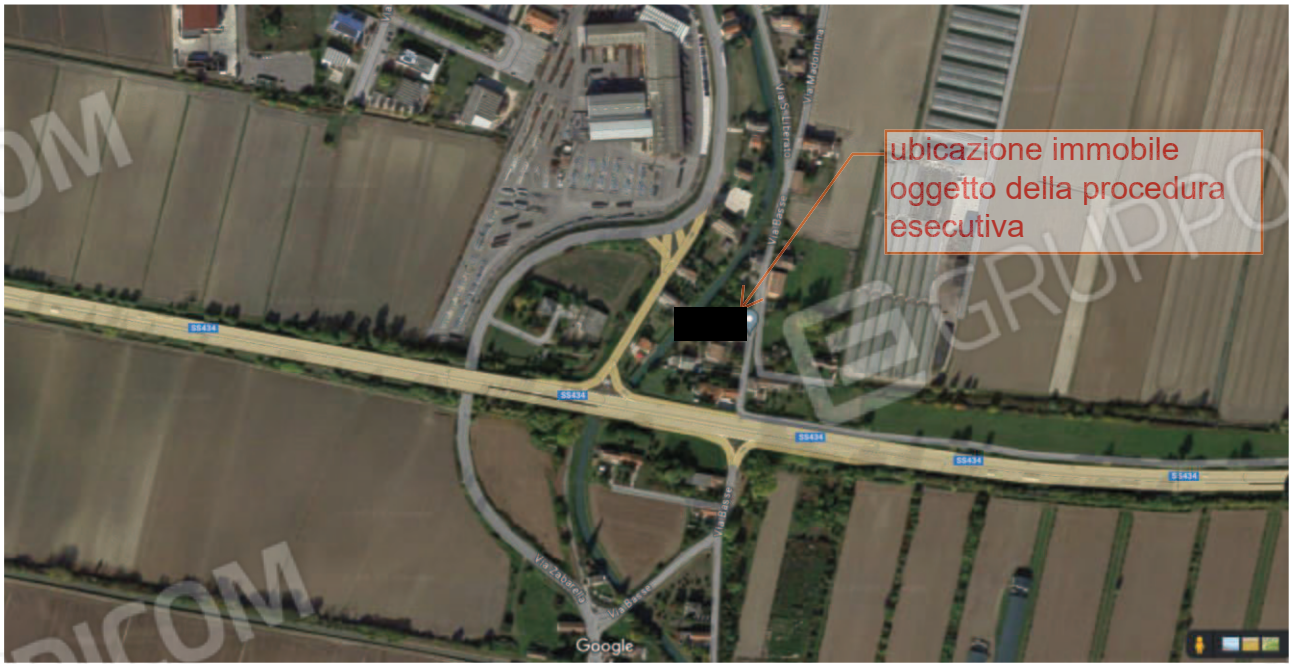
Figura 1 Veduta aerea