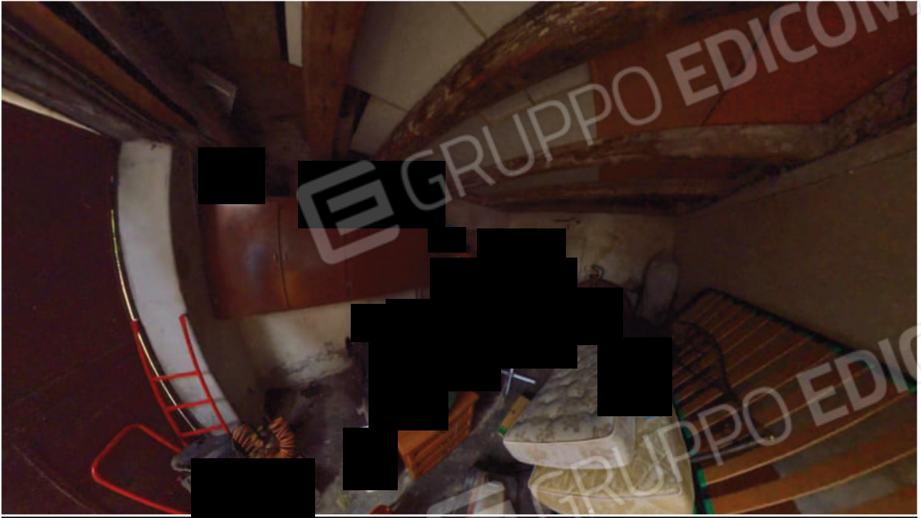
Figura 28 Interno pertinenza mn 90 sub 2