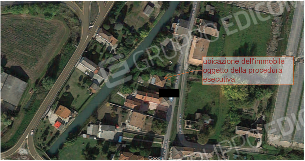
Figura 2 veduta aerea