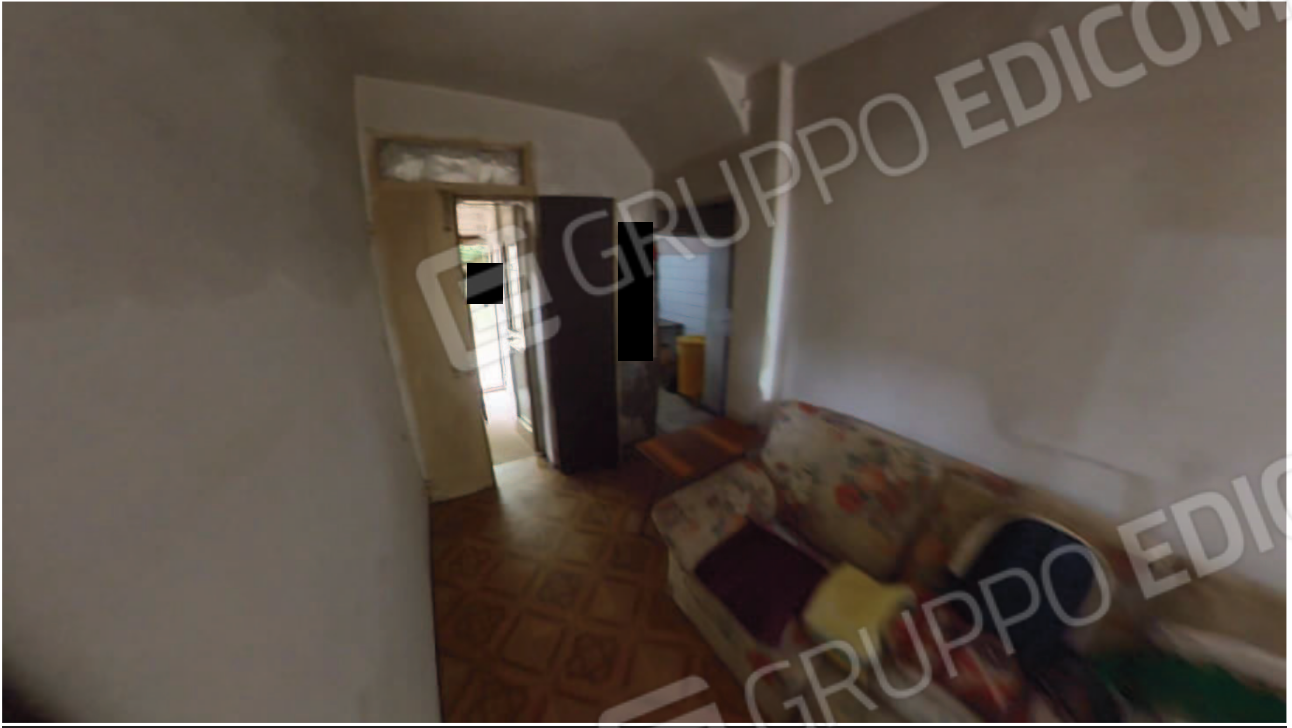
Figura 18 Interni abitazione piano terra