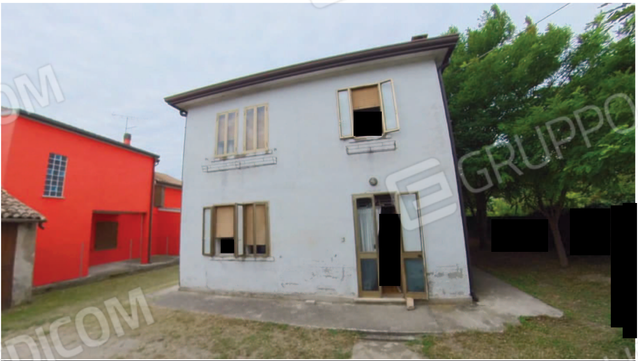
Figura 5 Esterno lato Est