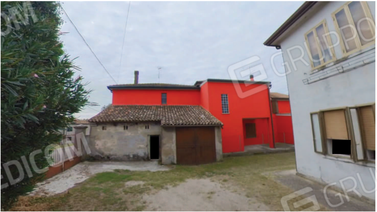
Figura 11 Pertinenza Cantina Garage