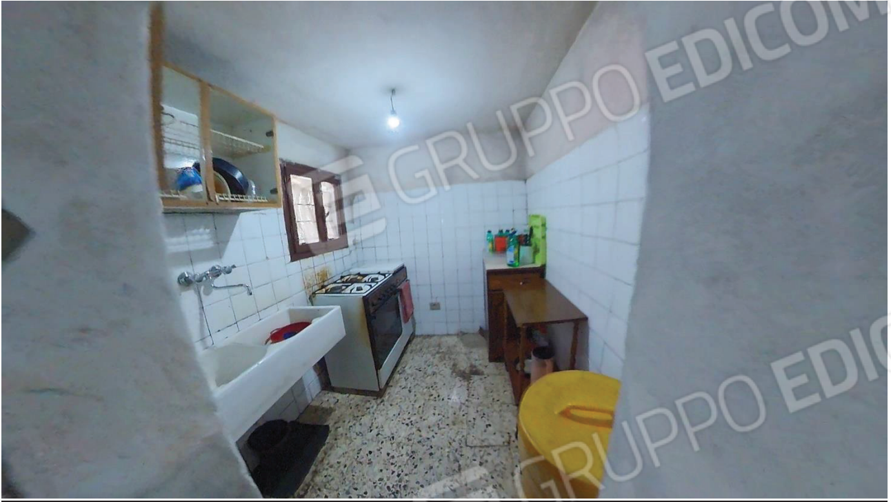
Figura 20 Interni abitazione piano terra