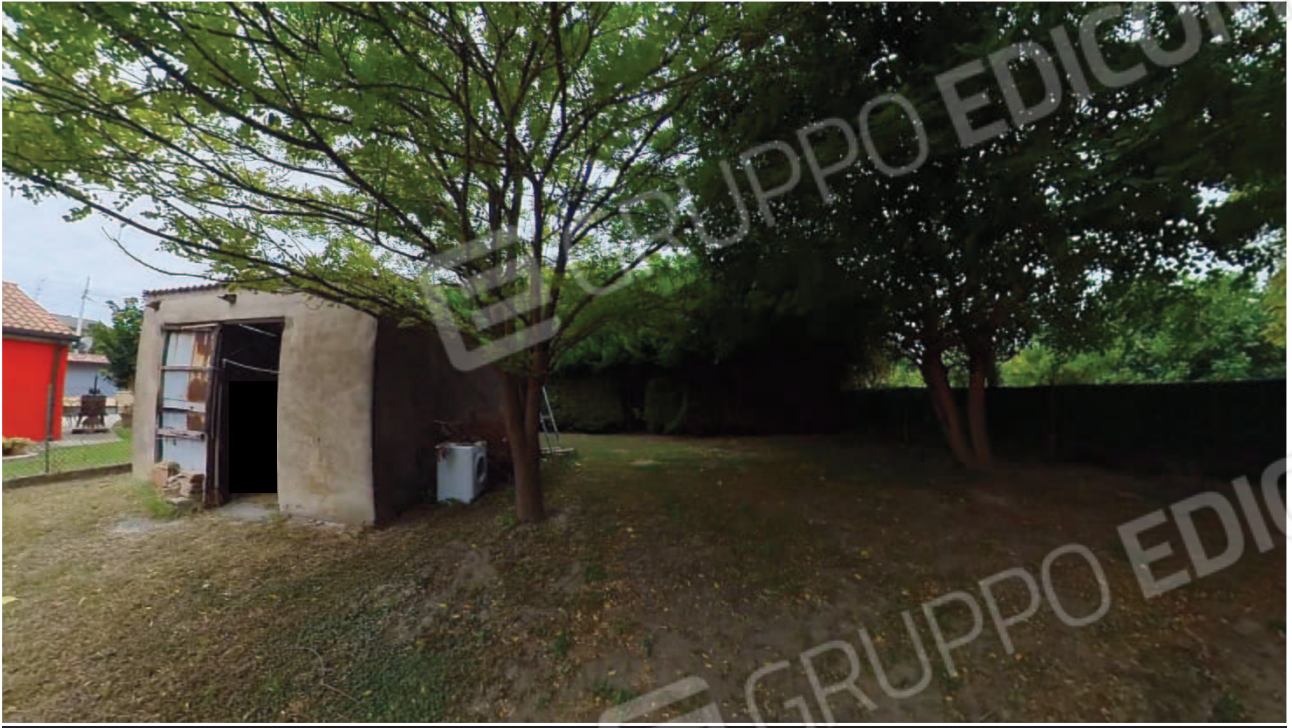
Figura 12 Pertinenza garage