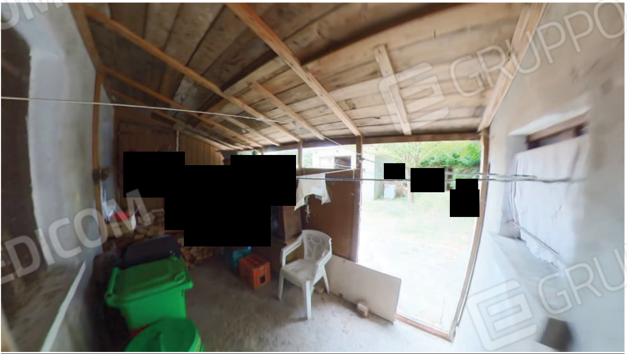
Figura 21 ampliamento abusivo