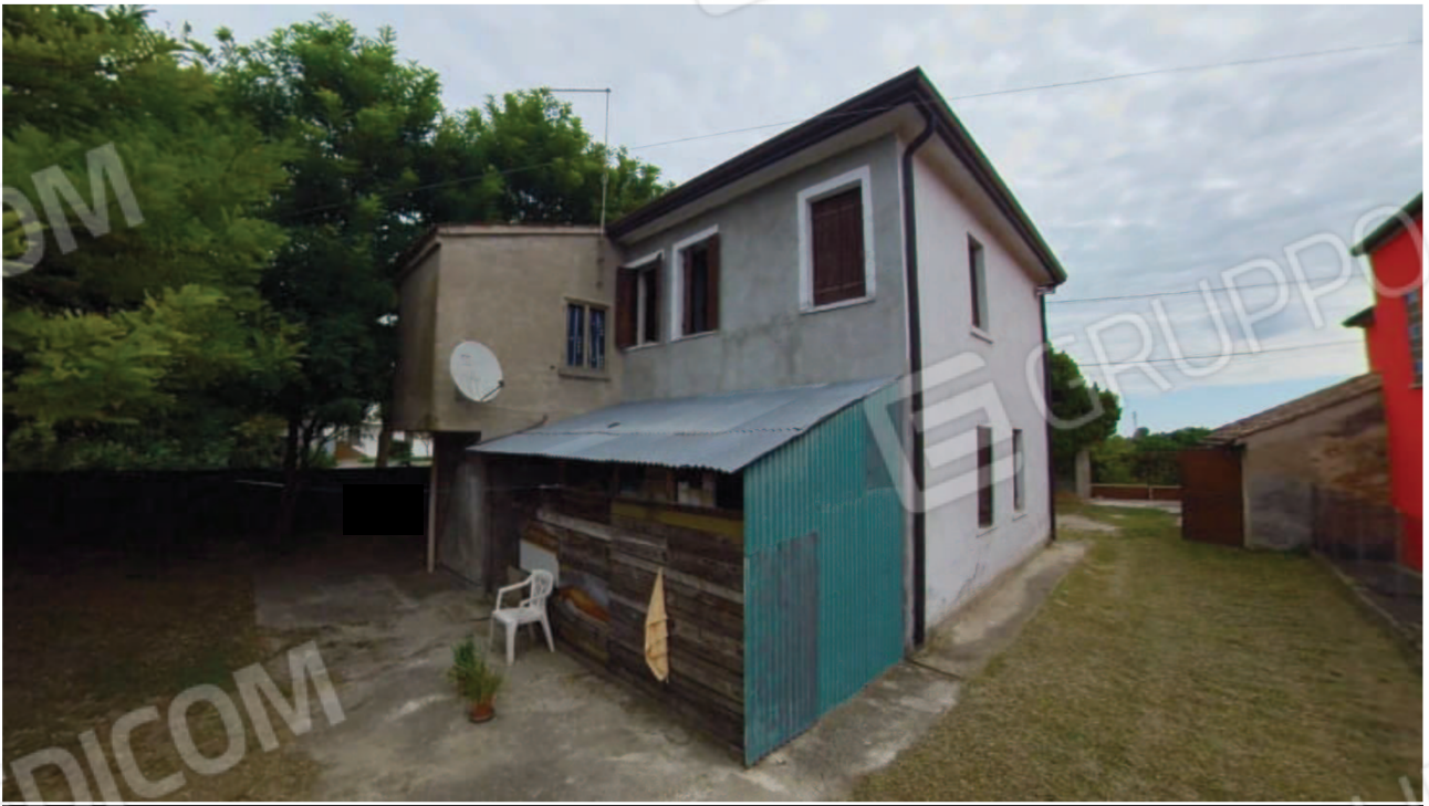
Figura 7 Esterno lati Sud e Ovest abitazione