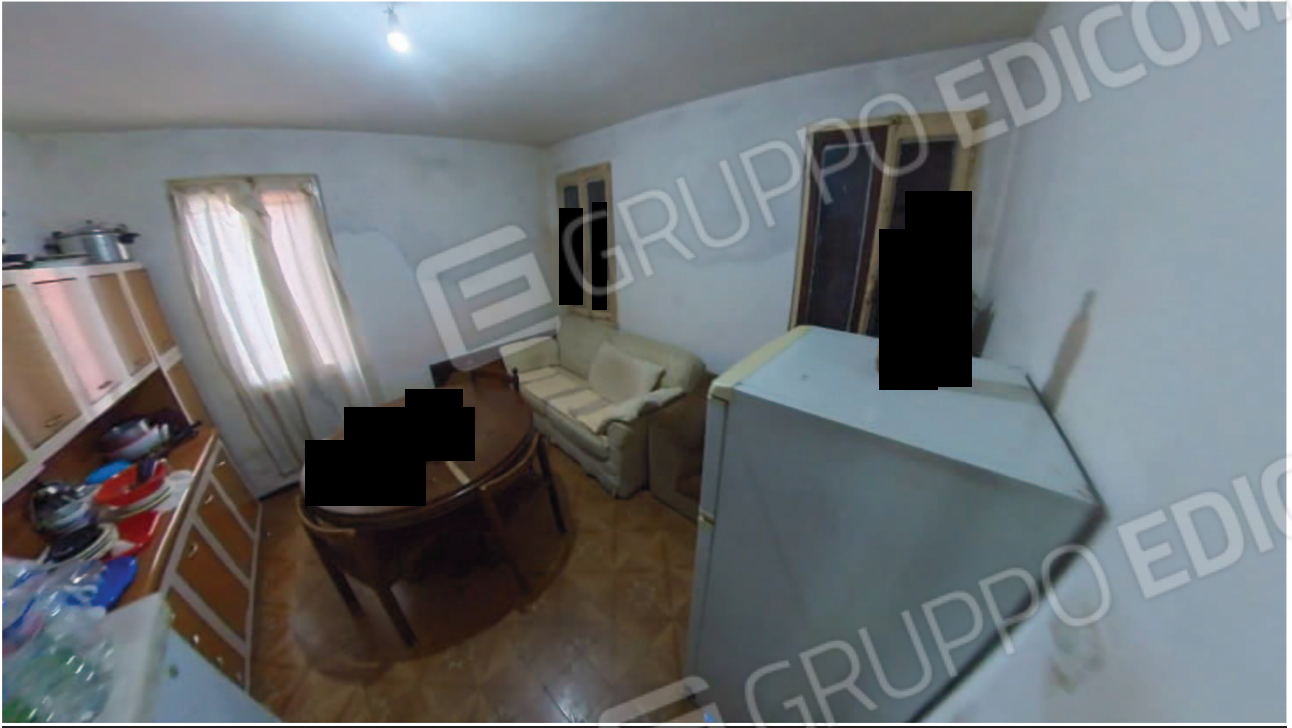
Figura 16 Interni abitazione piano terra