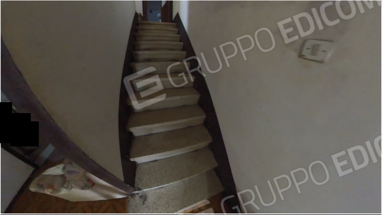
Figura 22 Interni abitazione piano terra