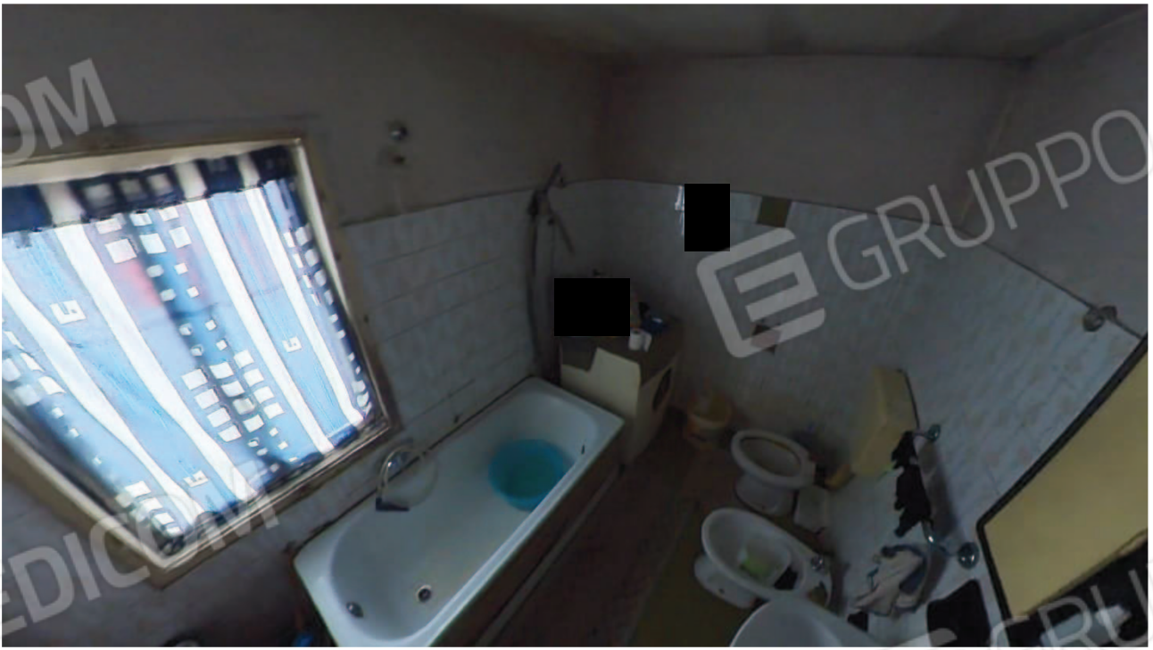
Figura 23 interni primo piano