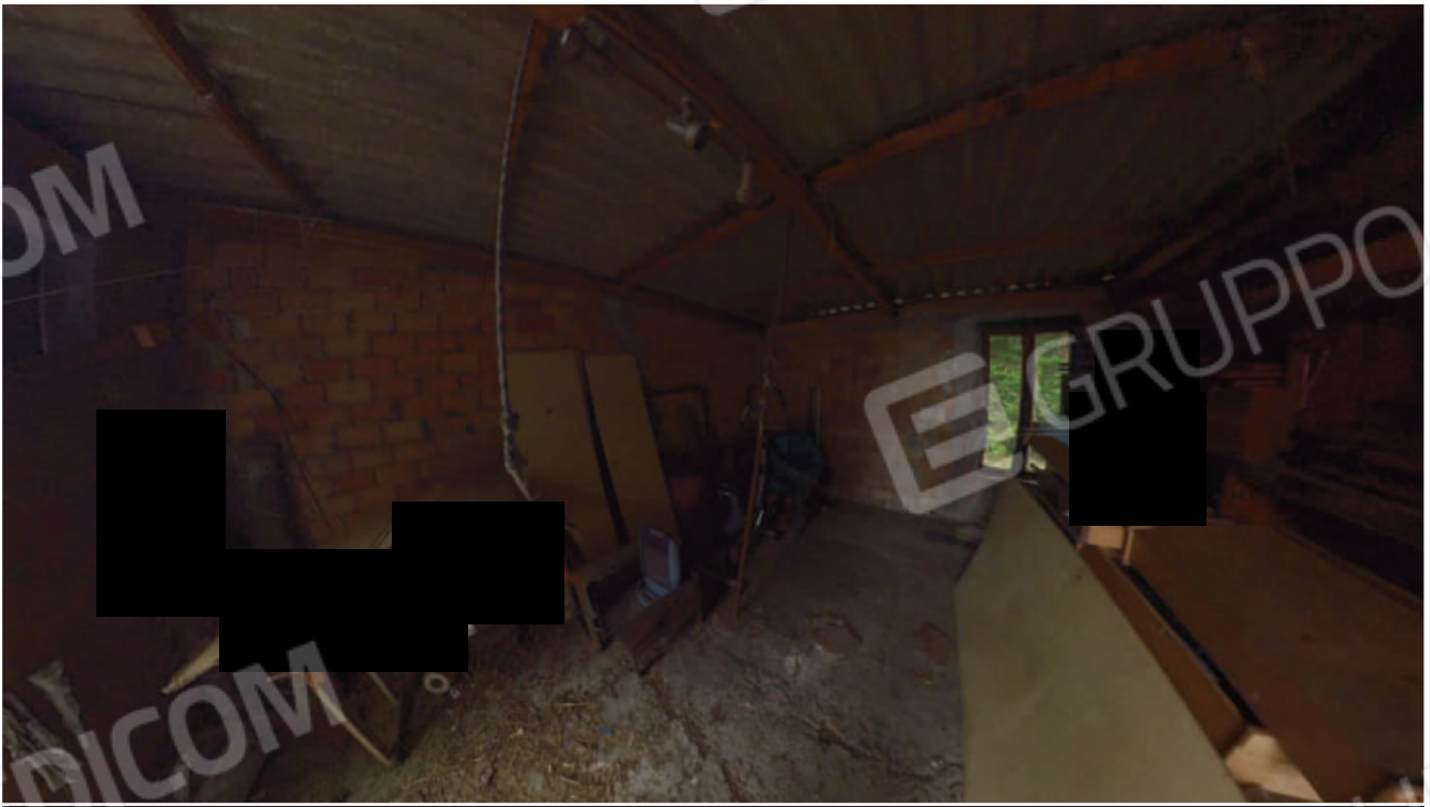
Figura 29 interno pertinenza mn 90 sub 3