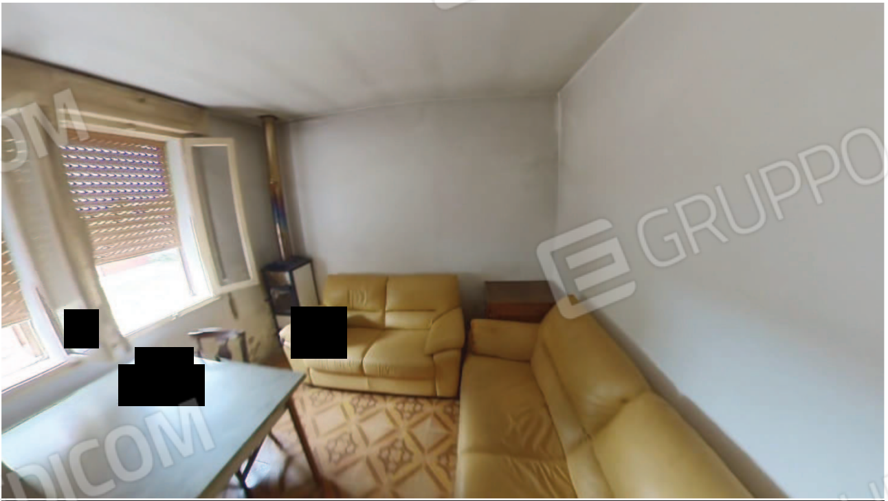
Figura 15 Interni abitazione piano terra