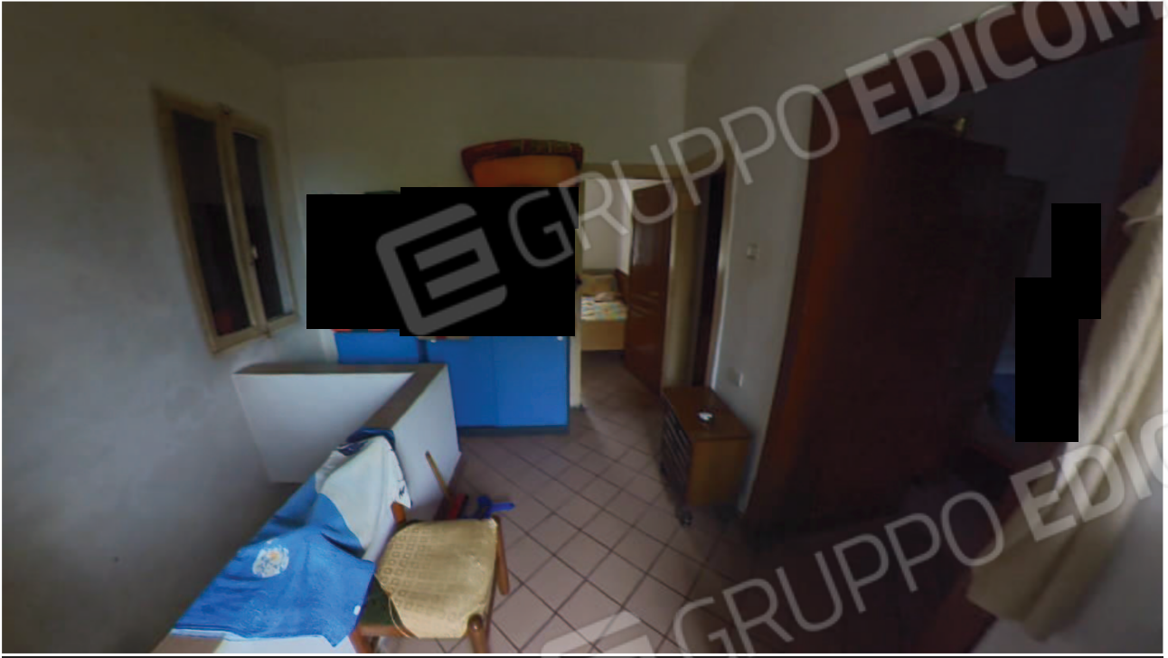
Figura 24 Interni abitazione primo piano