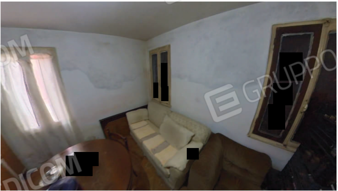
Figura 17 Interni abitazione piano terra