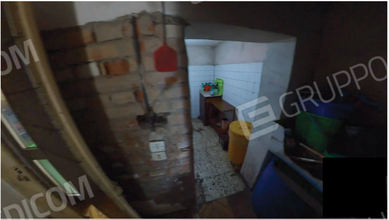
Figura 19 Interni abitazione piano terra