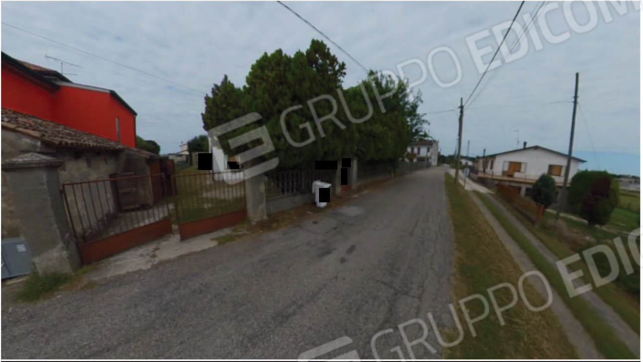
Figura 4 Veduta da Via Basse