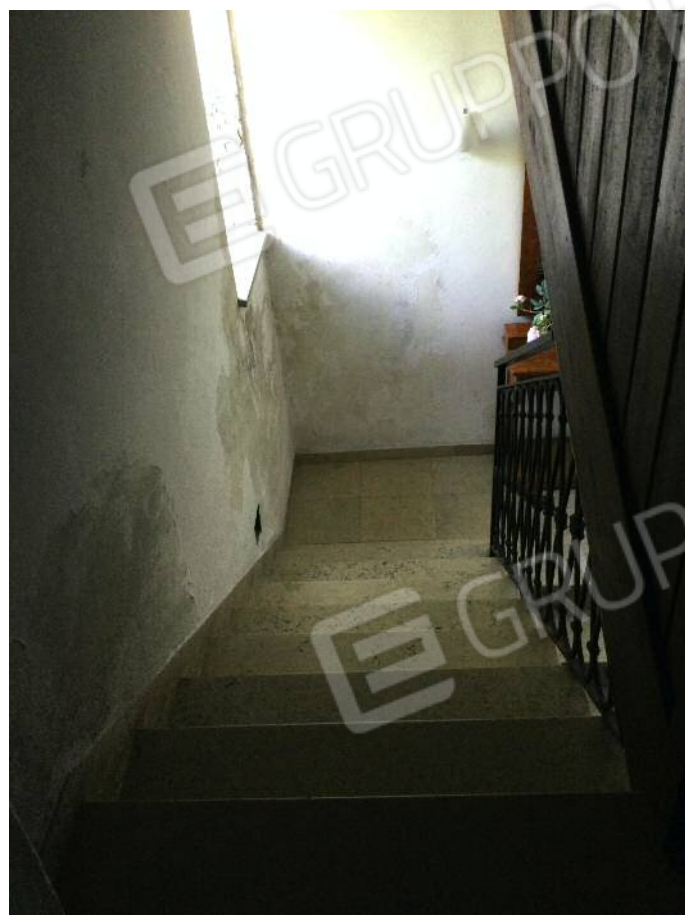
Vano scala comune