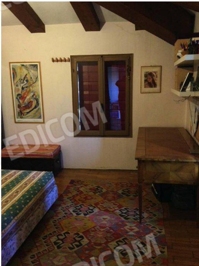
Camera (secondo piano)