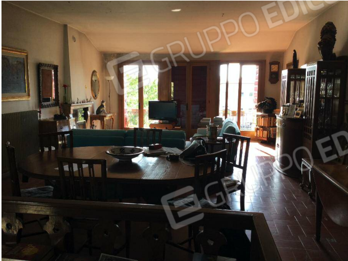
Soggiorno - pranzo (secondo piano)