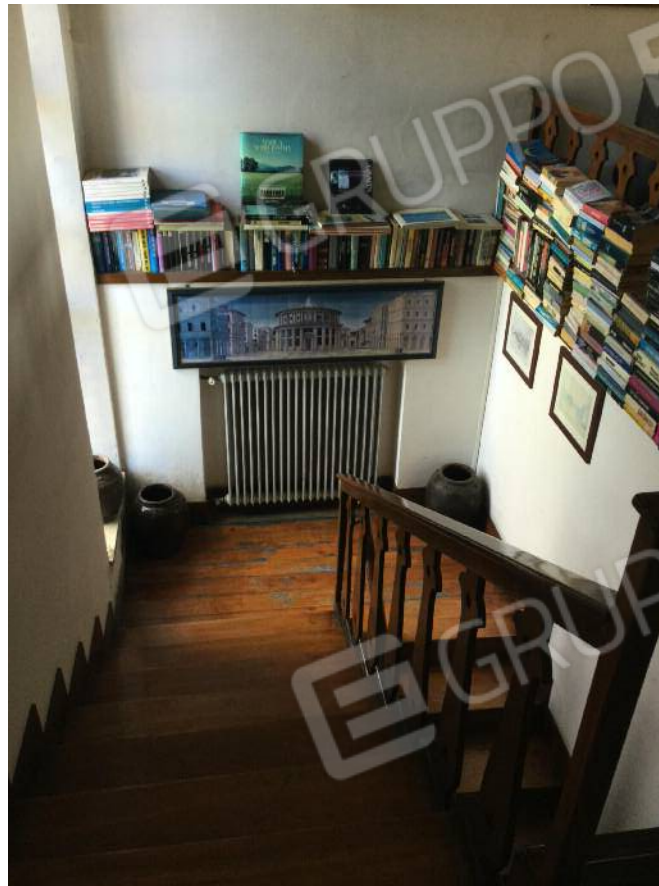
Vista sul vano scala interno (secondo piano)