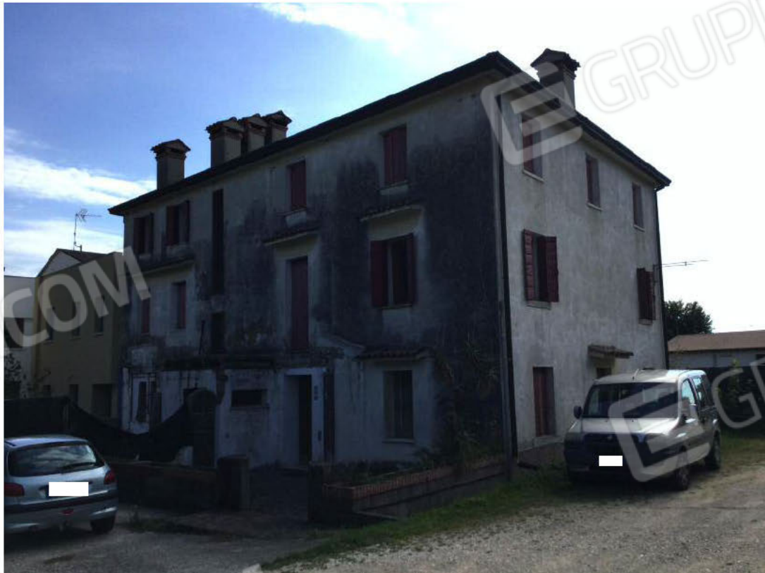
Prospetti Nord e Ovest dell'edificio (appartamento al secondo piano)