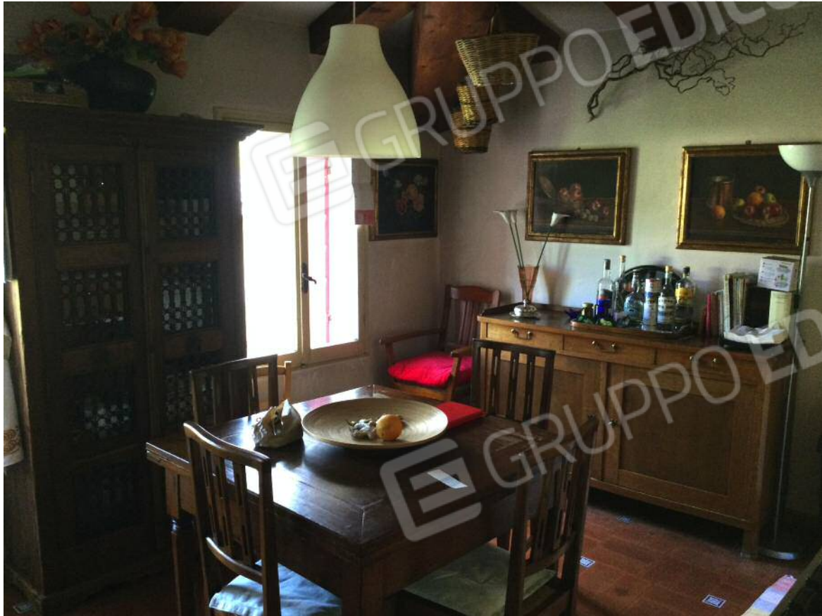
Cucina (secondo piano)