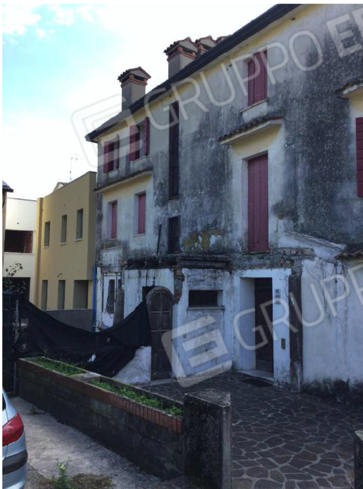
Dettaglio prospetto Nord dell'edificio (appartamento al secondo piano)