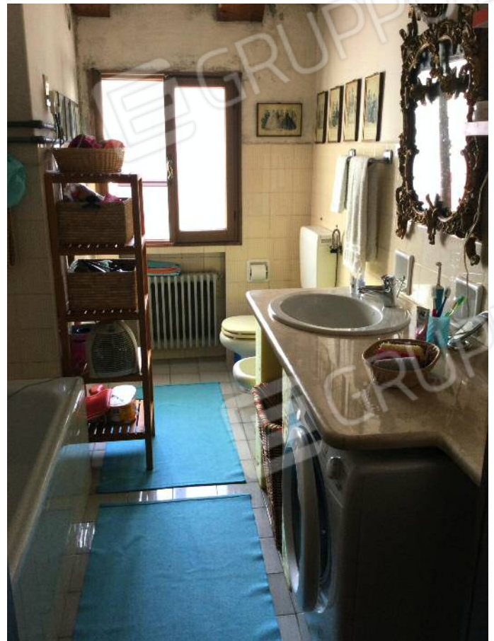
Bagno (secondo piano)