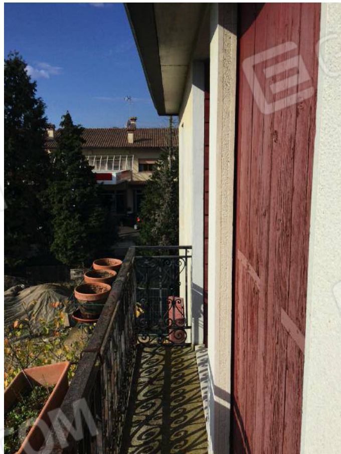
Balcone (secondo piano)