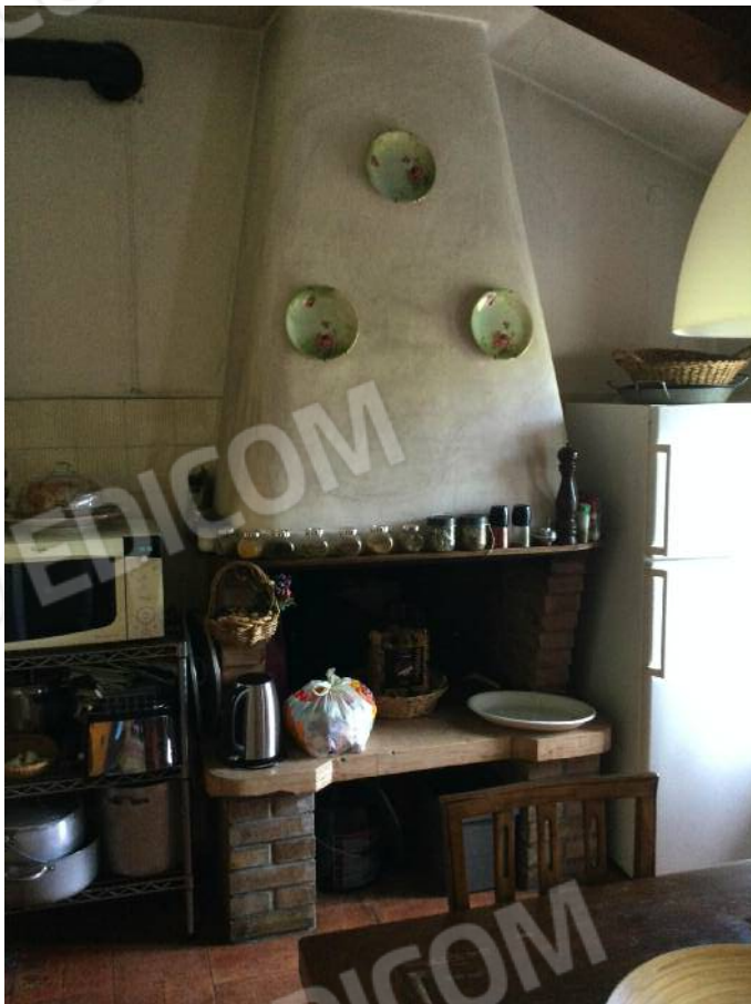
Cucina (secondo piano)