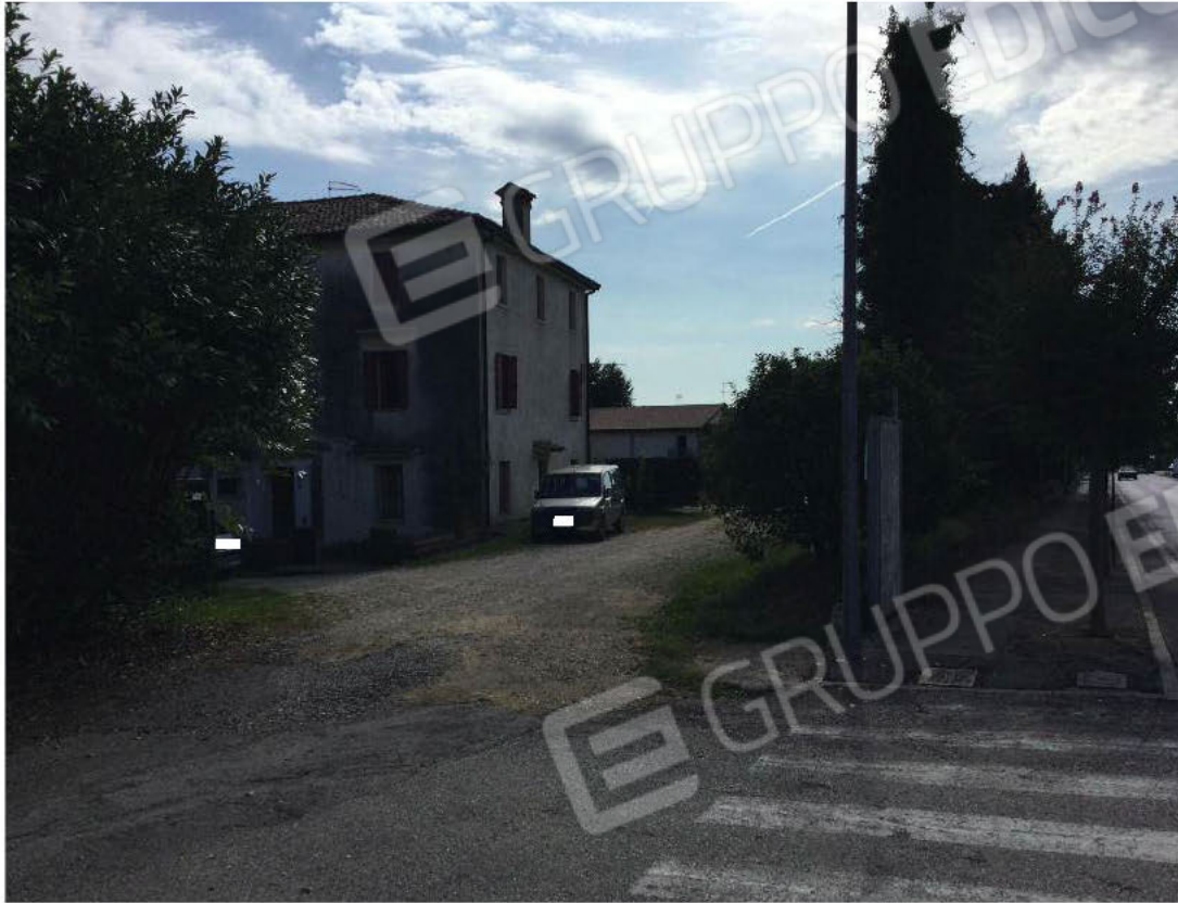
Scorcio prospetti Nord e Ovest dell'edificio (appartamento al secondo piano)