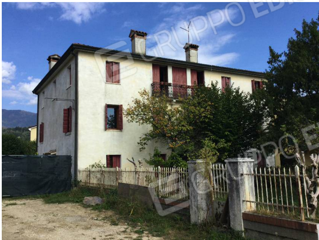
Prospetti Sud e Ovest dell'edificio (appartamento al secondo piano)