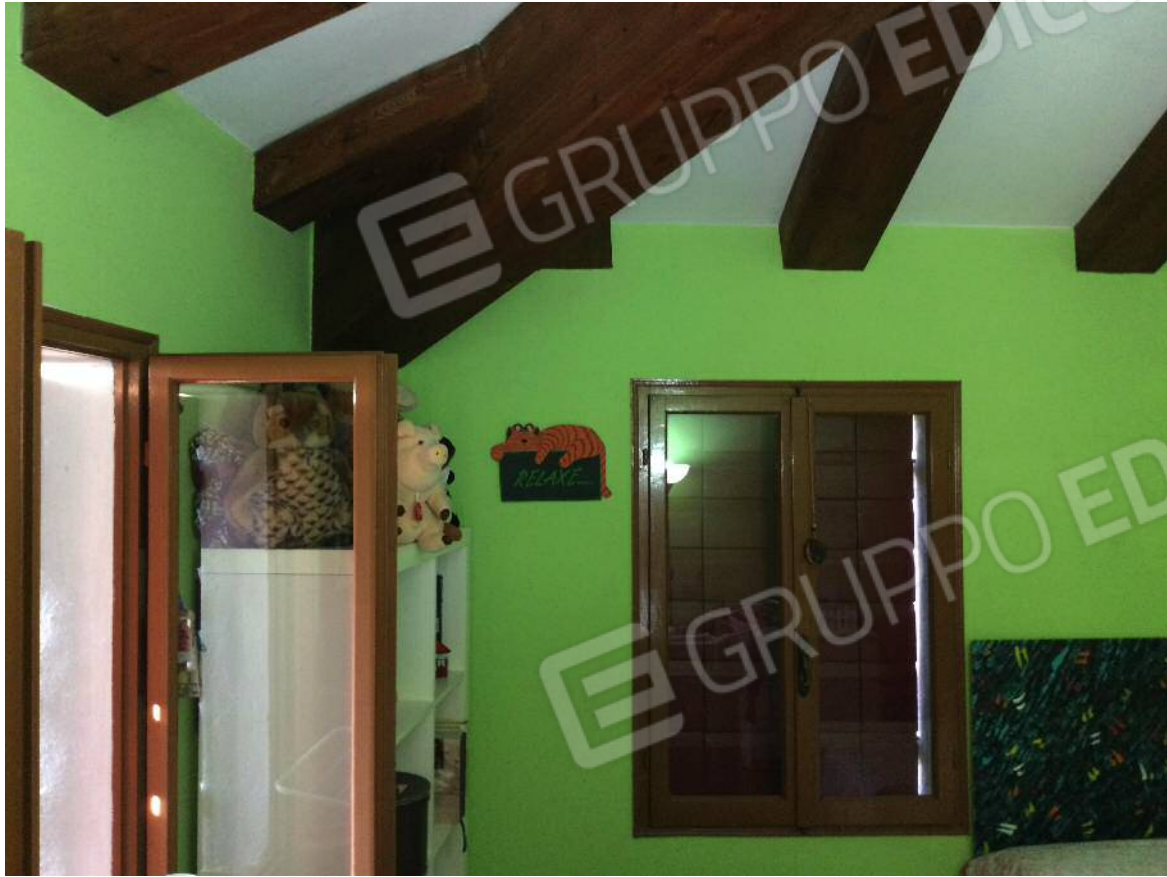
Camera (secondo piano)