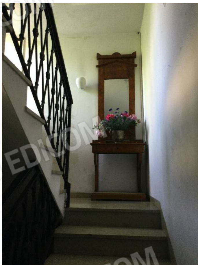
Vano scala comune