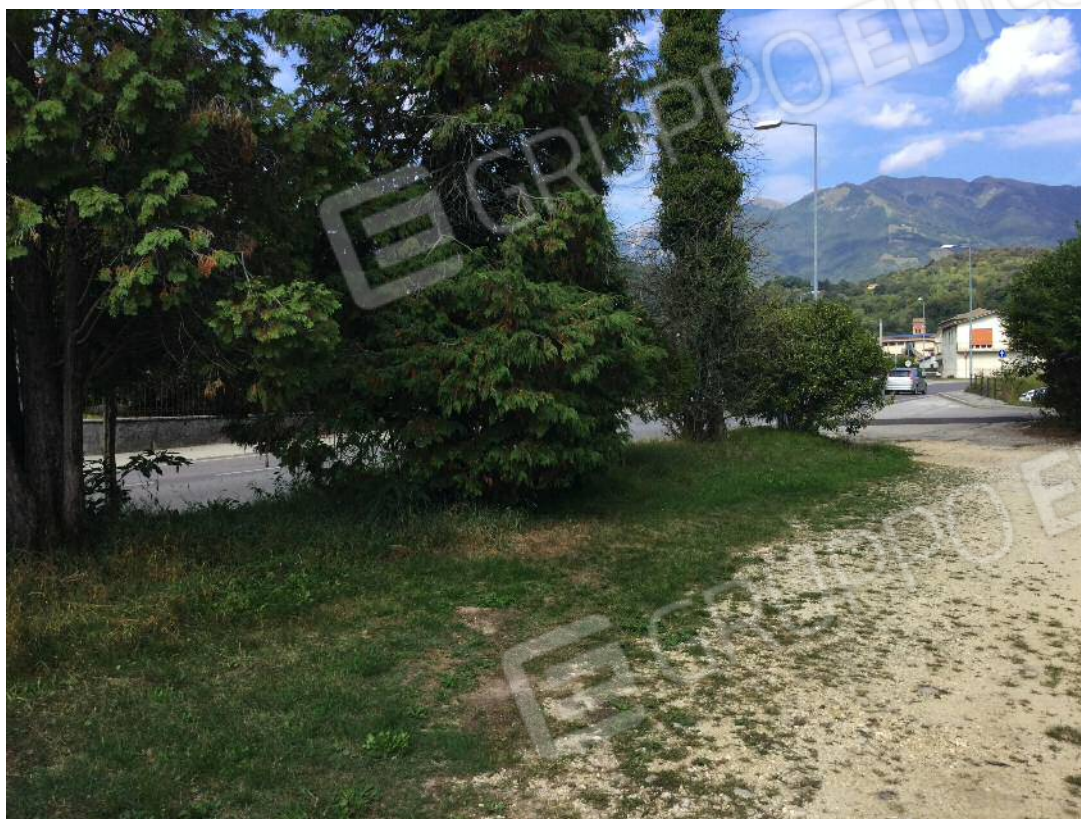
Area scoperta di pertinenza