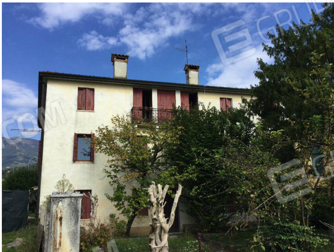
Prospetto Sud dell'edificio (appartamento al secondo piano)