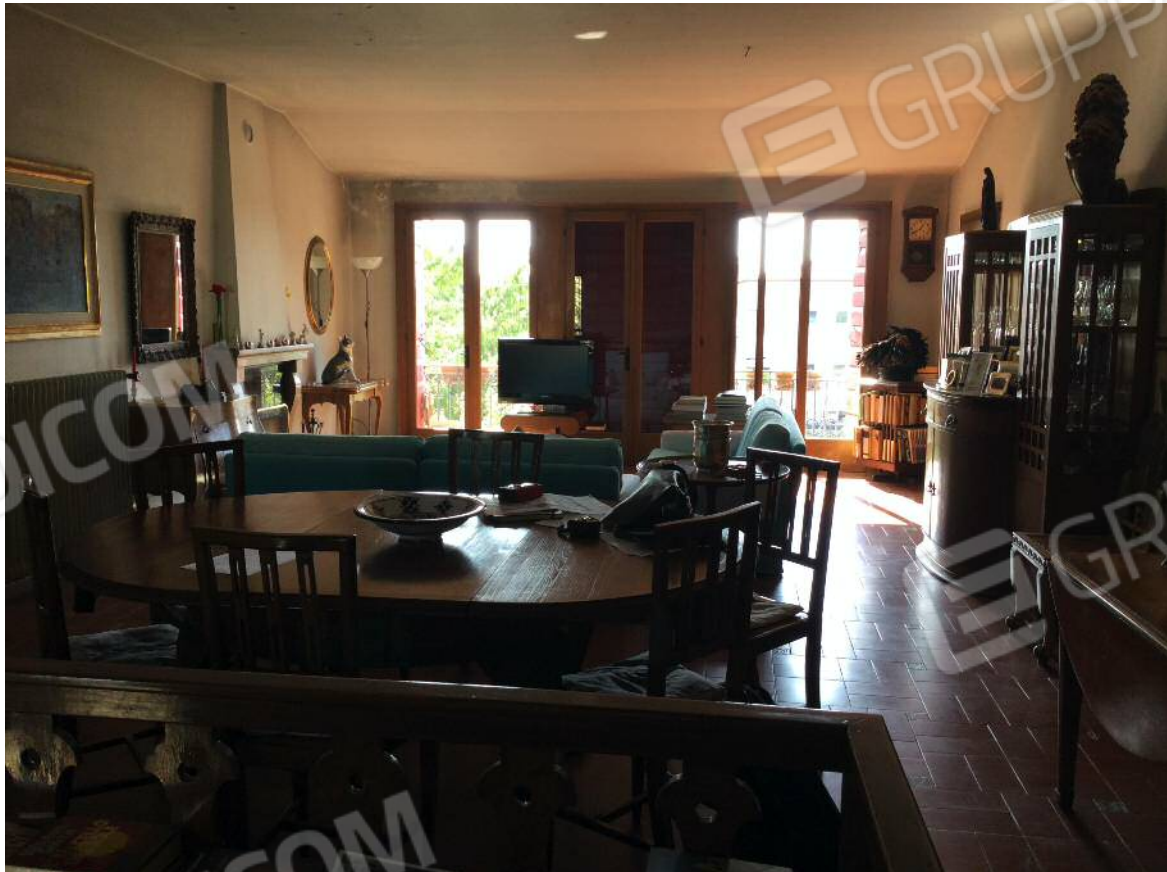
Soggiorno - pranzo (secondo piano)