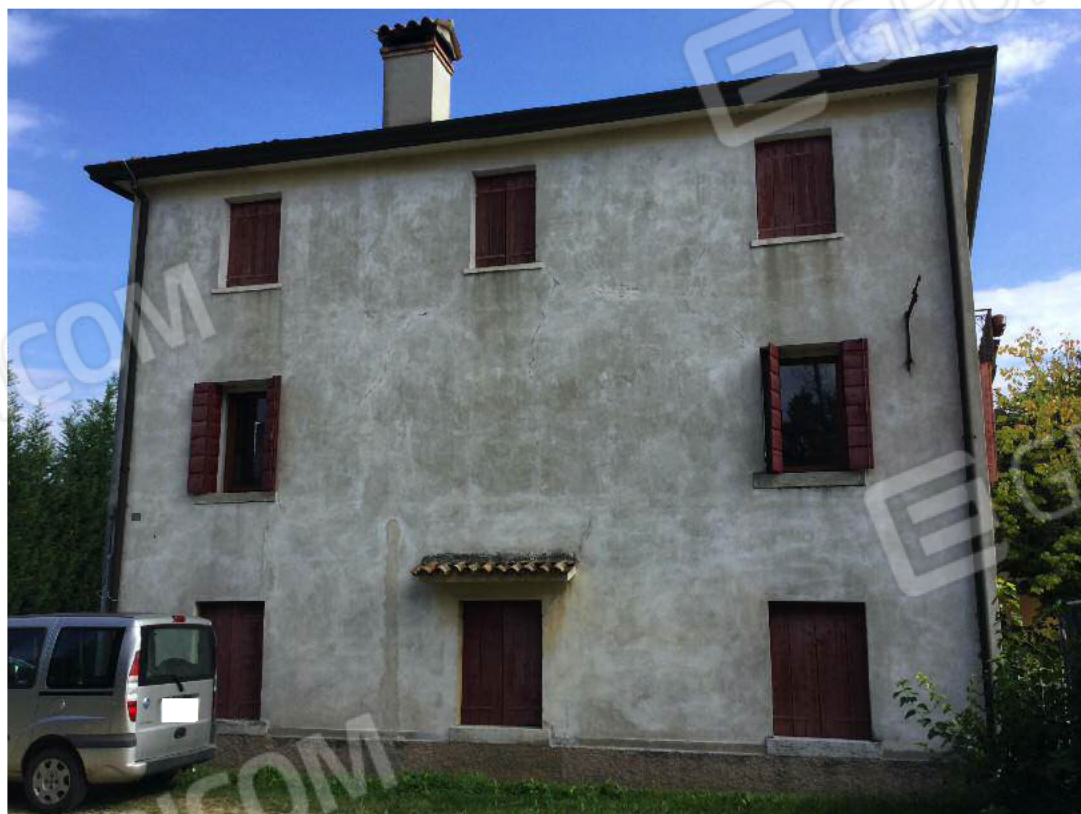
Prospetto Ovest dell'edificio (appartamento al secondo piano)