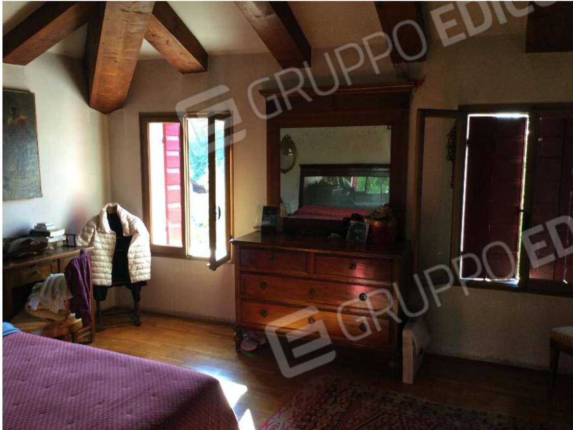
Camera (secondo piano)