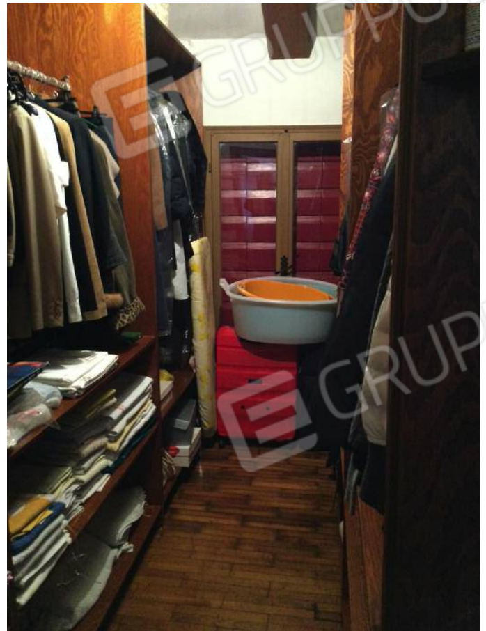
Ripostiglio (secondo piano)