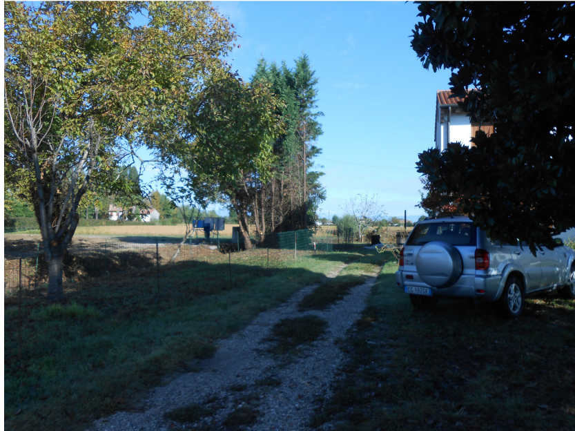
Figura 3: nuova rete di recinzione sul corretto confine (vista da metà giardino)