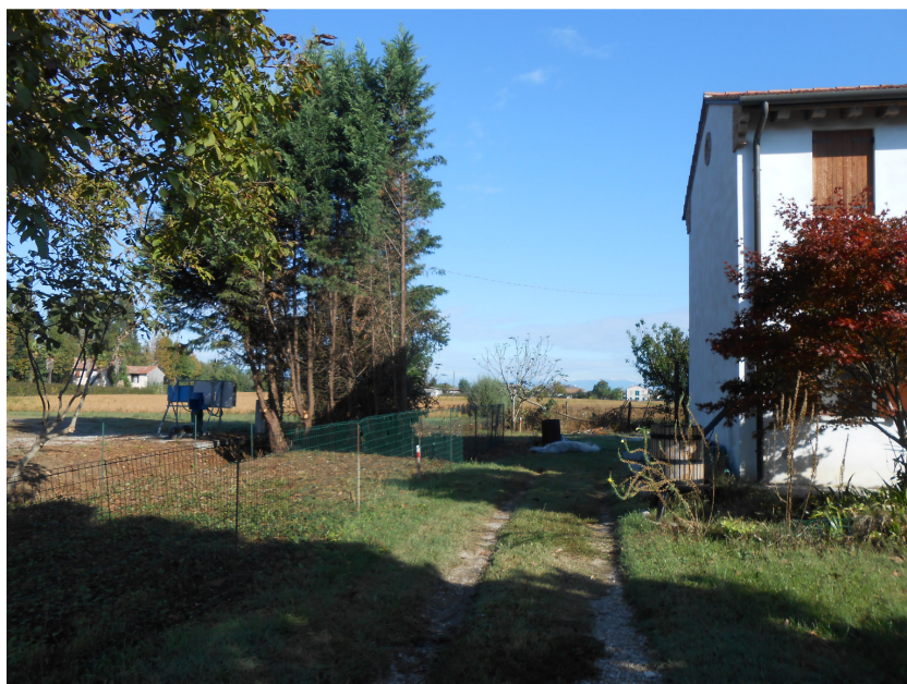
Figura 2: nuova rete di recinzione sul corretto confine

In data 29/09/2020 si effettuava un sopralluogo presso l'immobile, insieme al topografo incaricato dalla proprietà confinante oltre che ad un amministratore della stessa proprietà. In quell'occasione, lo scrivente effettuava rilievi fotografici (riportati nelle Figure 2, 3 e 4) della nuova recinzione e, con l'ausilio di un collaboratore di studio, procedeva ad un rilievo sommario del posizionamento dei picchetti – e della stessa recinzione – rispetto all'immobile, tramite cordella metrica. Anche tale verifica forniva esito positivo (non veniva eseguita dallo scrivente una verifica di dettaglio dei punti di posizionamento dei picchetti e della recinzione tramite stazione GPS o stazione totale integrata, lasciando eventualmente tale approfondimento al futuro acquirente).