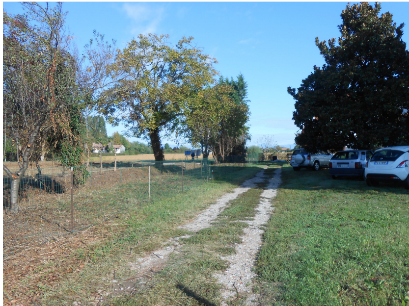
Figura 4: nuova rete di recinzione posizionata in corrispondenza del corretto confine (vista dall'ingresso del giardino)