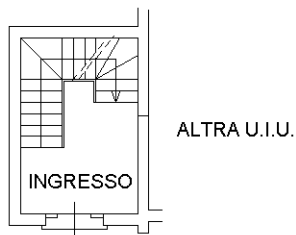
PIANO TERRA H.3.00