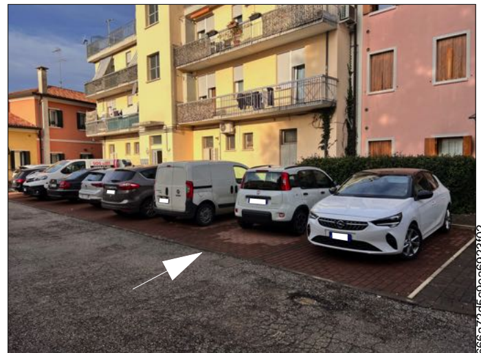
- FOTO - Q.ta 1/3 area urbana Sez C. - Fg 7 Mappale 548 - Sub 60 graffato Mappale 275 - Sub 18