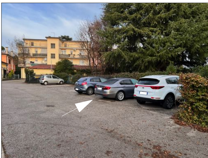
- FOTO - Q.ta 1/10 area urbana Sez C. - Fg 7 Mappale 548 - Sub 62 graffato Mappale 275 - Sub 22