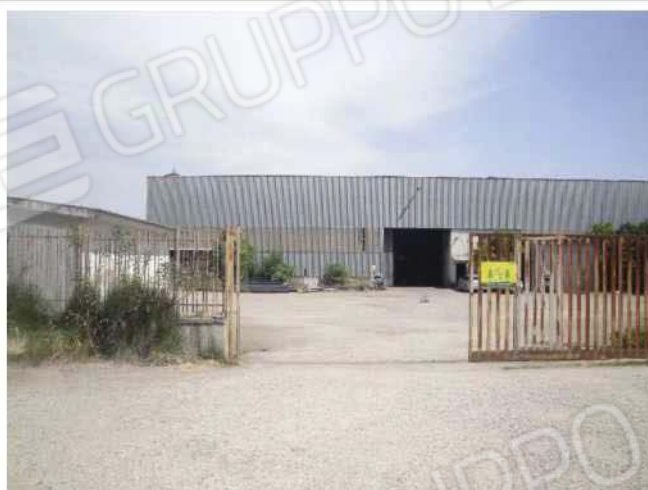
Ingresso carrabile su piazzale esterno non compreso nel cespite pignorato