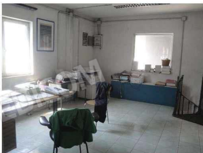
Ufficio – piano soppalco