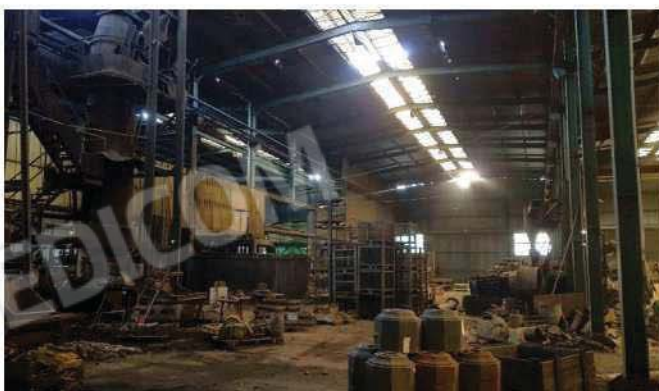
Vista da lato est