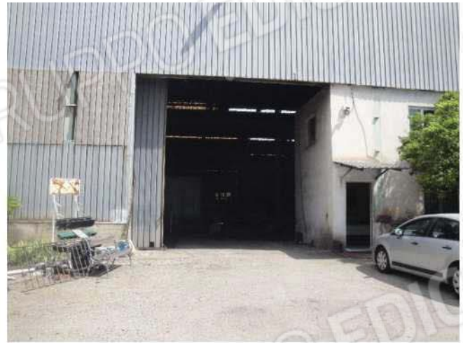
Esterno fabbricato - portone principale di accesso sul prospetto sud e ingresso zona uffici