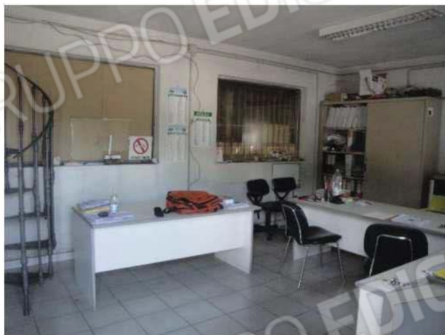
Ufficio – piano terra