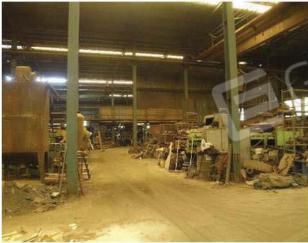
Vista da lato nord