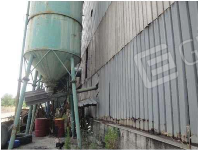
Particolare tamponamenti con corrosione passante - spigolo sud-ovest