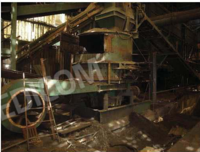
Vecchia linea produzione fonderia