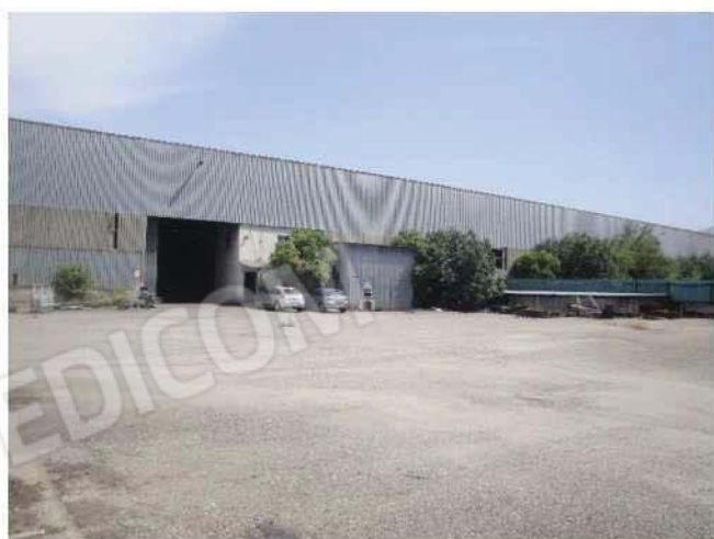
Esterno fabbricato - lato sud da piazzale esterno non compreso nel cespite pignorato