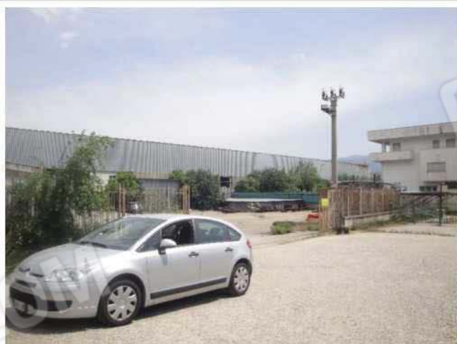
Ingresso carrabile su piazzale esterno non compreso nel cespite pignorato