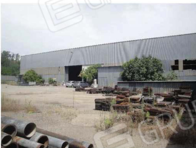
Esterno fabbricato - lato sud da piazzale esterno non compreso nel cespite pignorato

DOCUMENTAZIONE FOTOGRAFICA ESTERNO FABBRICATO – PAG. 1 DI 6