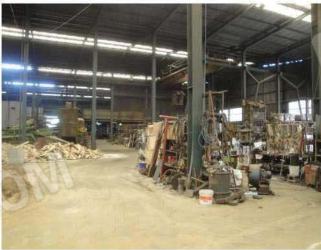
Vista da lato nord-est