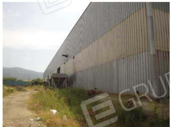
Esterno fabbricato lato nord