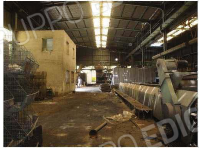
Vista da lato sud-est