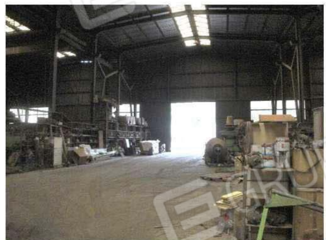
Apertura laterale - vista da lato est

DOCUMENTAZIONE FOTOGRAFICA INTERNO FABBRICATO – PAG. 3 DI 6