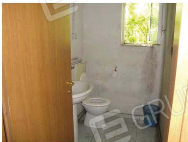
Ufficio – bagno piano soppalco

DOCUMENTAZIONE FOTOGRAFICA INTERNO FABBRICATO – PAG. 5 DI 6