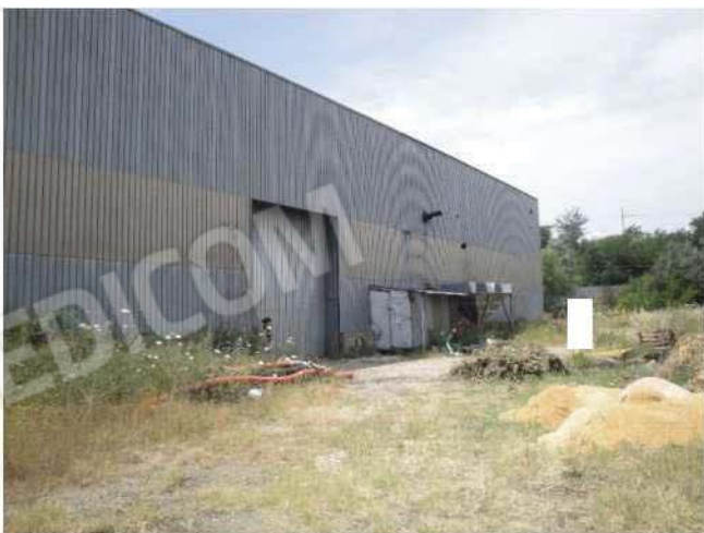
Esterno fabbricato lato nord