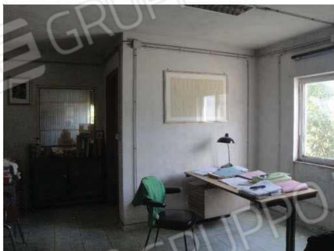
Ufficio – piano soppalco