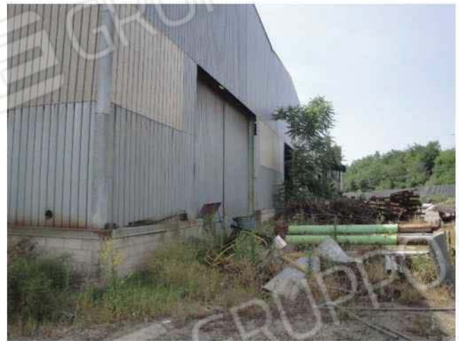
Esterno fabbricato lato ovest