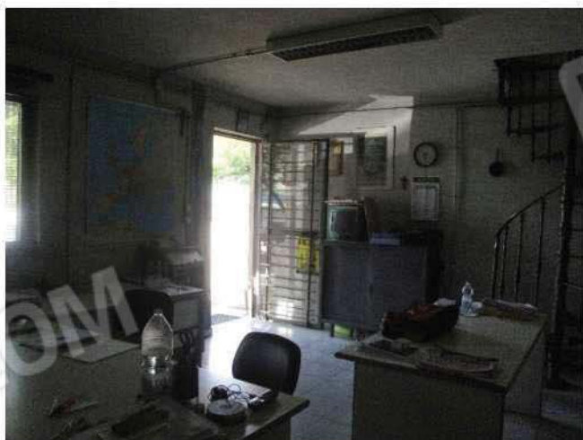
Ufficio – piano terra