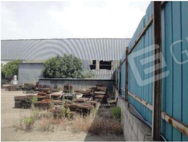
Esterno fabbricato - lato sud da piazzale esterno non compreso nel cespite pignorato