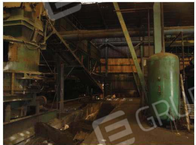
Vecchia linea produzione e cunicoli fonderia

DOCUMENTAZIONE FOTOGRAFICA INTERNO FABBRICATO – PAG. 4 DI 6