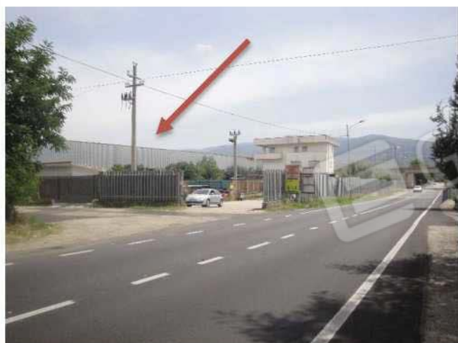
Contesto urbanistico - vista da Strada Comunale Coda di Volpe