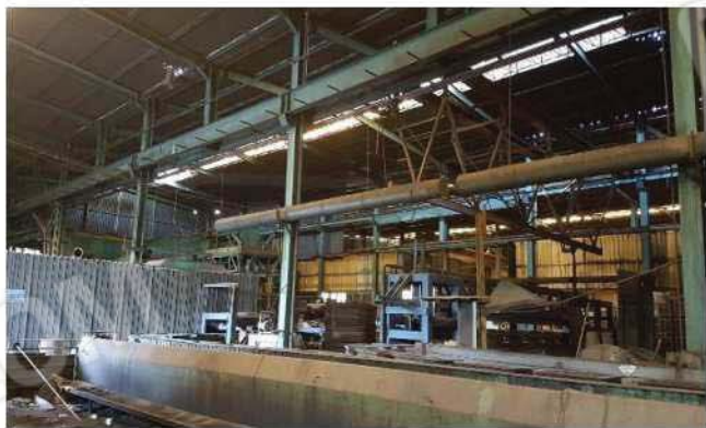
Vista da lato sud-est