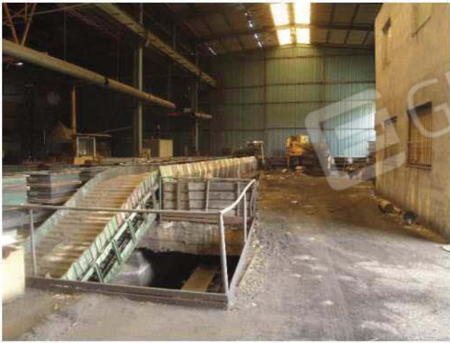
Vista da ingresso principale verso est