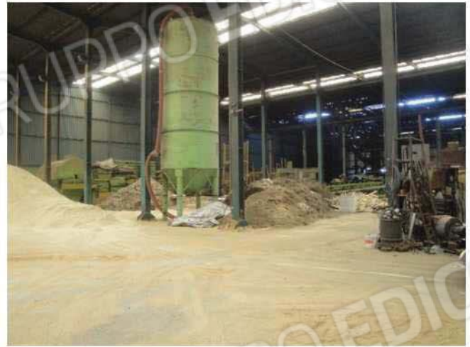
Vista da lato nord-ovest