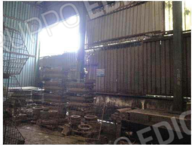
Particolare tamponamenti danneggiati con lastra di vetroresina traslucida mancante - lato sud-est