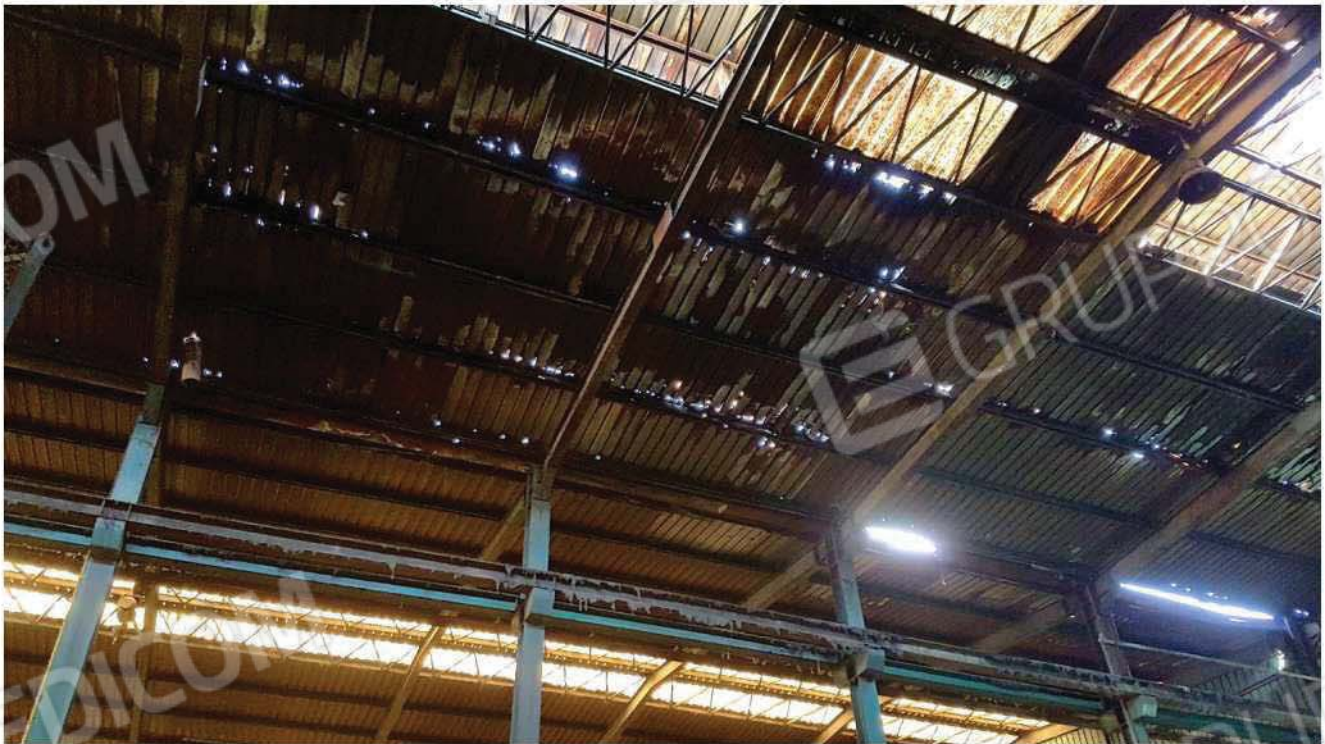
Particolare copertura con corrosione passante

DOCUMENTAZIONE FOTOGRAFICA INTERNO FABBRICATO – PAG. 6 DI 6