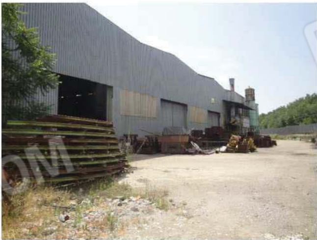
Esterno fabbricato lato ovest