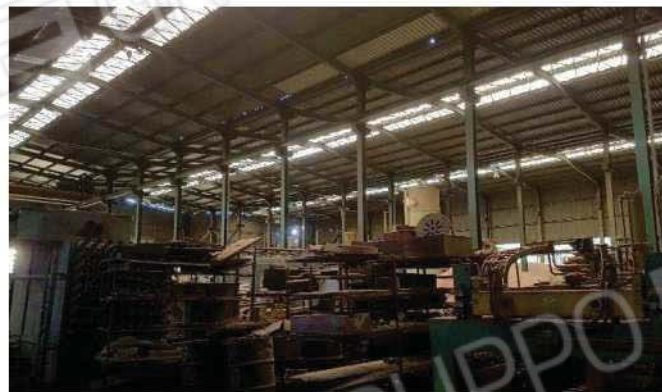
Vista da lato sud-est