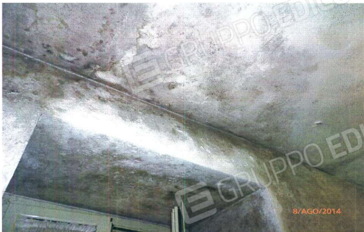
PARTICOLARE INFILTRAZIONE D'ACQUA

COMUNE DI MONTALTO UFFUGO (CS), Foglio n° 29, Particella n° 264 Sub 1.