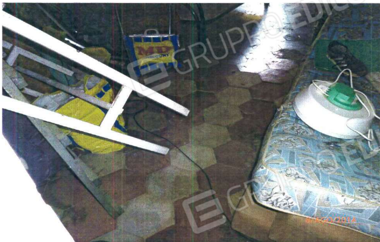
PARTICOLARE DI UN PAVIMENTO

COMUNE DI MONTALTO UFFUGO (CS), Foglio n° 29, Particella n° 264 Sub 1.