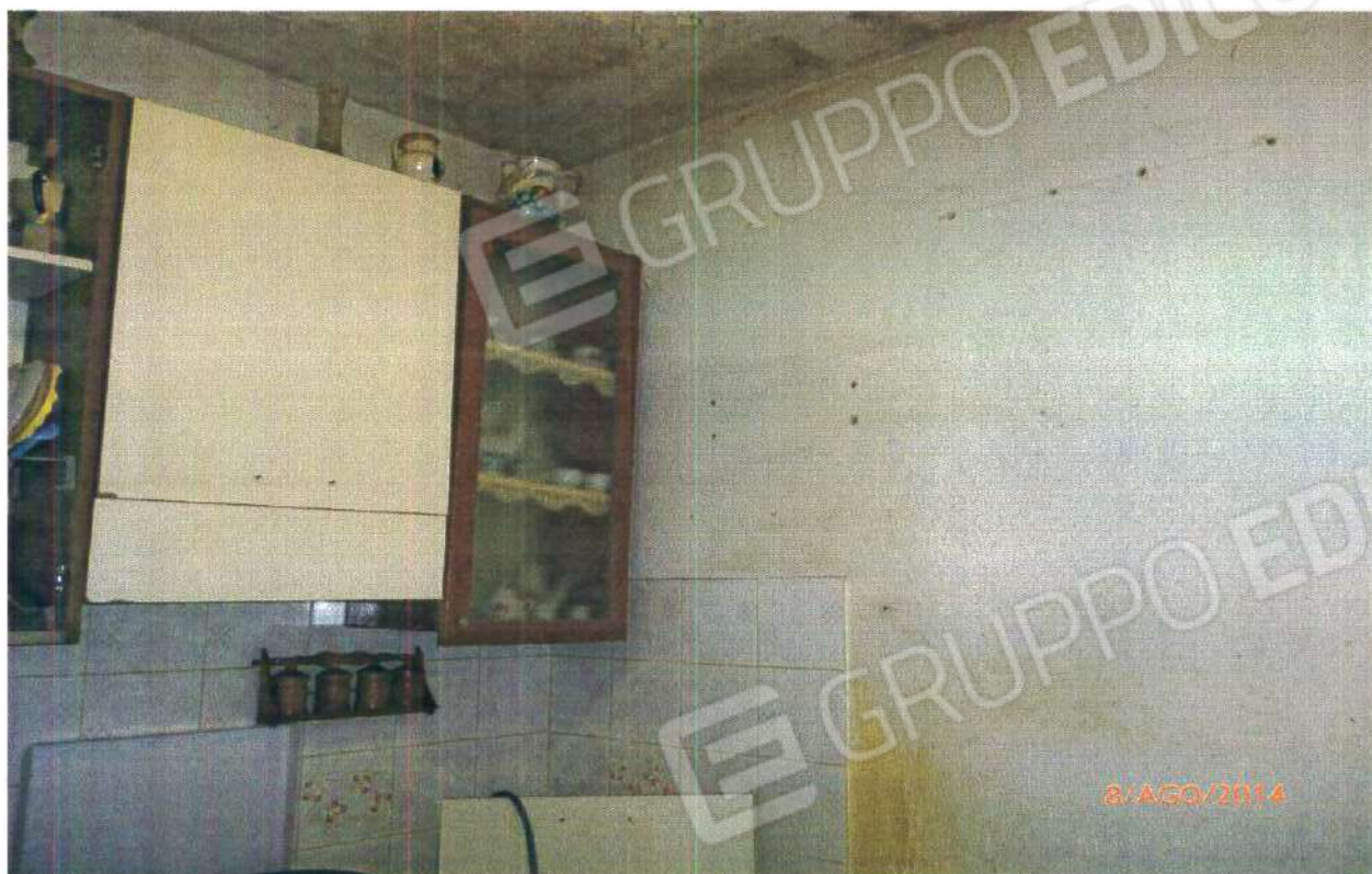
PIANO PRIMO: CUCINA

COMUNE DI MONTALTO UFFUGO (CS), Foglio n° 29, Particella n° 264 Sub 1.