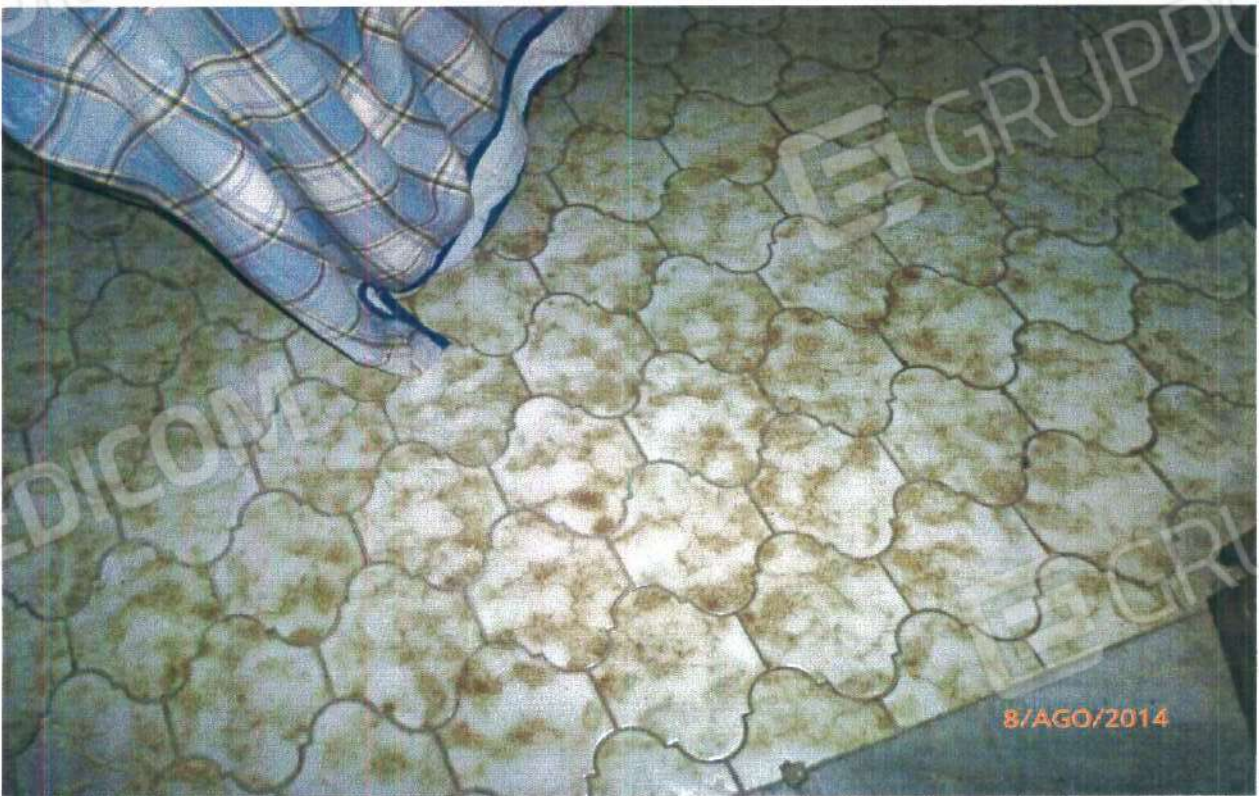
PARTICOLARE DI UN PAVIMENTO