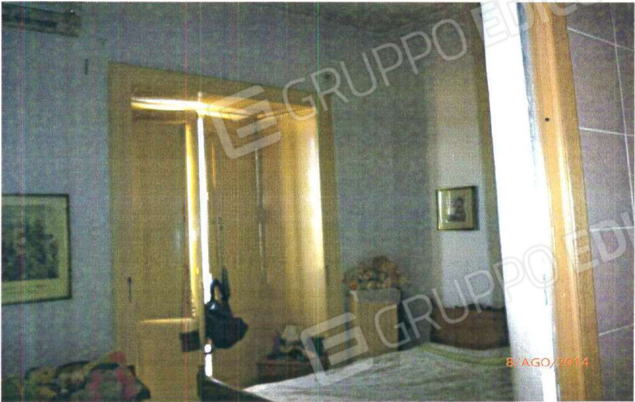
PIANO PRIMO: CAMERA MATRIMONIALE

COMUNE DI MONTALTO UFFUGO (CS), Foglio n° 29, Particella n° 264 Sub 1.