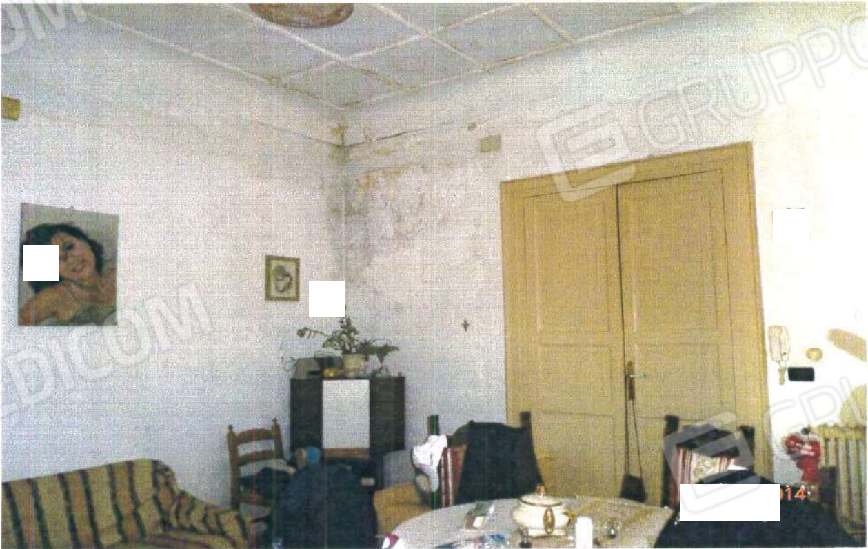
PIANO PRIMO: PRANZO/TINELLO