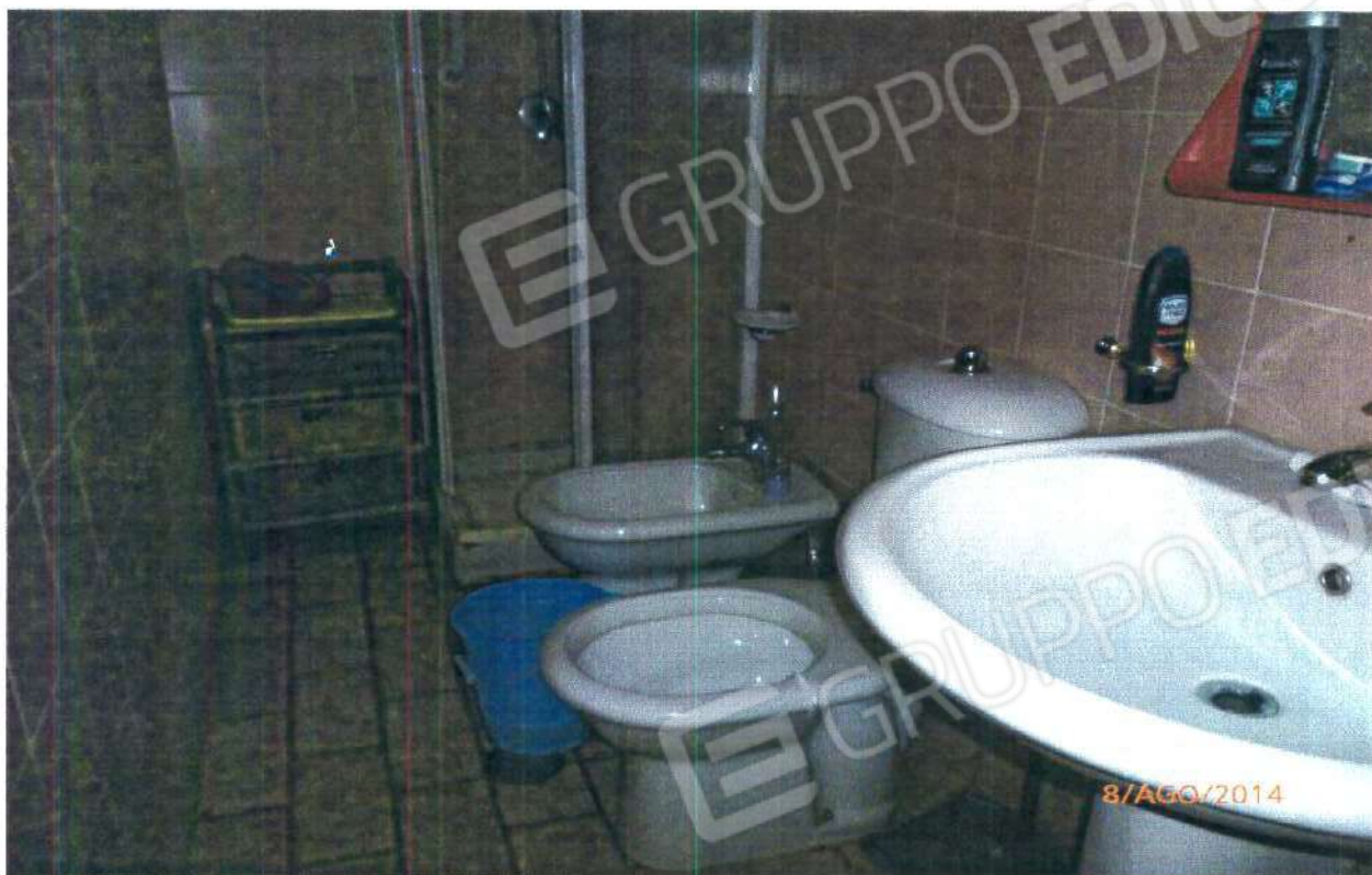
PIANO PRIMO: W.C. DELLA CAMERA MATRIMONIALE

COMUNE DI MONTALTO UFFUGO (CS), Foglio n° 29, Particella n° 264 Sub 1.