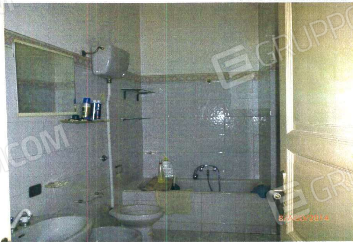
PIANO PRIMO: BAGNO