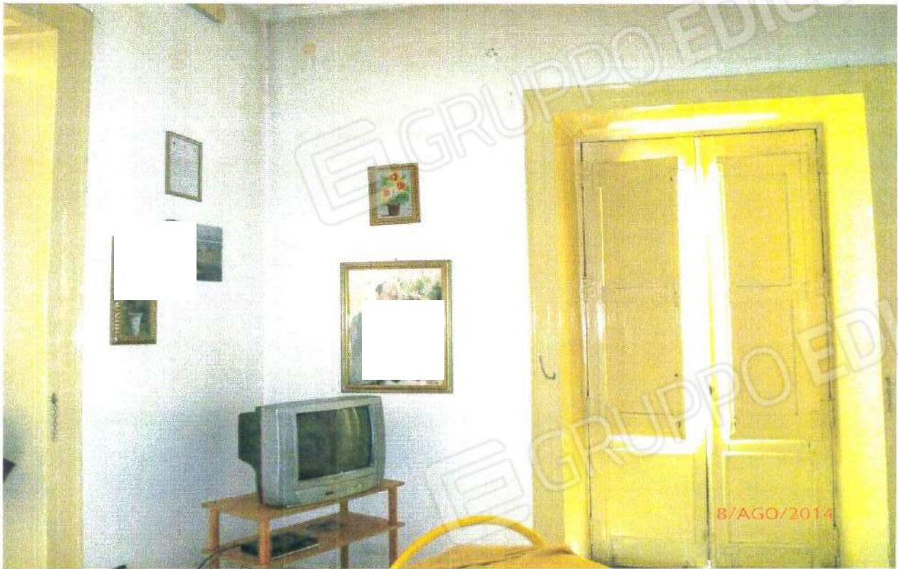
PIANO PRIMO: SOGGIORNO

COMUNE DI MONTALTO UFFUGO (CS), Foglio n° 29, Particella n° 264 Sub 1.