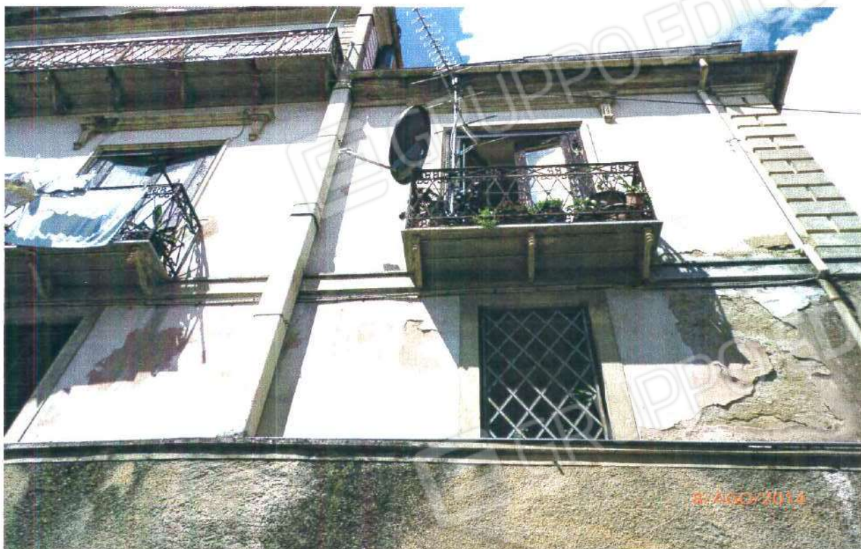
UMIDITA' SULLA FACCIATA OVEST

COMUNE DI MONTALTO UFFUGO (CS), Foglio n° 29, Particella n° 264 Sub 1.