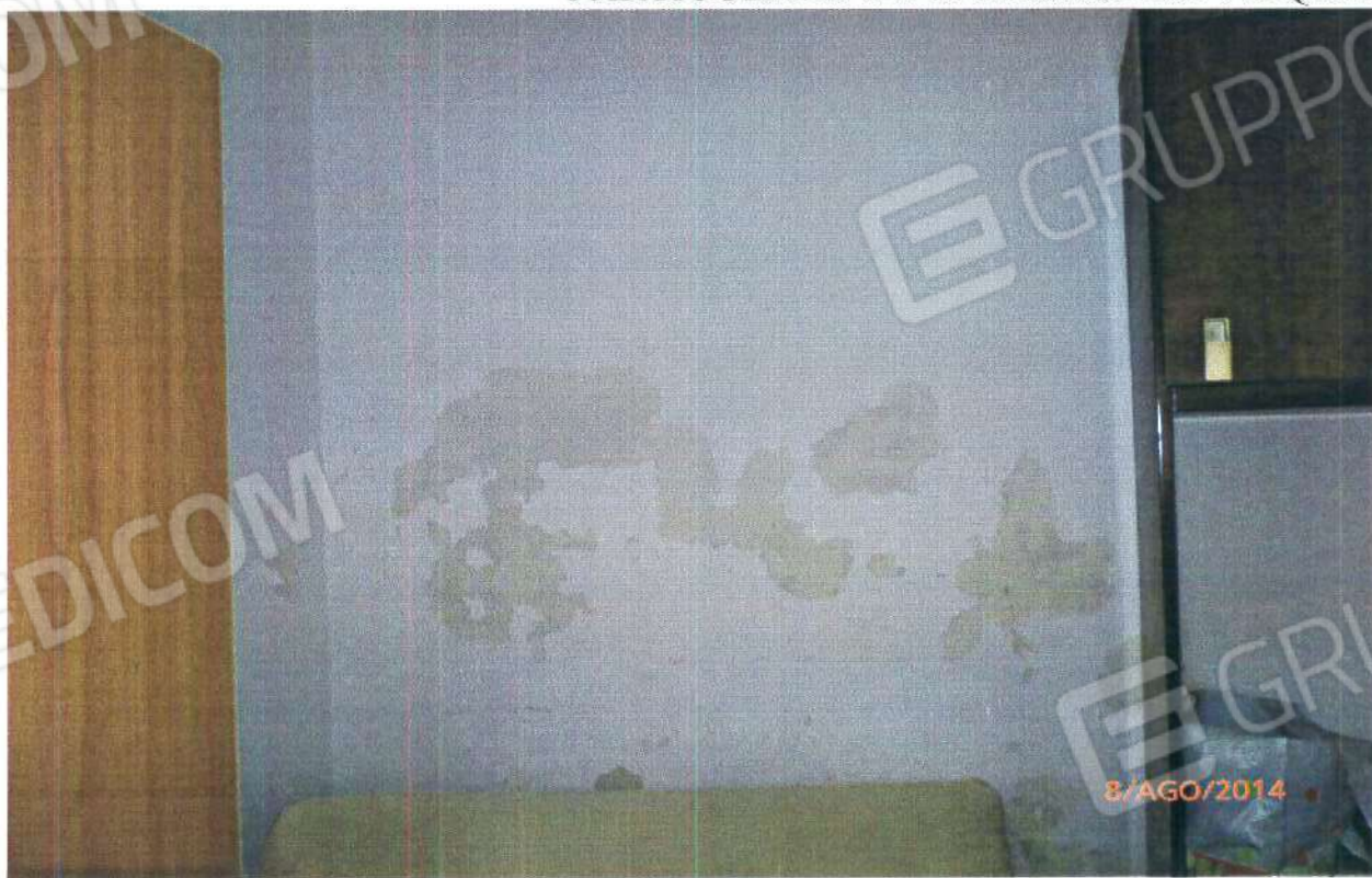
PARTICOLARE INFILTRAZIONE D'ACQUA