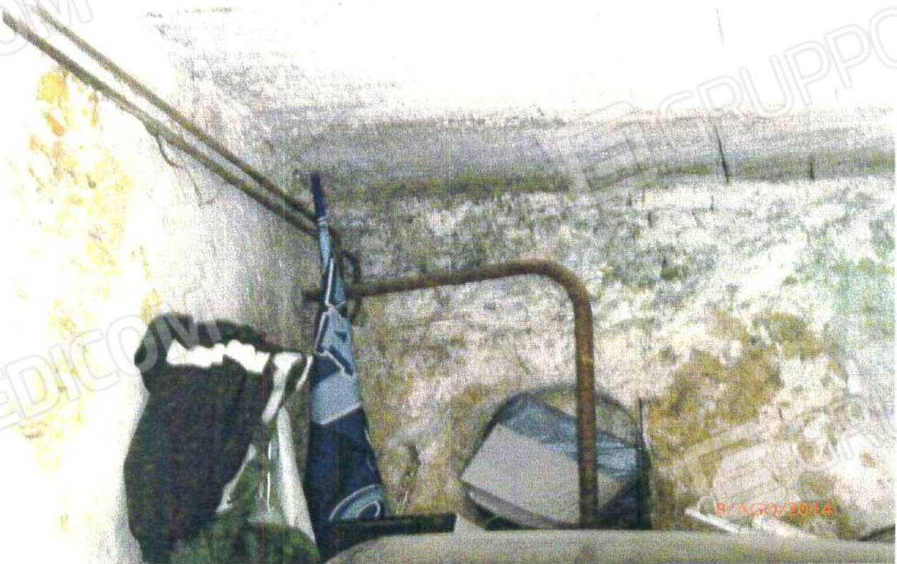
LOCALE CANTINA: INTERNO