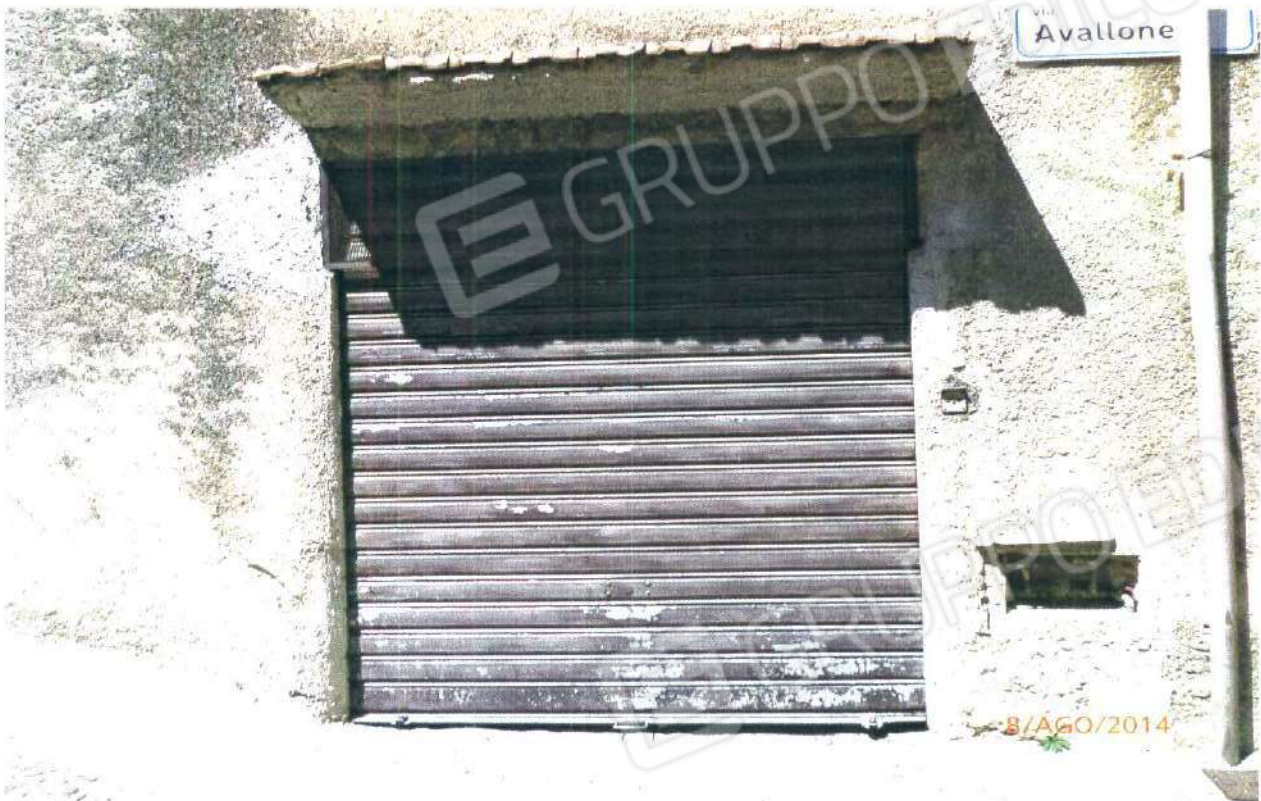
LOCALE CANTINA SU VIA AVALLONE

COMUNE DI MONTALTO UFFUGO (CS), Foglio n° 29, Particella n° 264 Sub 1.