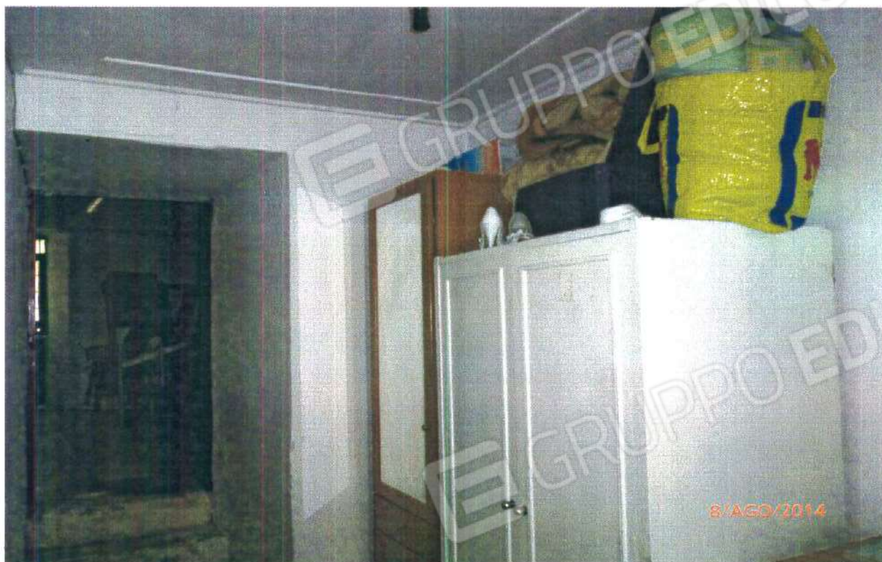
PIANO TERRA: LOCALE DI DISIMPEGNO

COMUNE DI MONTALTO UFFUGO (CS), Foglio n° 29, Particella n° 264 Sub 1.