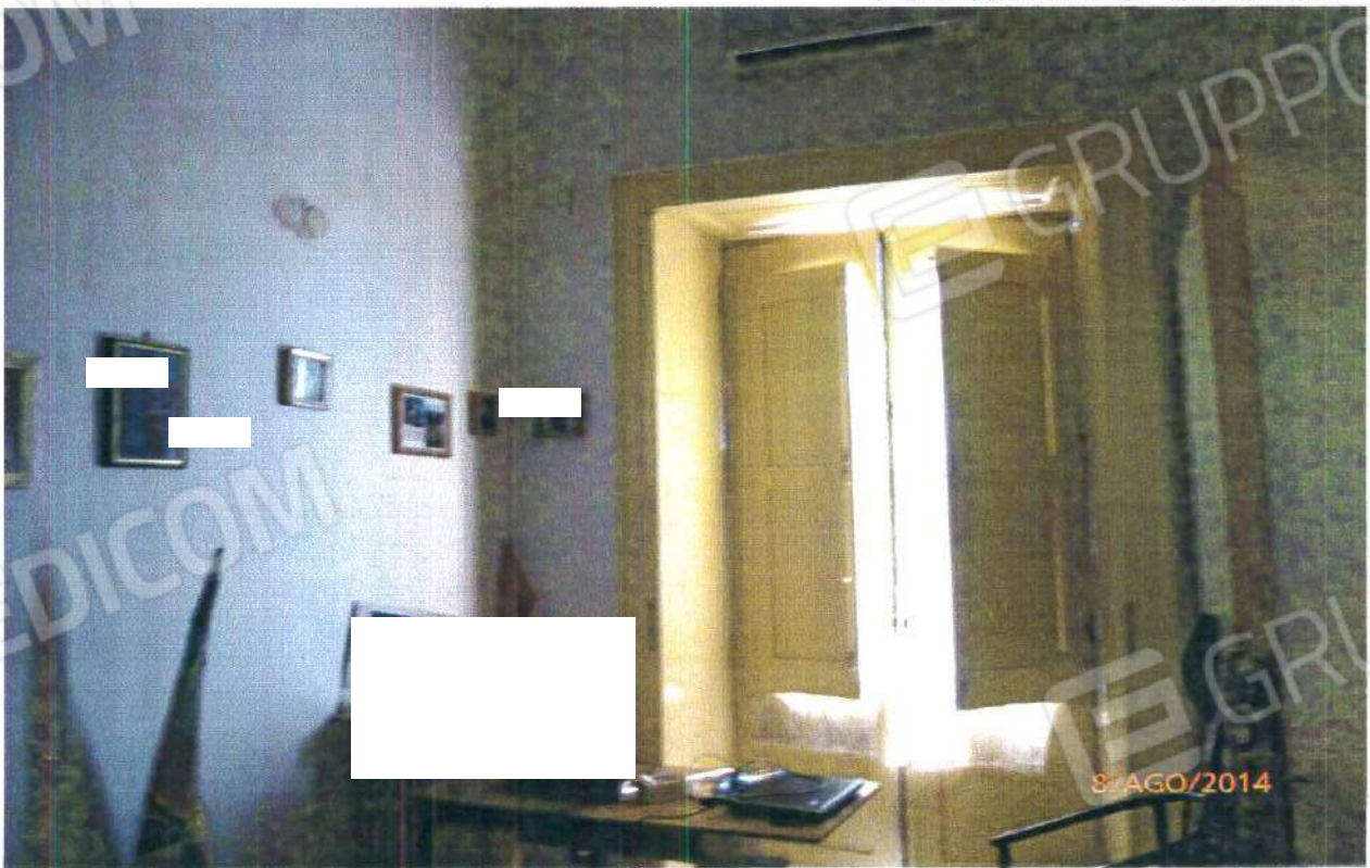
PIANO PRIMO: CAMERA