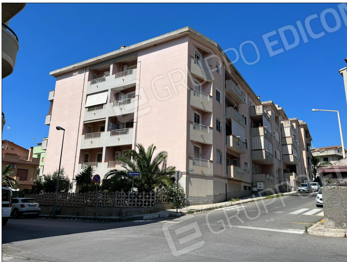
Foto 3: Vista condominio "Le Palme" Via Micene 58 Villa San Giovanni