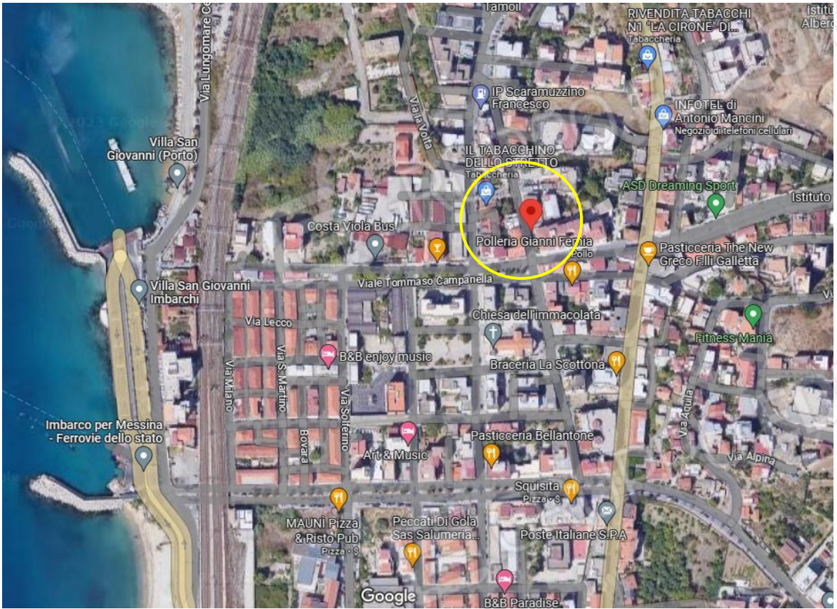
Foto 1: Inquadramento terr. condomino “Le Palme” Via Micene 58 Villa San Giovanni