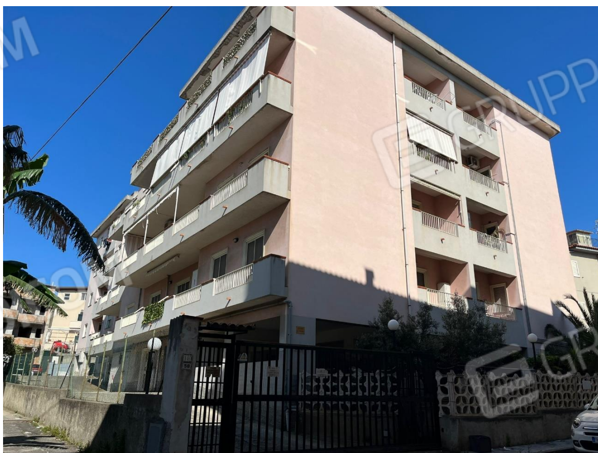
Foto 4: Vista condominio "Le Palme" Via Micene 58 Villa San Giovanni