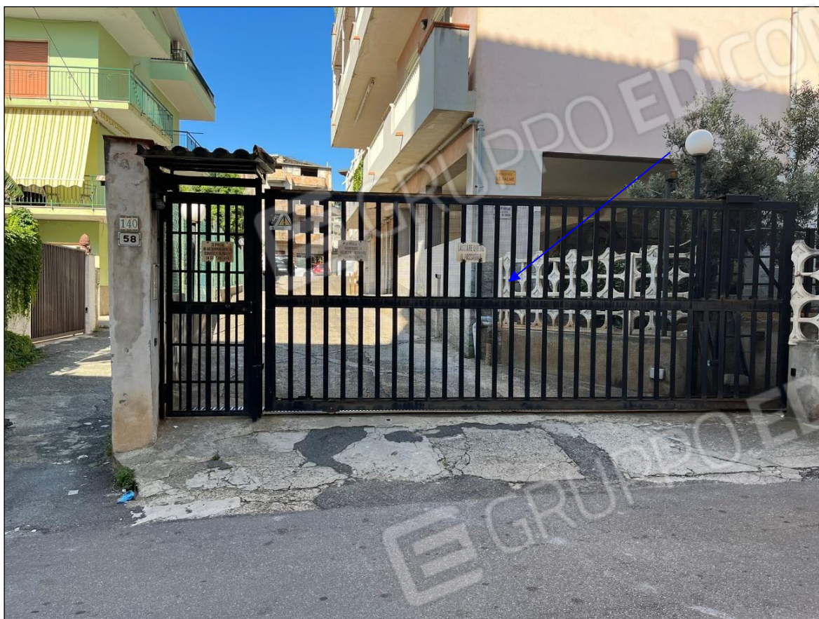
Foto 5: Vista ingresso condominio "Le Palme" Via Micene 58 Villa San Giovanni