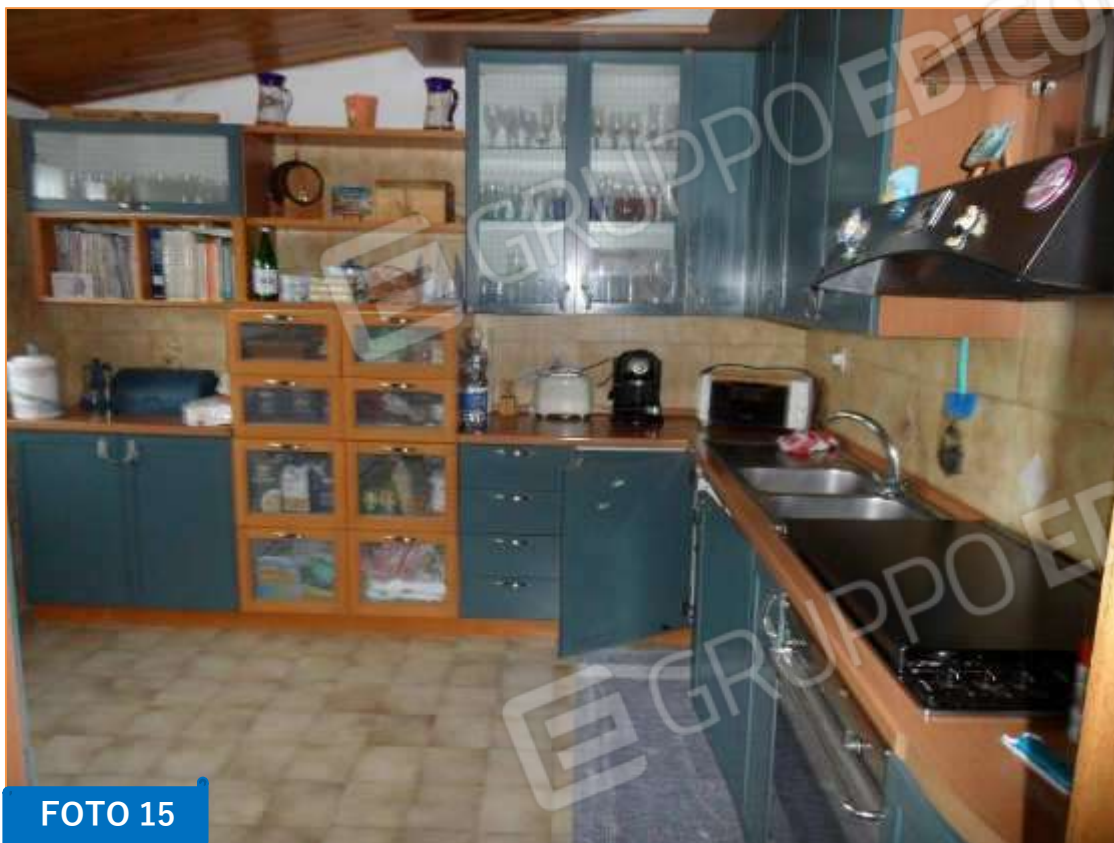
Interno della cucina, zona Sud – Ovest del piano.