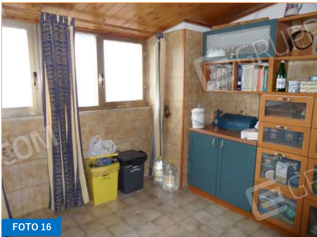
Ulteriore vista della cucina.