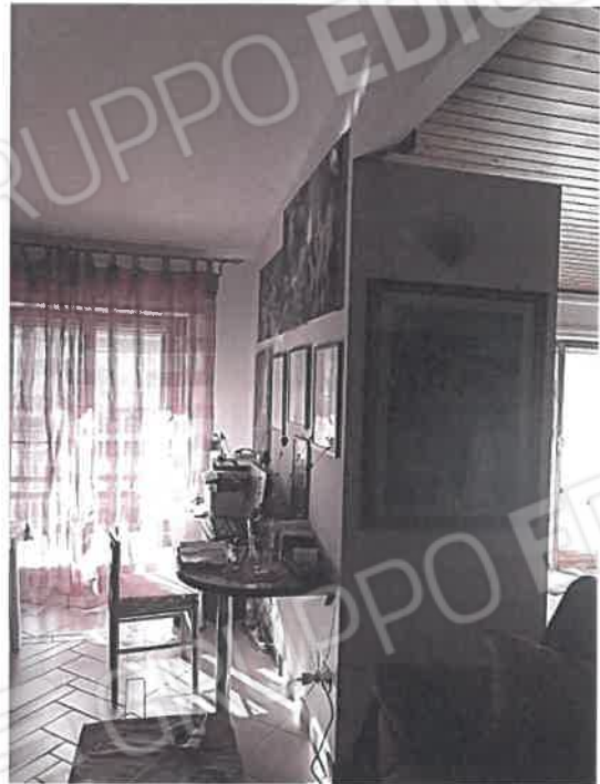
foto n. 6 - veduta interna