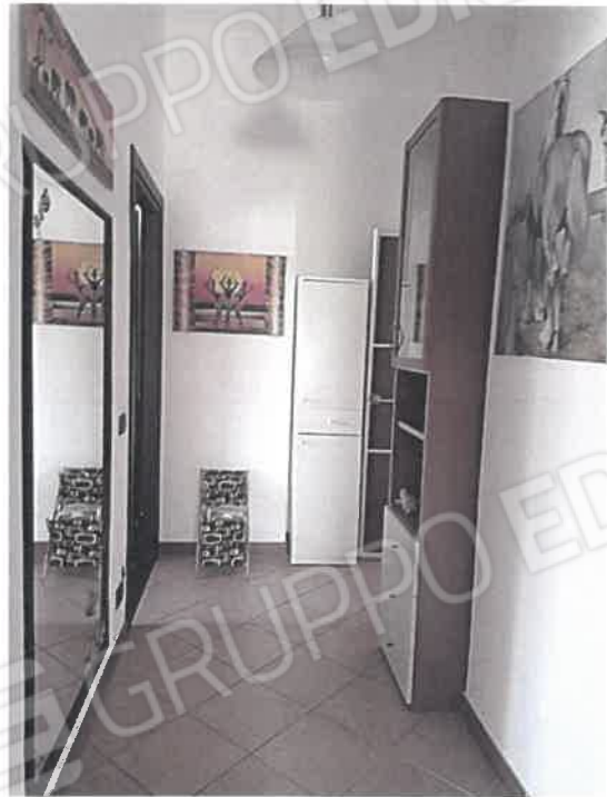
foto n. 8 - veduta disimpegno