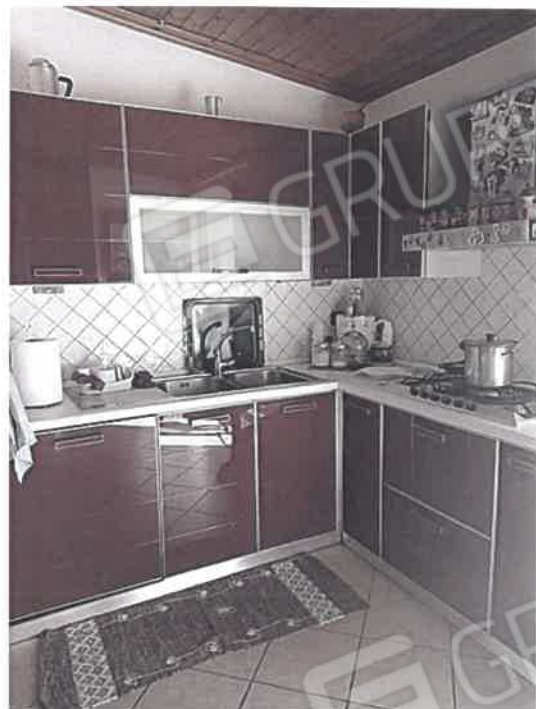
foto n. 8 - veduta cucina