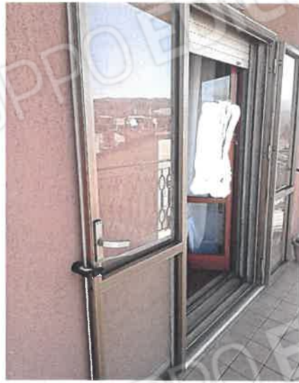
foto n. 16 - particolare infissi