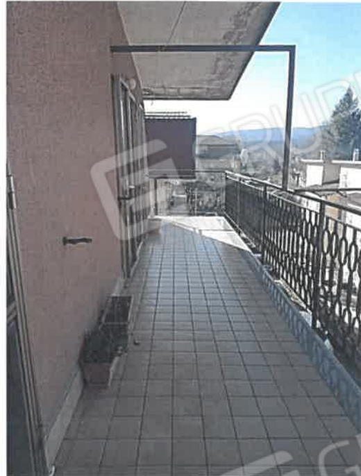
foto n. 22 - vista balcone