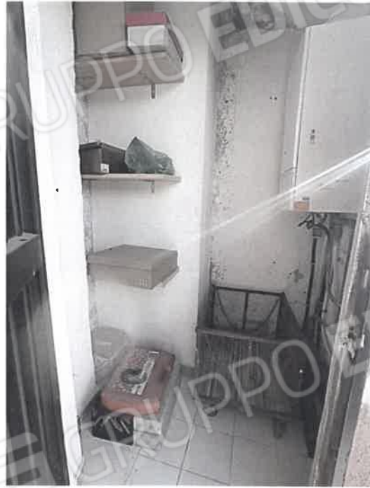
foto n. 20 - veduta vano caldaia