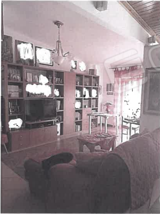
foto n. 5 - veduta interna