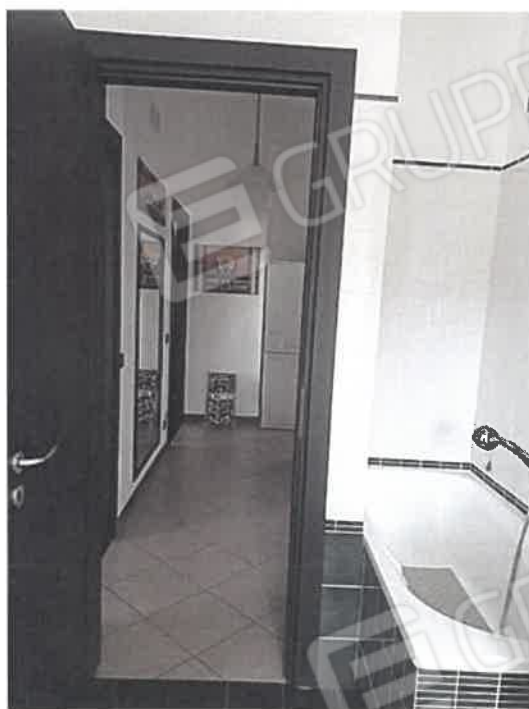
foto n. 14 - particolare vasca