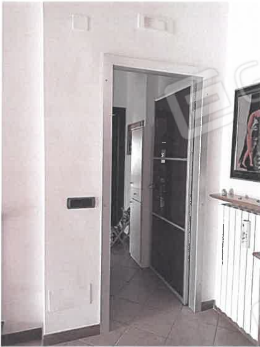
foto n. 7 - veduta interna