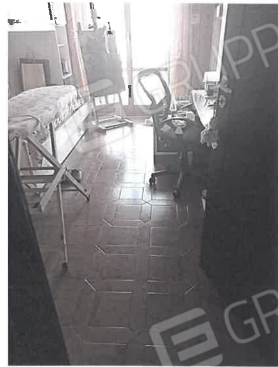
foto n. 10 - veduta camera