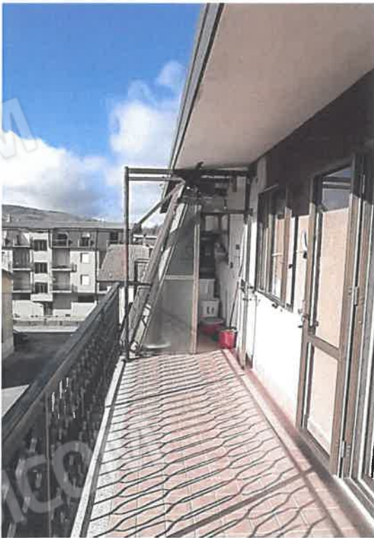
foto n. 17 - vista balcone - fronte sud