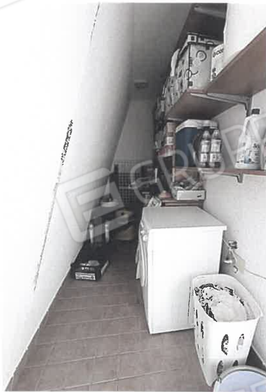
foto n. 18 - veduta ripostiglio