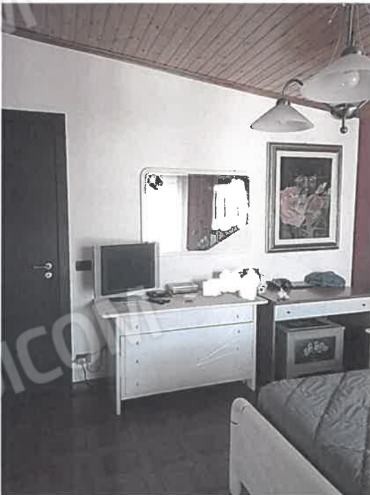
foto n. 9 - veduta camera