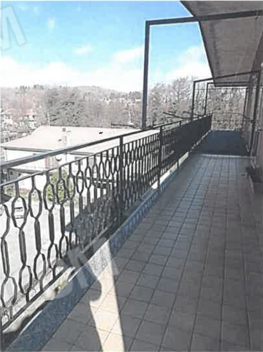
foto n. 21 - vista balcone - fronte ovest