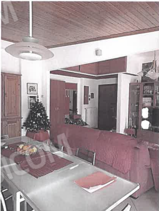
foto n. 7 - veduta interna