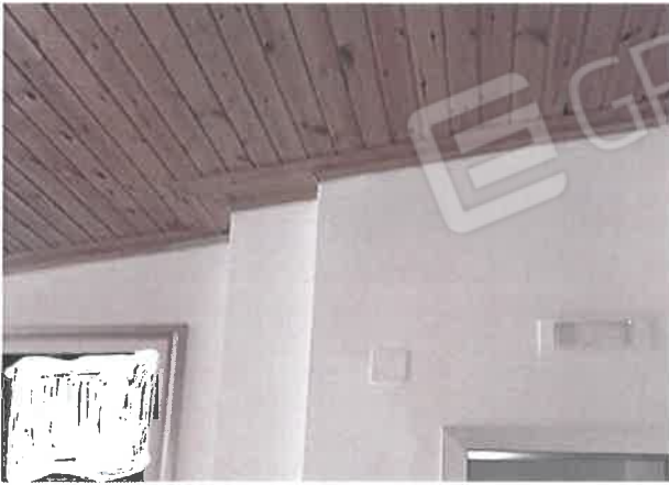
foto n. 15 - particolare soffitto