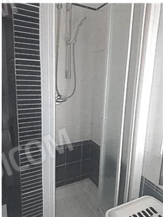
foto n. 13 - particolare box doccia