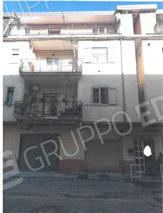
foto n. 2 -prospetto ingresso Località La Prisa - fronte sud