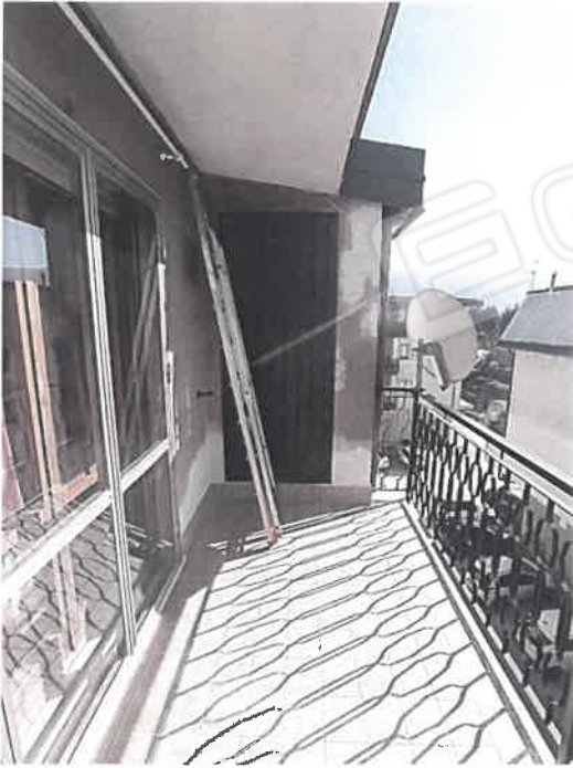
foto n. 19 - vista balcone - fronte sud