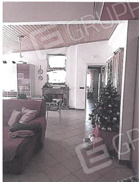
foto n.4 - veduta interna