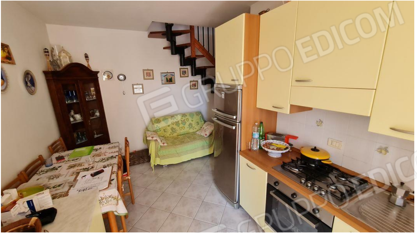
Soggiorno con angolo cottura (P1)