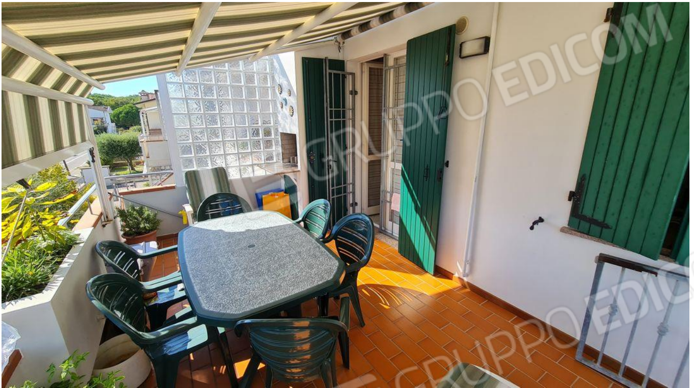
Balcone e accesso all'immobile (P1)