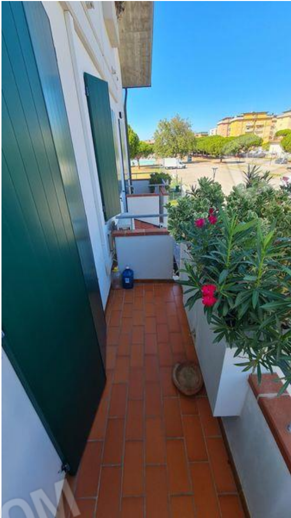
Balcone della camera matrimoniale (P1)