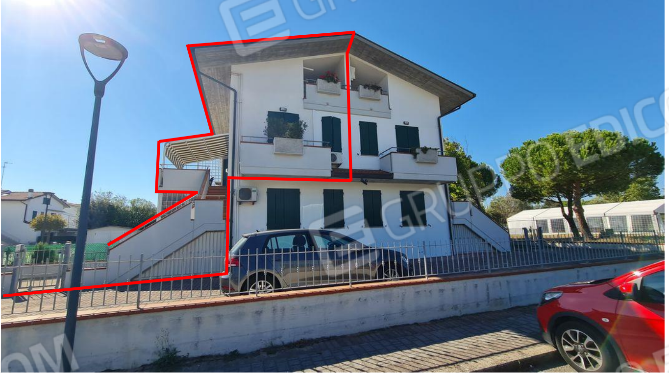
Vista dell'immobile da via Longiano

Sezione S, Foglio 70, Mappale 252, Subalterno 8