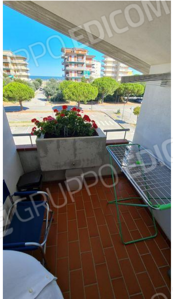
Balcone del sottotetto (P2)