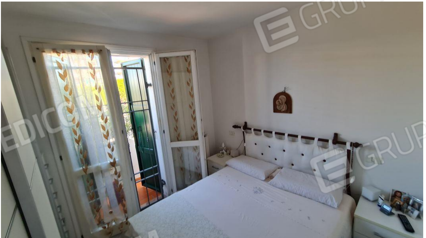
Camera da letto matrimoniale con vista su balcone (P1)