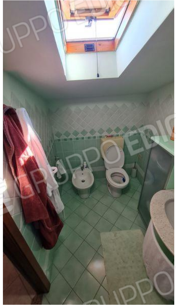
Bagno sottotetto (P2)