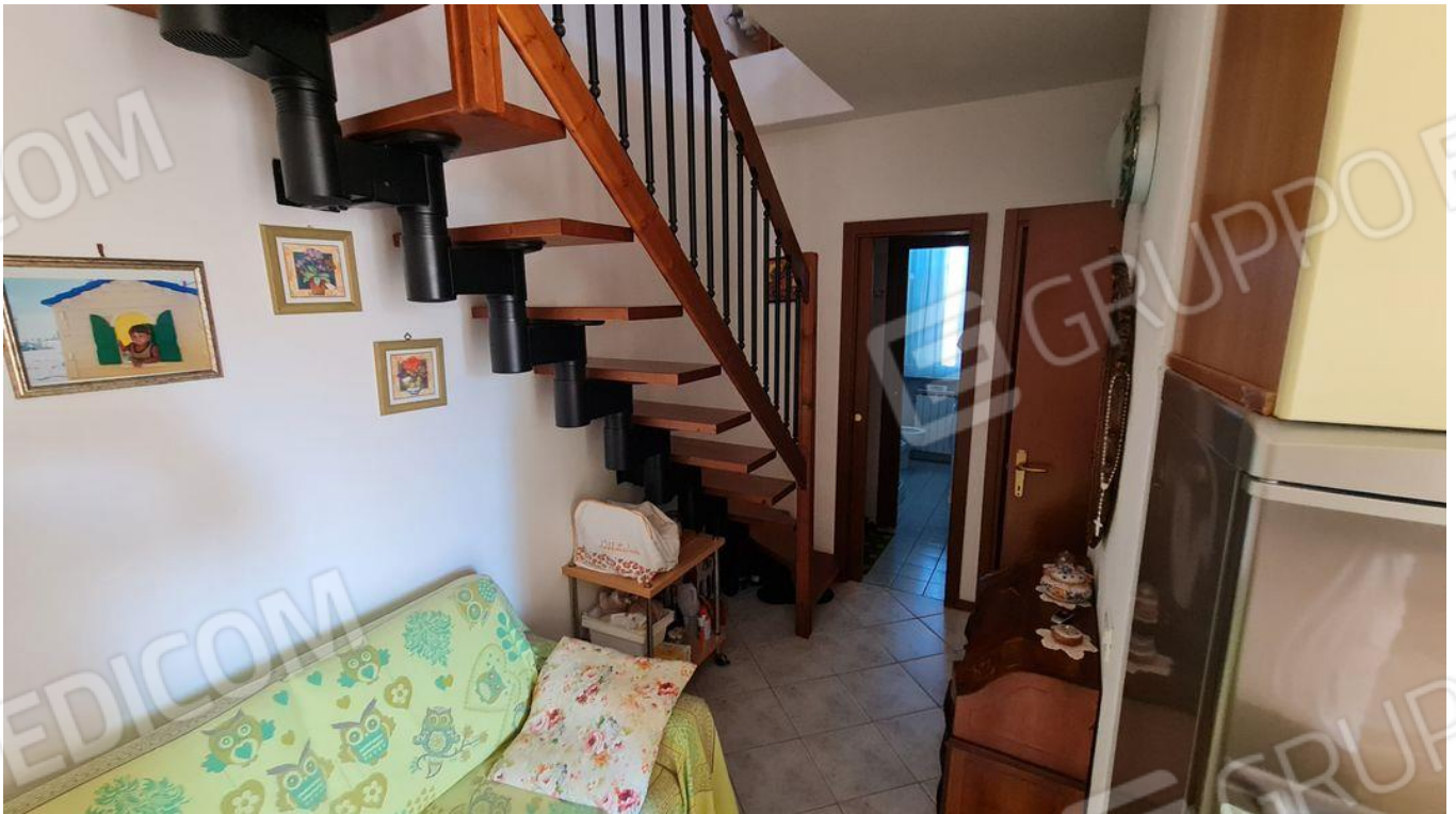
Soggiorno con angolo cottura con vista su zona notte e scala per accesso al piano sottotetto (P1)