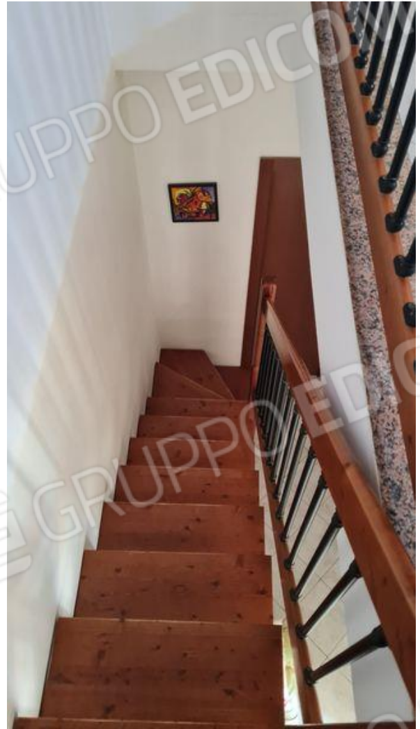
Scala per accesso al piano sottotetto (P2)