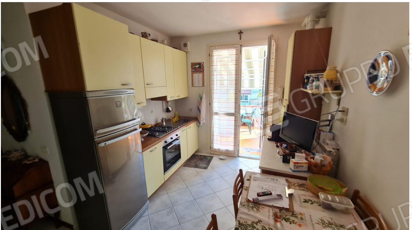
Soggiorno con angolo cottura (P1)