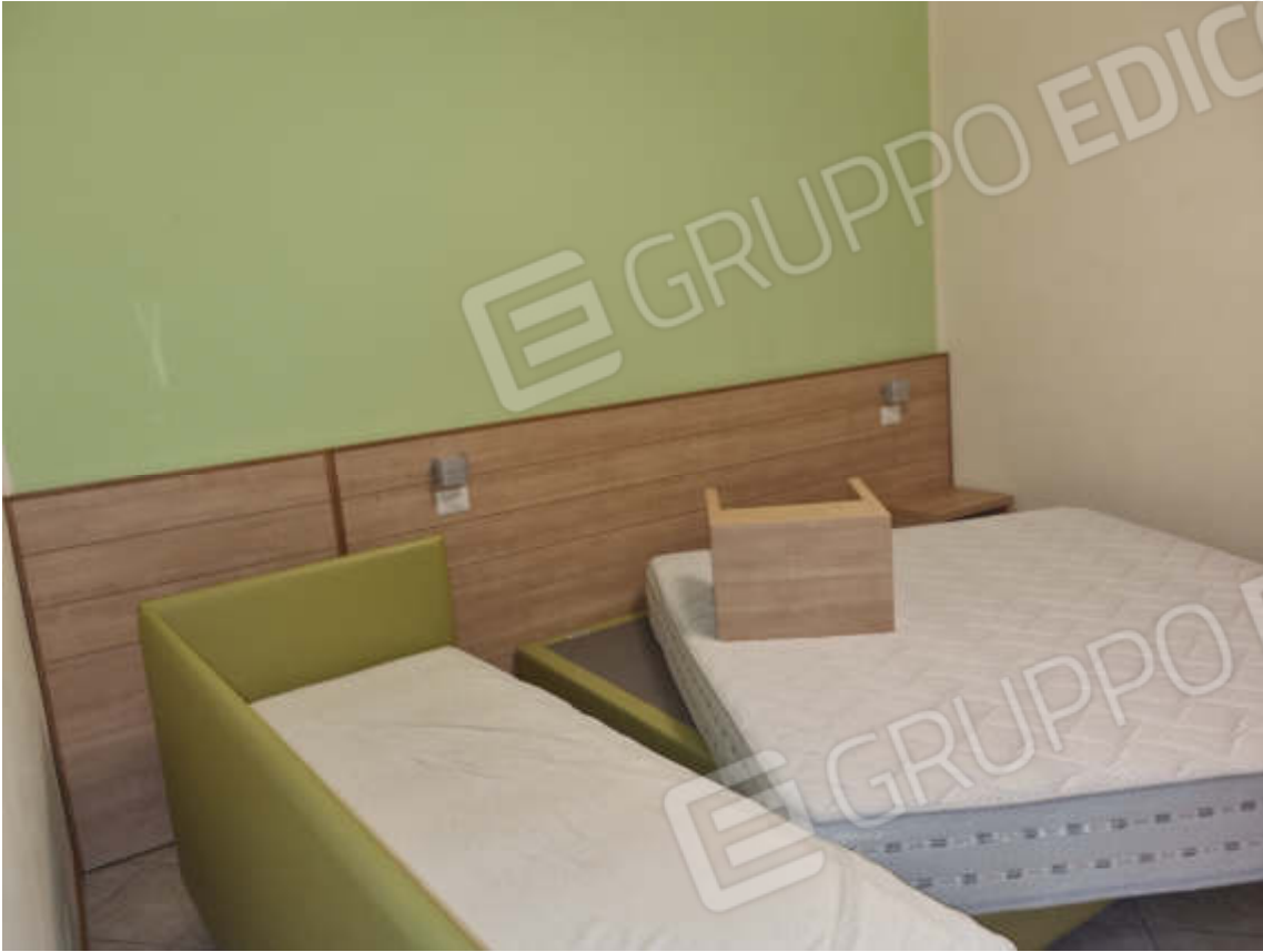
Foto 8 - Camere con diversa tipologia a due tre letti