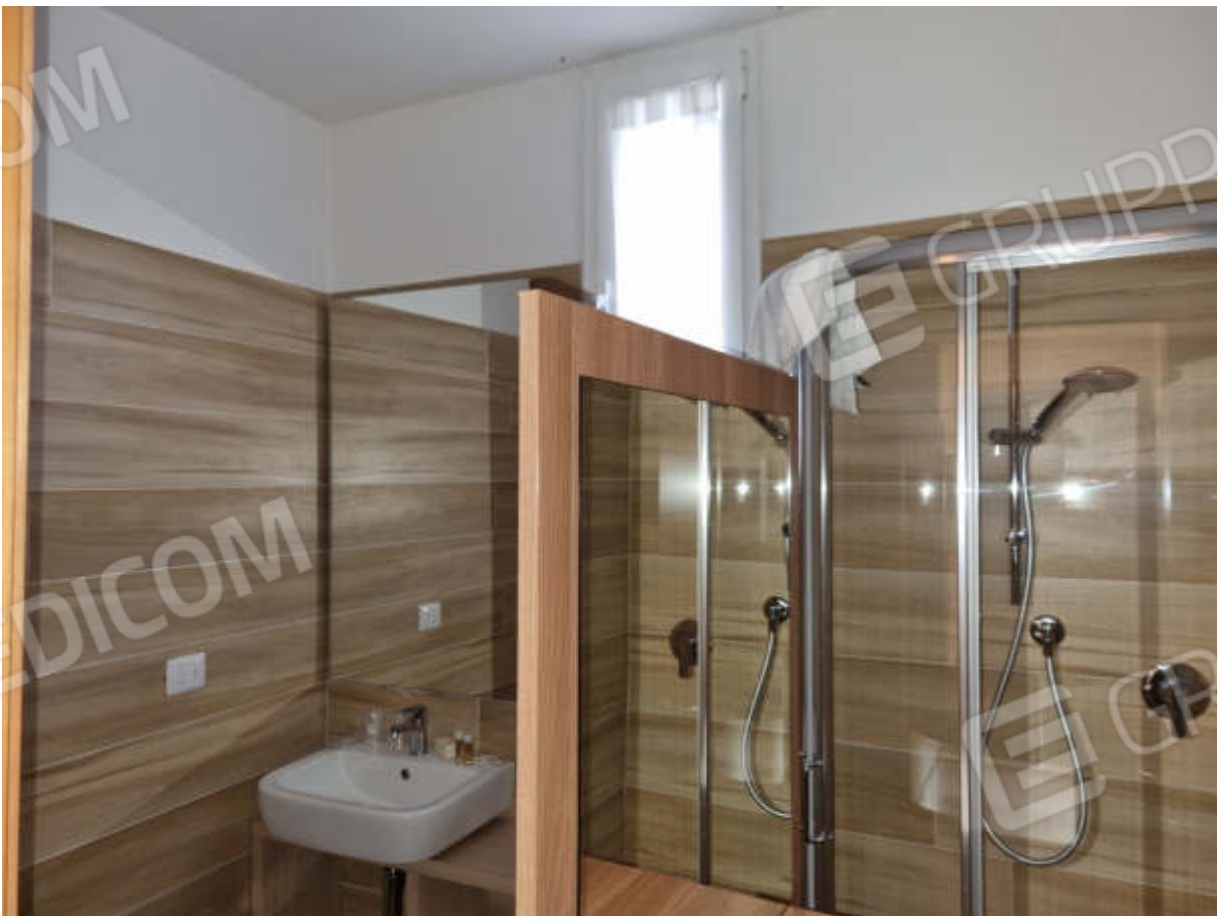
Foto 14 - Bagno con rivestimento h cm. 220