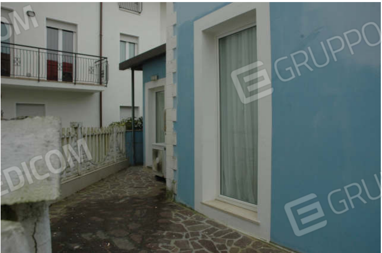
Foto 4 - Corte sul retro, con un ampliamento non legittimato