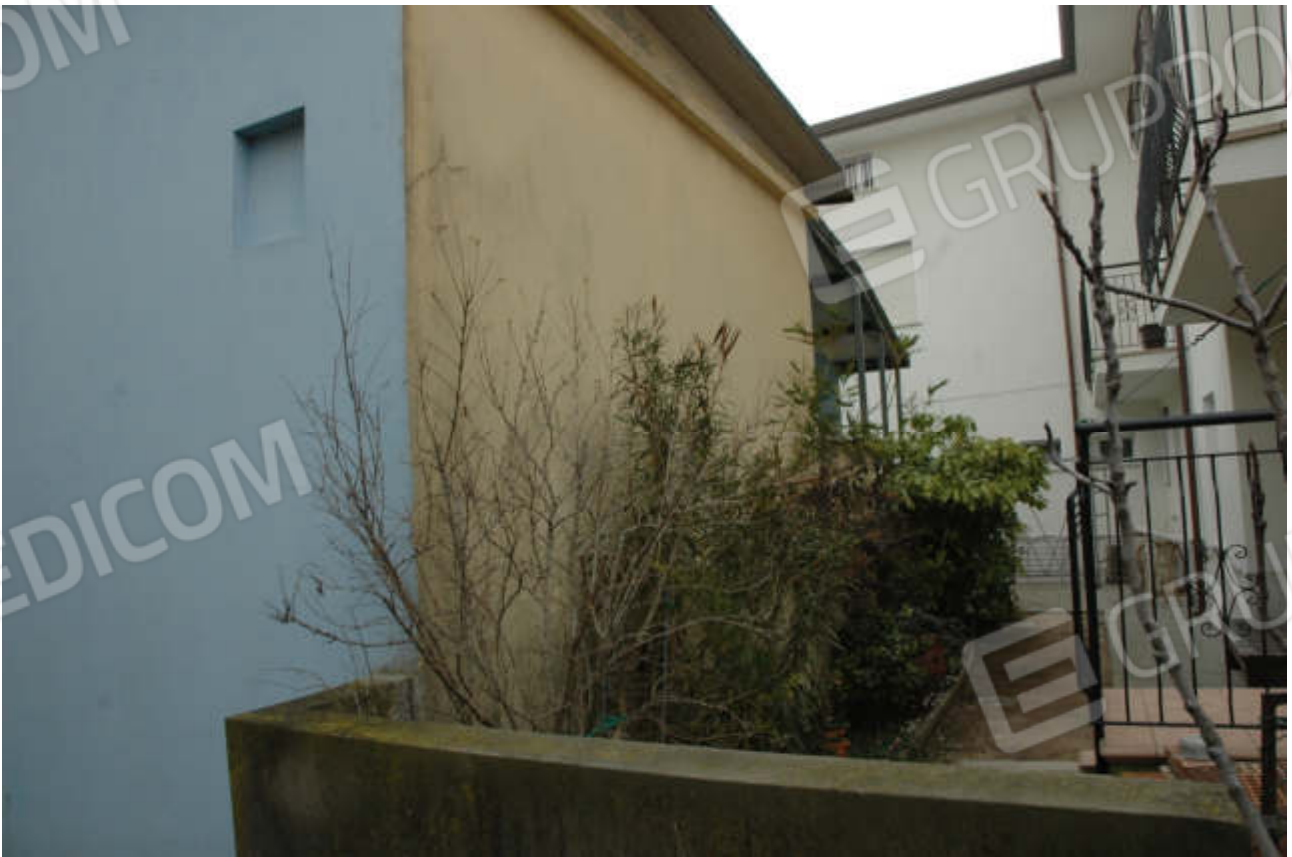
Foto 20 - Vista sul confine lato monte