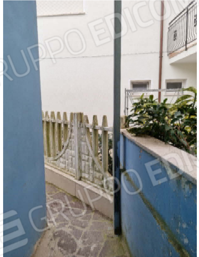
Foto 18 -19 - La porzione del fabbricato nell'immagine risulta edificata senza autorizzazione