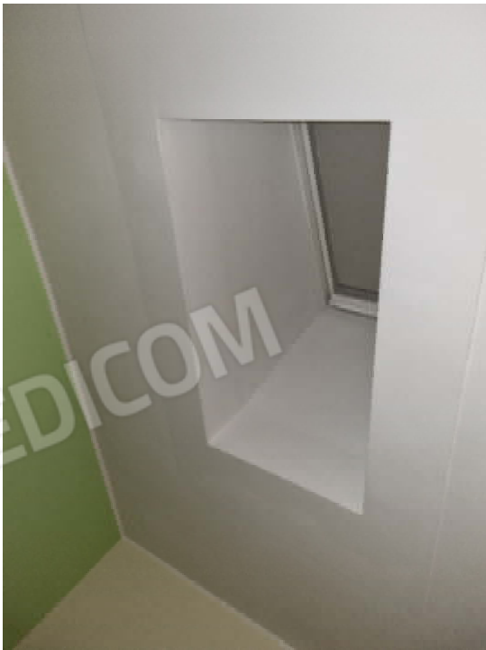
Foto 16 - Luminello camera posta sul retro