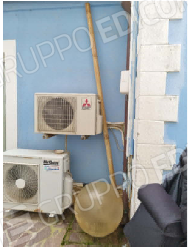
Foto 5-6 - Angolo sul retro con accesso alla cantina