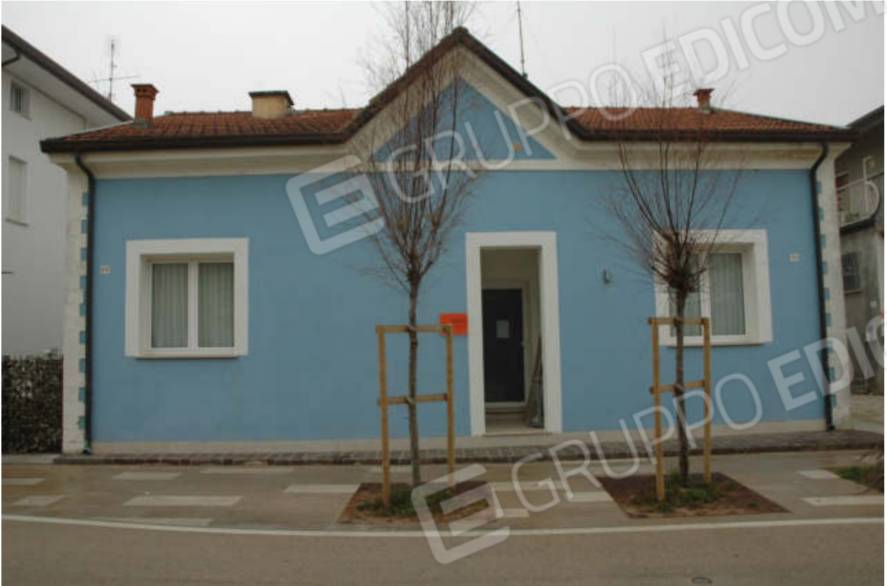
Foto 1 - Prospetto lato mare del fabbricato