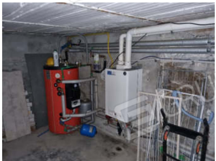
Foto 17- Cantina con centrale termica