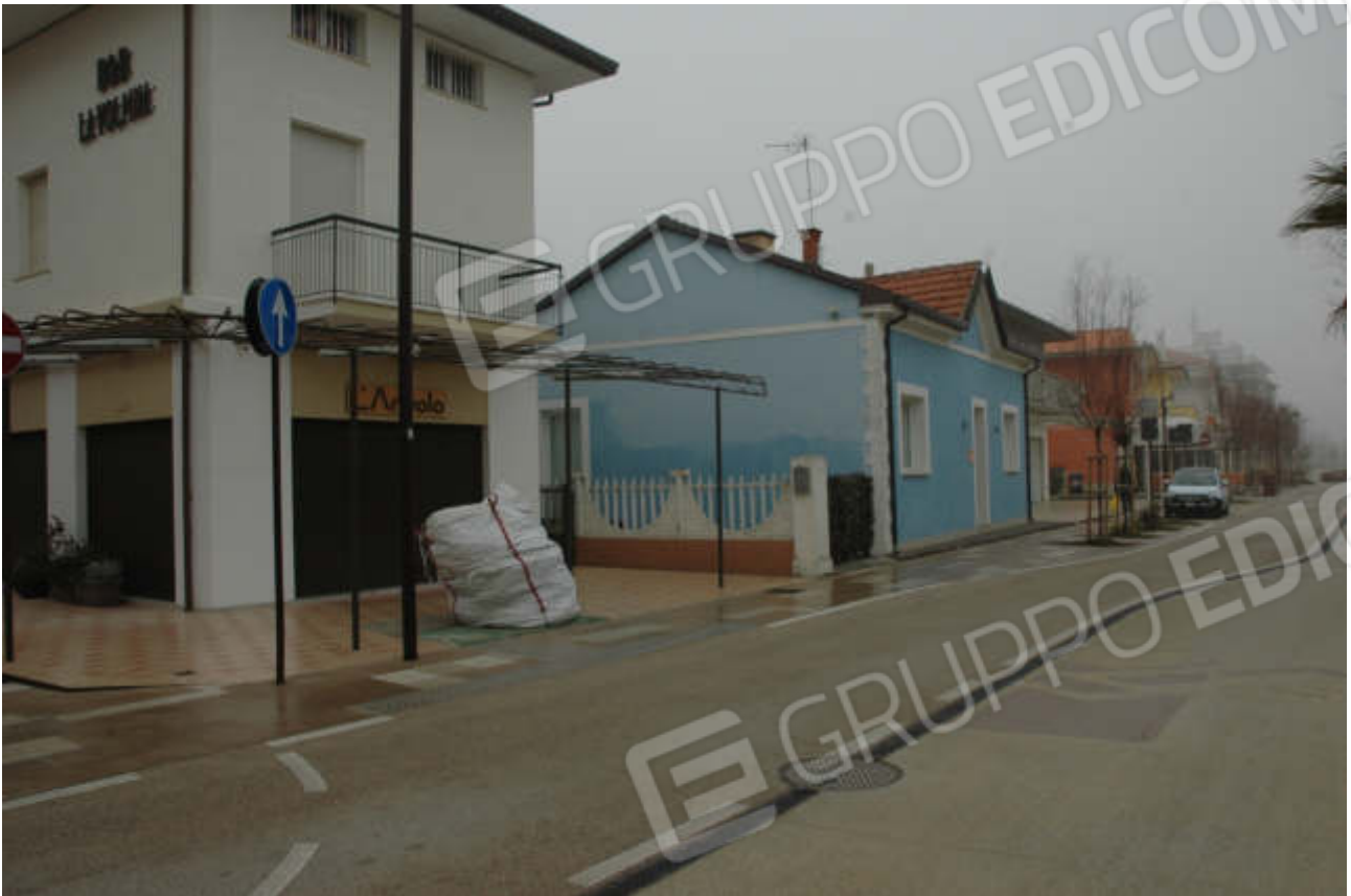
Foto 3 - Prospetto lato N/E, con il cancello per accedere alla corte