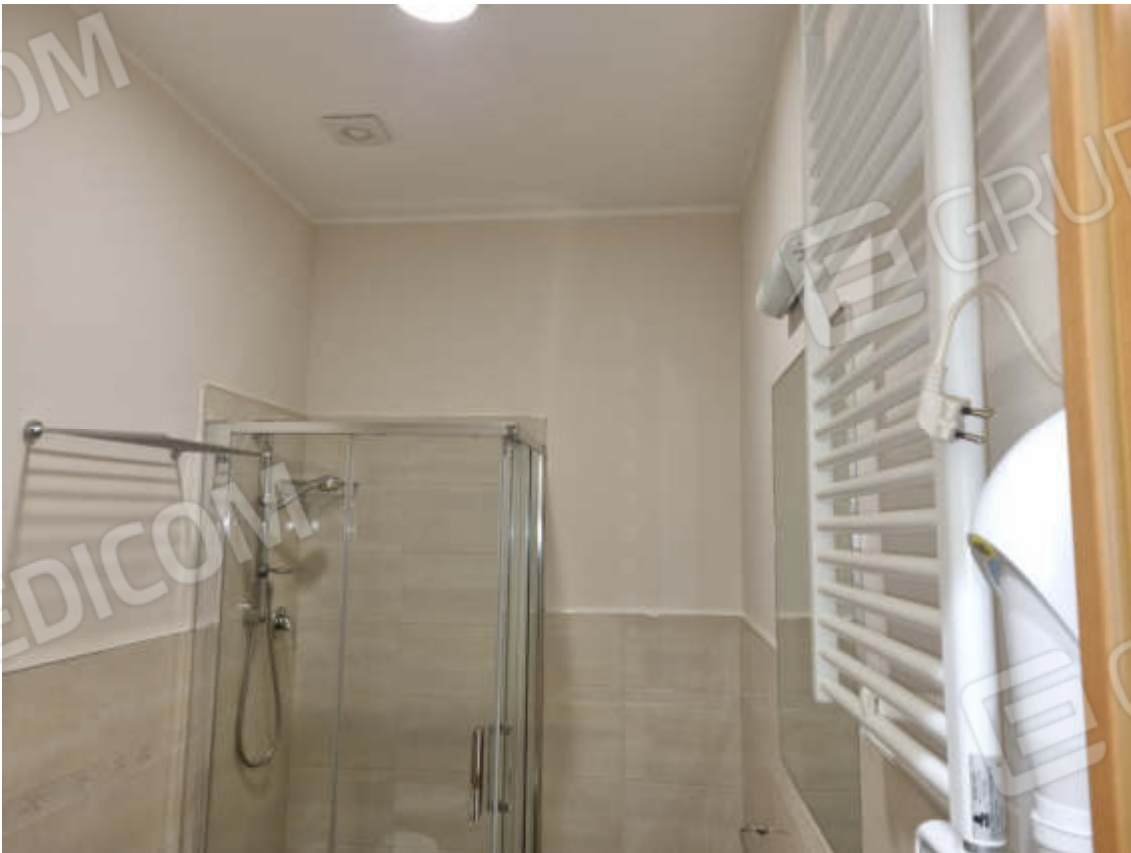
Foto 9 - Bagni con rivestimento, box doccia in acciaio e vetro, termoarredo