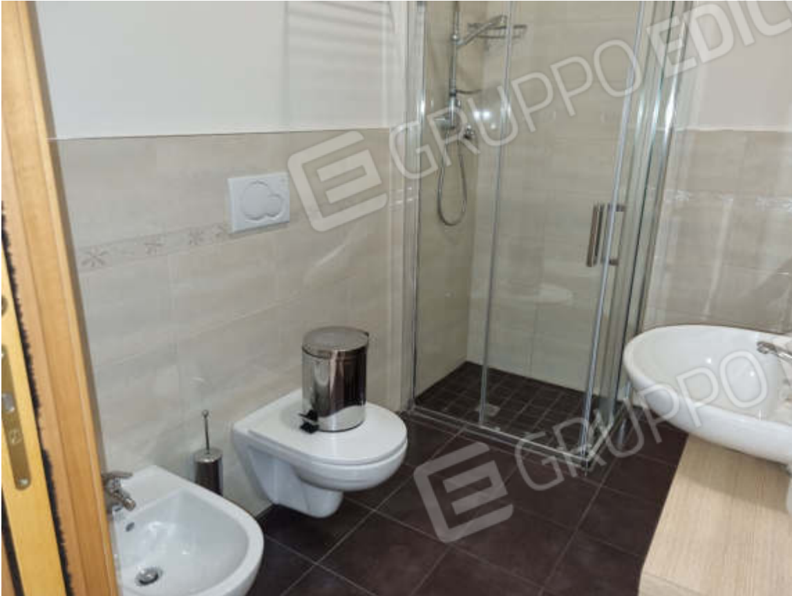
Foto 10 - Bagno con doccia e bidet