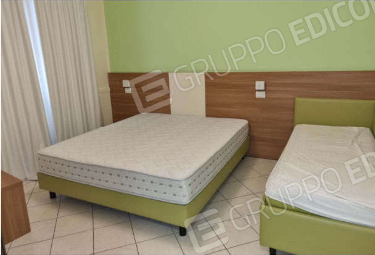
Foto 13 - Camera a tre letti