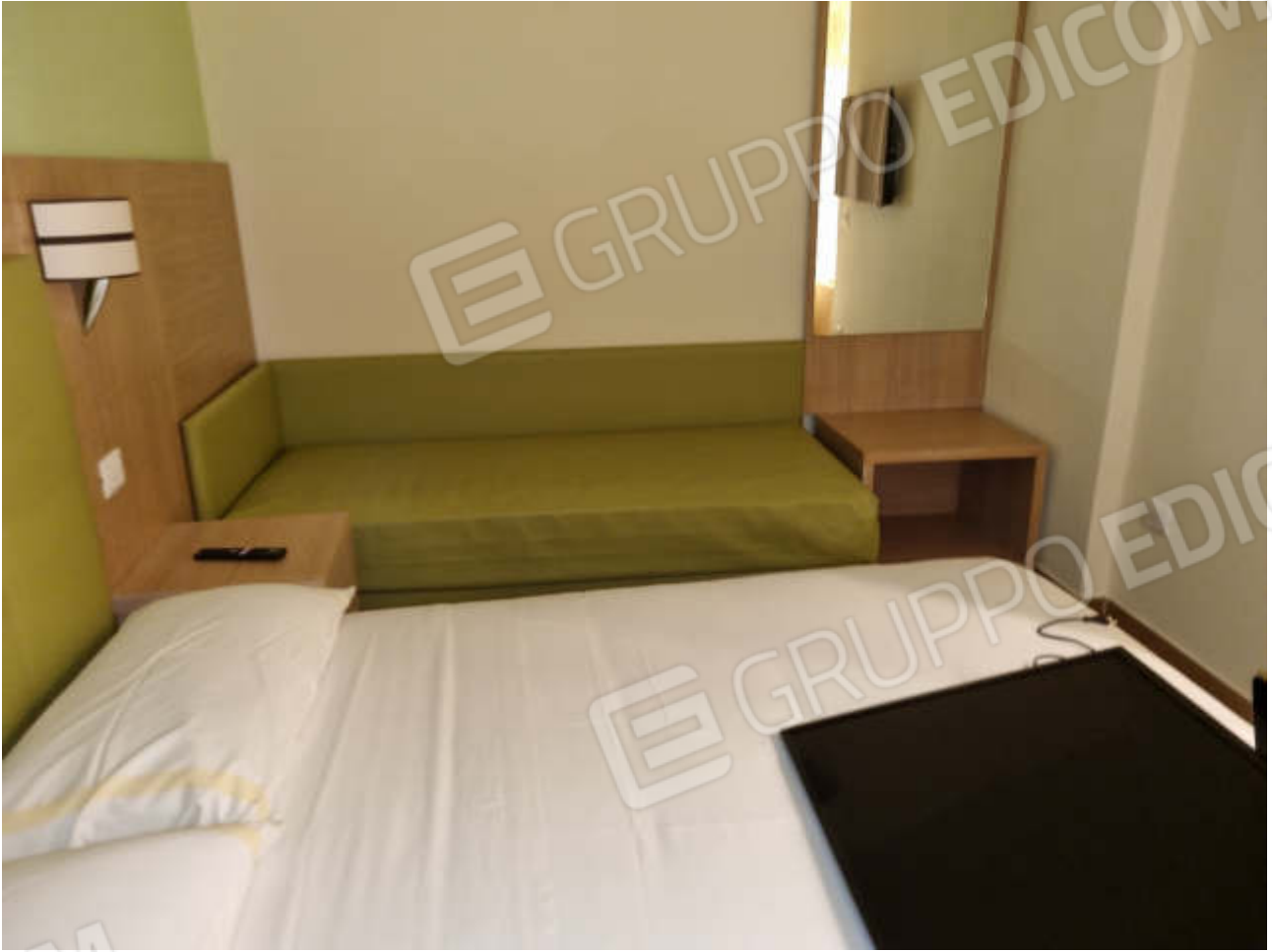
Foto 15 - Camera tre letti