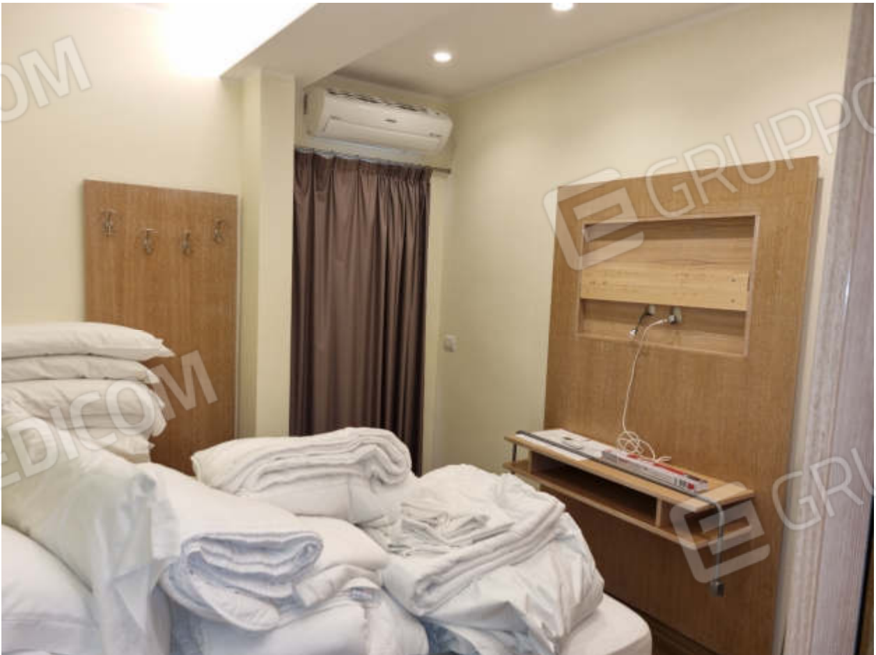
Foto 7 - Internamente ad uso affittacamere sono state ricavate 6 camere da letto con bagno