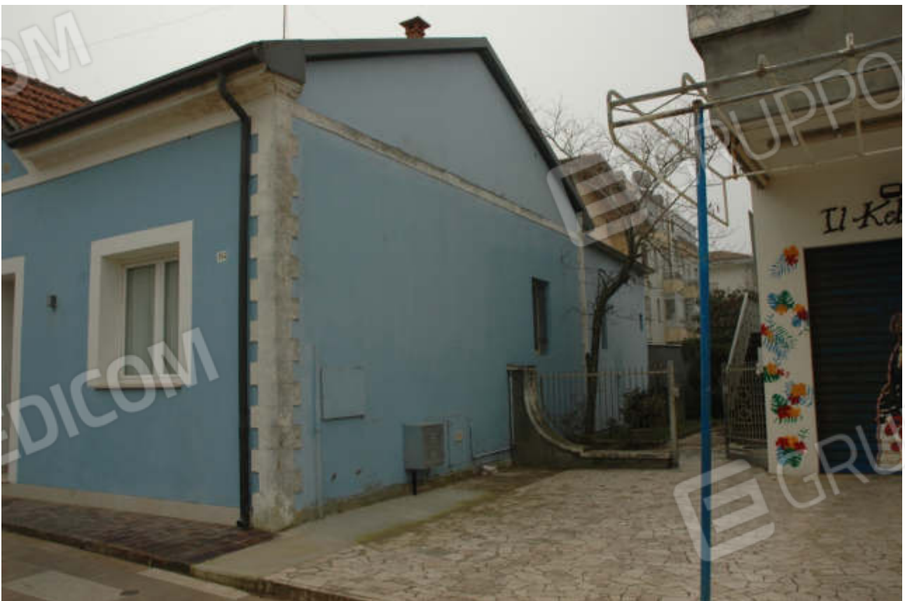
Foto 2 - Prospetto, lato N/W a confine con altra proprietà