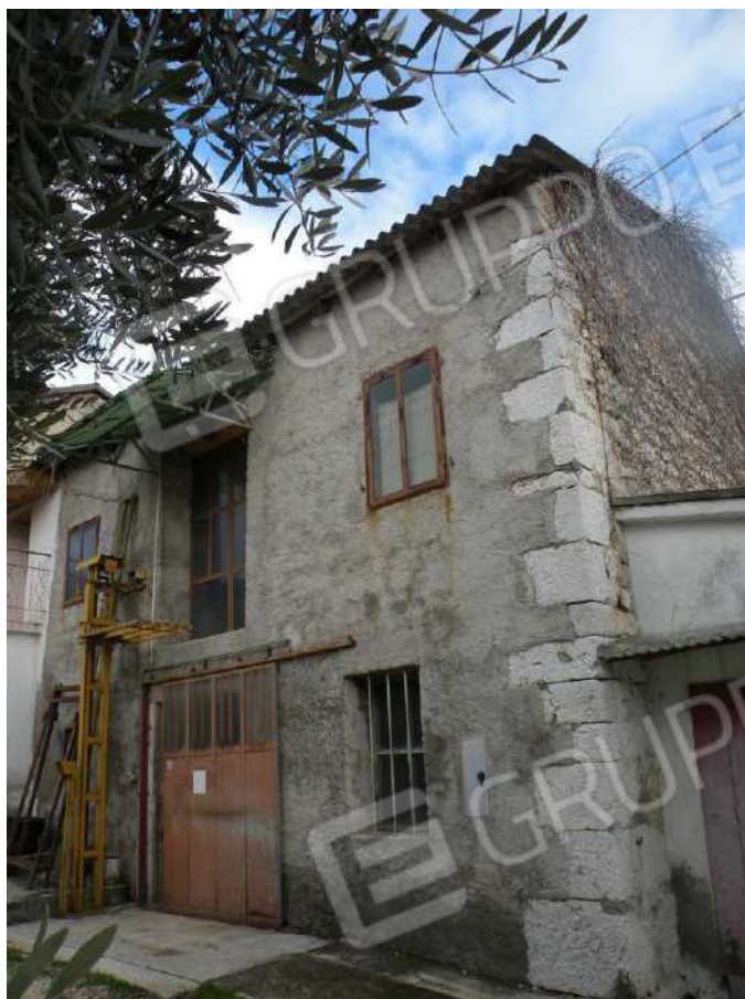
3 – Prospetto Ovest