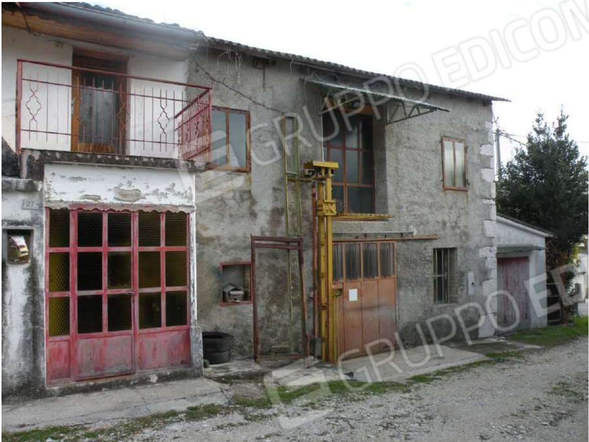
1 – Prospetto Ovest