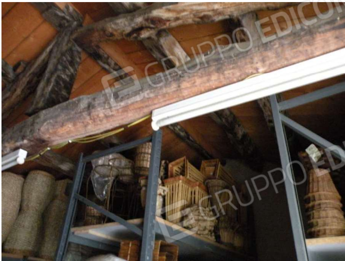
9 – 1° P - Magazzino