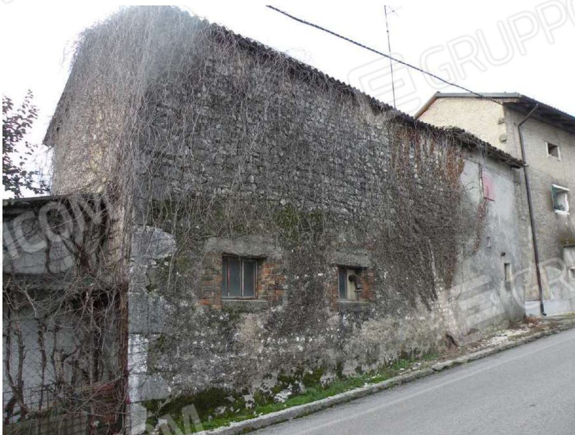
4 – Prospetto Est – Via Vallone