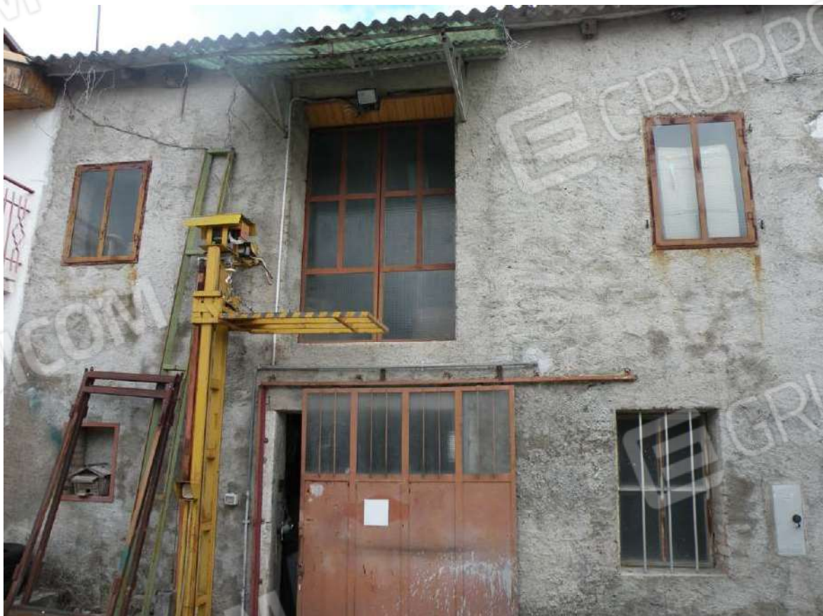
2 – Prospetto Ovest