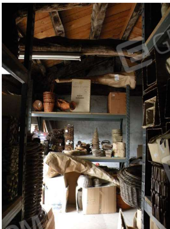
8 – 1° P - Magazzino