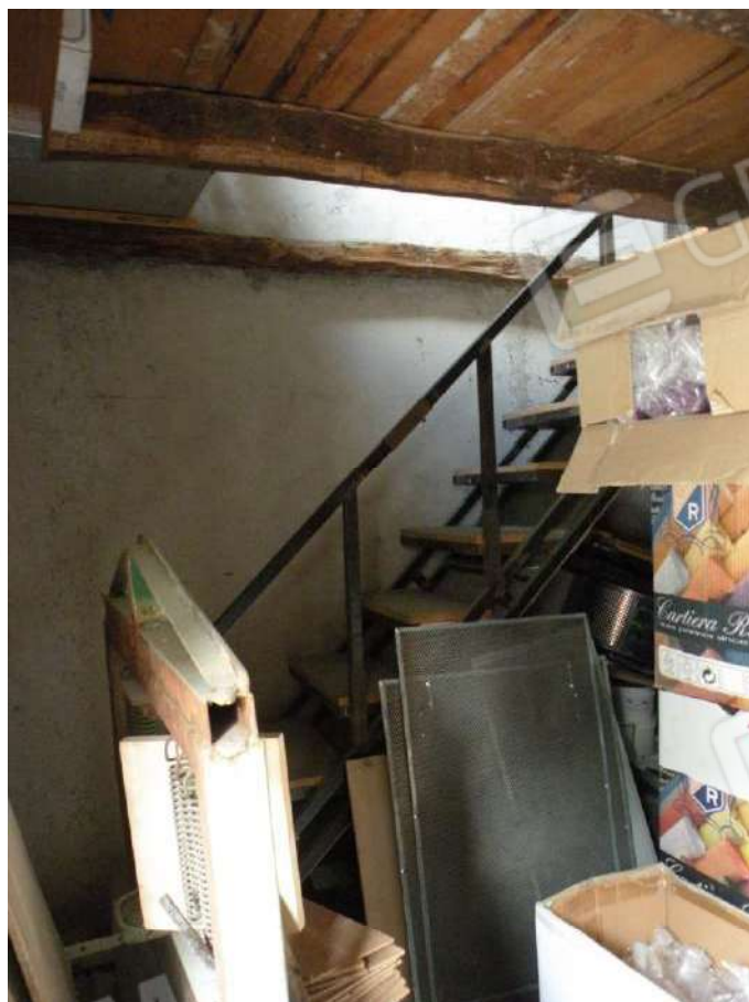
6 – Scala per il 1° piano