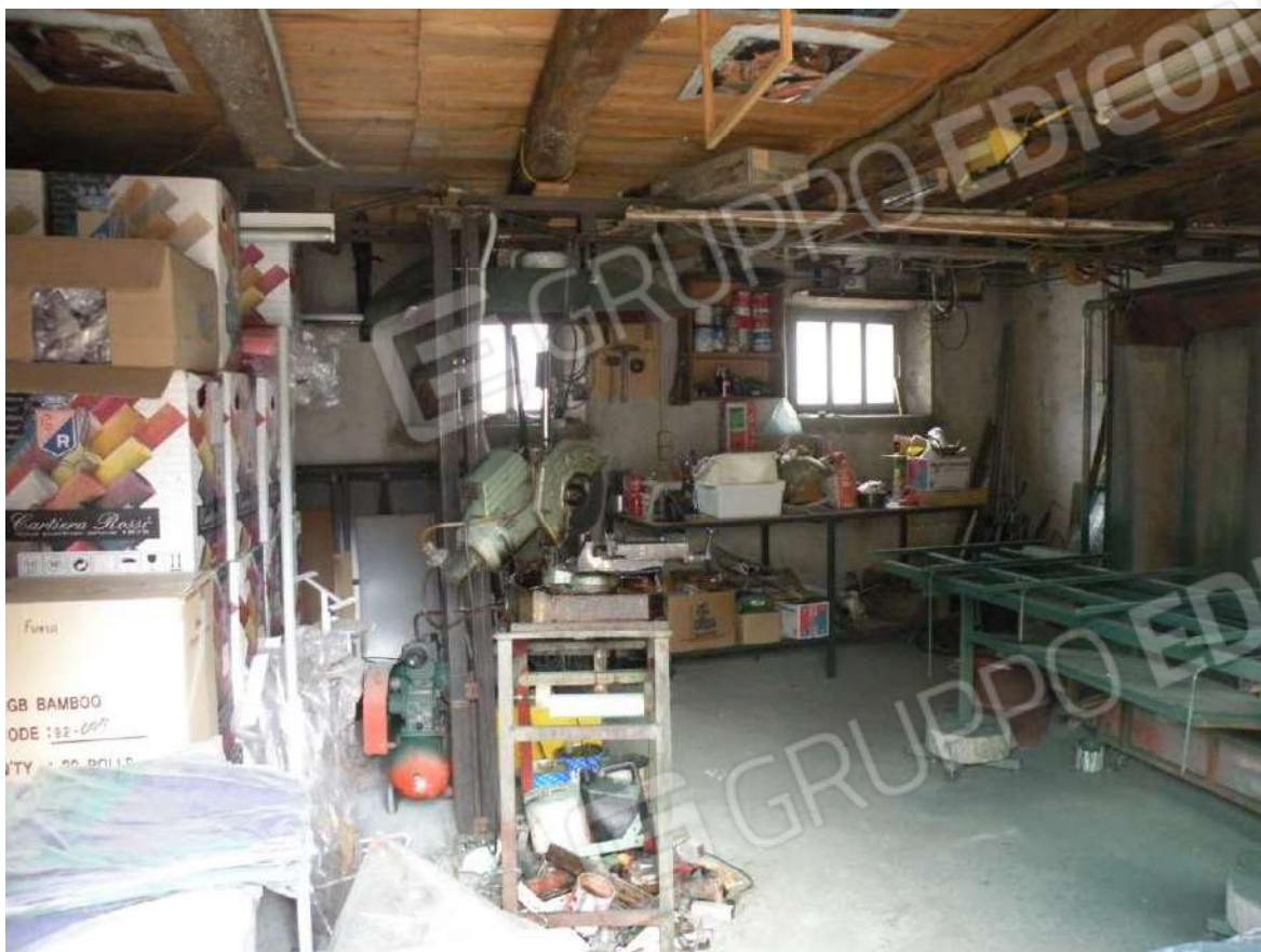
5 – P.T. - Deposito