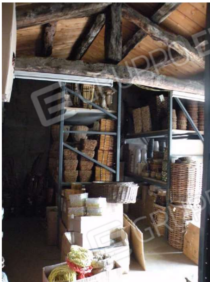
7 – 1° P - Magazzino