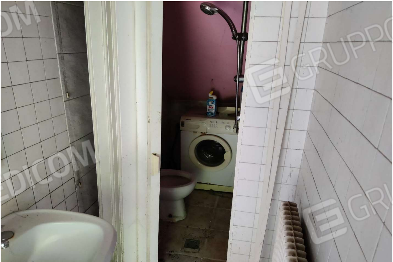
Foto n. 10 – Disimpegno e ripostiglio adibito a servizio igienico.