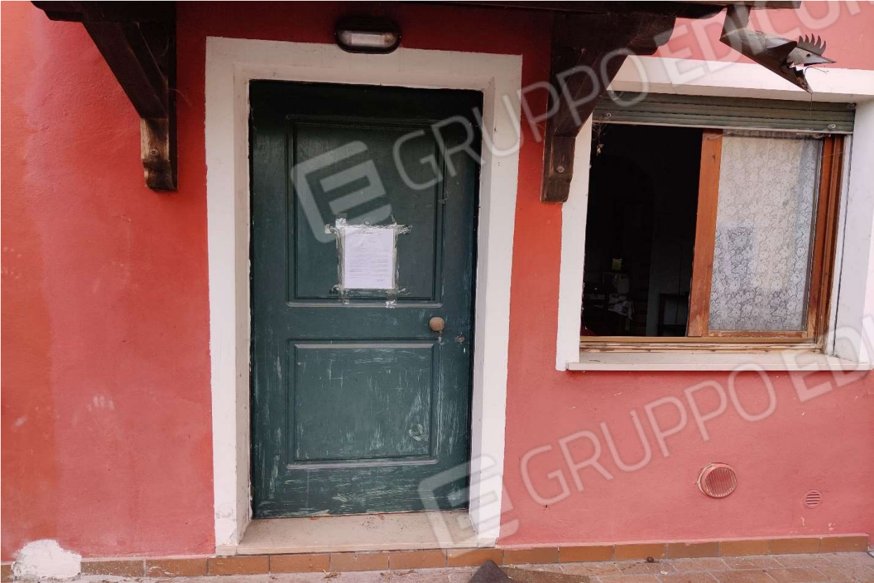
Foto n. 5 – Accesso da via Garibaldi; in evidenza lo stato di degrado dei serramenti.

DOC. FOTOGRAFICA – Beni in Pasiano di Pordenone (PN) – via Garibaldi n. 70.