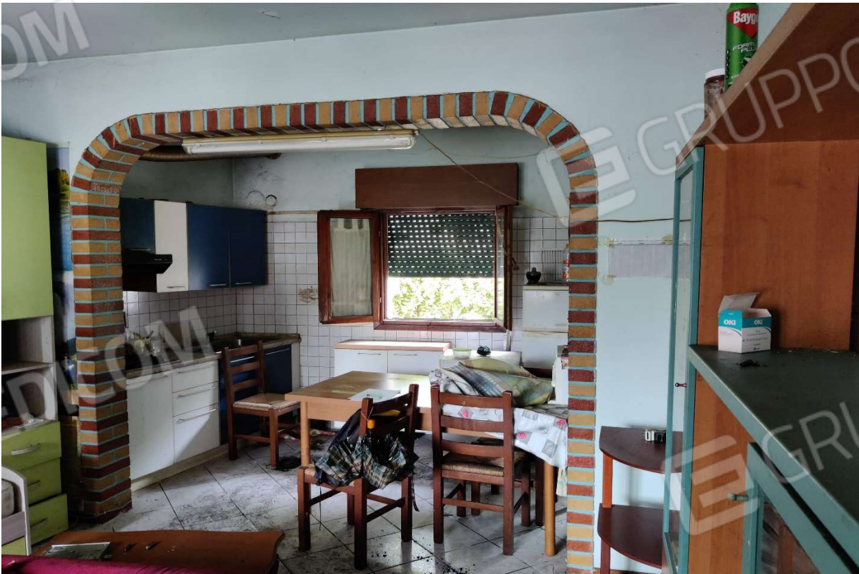
Foto n. 8 – Ingresso - soggiorno - cucinino, con in evidenza rifiniture in mattoni colorati.