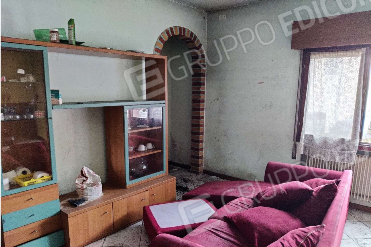
Foto n. 7 – Ingresso - soggiorno, con in evidenza rifiniture in mattoni colorati.

DOC. FOTOGRAFICA – Beni in Pasiano di Pordenone (PN) – via Garibaldi n. 70.