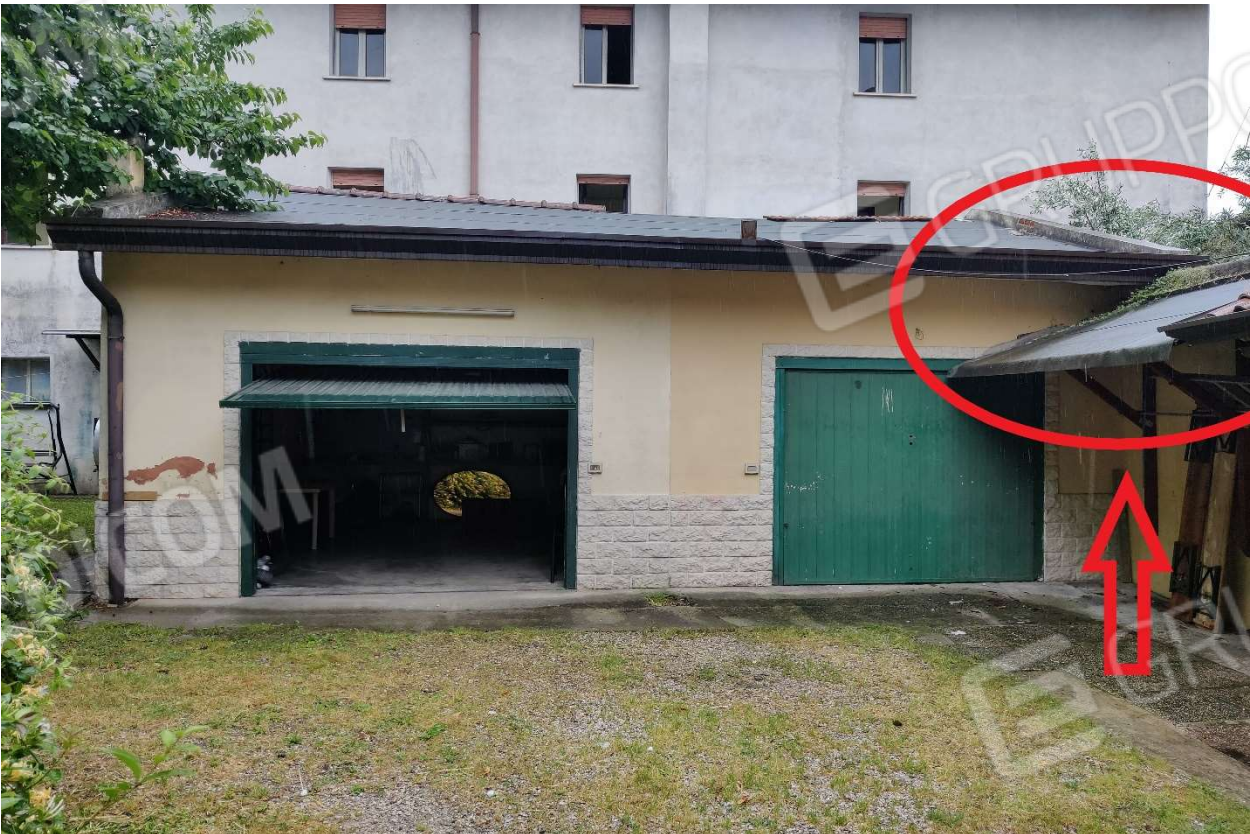
Foto n. 28 – Pensilina comune per la quale non sono stati rinvenuti titoli autorizzativi.