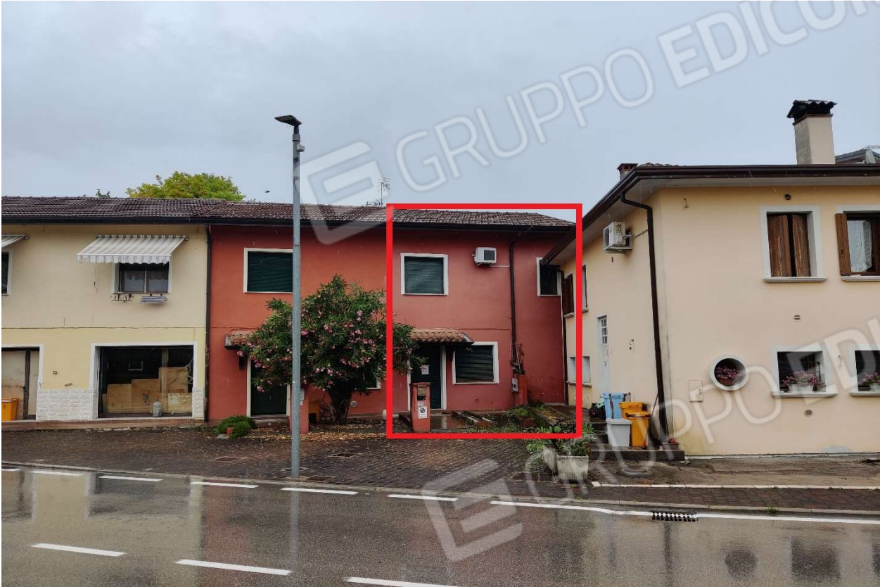
Foto n. 1 – Abitazione vista da via Garibaldi (facciata rivolta ad Ovest) – Porzione evidenziata in rosso.

DOC. FOTOGRAFICA – Beni in Pasiano di Pordenone (PN) – via Garibaldi n. 70.