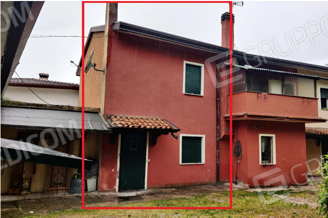
Foto n. 2 – Abitazione vista da scoperto comune (facciata rivolta ad Est) – Porzione evidenziata in rosso).