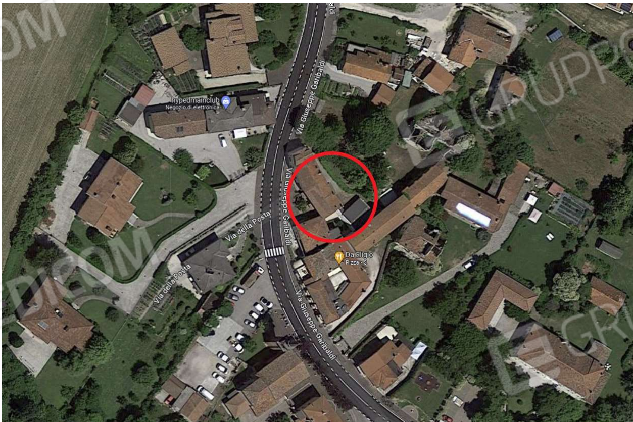
Foto n. II – Ambito nel quale sono inseriti i beni esegutati – cerchiato in rosso.