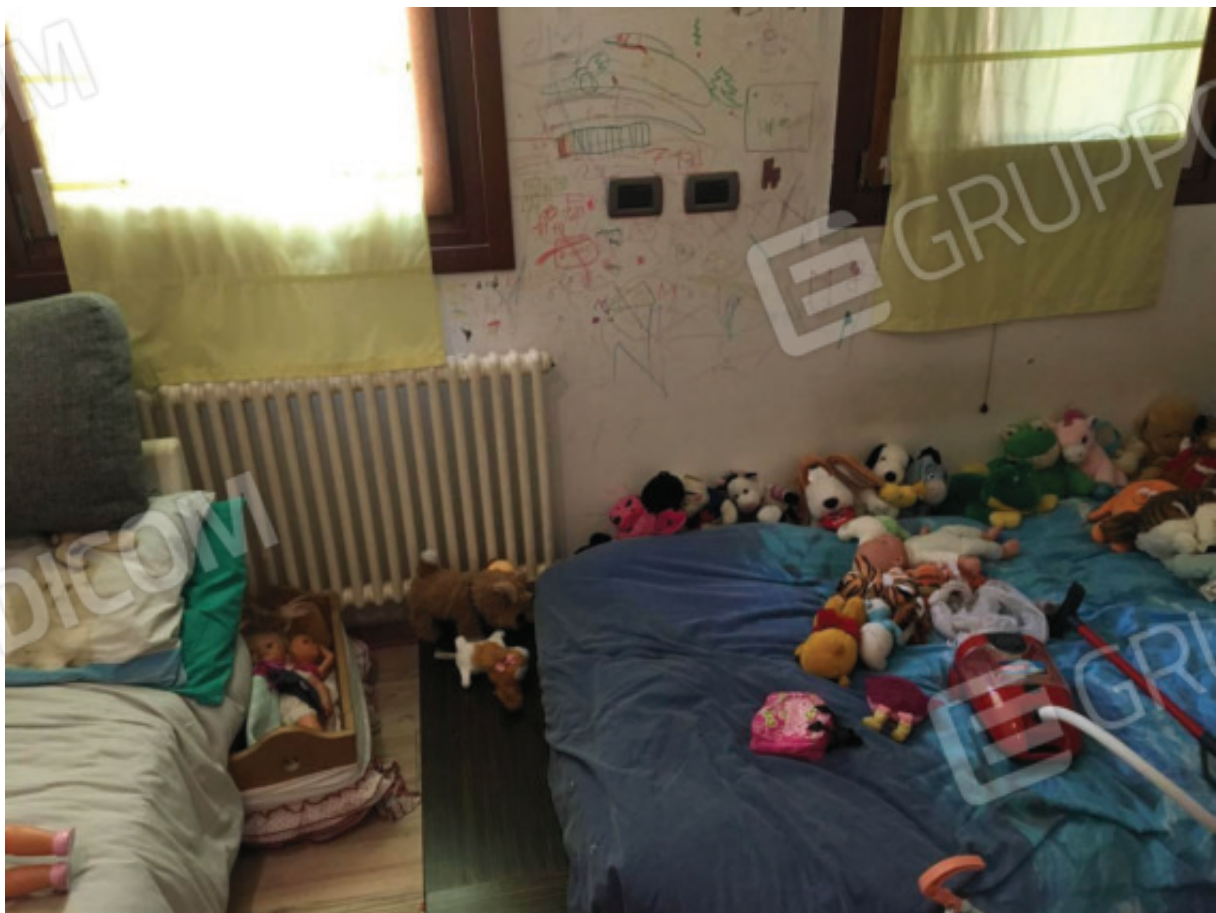
Foto n.18: Camera Ovest, difforme da quanto assentito dal Comune (Sub.1).