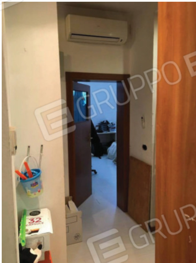
Foto n.17: Disimpegno zona notte, difforme da quanto assentito dal Comune (Sub.1).