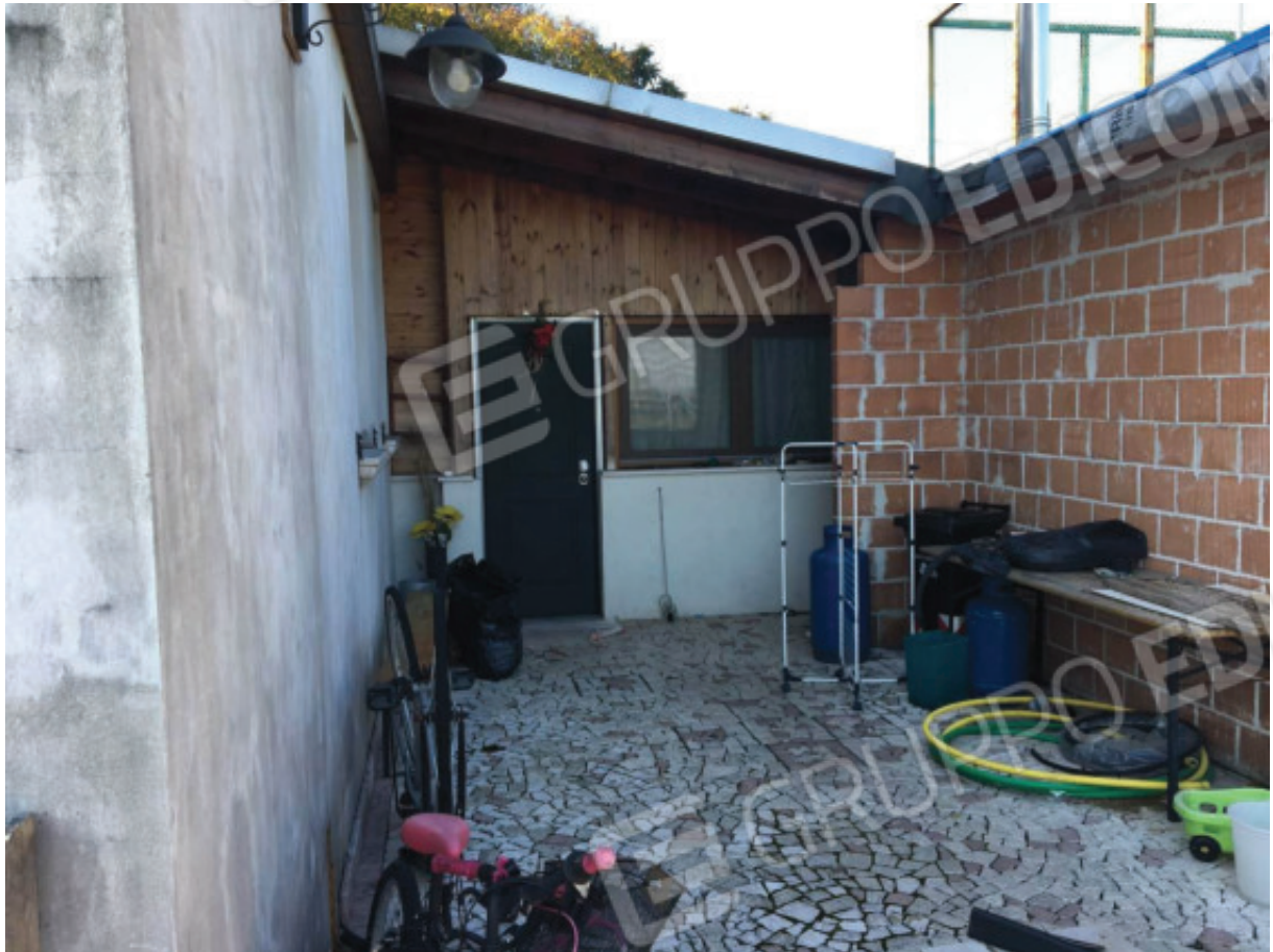
Foto n.9: Ampliamento abusivo (da completare) con evidenza del nuovo portoncino d'ingresso posto ad est della zona giorno dell'Appartamento oggetto di E.I. (Sub.1) e direttamente collegato con la restante Corte Scoperta Esclusiva (Sub.7).