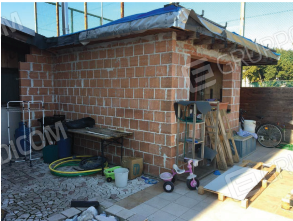
Foto n.22: Facciata Sud ed Est della parte accessoria adibita a Lavanderia-Deposito che è stata edificata, abusivamente, in luogo di un pergolato, sullo scoperto esclusivo (Sub.7).