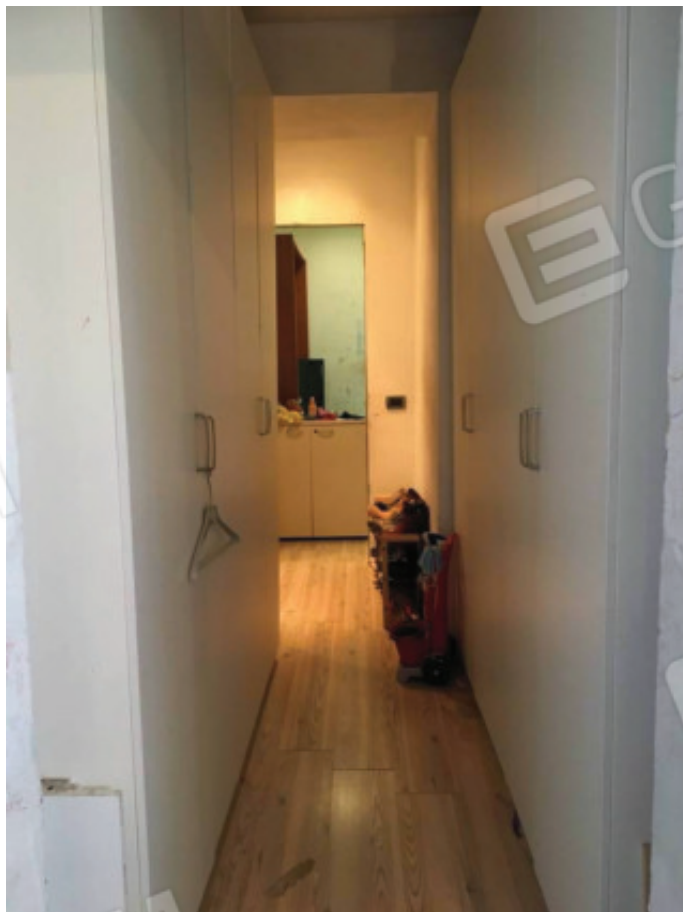
Foto n.16: Disimpegno tra zona giorno e zona notte, difforme da quanto assentito dal Comune (Sub.1).