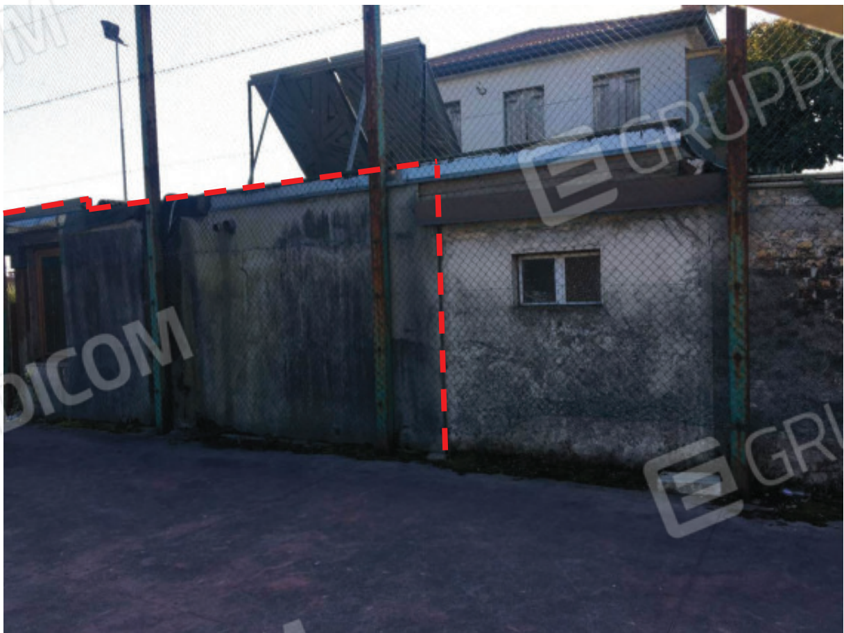
Foto n.4: Facciata Nord del Condominio con evidenziata la porzione accessoria dell'Appartamento oggetto di E.I. ( Sub.5-7/porz ).