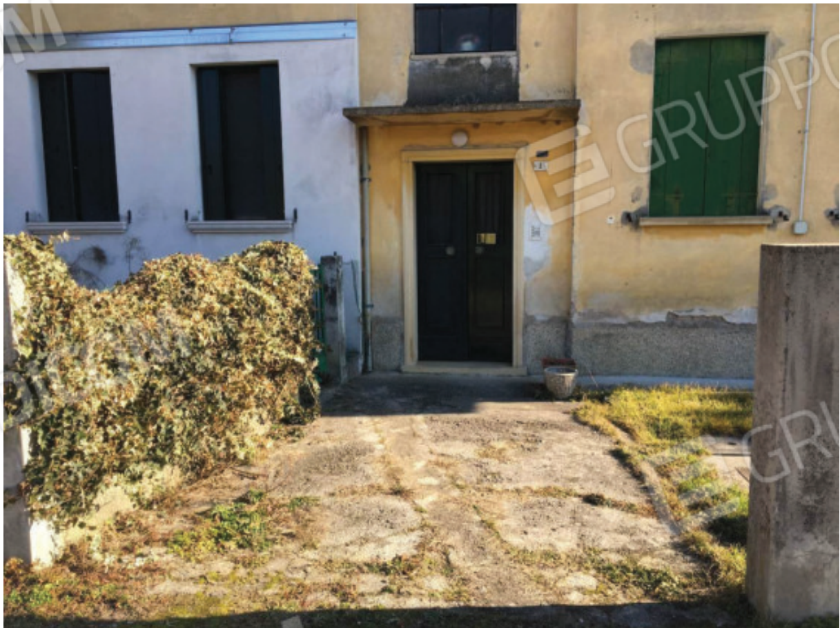
Foto n.8: Area d'accesso comune (Sub.11) antistante al portoncino d'ingresso alla palazzina condominiale che, posto ad ovest, è accessibile dalla stradina sterrata di lottizzazione, laterale di via Eritrea.