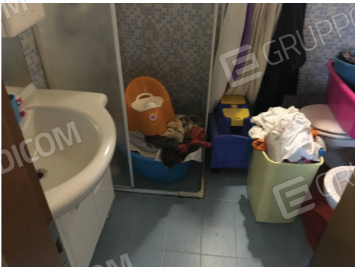
Foto n.14: Bagno abusivo realizzato in luogo dell'originario Ripostiglio isolato (Sub.1), privo di antibagno verso la zona giorno cucina/pranzo.