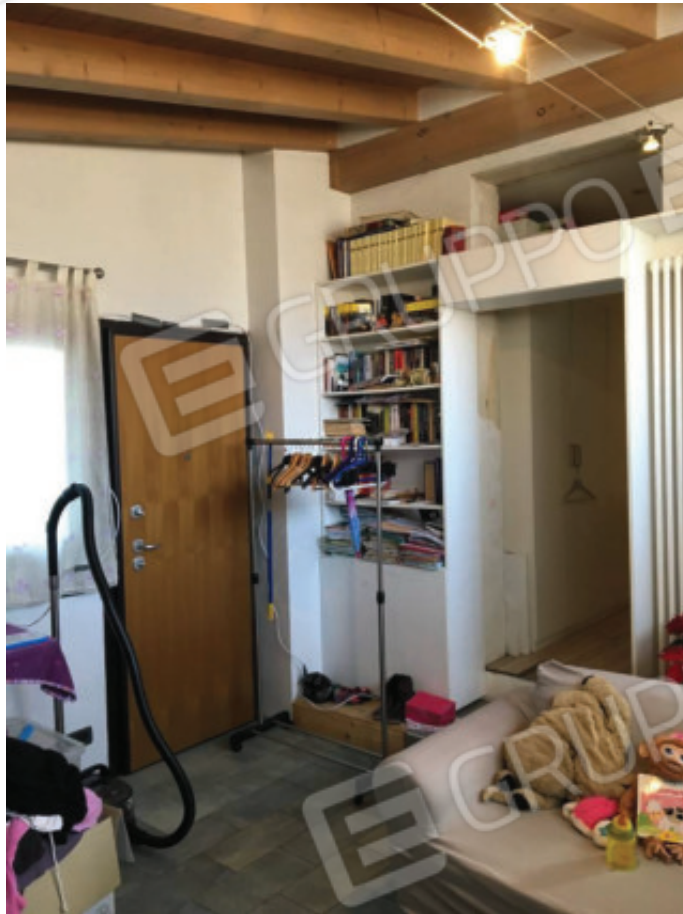
Foto n.11: Nuovo ingresso autonomo realizzato nella zona giorno con portoncino blindato che è direttamente collegato ad Est con la Corte Scoperta Esclusiva (Sub.7).