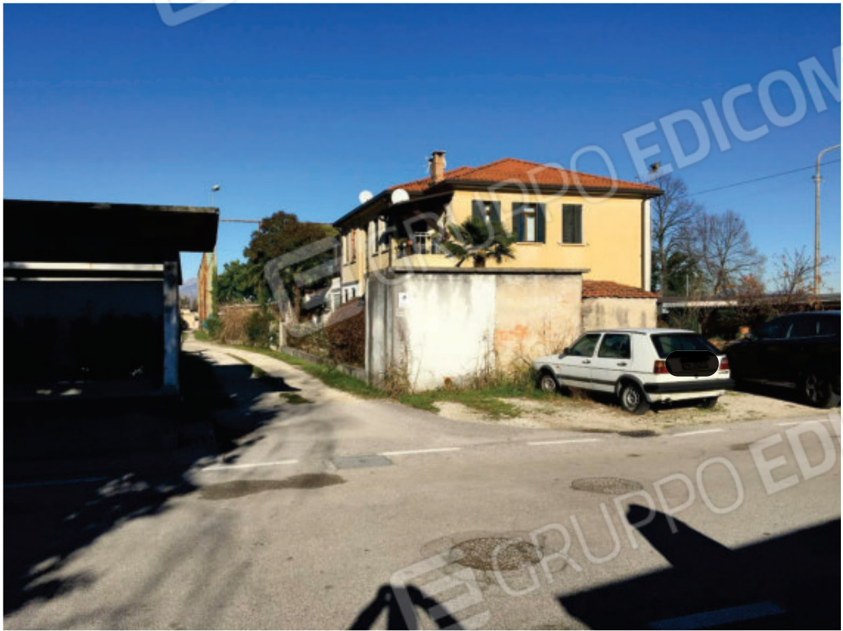
Foto n.1: Prospetti Sud ed Ovest del Fabbricato Condominiale dov'è ubicato l'Appartamento oggetto di E.I., visto dalla via pubblica Eritrea.