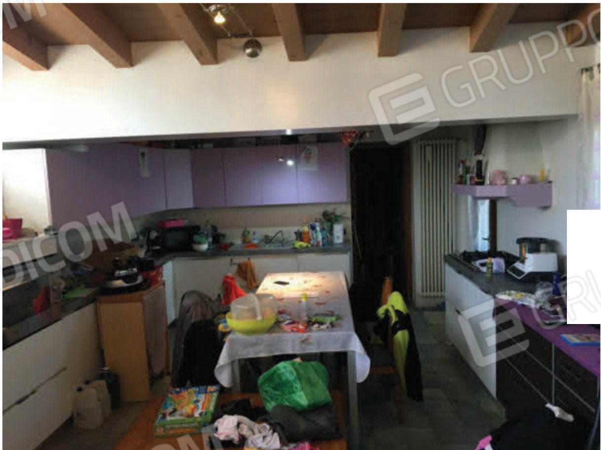
Foto n.12: Pranzo/Cucina, realizzato abusivamente accorpando l'ex autorimessa (Sub.5) con parte della corte esclusiva (Sub.7).