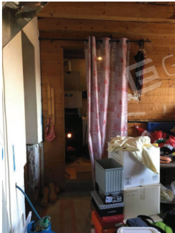
Foto n.24: Deposito con vista della porta d'ingresso della Lavanderia/C.T.; il tutto realizzato abusivamente, in luogo di un pergolato, sopra lo scoperto esclusivo (Sub.7).