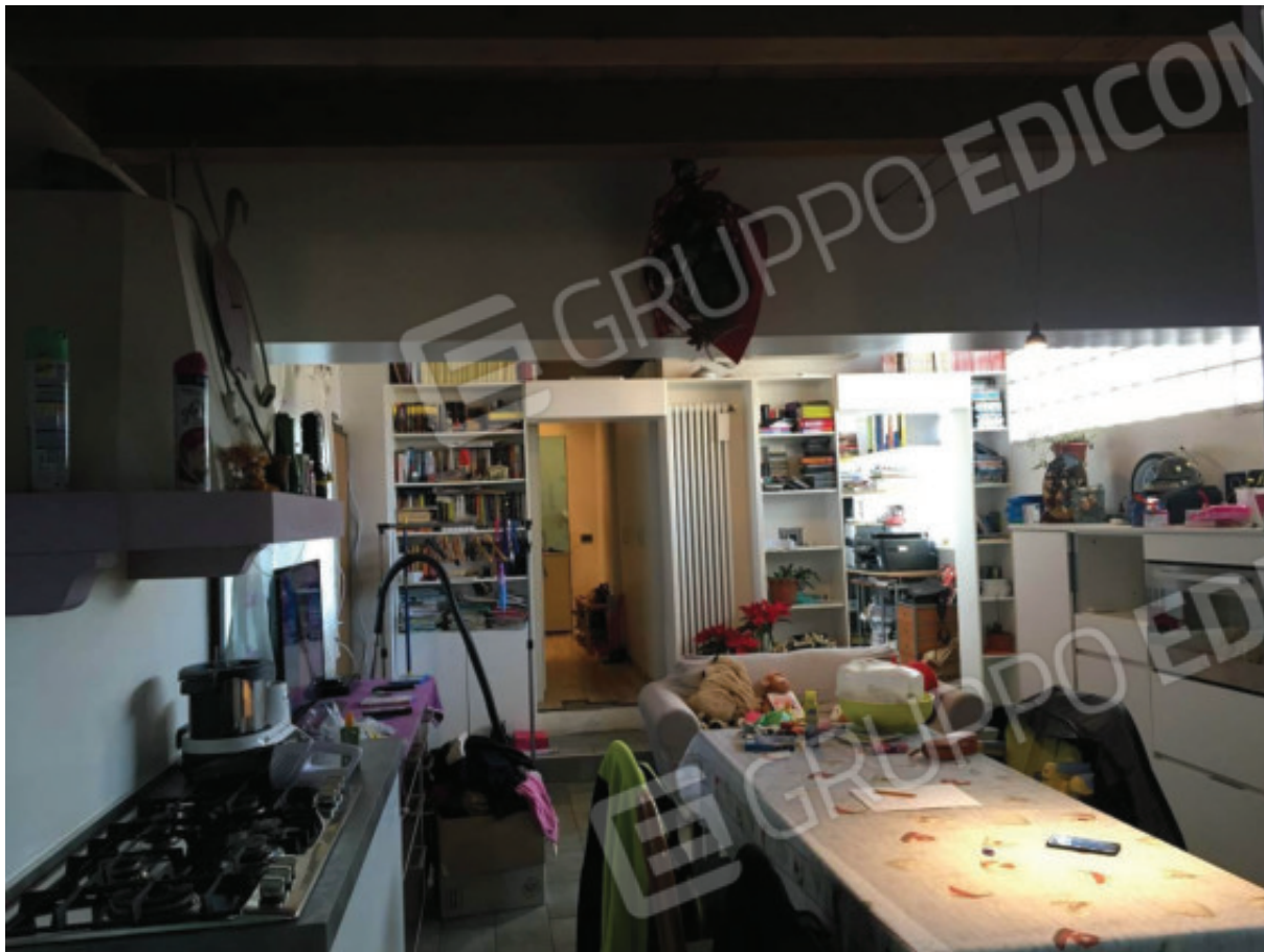
Foto n.13: Pranzo/Cucina, realizzato abusivamente accorpendo l'ex autorimessa (Sub.5) con parte della corte esclusiva (Sub.7).