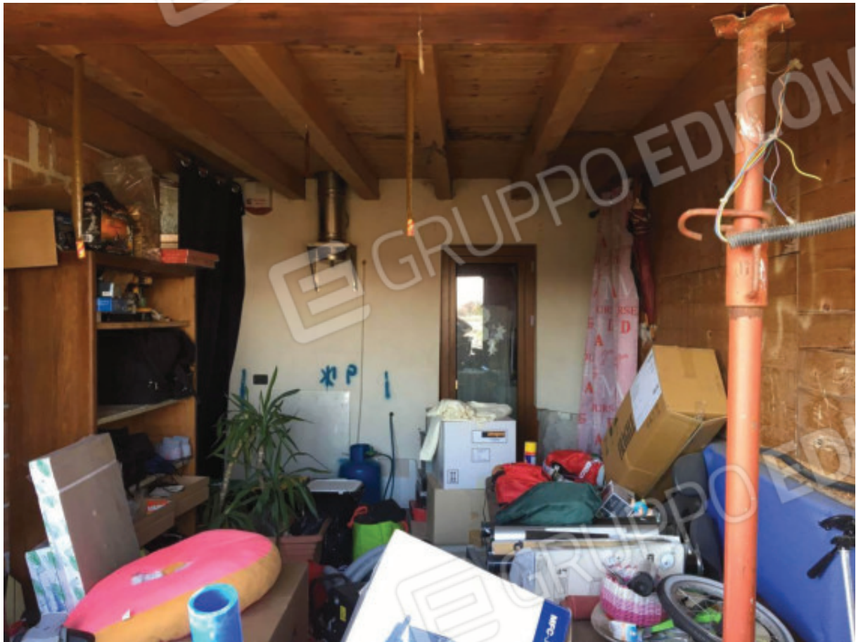
Foto n.23: Deposito abusivo che era stato autorizzato come Pergolato.