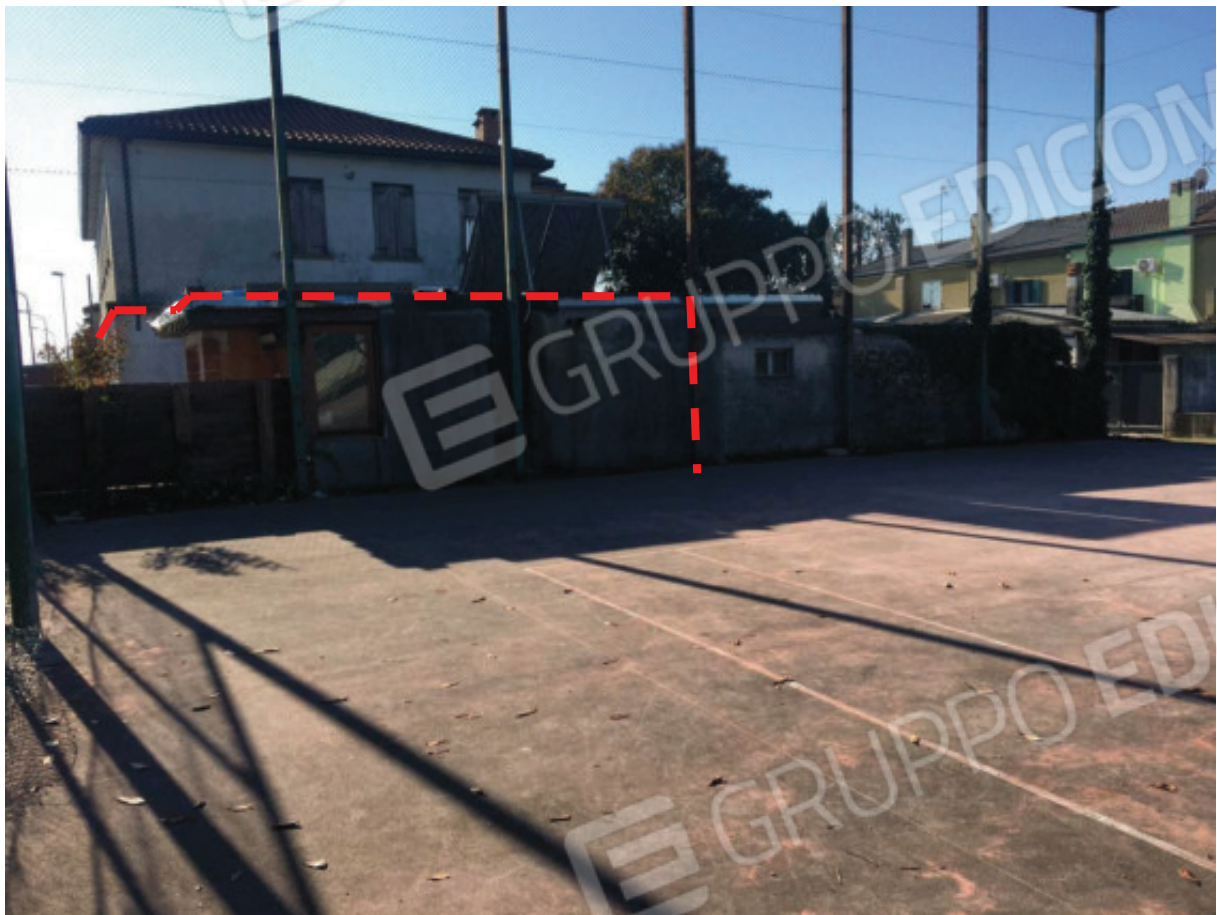
Foto n.3: Prospetto Nord del Fabbricato Condominiale, visto dal campo da tennis ( Mapp.28 ), con indicata la parte accessoria dell'Appartamento oggetto di E.I.