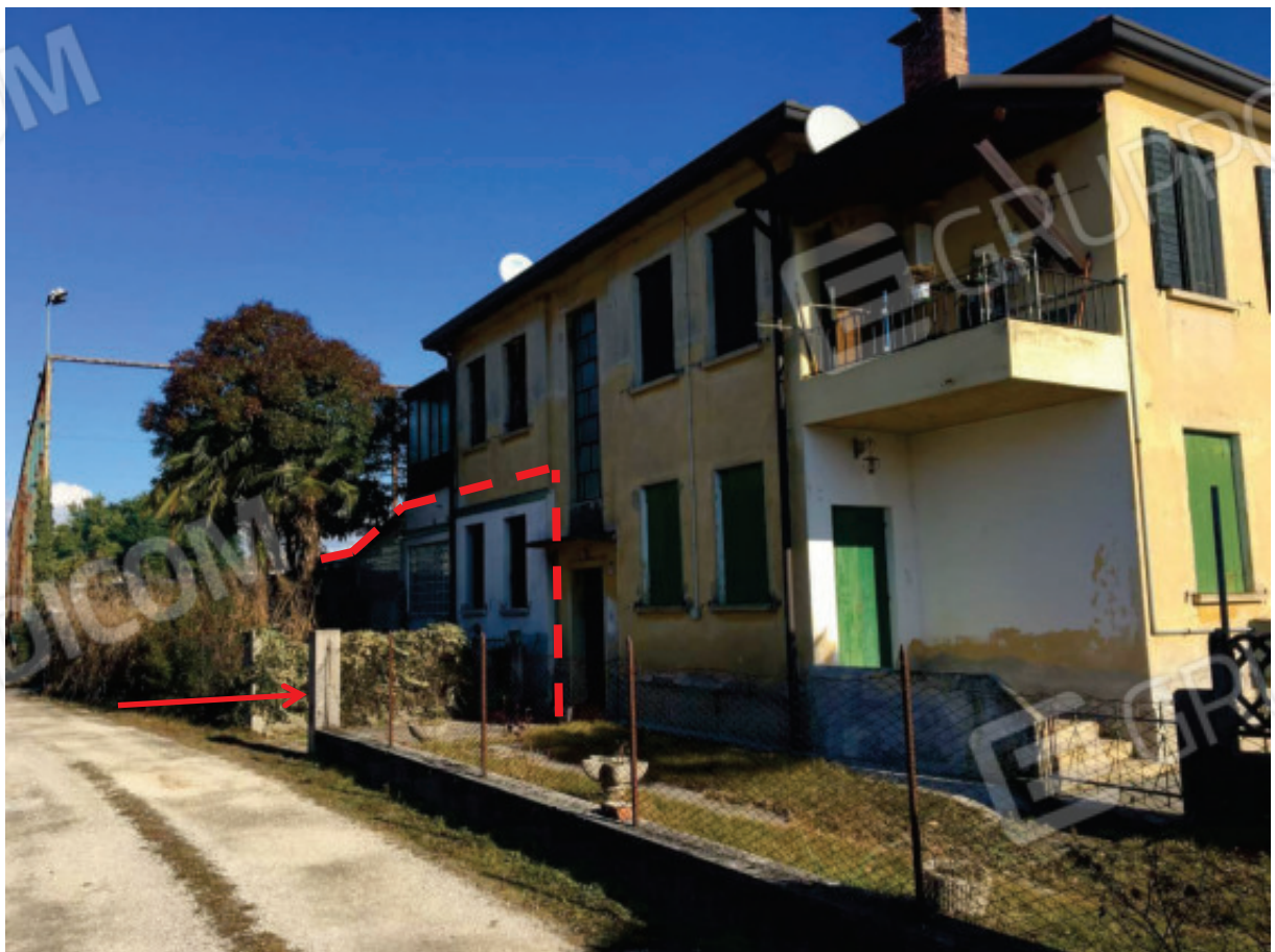
Foto n.2: Prospetto Ovest del Fabbricato Condominiale, visto dalla strada privata di lottizzazione (Mapp.405-426-428-429-309), quale laterale di Via Eritrea, con evidenziato l'Appartamento oggetto di E.I. e dell'accesso comune al vano scala condominiale (Sub.11).