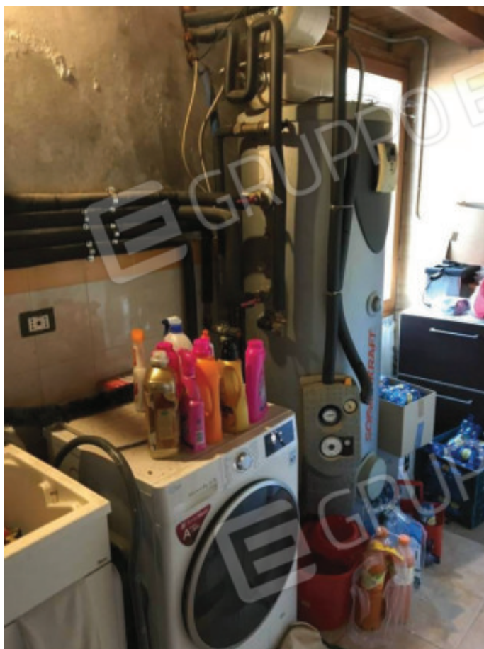
Foto n.25: Lavanderia/C.T., realizzata abusivamente lungo il confine nord, in luogo di un pergolato, sopra lo scoperto esclusivo (Sub.7).