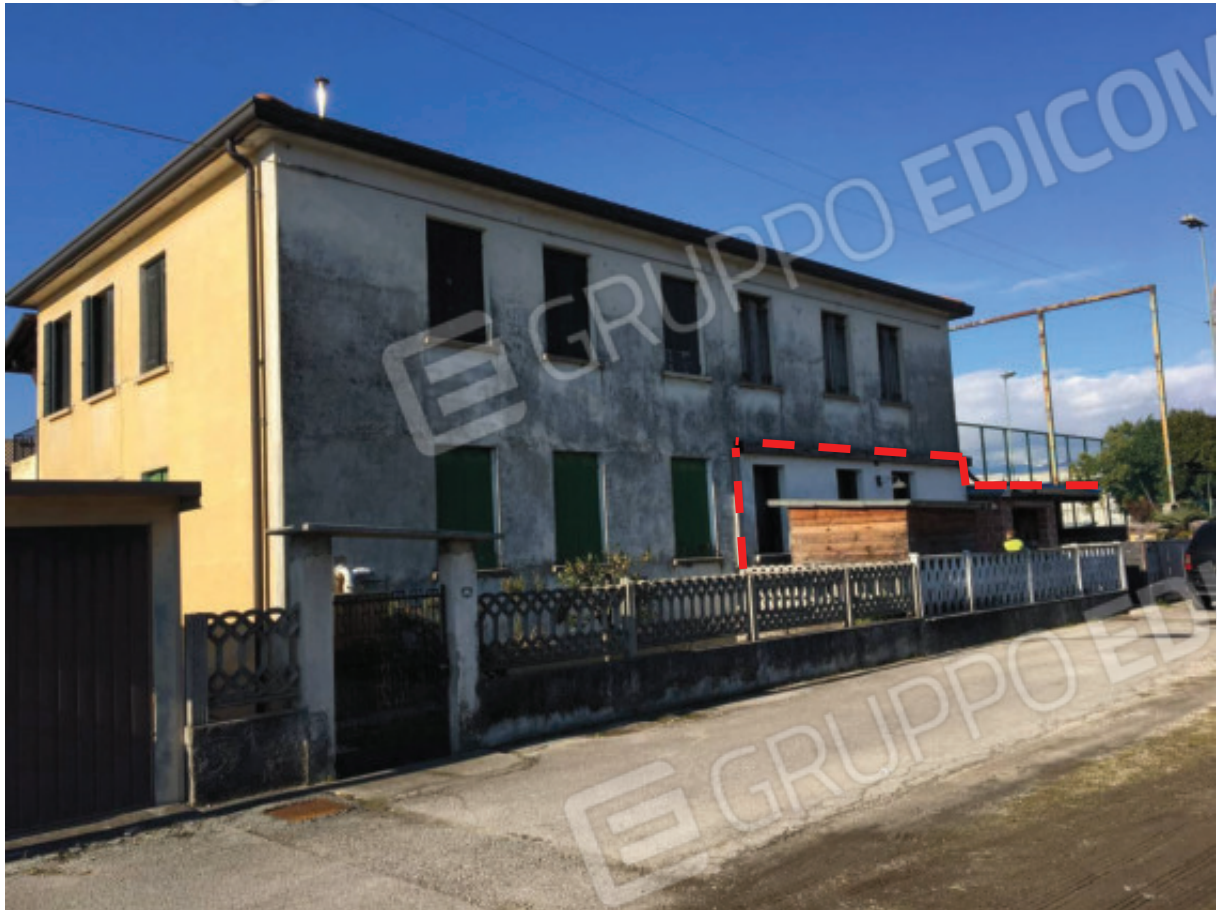
Foto n.5: Facciate Sud ed Est della palazzina condominiale, viste dalla strada ad uso pubblico quale laterale di via Eritrea, con evidenziato l'Appartamento oggetto di E.I. (Sub.1).