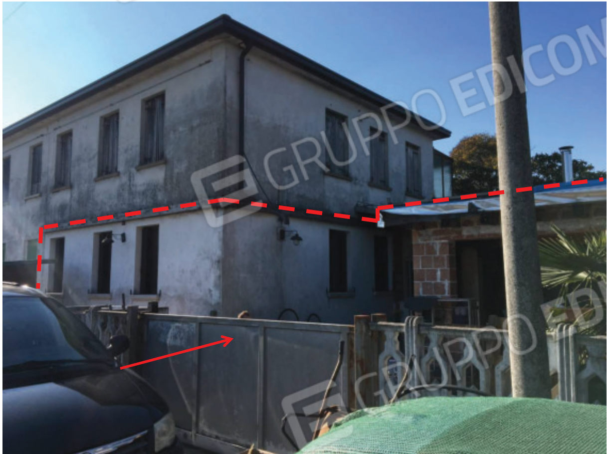
Foto n.7: Facciate Nord ed Est della palazzina condominiale con evidenziato l'Appartamento oggetto di E.I. e indicazione del relativo accesso carraio collegato alla via di uso pubblico, laterale di via Eritrea.