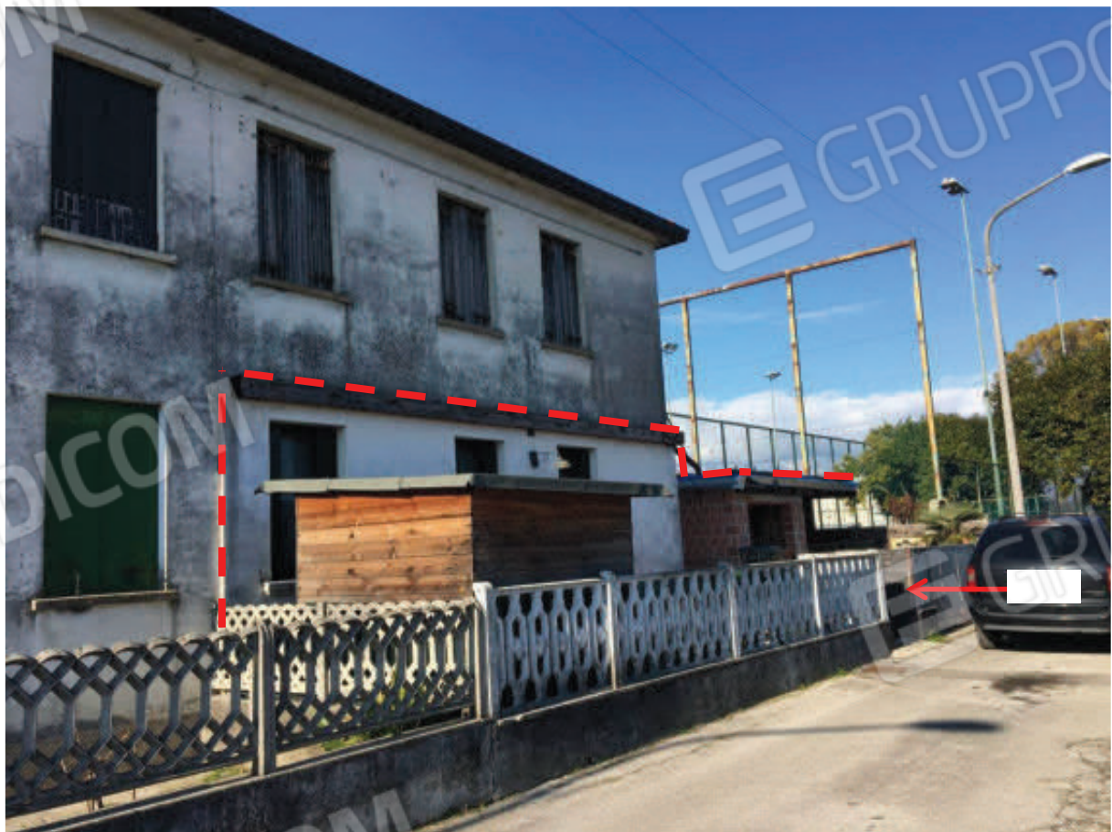
Foto n.6: Facciata Est della palazzina condominiale con evidenziato l'Appartamento oggetto di E.I. (Sub.1) e indicazione del relativo accesso pedonale alla Corte Esclusiva (Sub.7).