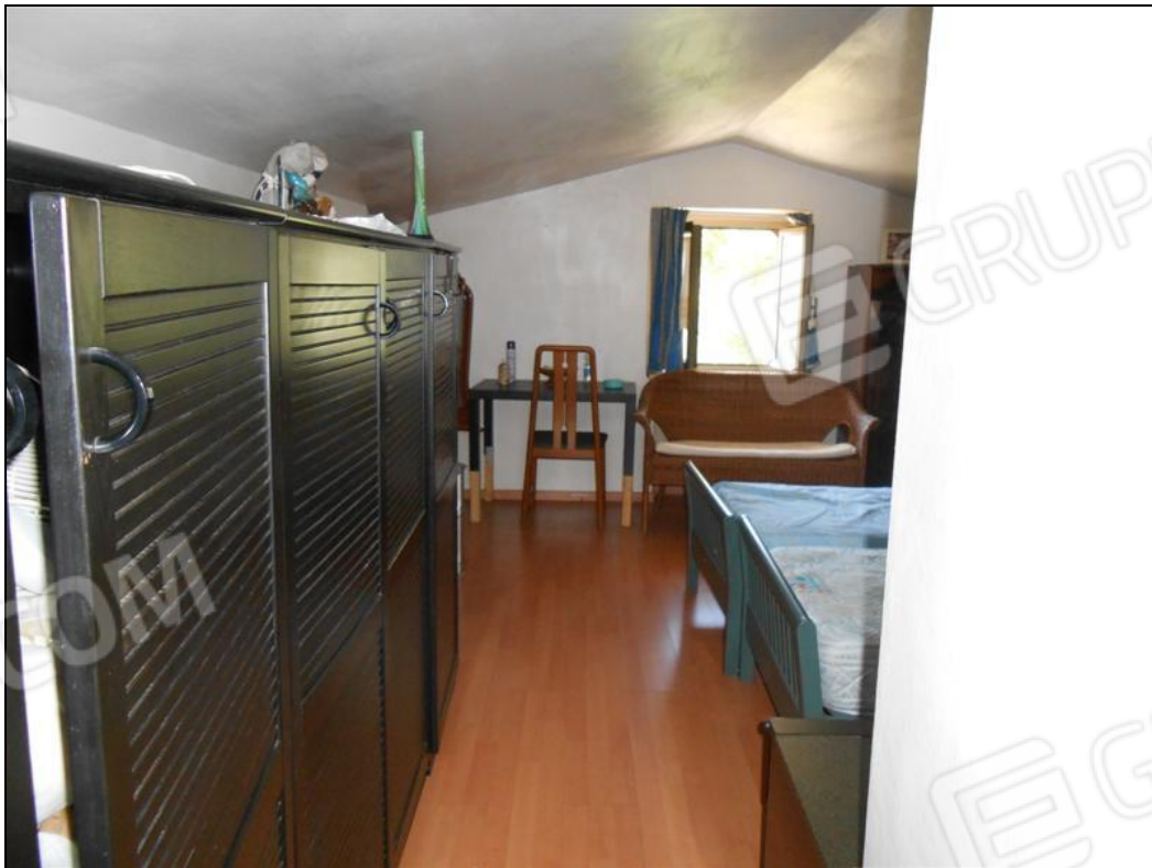
Soffitta – locale centrale