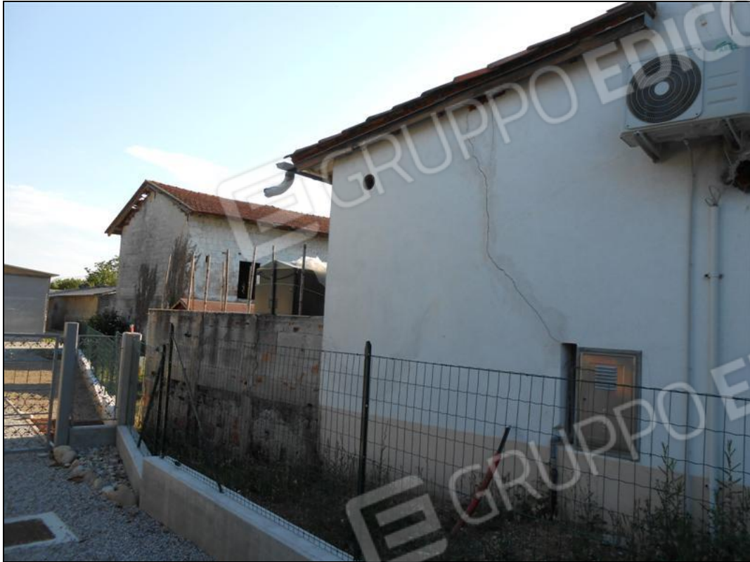
Recinzione sul lato est del complesso e veduta del fabbricato deposito