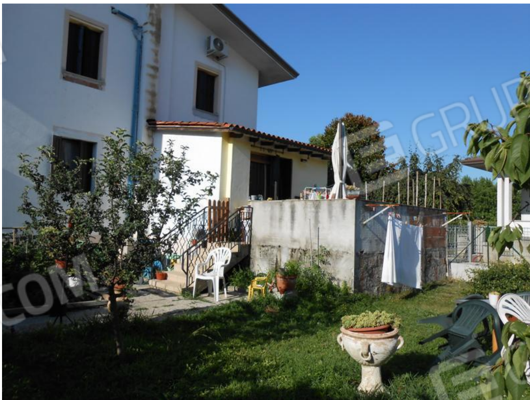
Veduta dell'abitazione e della terrazza comunicante con lo scoperto