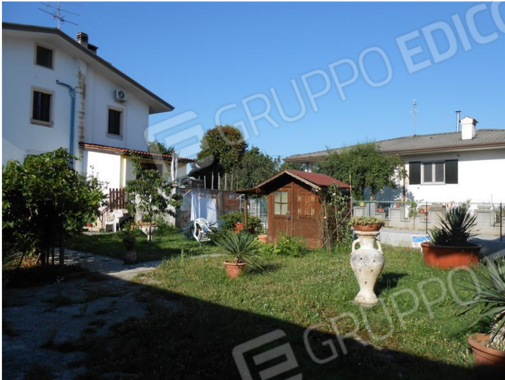
Veduta dello scoperto