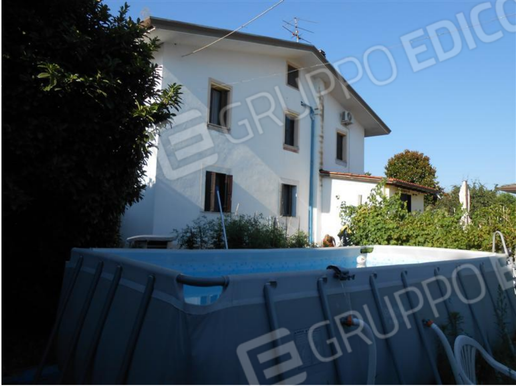
Veduta del fabbricato abitazione dallo scoperto