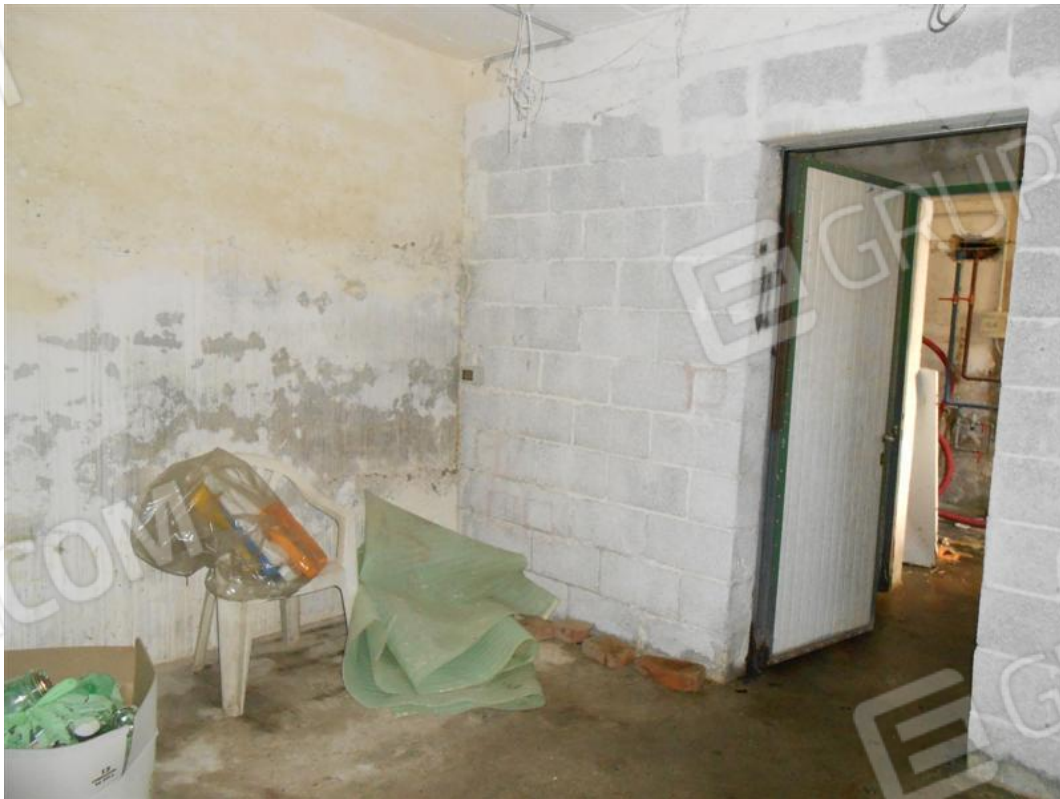
Cantina e disimpego