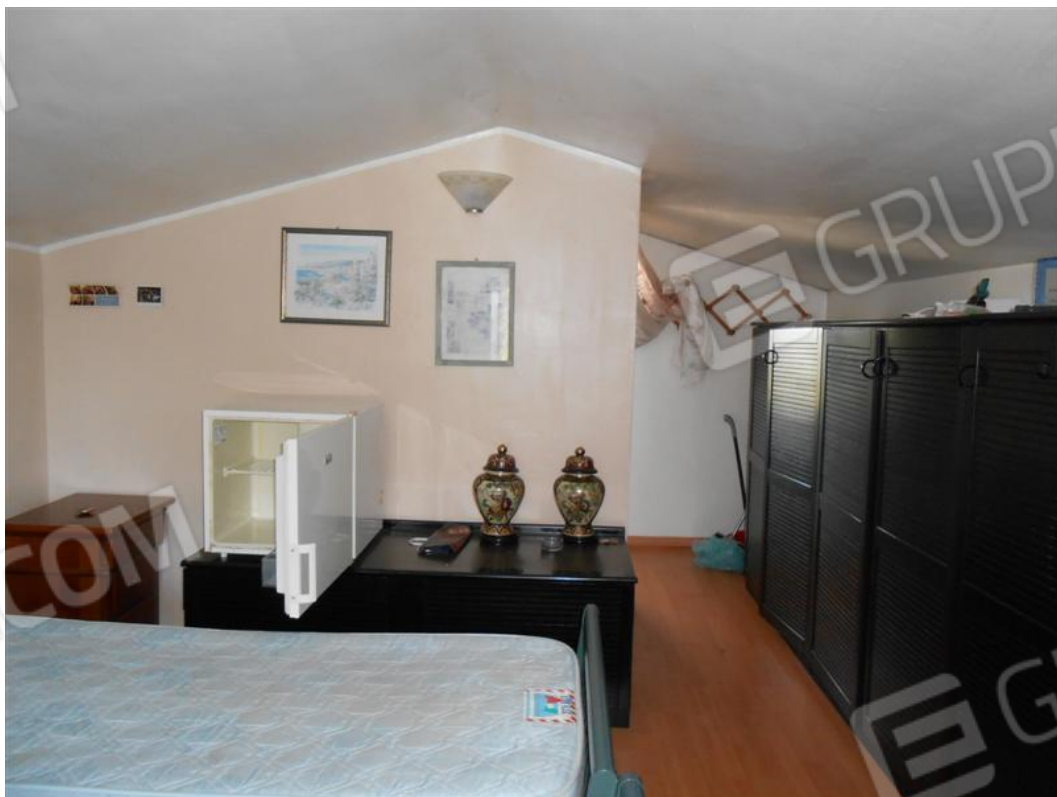
Soffitta – locale centrale