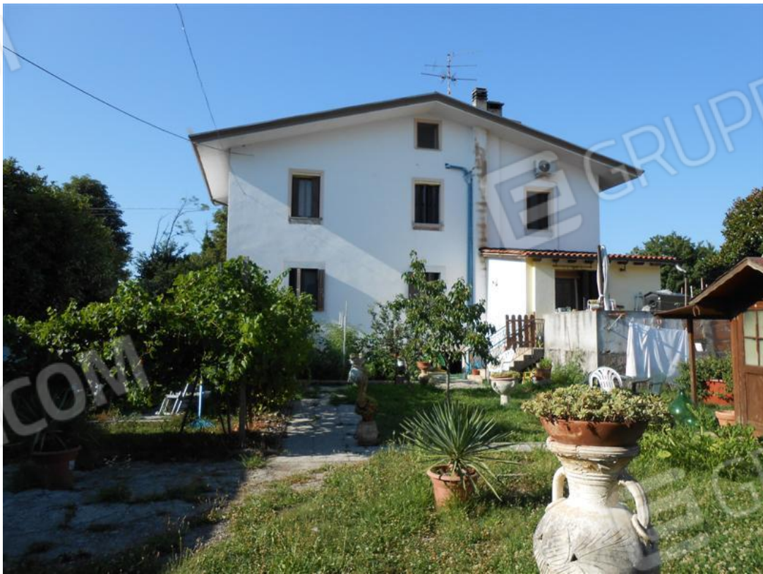
Fronte sud del fabbricato abitazione e veduta dello scoperto