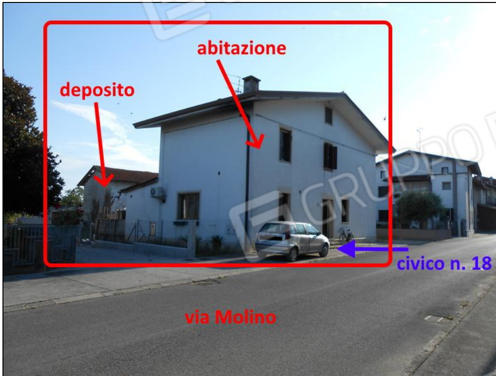
Veduta del complesso pignorato dalla strada via Molino

la documentazione fotografica dettagliata è riportata negli allegati alla relazione peritale: ALL. 5.1.1, ALL. 5.1.2, ALL. 5.1.3, ALL. 5.1.4, ALL. 5.1.5