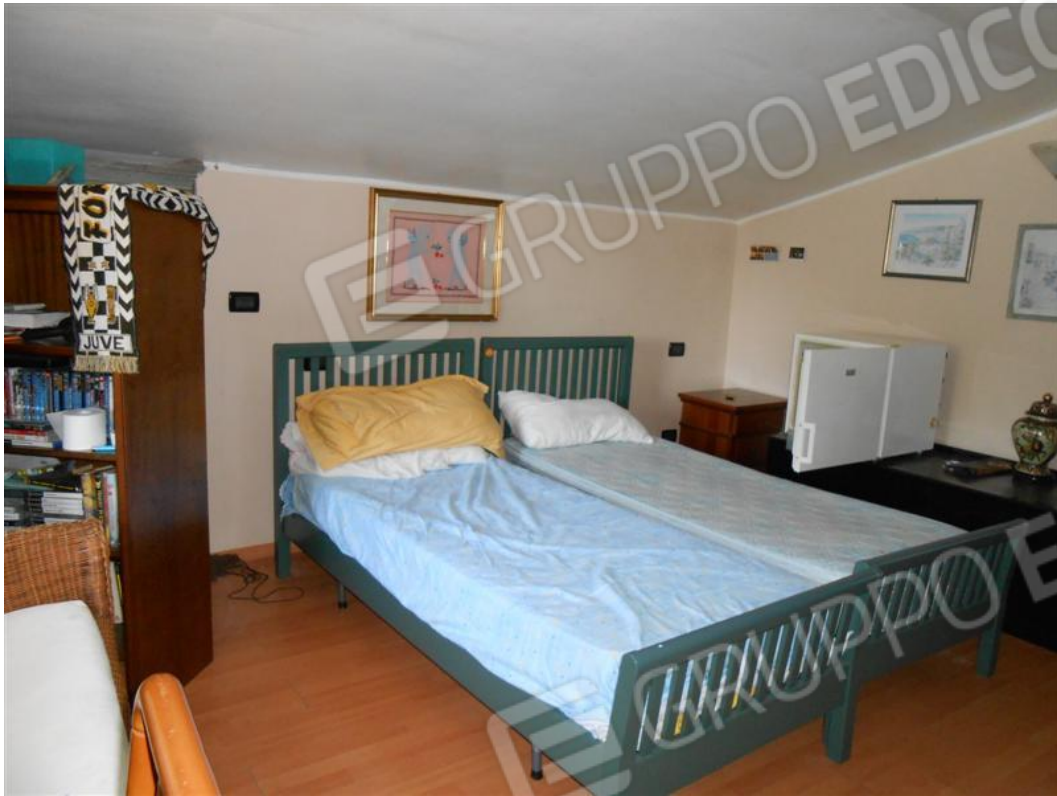
Soffitta – locale centrale