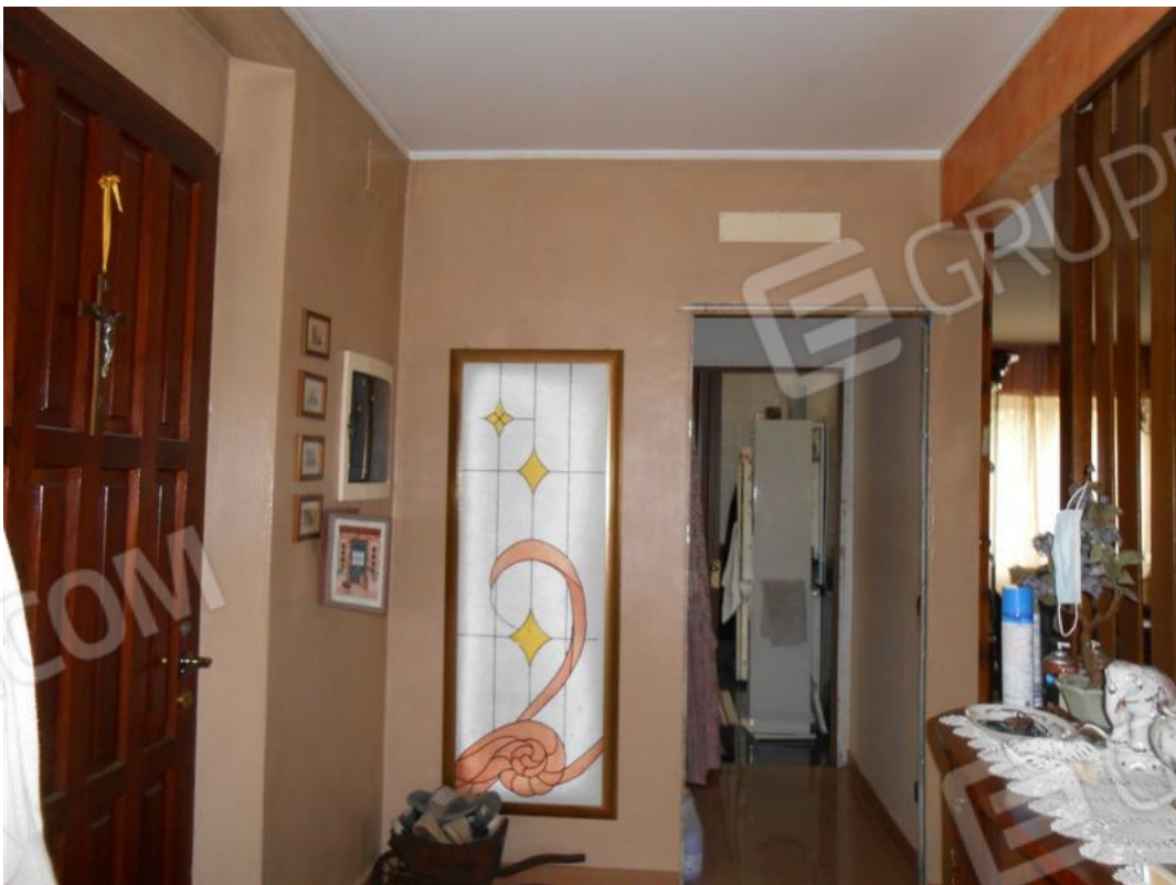
Veduta antibagno dall'ingresso