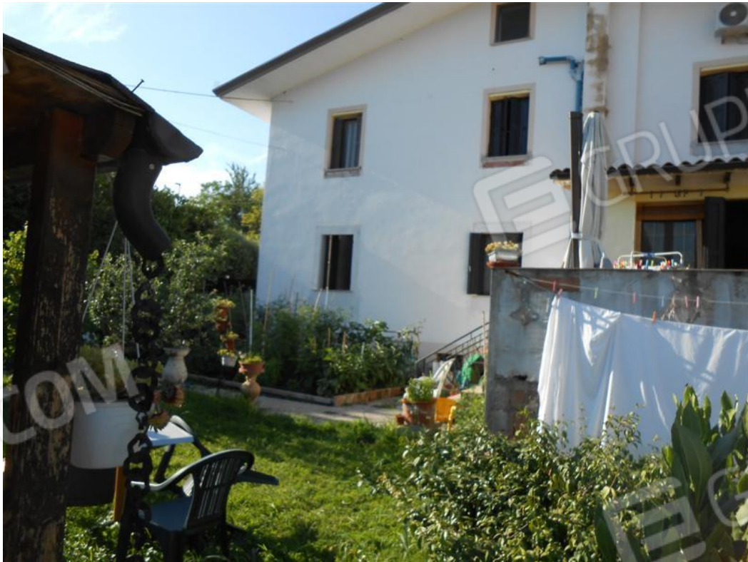
Veduta dello scoperto