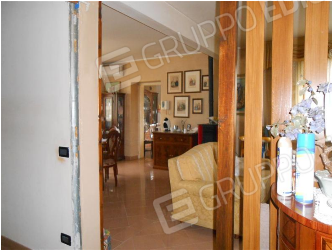
Ingresso e veduta soggiorno