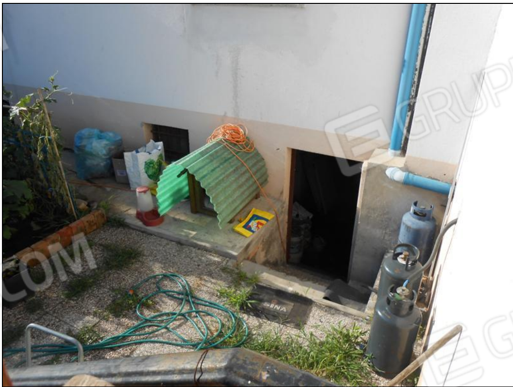
Scala di comunicazione con lo scoperto