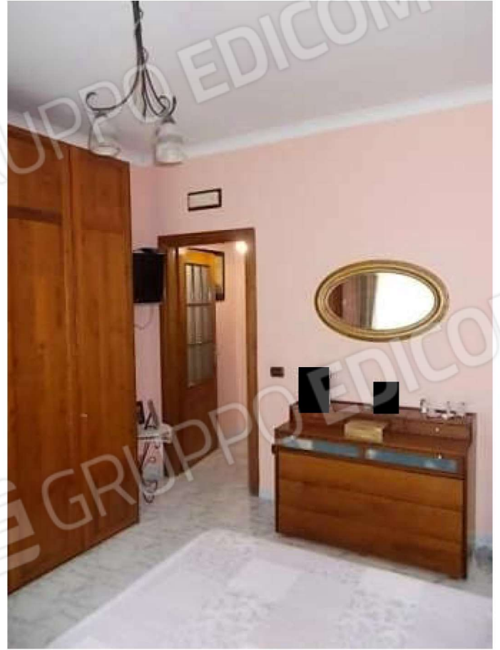
camera n. 1