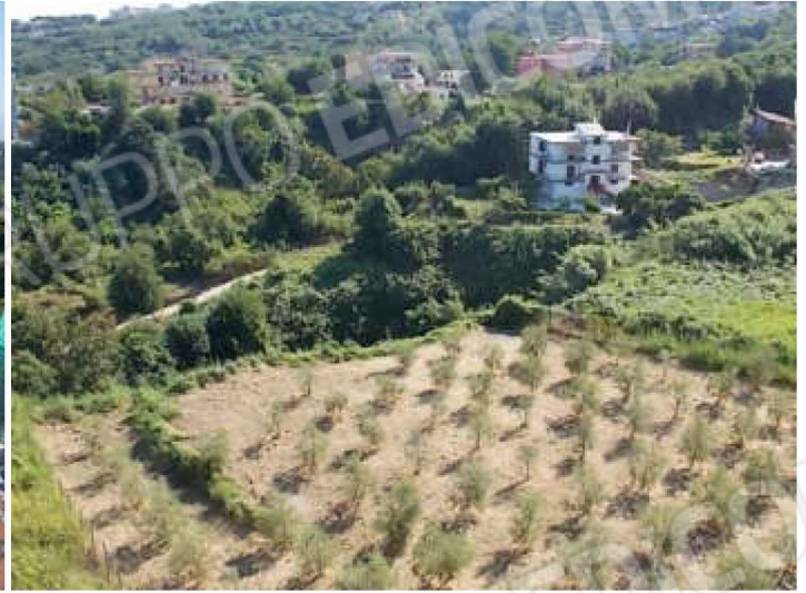
circondario visto dal terrazzo