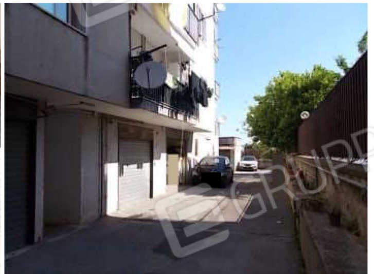
area di manovra e rampa di accesso dalla strada