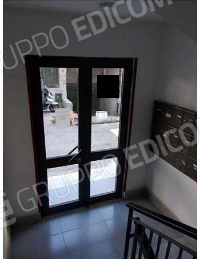
accesso al fabbricato dal viale di disimpegno tra fabbricati