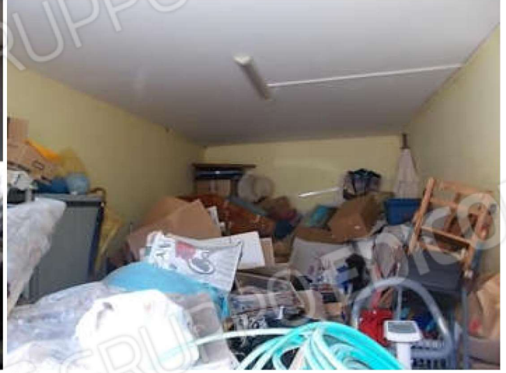
viste interne del box auto