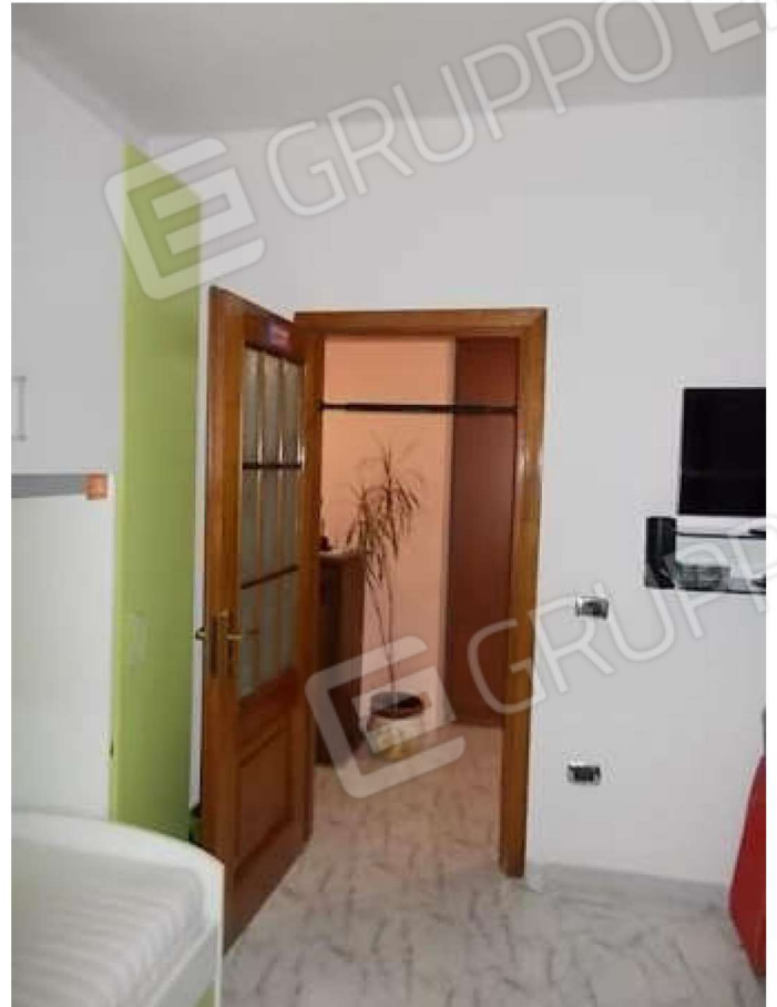
camera n. 2