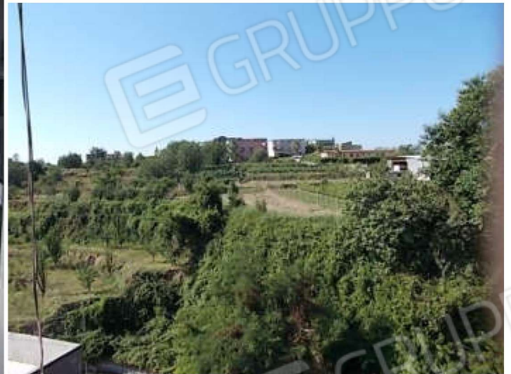
balcone a servizio della camera n. 1 e circondario