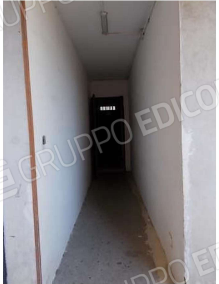
collegamento tra le scale ed il viale di accesso al box auto