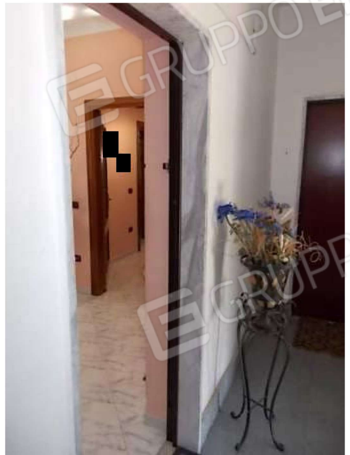
scala ed accesso all'alloggio