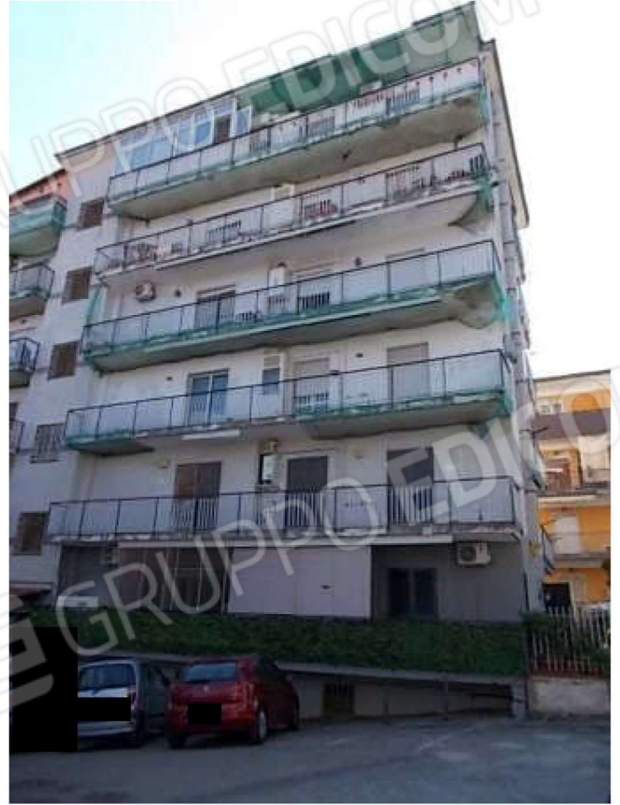
viste esterne del fabbricato e dell'alloggio