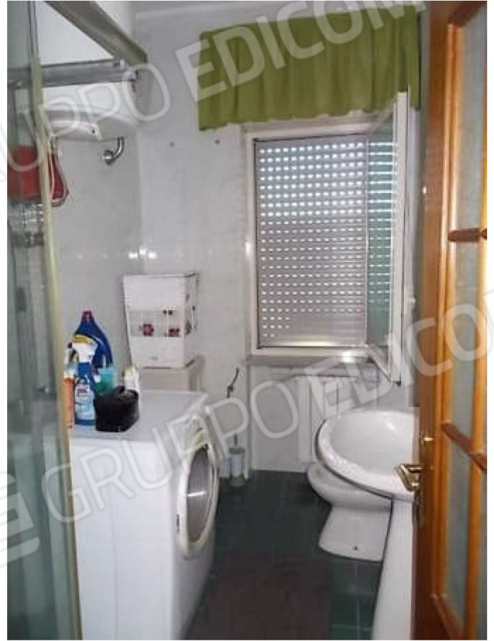
bagno e w.c.