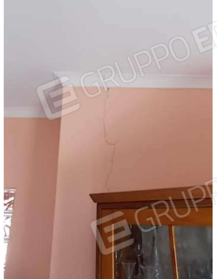
viste delle lesioni da distacco visibili nell'alloggio pignorato