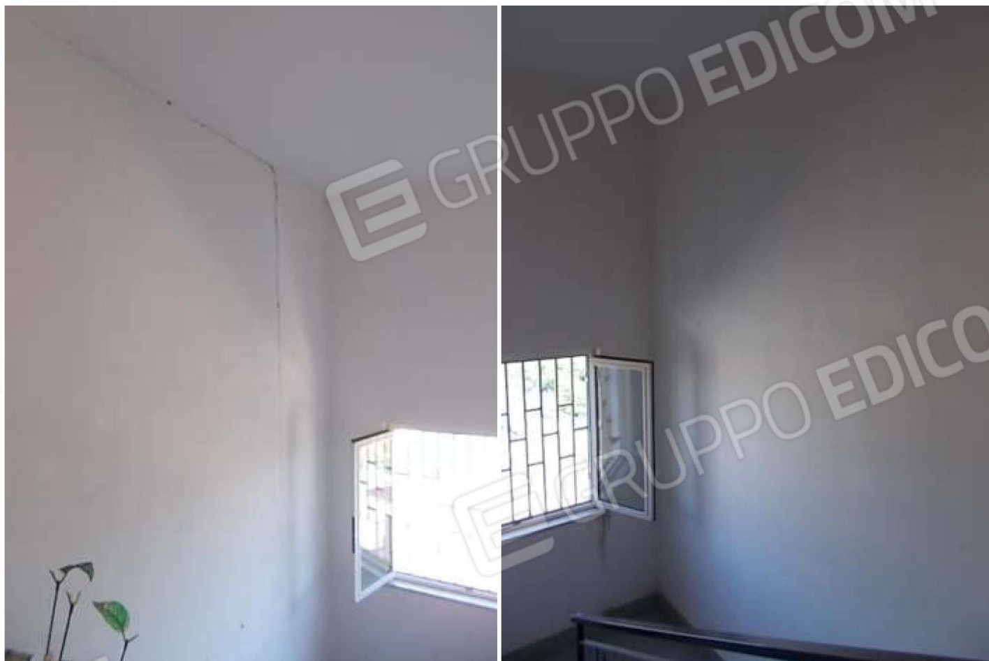
viste delle lesioni da distacco visibili nella scala del fabbricato