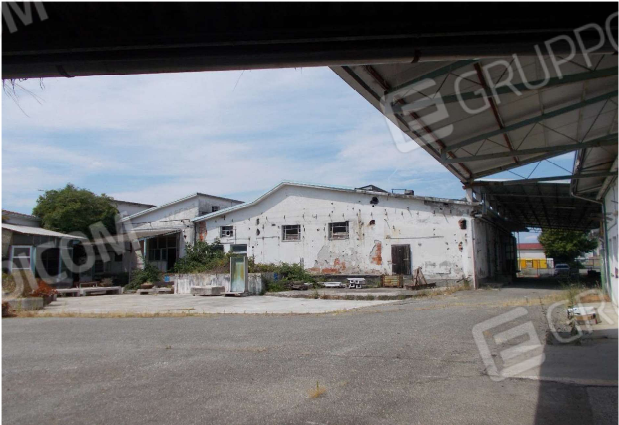
4. Vetusti fabbricati situati entrostanti l'area di pertinenza