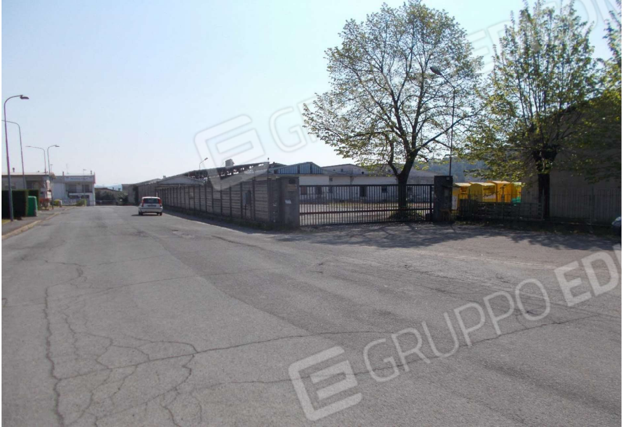
1. "Ex Caseificio Merlo" - particolare accesso da Via B. Salvadori civico nr. 64