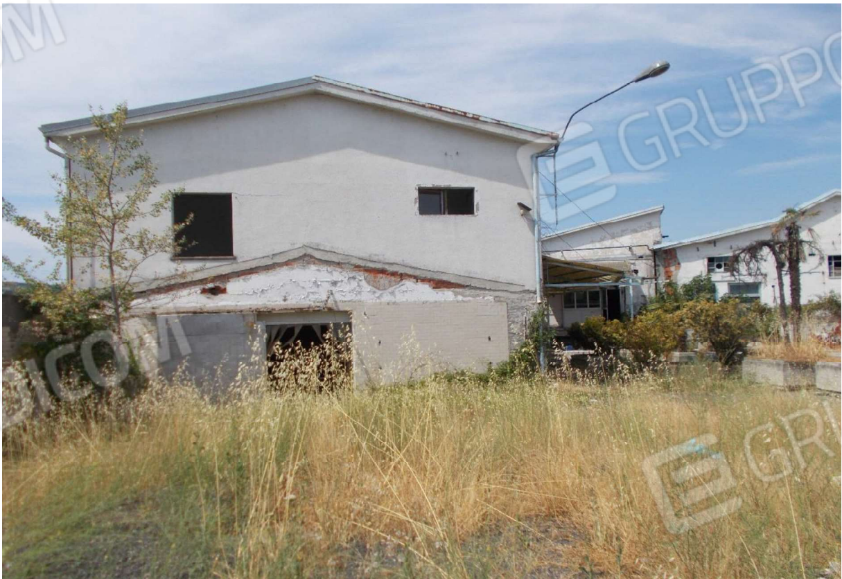
6. Vetusti fabbricati situati entrostanti l'area di pertinenza