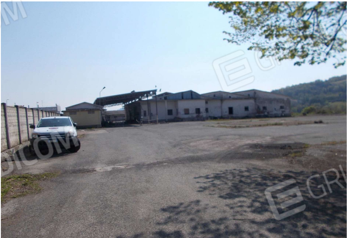
2. Ampia area cortilizia di pertinenza del complesso immobiliare