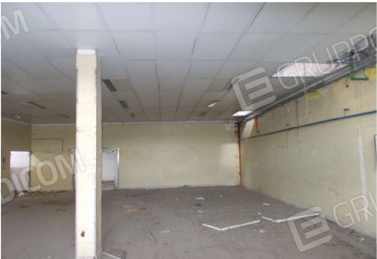
10. Particolare locali interni