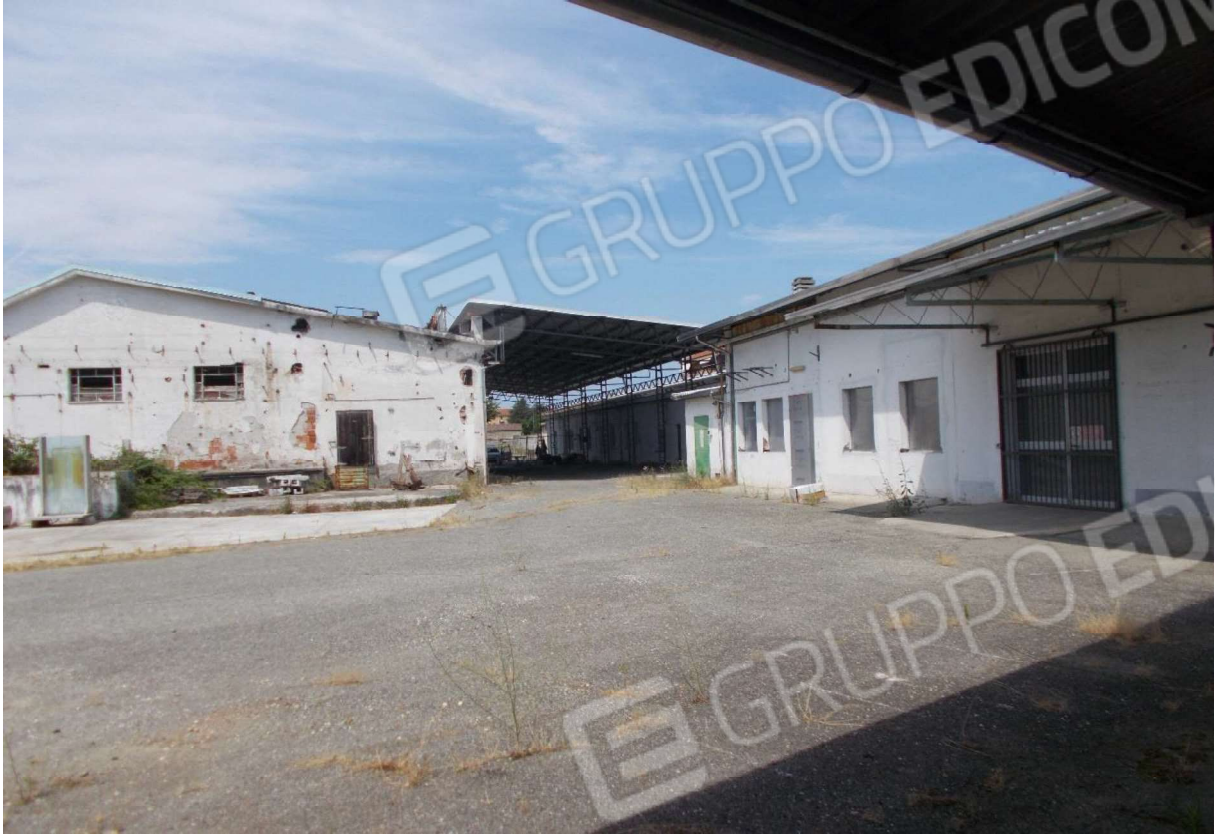
5. Vetusti fabbricati situati entrostanti l'area di pertinenza