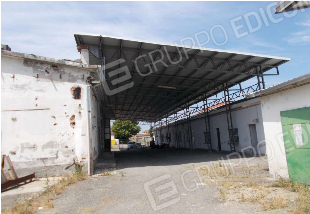
7. Particolare tettoia