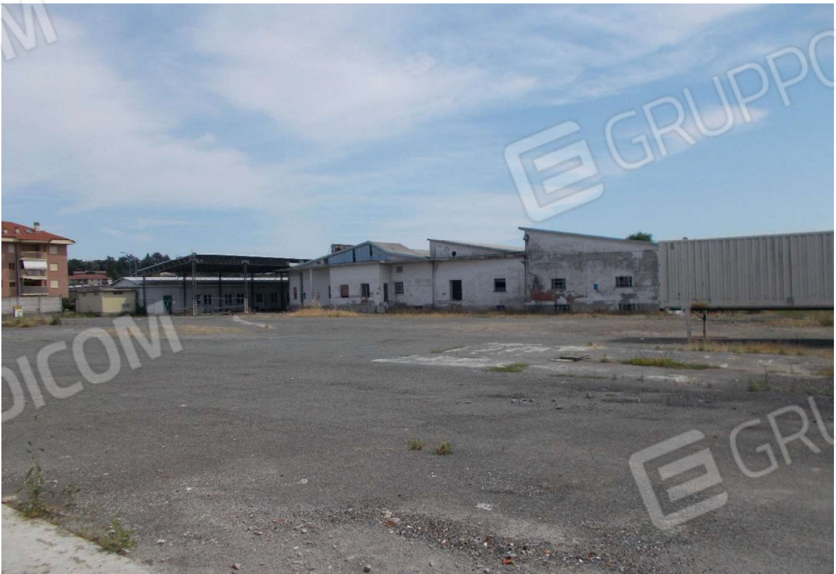
8. Ampia area cortilizia di pertinenza