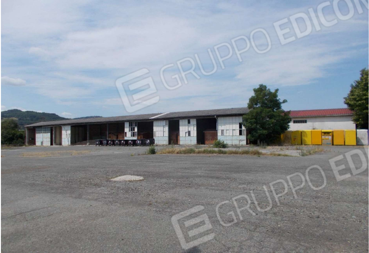
3. Vetusti fabbricati situati entrostanti l'area di pertinenza