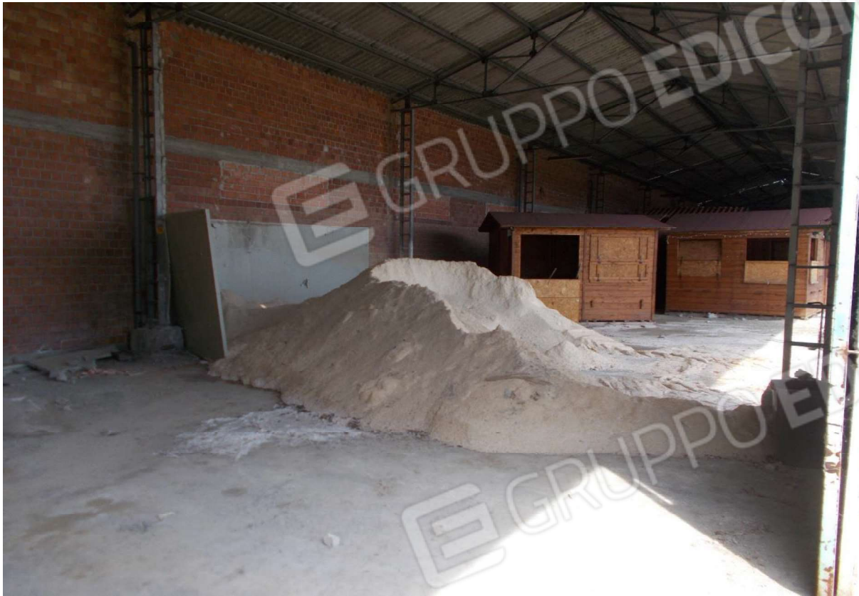
11. Particolare locali interni