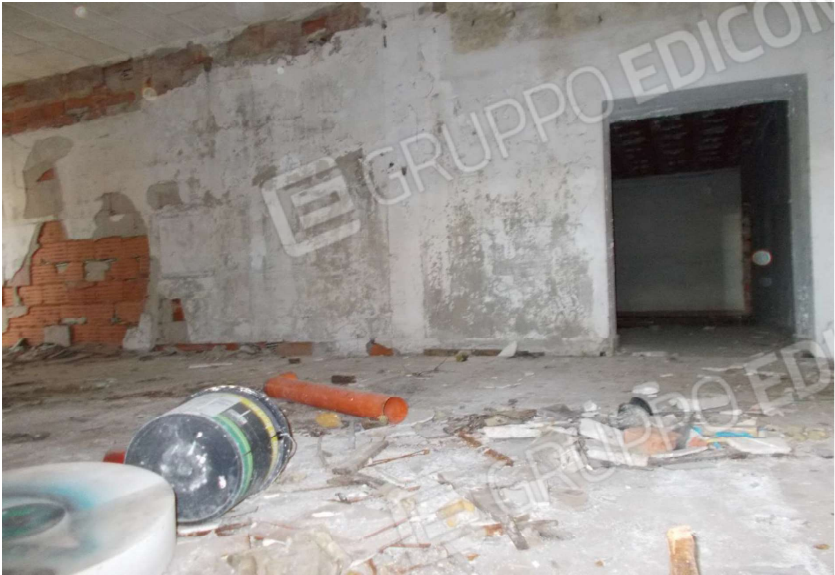
9. Particolare locali interni