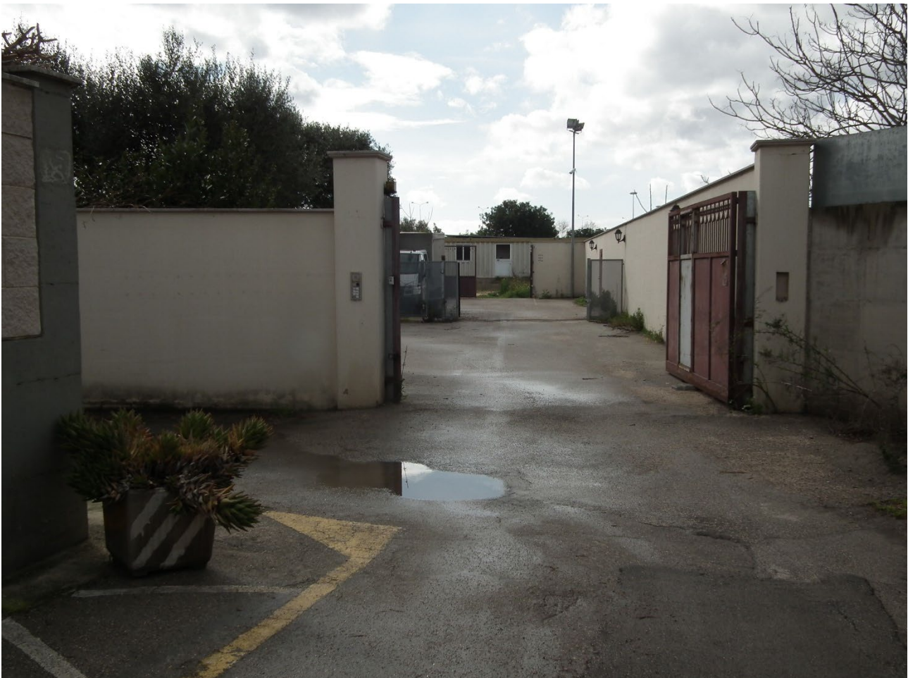
Foto 2: Cancello di accesso alla particella 999 e, tramite questa, alla particella 1000