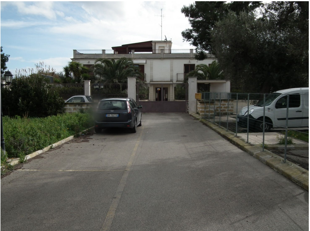
Foto 4: Zona asfaltata della particella 1000, con servitù di fatto per accesso alla particella 70