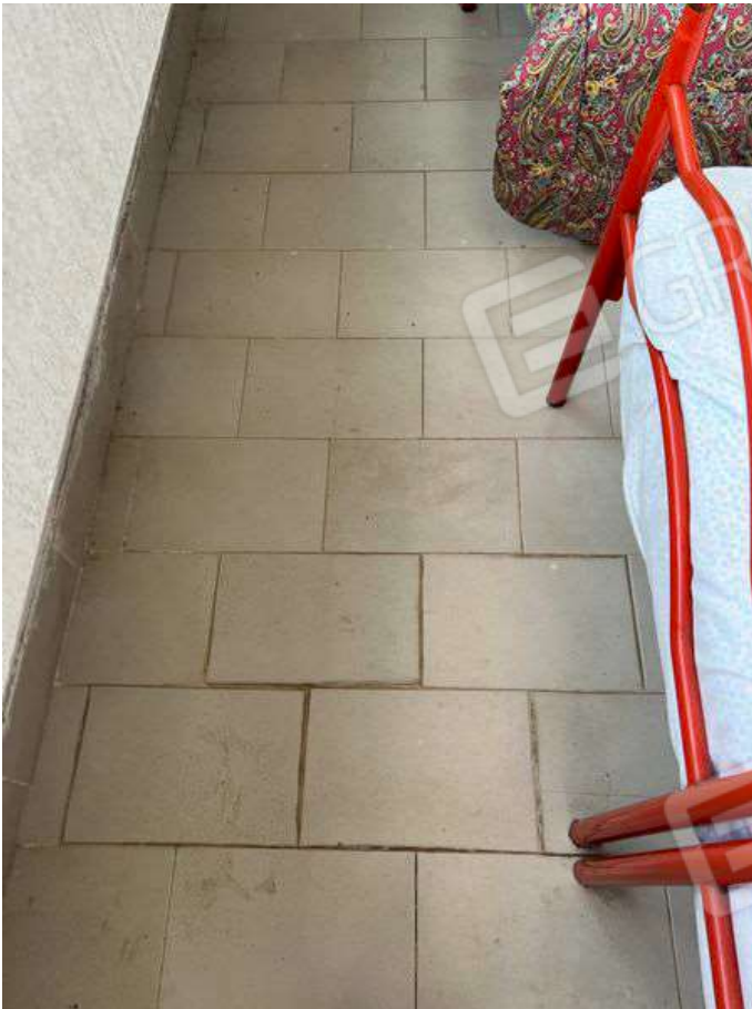
Foto 19 - Particolare degrado delle rifiniture nella veranda a piano secondo