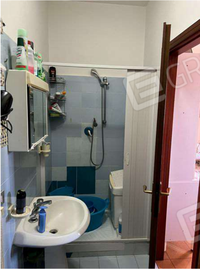
Foto 11 - Vista interna bagno