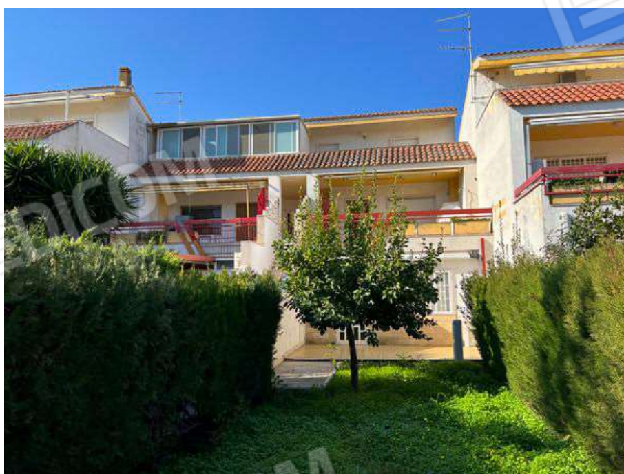
Foto 2 – Prospetto Principale fabbricato condominiale in Via Giuseppe De Nittis, n.5