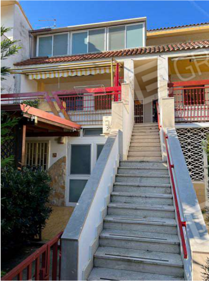
Foto 3 - Prospetto Principale fabbricato condominiale Via Giuseppe De Nittis, n.5