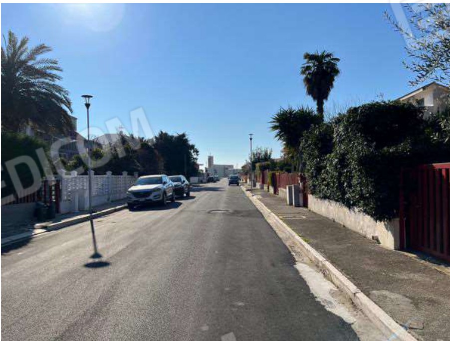
Foto 4 – Vista della viabilità di accesso strada pubblica Via Giuseppe De Nittis