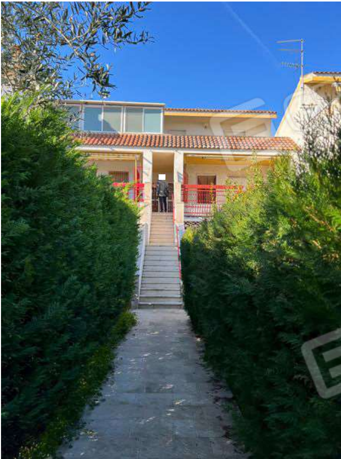
Foto 5 – Vista vialetto comune d'accesso all'appartamento dal civico 5 di Via Giuseppe De Nittis