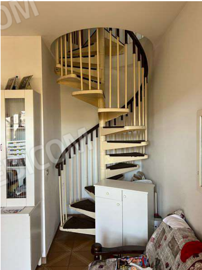
Foto 12 - Vista interna della scala a chiocciola di collegamento tra i piani primo e secondo