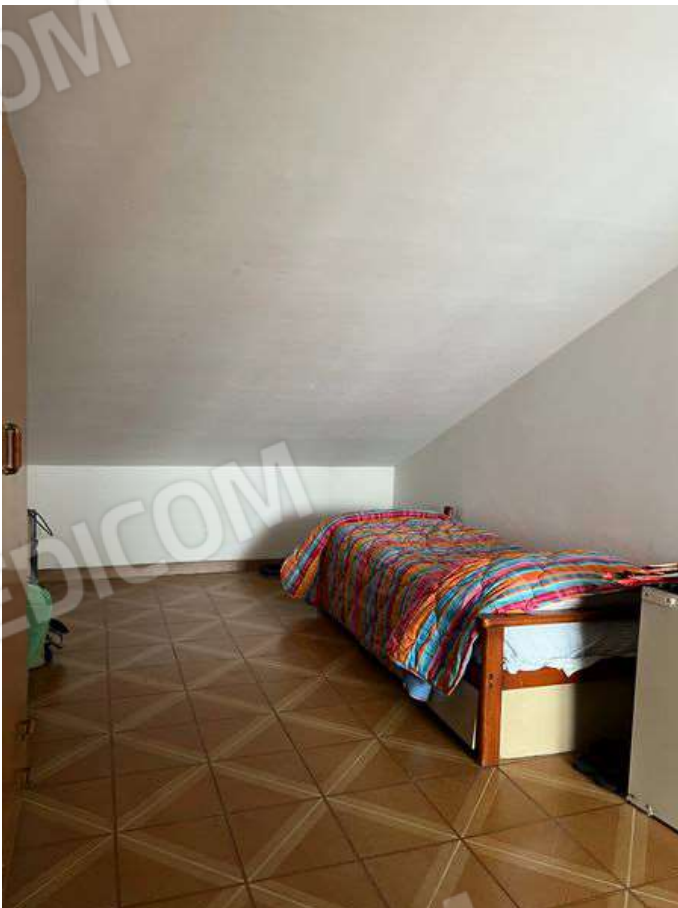
Foto 16 - Vista interna vano a piano secondo mansardato