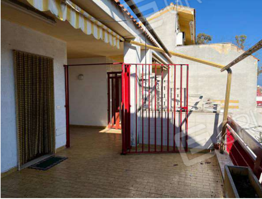
Foto 7 – Vista terrazzino pertinenziale a livello a piano primo e cancelletto in ferro di accesso all'unità immobiliare