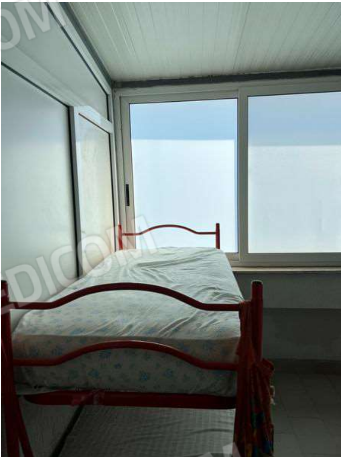
Foto 20 - Vista interna veranda a piano secondo