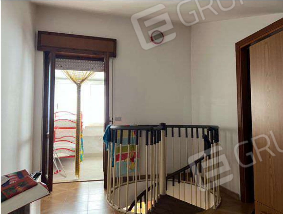
Foto 15 - Vista interna della scala a chiocciola di collegamento tra i piani primo e secondo