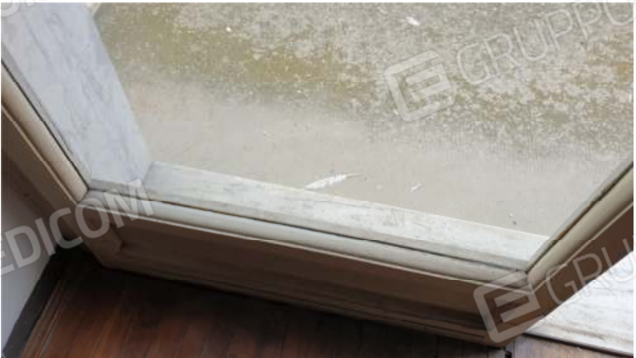
Viste dei serramenti esterni