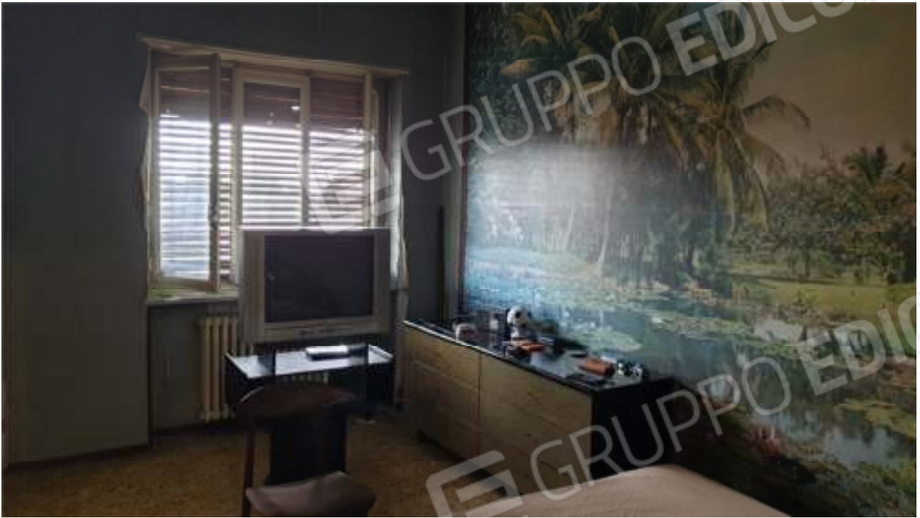
Vista della camera 2