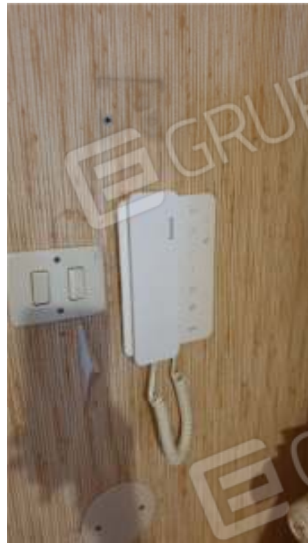
Viste del citofono