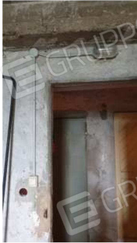
Vista dell'impianto elettrico della cantina