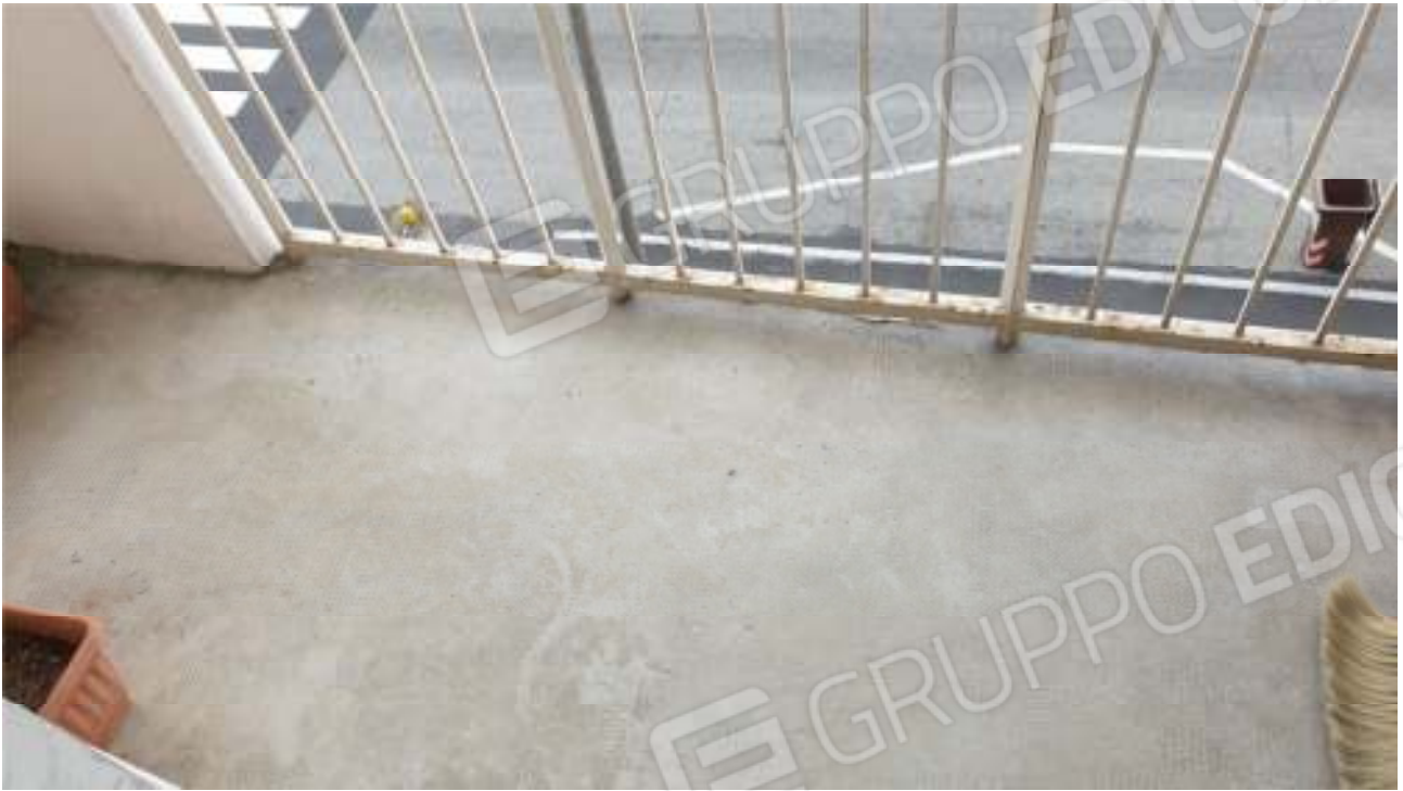
Vista del balcone