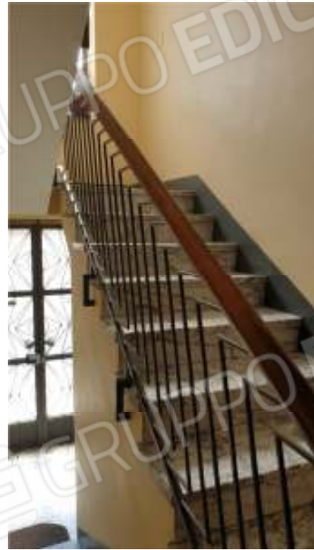
Viste della scala e dell'atrio comune