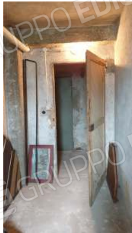
Viste del locale cantina