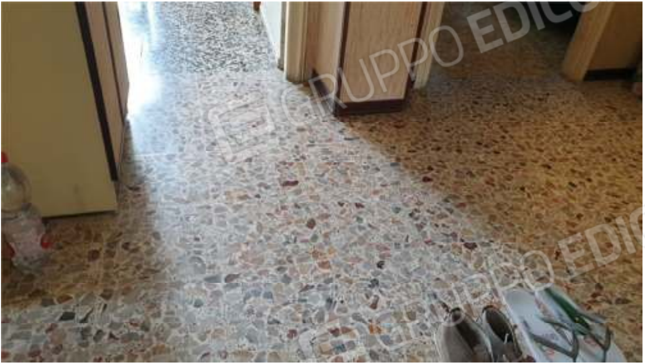
Vista del pavimento dell'ingresso