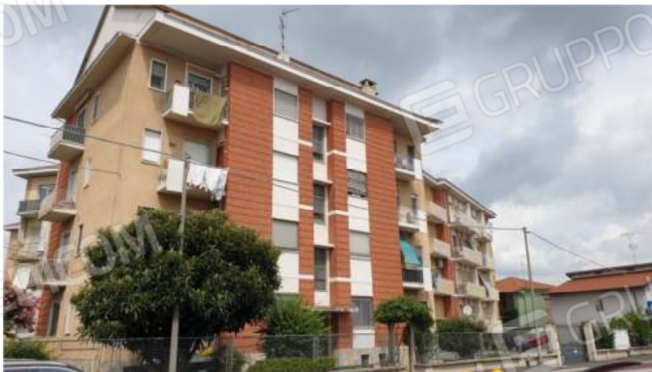
Viste da via Tagliamento