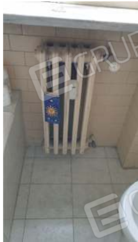
Viste dei terminali del impianto termico