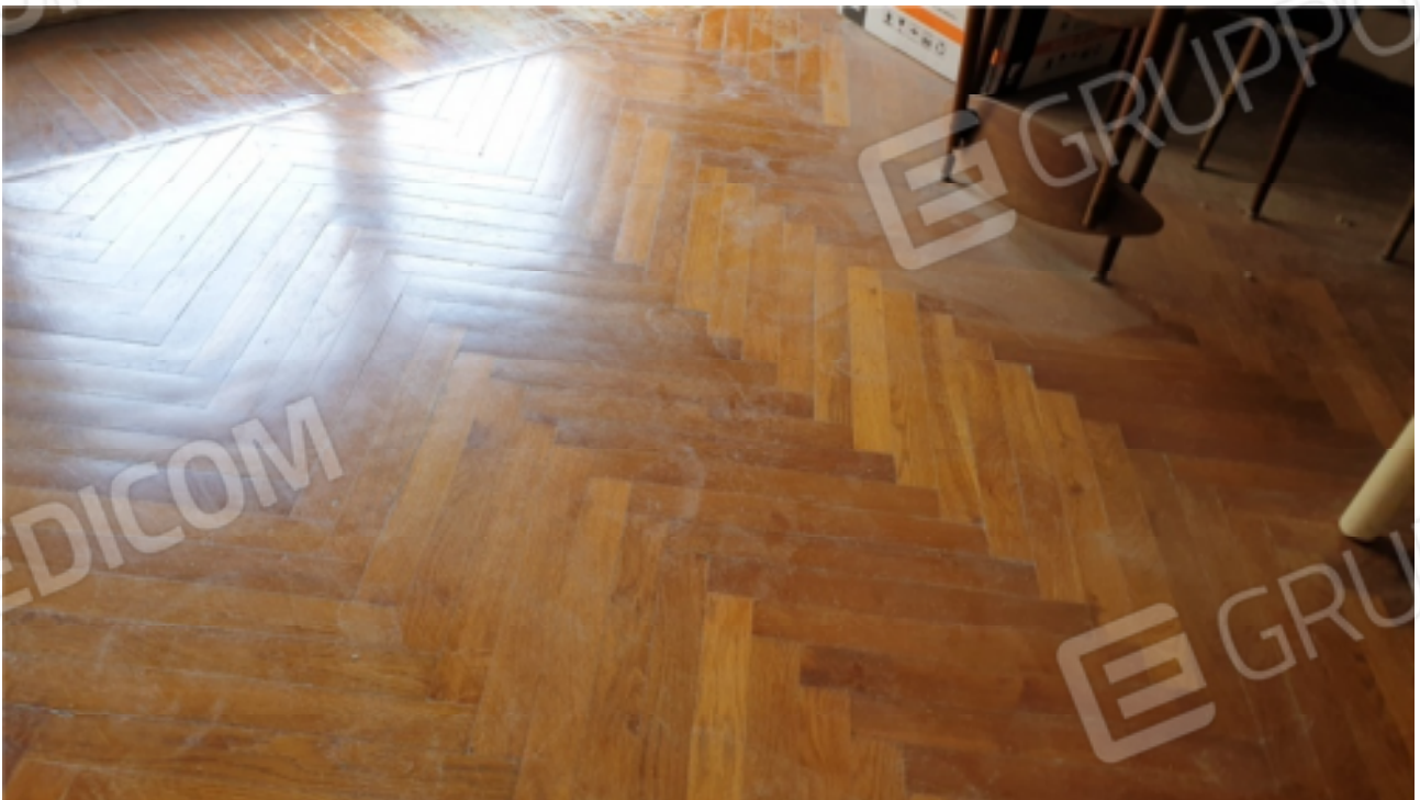
Vista del pavimento della camera 1