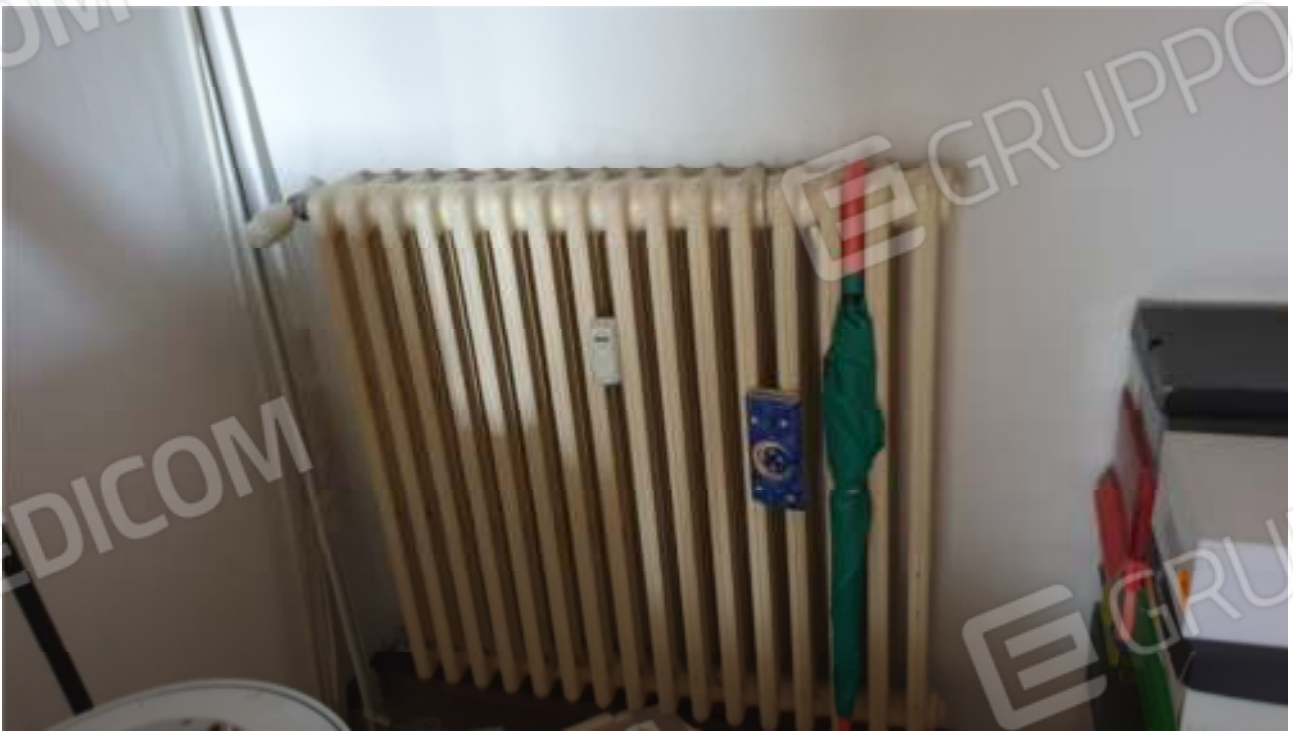
Viste dei terminali del impianto termico