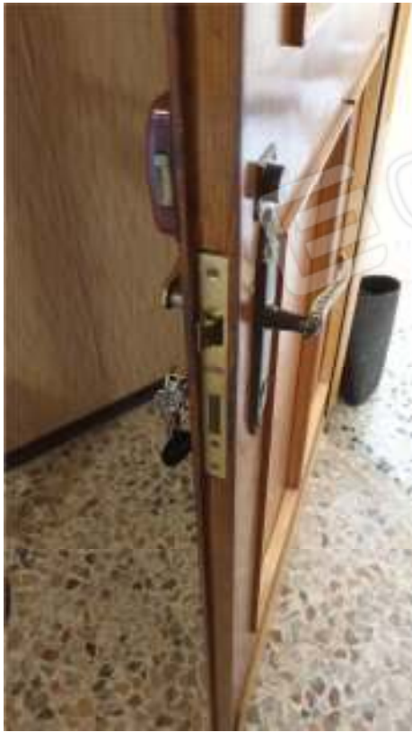
Vista del portoncino d'ingresso