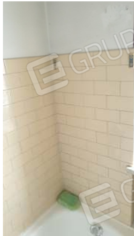
Viste del servizio igienico