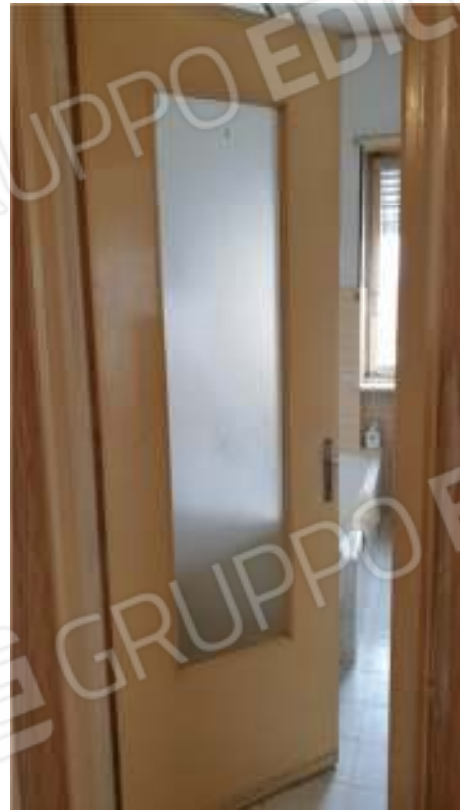
Vista dei serramenti interni