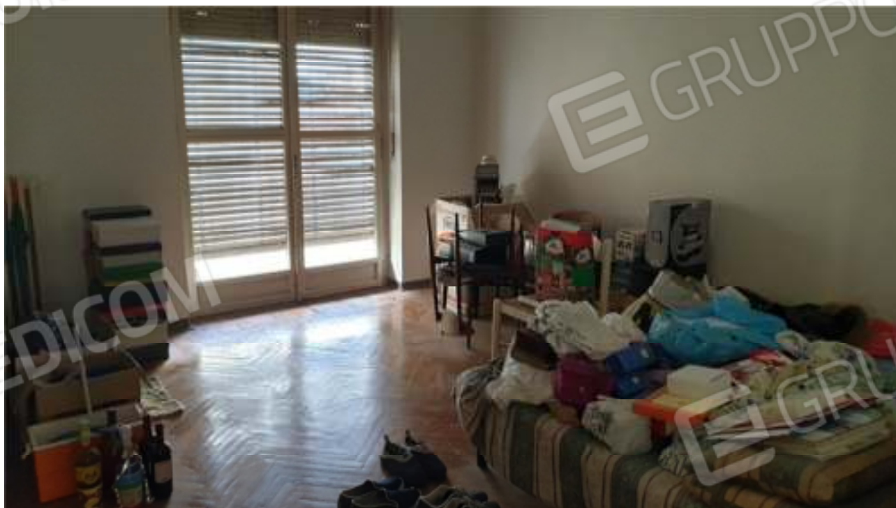
Vista della camera 1