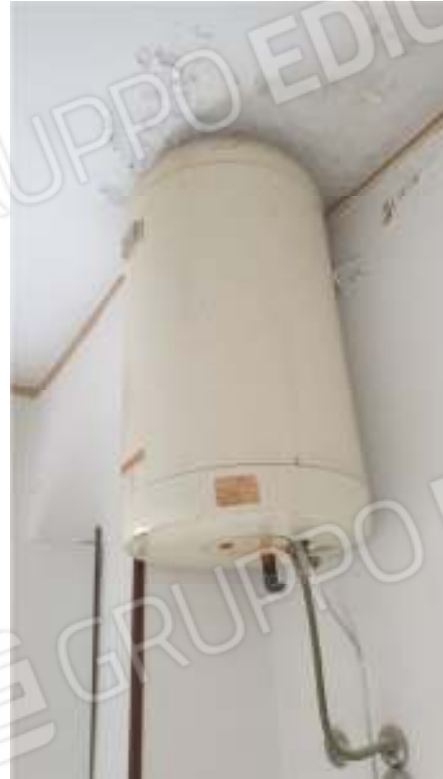
Viste del impianto termico e produzione ACS